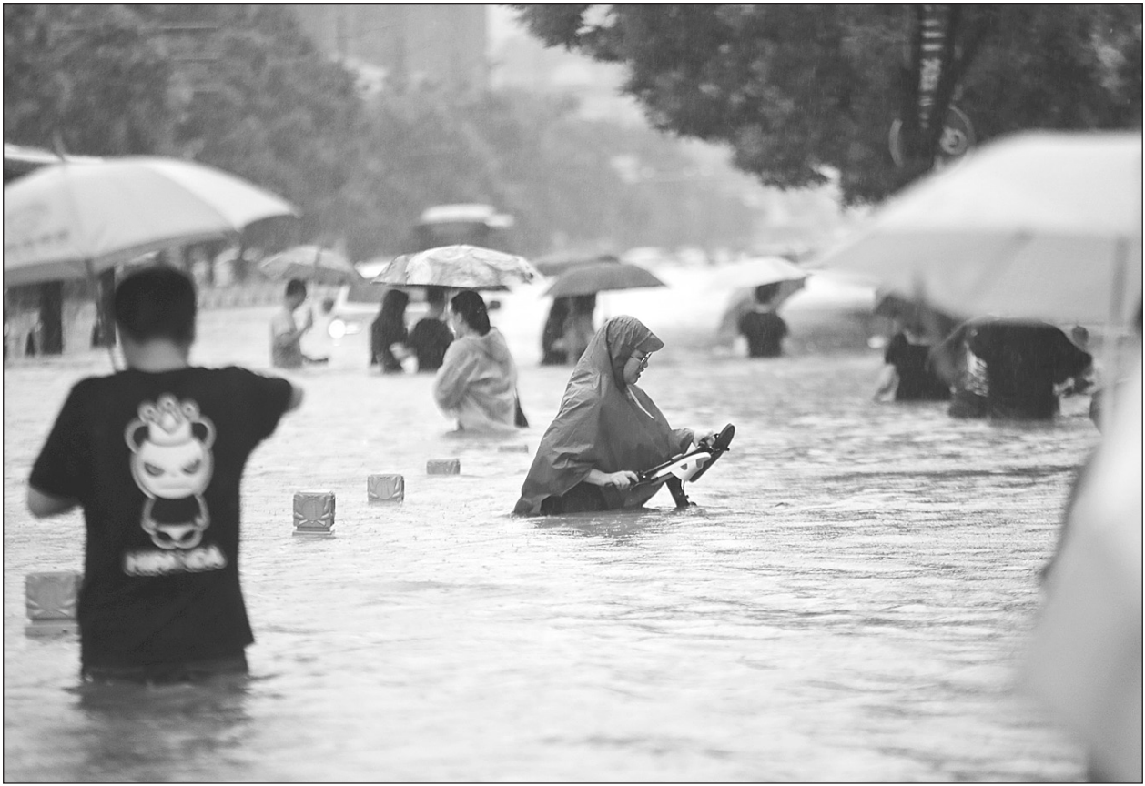
น้ำท่วมใหญ่ ● ประชาชนในนครเจิ้งโจว มณฑลเหอหนาน ภาคกลางของจีน เดินลุยน้ำท่วมถนนจากฝนตกหนักเมื่อวันที่ 20 กรกฎาคม มีผู้เสียชีวิตอย่างน้อย 12 ราย จากเหตุน้ำท่วมในเมืองนี้.

ชายชื่อกัวรายหนึ่งที่ต้องนอนค้างคืนที่สำนักงานกล่าวว่า เพราะฝนตกทำให้ทางการเจิ้งโจวต้องระงับการเดินทางโดยสาธารณะที่วิ่งรถไฟใต้ดิน คือสาเหตุที่ทำให้คนจำนวนมากใช้บริการรถไฟใต้ดิน แล้วเกิดเรื่องเศร้าขึ้น สื่อของจิงรายงานว่า จำนวนผู้เสียชีวิตเพราะฝนตกหนัก