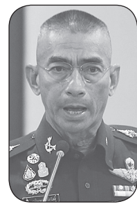
พล.อ.เฉลิมพล ศรีสวัสดิ์

นี่ยังไม่นับมาตรการเยียวยาใน 13 จังหวัด โดยเฉพาะเรื่องเงิน 2,500 บาทที่จะจ่ายให้กับบรรดาคนขยับเงินเดือน 9 กิจการ ซึ่ง ผู้จ่ายเงินค่าประกันสังคมเดือนละ 750 บาท มาทุกเดือนใน 10 หรือ 13 จังหวัด ก็ได้แต่นั่งบ่นว่าทำไมไม่ได้รับทุกคน แต่กับ คนที่เพิ่งมาสมัครเข้าระบบประกันภายในสิ้นเดือนนี้กลับจะได้รับเงินช่วยเหลือ 5,000 บาท นี้ใช้ ตรรกะไหนคิด เพราะการ WHF ไม่ว่าจะเป็นธุรกิจประเภทใดก็ตามแต่ที่ต้นทุนสูงซึ่งนั่นนั้น ไม่ว่าจะป็นค่าน้ำ ค่าไฟ ค่าอินเทอร์เน็ต รวมถึงค่านัก แต่รัฐบาลกลับลดค่าไฟและค่าน้ำเหมือนของเช่นสิ่งที่แทบไม่ช่วยอะไร แล้วอย่างนี้จะเรียกว่าเยียวยาได้อย่างไรเล่า ...●