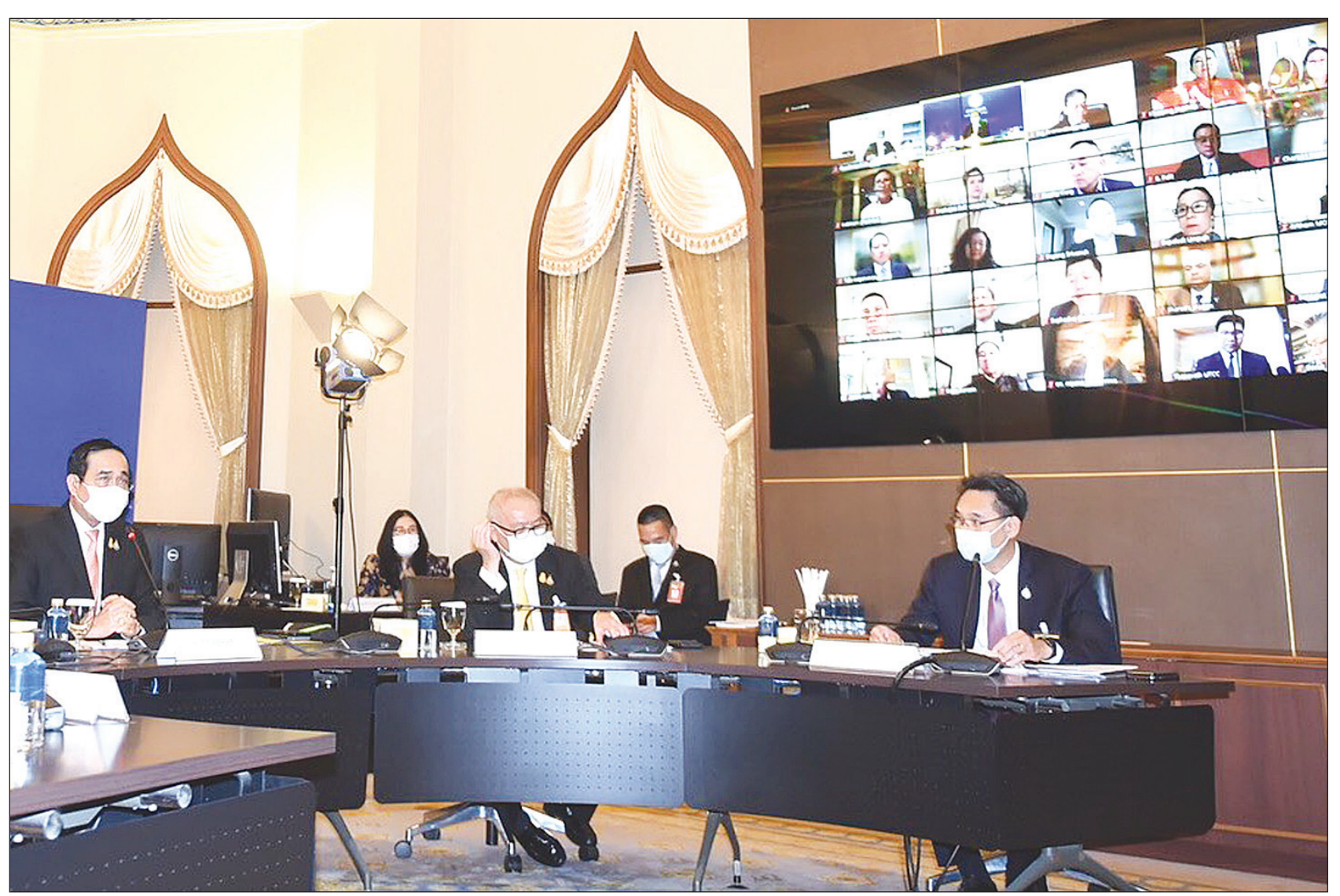
พล.อ.ประยุทธ์ จันทร์โอชา นายกรัฐมนตรีและ รมว.กลาโหม เป็นประธานการประชุมหารือร่วมกับสภาการค้าแห่งประเทศไทย และ 40 ซีอีโอ เพื่อหาแนวทางในการแก้ไขปัญหาสถานการณ์การแพร่ระบาดของโรคติดเชื้อไวรัสโคโรนา 2019 (โควิด-19) ผ่านระบบวิดีโอคอนเฟอเรนซ์ ที่ห้อง PMOC ชั้น 2 ตึกไทยคู่ฟ้า ทำเนียบรัฐบาล

จากการค้นหาเชิงรุก 2,910 ราย, มาจากเรือนจำและที่ต้องขัง 1,049 ราย, มาจากต่างประเทศ 31 ราย ทำให้มียอดผู้ติดเชื้อสะสม 439,477 ราย หายป่วยเพิ่มเติม 8,248 ราย หายป่วยสะสม 304,456 ราย อยู่ระหว่างรักษา 131,411 ราย อาการหนัก 3,786 ราย ใช้เครื่องช่วยหายใจ 879 ราย มีผู้เสียชีวิตเพิ่มเติม 108 ราย เป็นชาย 59 ราย หญิง 49 ราย โดยมากสุดอยู่ใน กทม. 40 ราย และมีถึง 42 รายที่เสียชีวิตไม่เกิน 6 วันนับจากทราบผล จึงขอเน้นย้ำหากใครอยู่ในกลุ่มเสี่ยงและมีอาการทางเดินหายใจขอให้รีบตรวจโดยเร็ว ทำให้ปัจจุบันมียอดผู้เสียชีวิตสะสม 3,610 ราย ขณะที่สถานการณ์โลก มีผู้ติดเชื้อสะสม 192,228,307 ราย เสียชีวิตสะสม 4,133,324 ราย พญ.อภิสมัยกล่าวว่า สำหรับ 10 จังหวัดที่มีผู้ติดเชื้อสูงสุดวันที่ 21 ก.ค. ได้แก่ กทม. 2,921 ราย, สมุทรสาคร 932 ราย, นนทบุรี 661 ราย, สมุทรปราการ 656 ราย, ชลบุรี 636 ราย, ฉะเชิงเทรา 374 ราย, ปทุมธานี 350 ราย, ระยอง 305 ราย, บิดดาดี 282 ราย, พระนครศรีอยุธยา 235 ราย นอกจากนี้ 10 จังหวัดดังกล่าวแล้ว ยังพบหลายจังหวัดมีผู้ติดเชื้อเพิ่มมากขึ้น อาทิ จ.มหาสารคาม กาฬสินธุ์ ศรีสะเกษ ขอนแก่น นครราชสีมา ผู้ติดเชื้อที่พบเป็นผู้เดินทางกลับจากพื้นที่ควบคุมสูงสุดและเข้มงวดหรือพื้นที่สีแดงเข้ม จึงขอให้ผู้ตรวจเชื้อแล้วผลเป็นบวกเข้ารับบริการโดยเร็ว โดยไม่ต้องเคลือบยา เพราะข้อมูลผู้ติดเชื้อใน กทม. 70-80% มีอาการคล้ายไข้หวัดและเสียชีวิตอ่อน