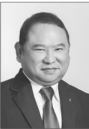
พุฒพงศ์ ปราสาททองโฮสเทล

เริ่มแบกภาระต้นทุนไม่ไหวแล้ว จึงอาจจะส่งผลกระทบต่อการบินและการจ้างพนักงาน ทั้งนี้ สมาคมได้ขอรับการสนับสนุนชอฟต์โลนไปตั้งแต่การระบาดของโควิด-19 รอบแรกหรือในเดือน มี.ค.2563 และได้ติดตามต่อเนื่อง รวมถึงเข้าพบ พล.อ.ประยุทธ์ จันทร์โอชา นายกรัฐมนตรี วันที่ 28 ส.ค.63 เพื่อให้เร่งพิจารณาเรื่องดังกล่าว ล่าสุดเมื่อเดือน พ.ค.2564 ได้ส่งหนังสือติดตามอีกครั้ง จนปัจจุบันก็ยังไม่ได้มีการพิจารณา รวมเป็นเวลากว่า 478 วันแล้ว "ที่ผ่านมาสายการบินทั้ง 7 สายให้ควมร่วมมือกับภาครัฐเป็นอย่างดี ขณะเดียวกันได้มีการปรับตัวในหลายมิติ การรับเที่ยวบินทั้งหมดส่งผลให้