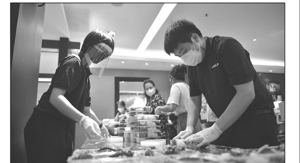
บมจ.กอล์ฟ เอ็นเนอร์ยี ดีเวลลอปเม้นท์ หรือ GULF เดินหน้าต่อกับโครงการผลิตพลังงานลม มอชชีวมวลพลังงานชีวมวล-19 เตรียมส่งมอบข้าวกล่องวันละ 2,000 กล่อง เป็นระยะเวลา 60 วัน รวม 120,000 กล่อง ให้กับชุมชน ผู้ป่วยในโรงพยาบาลสนาม และผู้ช่วยในศูนย์พักคอย เพื่อเป็นส่วนหนึ่งในการช่วยเหลือและส่งผลให้ประชาชนที่ได้รับผลกระทบจากการแพร่ระบาดของโควิด-19 พร้อมเปิดโอกาสให้คนทั่วไปสามารถช่วยเหลือผู้คนที่ชุมชนที่ต้องการความช่วยเหลือเรื่องข้าวกล่องได้ที่ได้โพสต์ของเฟซบุ๊กแฟนเพจ https://www.facebook.com/GulfSPARK.TH/ ...