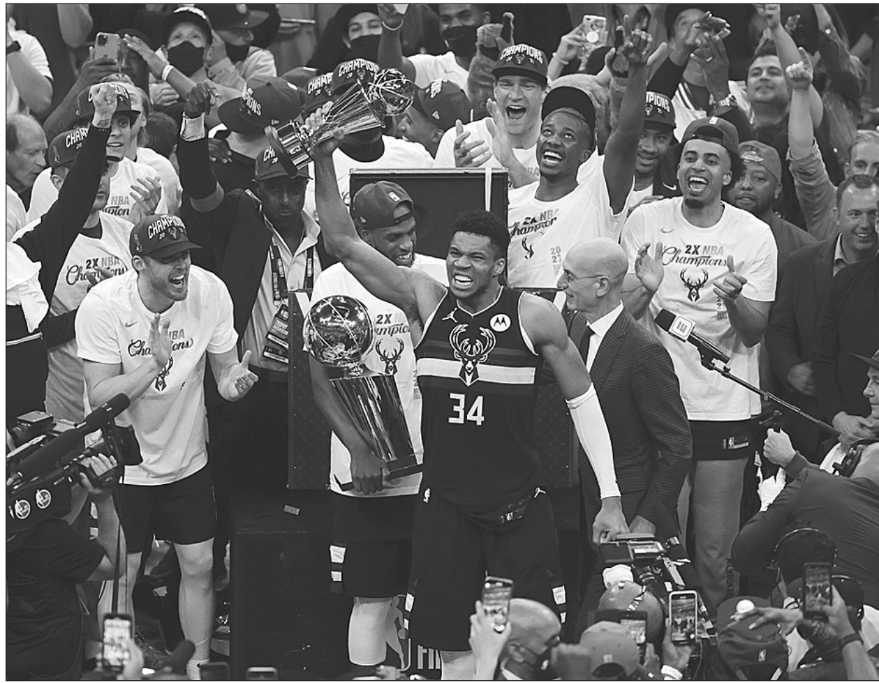
รอมานา ● ยานนิส อันเดโคคุมโป (เบอร์ 34) คว้ารางวัลผู้เล่นทรงคุณค่า หรือเอ็มวีพี ในซีรีส์ชิงชนะเลิศบาสเกตบอลเอ็นบีเอ หลังกดไป 50 คะแนน พา มิลวอกี บั๊กส์ เปิดไฟเชิร์ฟ ฟอรัม เอาชนะ ฟีนิกซ์ ซันส์ 105-98 ก่อนชนะซีรีส์ 4-2 คว้าแชมป์เอ็นบีเอเป็นครั้งแรกนับจากปี 1971.

ในส่วนสวนกว้างซึ่งเป็นไฮปาร์ตitionของสนามไฟเชิร์ฟ ฟอรัม ที่ขายตั๋วหมดทั้ง 20,000 ใบ ยังได้ต้อนรับแฟนๆ ประมาณ 65,000 คนที่มารวมตัวกันเชียร์ผ่านวิดีโอจอยักษ์ข้างสนาม "ผมมีความสุขที่สามารถทำสิ่งนี้ให้กับทีมมิลวอกีได้" อันเดโคคุมโปกล่าว "และโค้ชของเรา พวกเขาต้องทำแบบนั้นให้ได้อีก" ทางด้าน ฟีนิกซ์ ซันส์