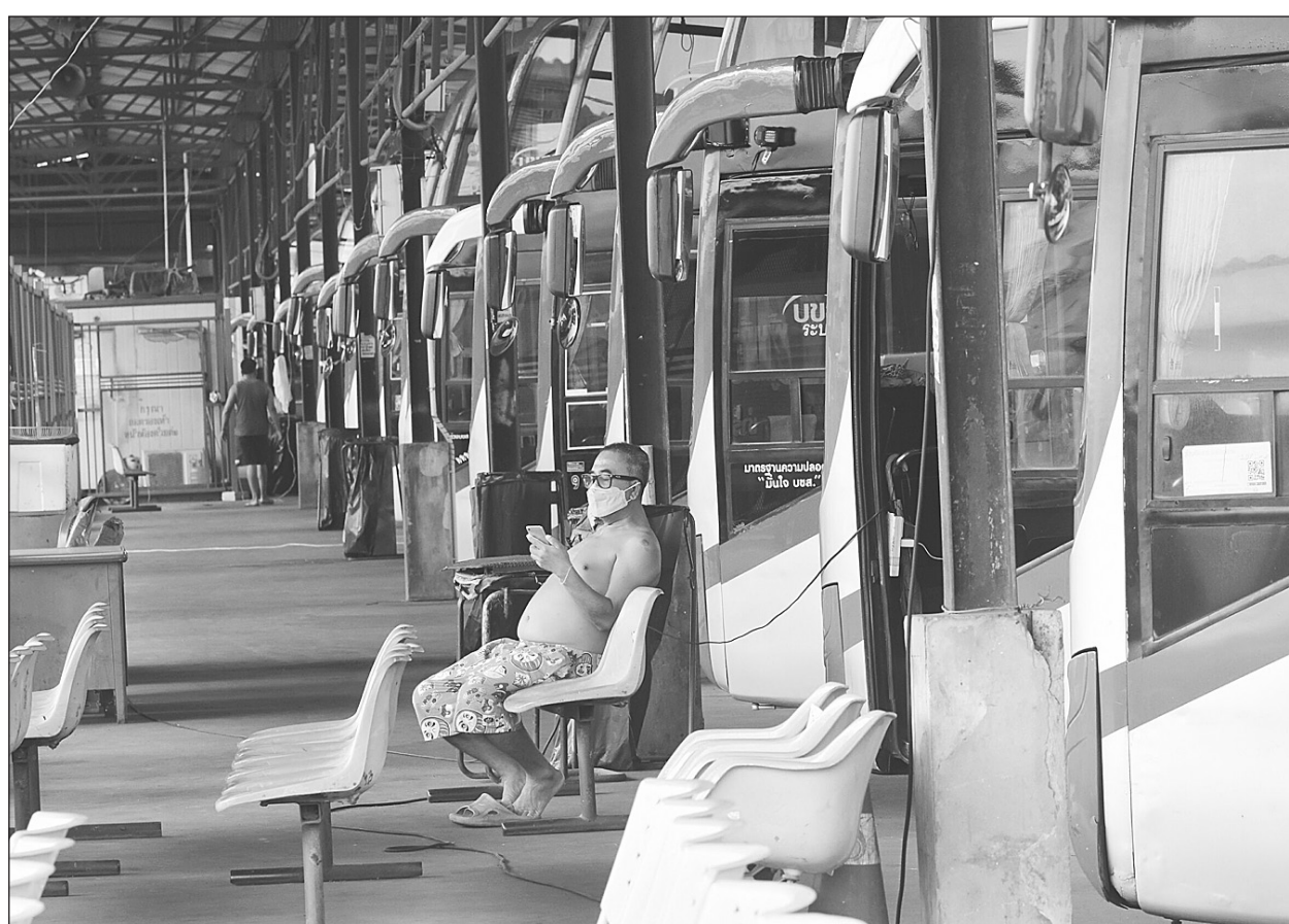
บรรยากาศที่สถานีขนส่งหมอติงเจียงเหงา หลัง บขส.แจ้งหยุดให้บริการเดินรถทางภาคเหนือ ภาคตะวันออกเฉียงเหนือ (อีสาน) ภาคตะวันออก และภาคใต้ ทุกเส้นทางชั่วคราว ตั้งแต่วันที่ 21 ก.ค.-2 ส.ค. ตามที่ ศบค.ประกาศเคอร์ฟิวล็อกดาวน์ และห้ามเดินทางข้ามจังหวัดในพื้นที่สีแดงเข้ม.