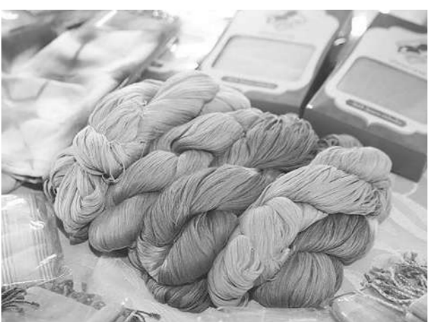
เรียนรู้ภูมิปัญญาทอผ้าที่ชุมชนบ้านโคกเมือง

สีลันบ้านโคกเมืองไม่ได้มีเพียงเท่านั้น ด้วยตั้งอยู่บนแหล่งอารยธรรมขอมที่มีความเจริญรุ่งเรืองในสมัยพระเจ้าชัยวรมันที่ 7 มีโบราณสถานน้อยใหญ่อายุกว่า 1,400 ปี ที่ได้เที่ยวชม ทั้งปราสาทเมืองต่ำ ปราสาทเขาปลายบัด ภูผาพิรุณี ที่สร้างขึ้นราวพุทธศตวรรษที่ 15-17 และสามารถเชื่อมโยงไปยังอุทยานประวัติศาสตร์พนมรุ้งได้ง่ายๆ ห่างแค่ 8 กิโลเมตร