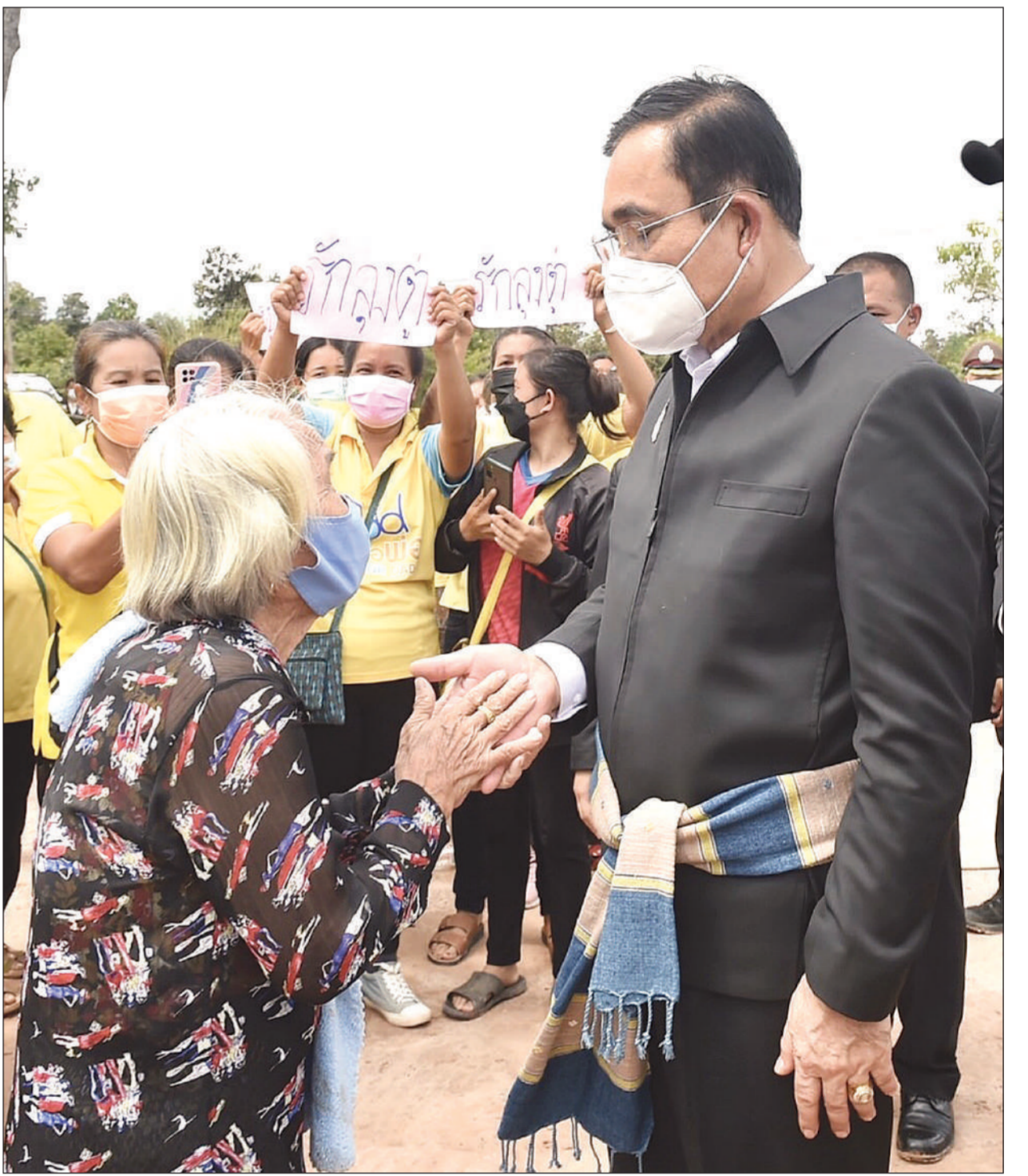
ชาวบ้านเข้ามาจับมือ พล.อ.ประยุทธ์ จันทร์โอชา นายกรัฐมนตรีและรัฐมนตรีว่าการกระทรวงกลาโหม เพื่อให้กำลังใจนายกฯ ในระหว่างลงตรวจเยี่ยมแหล่งเรียนรู้พลังงานทดแทนโคกอีด้อยวัลเลย์ ณ โรงเรียนศรีแสงธรรม ต.ห้วยยาง อ.โขงเจียม จ.อุบลราชธานี

ด้วยรถตู้โตโยต้า อัลพาร์ด สีขาว เลขทะเบียน กฉ 1111 ศรีสะเกษ มายังวัดป่าศรีแสงธรรม ต.ห้วยยาง อ.โขงเจียม จ.อุบลราชธานี เพื่อตรวจเยี่ยมแหล่งเรียนรู้พลังงานทดแทน “โคกอีด้อยวัลเลย์” ณ โรงเรียนศรีแสงธรรม และศูนย์การเรียนรู้ต้นแบบโคกหนองนา โดยมีพระครูวิมลปัญญาคุณ เจ้าอาวาสวัดป่าศรีแสงธรรมต้อนรับ พร้อมนำชมแหล่งเรียนรู้ “โคกอีด้อยวัลเลย์” พล.อ.ประยุทธ์กล่าวว่า ดีใจเป็นอย่างยิ่งที่ได้เห็นการสืบสาน รักษา ต่อยอด ตามพระราชโอรสของในหลวงรัชกาลที่ 10 ตามพระราชปณิธานของในหลวงรัชกาลที่ 9 ยืนยันว่ารัฐบาลจะทำให้ดี ทำให้ต่อเมืองและทันสมัย ให้สอดคล้องกับสถานการณ์ ส่วนความเดือดร้อนปัญหาต่างๆ จะมอบหมายให้ รว.มหาดไทย และหน่วยงานที่เกี่ยวข้องดูแล โดยตนจะประสานให้ทั้งหมด ขอชื่นชมเด็กนักเรียนที่ได้ทุนการศึกษาไปเรียนต่อที่เกาหลีใต้ ซึ่งมีหลายคนไปเกาหลีอย่าง “ลิซ่า” รัฐบาลจะดูแลและขับเคลื่อนให้ฐานการเรียนรู้นี้ขยายต่อ จากนั้น พล.อ.ประยุทธ์พบปะและมอบทุนการศึกษาให้นักเรียนโรงเรียนศรีแสงธรรม โดยมีตัวแทนนักเรียนอ่านกลอนต้อนรับ จากนั้นนายกฯ กล่าวชื่นชมพร้อมกล่าวว่า วันนี้ทุกเรื่องที่เป็นปัญหาตนรับไปแล้ว ยืนยันจะดูแลให้ดีที่สุด เพราะเราเป็นรัฐบาล แต่ต้องทำให้ถูกต้อง เพราะมีกฎระเบียบกฎหมายต่างๆ ย้ำว่ารัฐบาลมีจุดมุ่งหมายทำอะไรให้ประเทศชาติ