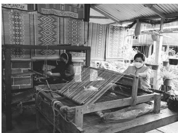
ตื่นตากับการทอเลือกยกกลาย อัตลักษณ์ชุมชน

ใครมาเที่ยวแนะนำให้เจาะลึกวัฒนธรรมผ่านฐานเรียนรู้ทางภูมิปัญญา เริ่มจากฝึกทำอาหารเด็ดพื้นถิ่นเมนูกุ้งจ่อมผัดสมุนไพรกับเซฟชุมชน ใช้ของดีกุ้งจ่อมประโคนชัยผัดกับสมุนไพร เสิร์ฟพร้อมข้าวหอมมะลิภูเขาไฟร้อนๆ ฟินไปอีก ฟินมากยิ่งขึ้นผ้าหมักโคลนบารายพันปีที่โดนใจกลุ่มวัยรุ่น ทอเลือกยกขาย ทอผ้า นอกจากนี่ยังมีฐานสมุนไพรเขาปลายบัด รู้จักข้าวหอมมะลิภูเขาไฟปลายบัด เพราะหมู่บ้านติดกับภูเขาไฟปลายบัด 1 ใน 6 ภูเขาไฟบุรีรัมย์ที่ดับสนิทแล้ว ที่ขึ้นชื่อแหล่งผลิตข้าวหอมมะลิคุณภาพเหนียวนุ่มลิ้นเลื่อง และยังมีไร่องุ่นภูเขาไฟออร์แกนิกเชิงเขาปลายบัด ปกติให้ชมหน้าหนาว จากนั้นไปเที่ยวปราสาทเมืองต่ำ ชมบารายเมืองต่ำ โบราณสถานสำคัญ ถ้ำสนใจนั่งรถอีแต่นขึ้น