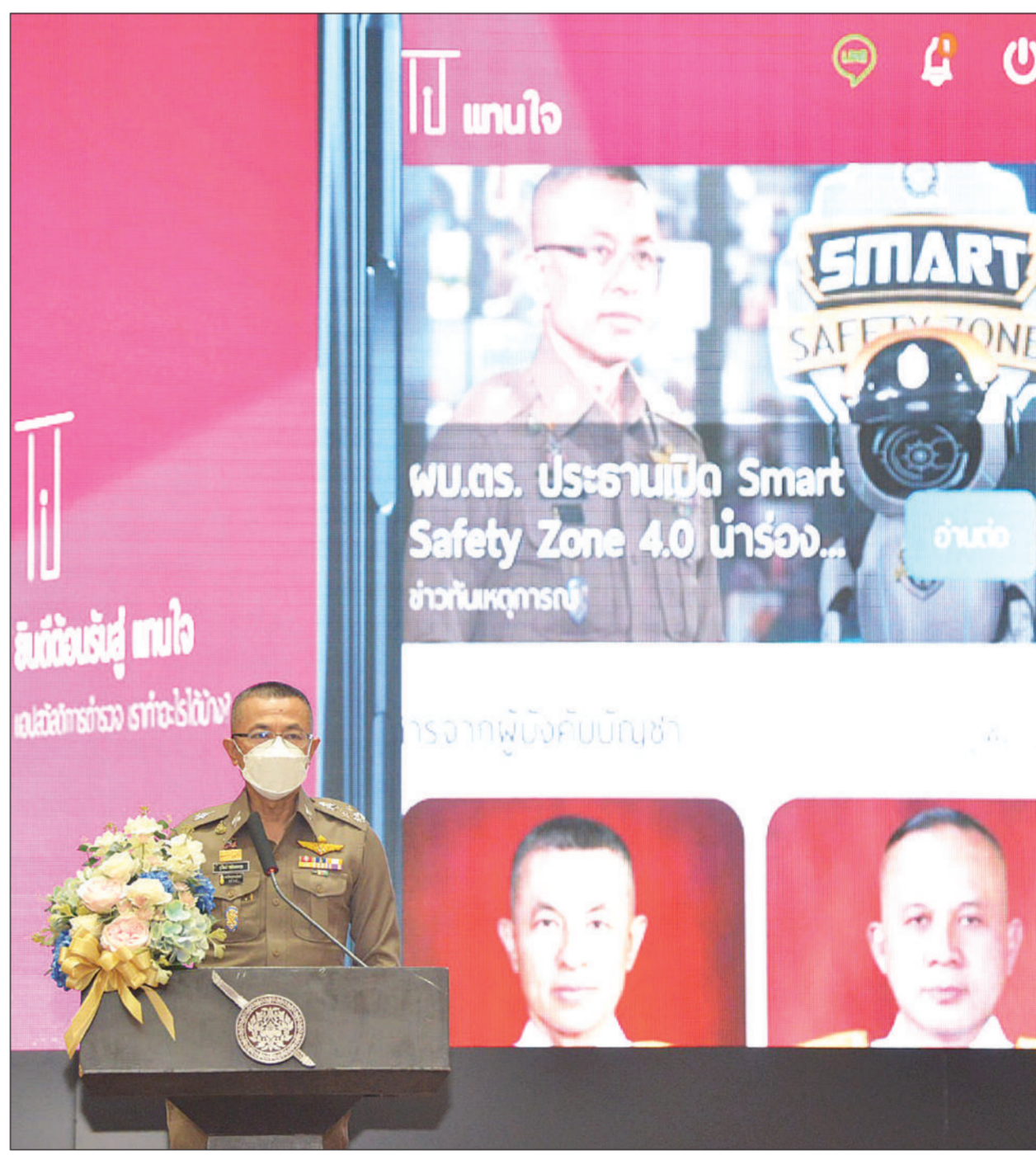
พล.ต.อ.สุวัฒน์ แจ้งยอดสุข ผู้บัญชาการตำรวจแห่งชาติ (มบ.ตร.) เปิดตัวแอปพลิเคชัน "แทนใจ" เนื่องในโอกาสวันครบรอบ 22 ปี วันสถาปนาสำนักงานตำรวจแห่งชาติ วันที่ 17 ตุลาคม 2564

กรุงเทพฯ • "ทักษิณ" ivotหน้า ส.ส. เพื่อไทยหลายสิบ มีหมัดเด็ดตอนเลือกตั้งกับใครคิดย้ายออกต้องรับเอาเงินค่าตัวไปคืน ปลุกลูกหาบหากไม่ชนะแลนด์สไลด์อย่าฝันตั้งรัฐบาล ปิดประตูไม่ต้น "หญิงอ้อ" นั่งหนพท. "จรินทร์-ปชป." ซึ่งเปิดตัวเร็วแคนดิเดตนายกฯ เริ่มเห็นผล ผลโพลสองสำนักโหวตบิ๊กตู่ ซึ่งเบอร์หนึ่งศึกไทยคู่ฟ้า เมื่อวันที่ 17 ตุลาคม นายประเสริฐ จันทรรวงทอง เลขาธิการพรรคเพื่อไทย กล่าวถึงการประชุมใหญ่พรรคเพื่อไทยจังหวัดขอนแก่น วันที่ 28 ตุลาคม ว่าในการประชุมใหญ่ จะมีการแต่งตั้งกรรมการบริหารทดแทนส่วนที่ลาออกไปจำนวน 4 ตำแหน่ง เป็นรองหัวหน้าพรรค 2 ตำแหน่ง และกรรมการบริหารพรรค 2 ตำแหน่ง โดยจะคัดเลือกจาก ส.ส.ที่มีความอาวุโสทางการเมือง ส่วนจะเป็นใครอย่างไรนั้น คงต้องรอให้ที่ประชุมมีมติออกมา ส่วนแคนดิเดตนายกฯ ที่พรรคเพื่อไทยจะเสนอในการเลือกตั้งครั้งต่อไปนั้น จะยังไม่เปิดตัวในการประชุมดังกล่าว คงต้องรอให้ใกล้เลือกตั้งก่อน แต่ยืนยันเปิดมาแล้วประชาชนประทับใจแน่นอน รายงานข่าวจากพรรคเพื่อไทยแจ้งว่า เมื่อช่วงสุดสัปดาห์ที่ผ่านมา มี ส.ส.อุบลราชธานีรายหนึ่งของพรรคเพื่อไทย ส่งคลิปวิดีโอเข้ากลุ่มไลน์ ส.ส.พรรคเพื่อไทย โดยเป็นคลิปบรรยายสถานการณ์ ส.ส.และผู้บริหารพรรคที่จัดขึ้นเมื่อไม่นานมานี้ ที่มีนายทักษิณ ชินวัตร อดีตนายกฯ วิดีโอคอลเข้ามาพูดคุยกับ ส.ส.ของพรรคด้วย เนื้อหาในคลิปเป็นช่วงที่นายทักษิณเปิดโอกาสให้ผู้ร่วมงานถามคำถาม ซึ่งนายเกรียง กัลป์ตินันท์ รองหัวหน้าพรรค และแกนนำภาคอีสานจาก จ.อุบลราชธานี เป็นผู้สอบถามถึงความเป็นไปได้ในการให้คุณหญิงพมมาน ฅ ป้อมเพชร อดีตภริยานายทักษิณมาเป็นหัวหน้าพรรคเพื่อไทยเพื่อสู้ศึกเลือกตั้งครั้งต่อไป อ่านต่อหน้า 16