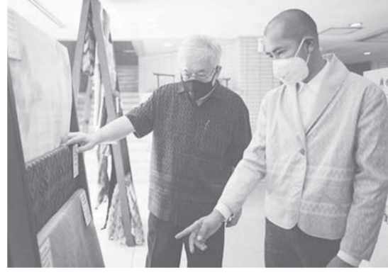
ชาย นครชัย อธิบดี สวธ. และวิษระวิชัย อัครสันติสุข ชมความสวยงามของผ้าไทย

"ทั้ง 24 ผลงานที่เข้ารอบและได้รับรางวัล มีจุดแข็ง