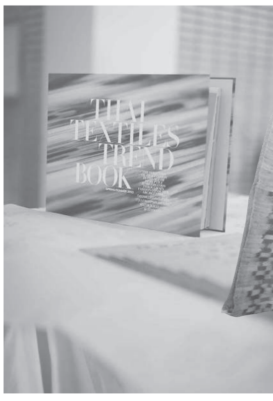
หนังสือ Thai Textiles Trend Book Spring/Summer 2022 ให้อิเดียแก่นักออกแบบ

และนิทรรศการพิเศษ เรื่อง "อารยธรรมวิวัฒน์ ลพบุรี - ศรีรามเทพนคร" ถึงวันที่ 28 พ.ย. 2564 เพื่อให้ประชาชนเข้าชมและศึกษาหาความรู้ได้มากขึ้น ณ พิพิธภัณฑ์สถานแห่งชาติ พระนคร นิทรรศการพิเศษสองทับหลังจะแสดงประวัติศาตร์และข้อมูลทางประวัติศาสตร์ หลักฐานที่ได้สืบค้น รวมถึงขั้นตอนการติดตามทางดิน ชุมแล้วเข้าใจถึงวิธีการกว่าจะได้มาซึ่งโบราณวัตถุ โดยความพยายามจากหลายฝ่าย กระตุ้นจิตสำนึกรักและหวงแหนมรดกวัฒนธรรมของไทย ส่วนนิทรรศการพิเศษ "อารยธรรมวิวัฒน์ ลพบุรี - ศรีรามเทพนคร" คัดเลือกโบราณวัตถุที่มีความสำคัญทางประวัติศาสตร์สะท้อนให้เห็นที่มาของวิวัฒนาการทางอารยธรรม เน้นอิทธิพลของศิลปะลพบุรี.