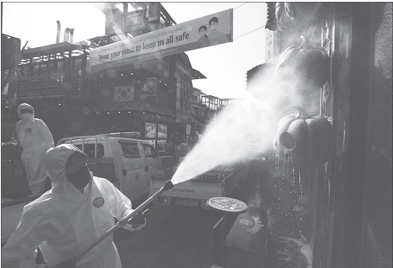
กอนฮัลโลวิน ● เจ้าหน้าที่สาธารณสุขเกาหลีใต้สวมชุดที่ป้องกันน้ำยาฆ่าเชื้อโรคหน้าร้านในย่านอิเทวอน กรุงโซล เพื่อป้องกันการแพร่ระบาดของเชื้อโควิด-19 เมื่อวันที่ 29 ตุลาคม ก่อนผู้คนจะออกมาฉลองวันฮัลโลวินในสุดสัปดาห์นี้.