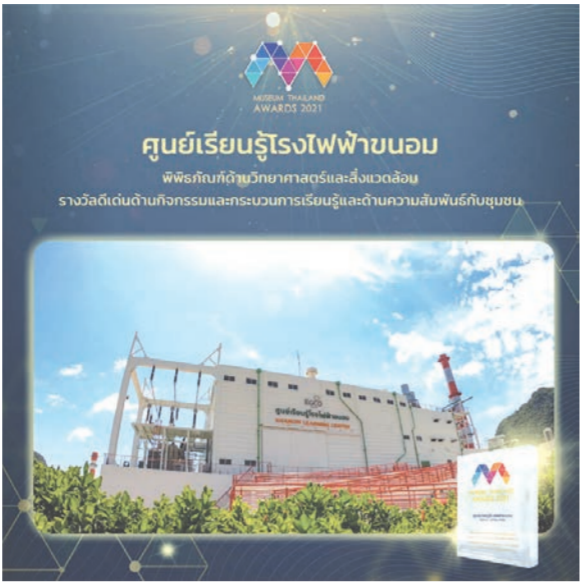
ศูนย์เรียนรู้โรงไฟฟ้าขอม พิพิธภัณฑ์วิทยาศาสตร์สิ่งแวดล้อม รางวัลดีเด่นกิจกรรมส่งเสริมการเรียนรู้และเรียนรู้ด้านพลังงาน รางวัลดีเด่นกิจกรรมส่งเสริมการเรียนรู้และเรียนรู้ด้านพลังงาน ประจำปี 2564

จากความมุ่งมั่นดังกล่าว ส่งผลให้ศูนย์เรียนรู้โรงไฟฟ้าขอมคว้า 2 รางวัลแห่งความภาคภูมิใจในระดับประเทศและระดับภูมิภาค ประจำปี 2564 ได้แก่ รางวัลสร้างสรรคัลสิ่งแวดล้อม เอเชีย “Asia Responsible Enterprise Awards 2021” (AREA 2021) ด้าน Investment In People จากสถาบัน Enterprise Asia องค์การพัฒนาเอกชนชั้นนำส่งเสริมศักยภาพผู้ประกอบการที่มีความรับผิดชอบต่อสังคมและสิ่งแวดล้อมในภูมิภาคเอเชียเพื่อการ Awards ที่ยั่งยืน ในขณะที่เดียวกัน ยังได้รับรางวัล “Museum Thailand Awards 2021”