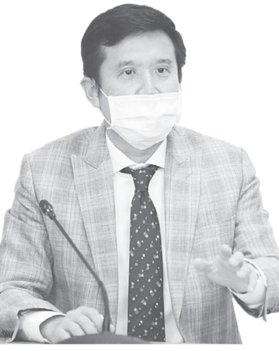
นายชัยวุฒิ ธนาคมานุสรณ์ รมว.ดิจิทัลเพื่อเศรษฐกิจและสังคม

คำว่าไม่ปรับ ครม.คนที่เป็นรัฐมนตรีอยู่ในปัจจุบันน่าจะชอบ เพราะจะได้ไม่ถูกปรับหรือเปลี่ยนตำแหน่งการทำงานก็จะทำได้ต่อเนื่องต่อไป