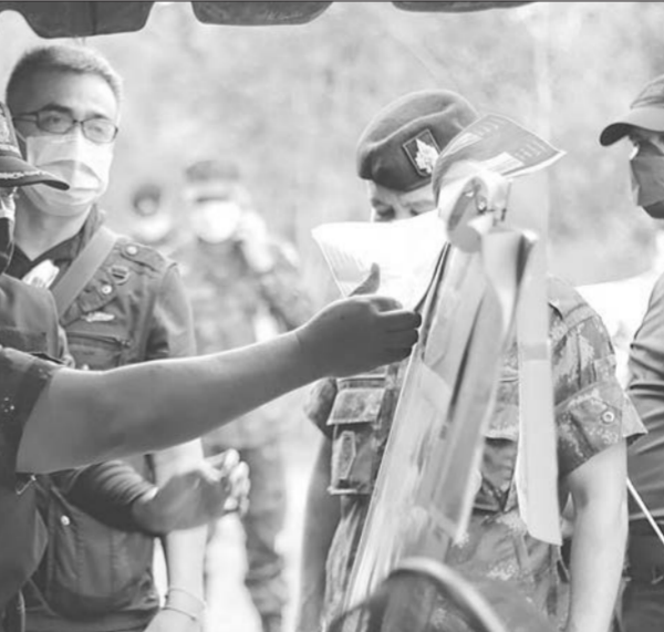
แม่ทัพภาคที่ 4 พร้อมด้วยผู้บัญชาการตำรวจภูธรภาค 9 ติดตามความคืบหน้าเหตุบังคับใช้กฎหมายกับกลุ่มผู้ก่อเหตุรุนแรง บ้านชุกเตยลอด ตำบลบาเระใต้ อำเภอบาเจาะ จังหวัดนราธิวาส

อากาศ ได้พิจารณาเรื่องเครื่องบิน เอฟ-16 เข้าประจำการ แต่ในช่วงนั้นนักวิชาการสนับสนุนให้ซื้อเอฟ-20 แต่คุณพ่อกล่าวว่ายอมรับสิ่งทีนักวิชาการและประชาชนให้ความเห็น เพราะเป็นความจริง เอฟ-20 เป็นเครื่องบินทีมีความทันสมัยสร้างจากบริษัทเครื่องบิน F-5 อุปกรณ์ใช้กันได้ แต่ ทอ.เป็นกองทัพขนาดเล็ก มึงบจกัก เราต้องใช้งบให้คุ้มค่า สิ่งทีบอกว่าเป็นในกระดาษ หรือจะซื้อเครื่องทีพิสูจน์ในสงครามว่าดีจริง หากตัดสินใจคิดในวันนั้น ทอ.คงไม่มีเครื่องบินทีมีประสิทธิภาพในวันนี เช่นเดียวกับกรพิจารณาจัดหาเครื่องบินรบรุ่นใหม่ ภายใต้งบประมาณจำกัด คงมีการตั้งคณะทำงานในการศึกษาไปก่อน แม้เครื่องบินทีมีอยู่ขณะนี้ จะทันสมัยในยุคนี้ แต่หากผ่านไปไม่กี่ปีก็ล้าสมัย จึงต้องคิดจัดซื้อทีทันสมัยตั้งแต่วันนี โดยจะก้าวข้ามเครื่องบินรบธรรมดาไปสู่เครื่องบินแอดวานซ์อย่างไร ทีสำคัญคือประชาชนต้องเข้าใจ และเห็นร่วมกันว่าควรมีประจำการ เพื่อประโยชน์ต่อส่วนรวมและประชาชน ไม่ใช่ประโยชน์ของ ทอ.เอง ถ้าเข้าใจตรงกันทุกอย่างก็จะปลอดภัยและเกิดขึ้นได้ แต่ถ้ายังไม่เข้าใจก็เกิดการต่อต้าน จะรุนแรงไปหมด สำหรับความขัดแย้งในโครงการต่างๆ จากแผนพัฒนาตามสมมุติภาพ ทอ.นั้น พล.อ.อ.นภาเดชกล่าวว่า ตนไม่รู้สึกความขัดแย้งอะไรต่างๆ ทอ.รักใคร่สามัคคีกัน แต่แนวทาง การสร้างความเจริญกับ ทอ.แตกต่างกันไปบ้าง ไม่ว่าแนวทางใด ก็มีชีวิตจิตใจทำให้ออ.เจริญเกิดขึ้นได้ และเป็นเรื่องชิลๆ เช่นเดียวกับแนวทางทีแอนติดีทีเป็นแนวคิดที่ดี แต่ต้องดูว่าจะทำอะไรได้บ้าง เทคโนโลยีบางอย่างบริษัทในประเทศอาจจะไม่มี จึงอยากทียกตัวอย่างว่าต้องดูสิ่งทีเราเห็นจริงแล้ว เช่นกรณี F-16 กับ F-20 ถ้าเรามีเงินน้อยก็จะไปเสี่ยงไม่ได ดังนั้นเราจึงต้องเลือกของทีดีที่สุด.