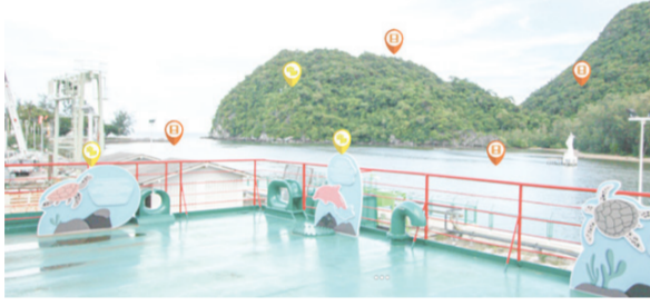
ศูนย์เรียนรู้โรงไฟฟ้าขอม โดยนำต้นแบบการเรียนรู้ในรูปแบบออนไลน์ที่สอดคล้องกับวิถีชีวิตของผู้เข้าชม

ท่ามกลางสถานการณ์การแพร่ระบาดของโควิด-19 ศูนย์เรียนรู้โรงไฟฟ้าขอมได้ปรับรูปแบบการเรียนรู้แบบออนไลน์ที่สอดคล้องกับวิถีชีวิตของผู้เข้าชม