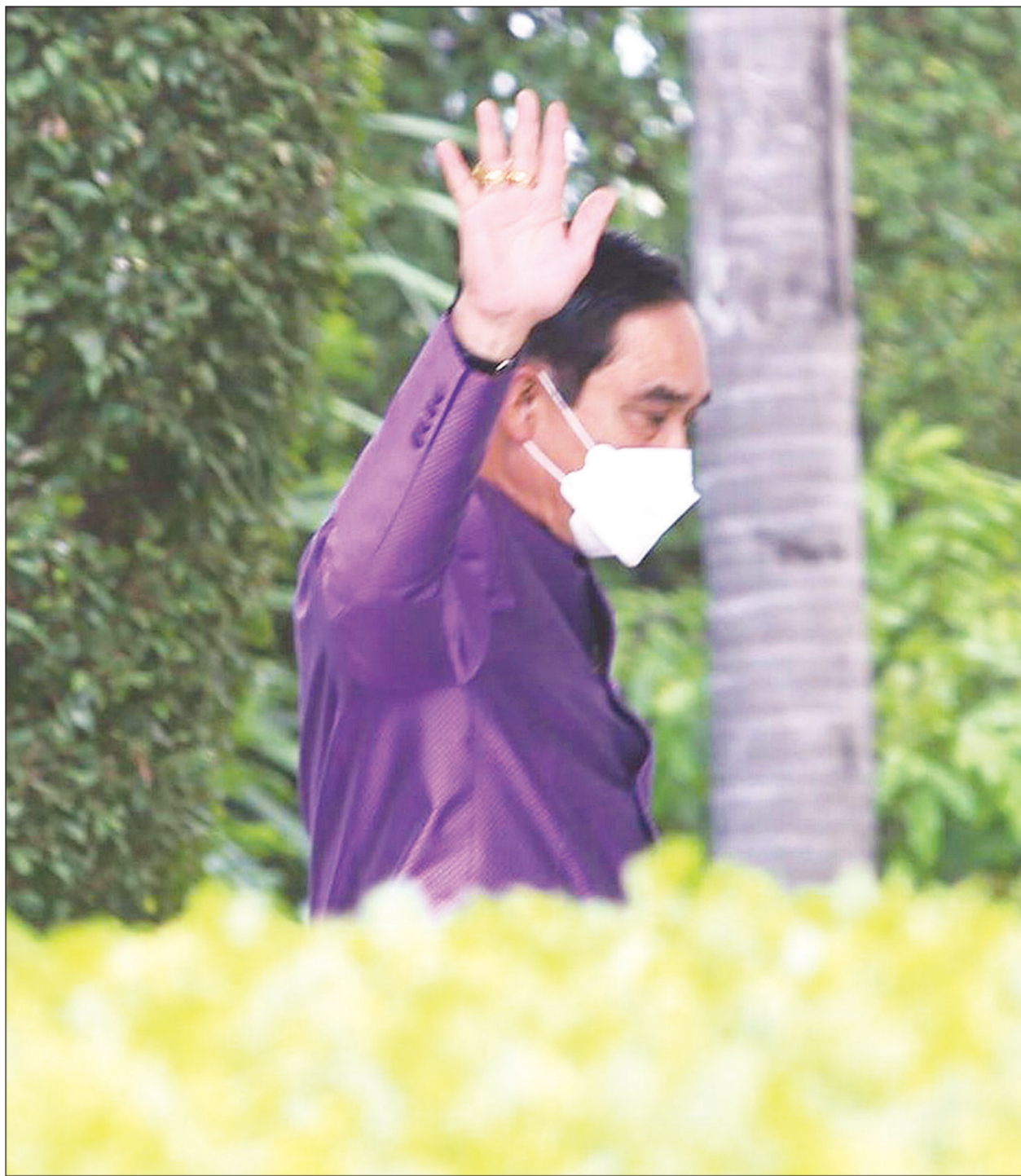
ภายหลังการประชุมคณะรัฐมนตรี ที่ตึกสันติไมตรี (หลังนอก) ทำเนียบรัฐบาล พล.อ.ประยุทธ์ จันทร์โอชา นายกรัฐมนตรีและ รว.กมล.ได้ให้สัมภาษณ์สื่อมวลชน เพียงแต่โบกมือให้กับผู้สื่อข่าวและทำมือสัญลักษณ์โผล่เพียงอย่างอารมณ์ดี ก่อนเดินขึ้นตึกไทยคู่ฟ้า

ย้ากรม.ลงพื้นที่ช่วยปชช.น้ำท่วมรับมือพายุลูกใหม่