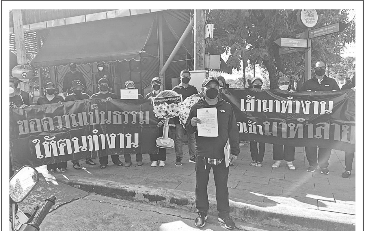
ประท้วง ● พนักงานและลูกจ้างลูกเสือประท้วงหน้าเทศบาลเมืองบุรีรัมย์ พร้อมพวงหรีดไว้อาลัยนายกเทศมนตรีและคณะผู้บริหารเทศบาลเรียกร้องขอความเป็นธรรมหลังถูกเลิกจ้างไม่มีเหตุผล อีกทั้งไม่แจ้งล่วงหน้า ทำให้พนักงานเดือดร้อนขาดรายได้แบบไม่ทันตั้งตัว

สำหรับถนนทางหลวงชนบทสาย บก.4001 แยกทางหลวงแผ่นดินหมายเลข 2095-บ้านดอนอุดม ต.โนนสมบูรณ์ เป็นเส้นทางเชื่อมระหว่างทางหลวงแผ่นดินหมายเลข 2095 พื้นที่ อ.พรเจริญ จ.บึงกาฬ กับทางหลวงแผ่นดินหมายเลข 222 สายท่งโคก-บึงกาฬ รวมทั้งยังสามารถใช้เป็นเส้นทางลัด เดินทางระหว่าง อ.โซ่พิสัย ไปยัง อ.เมืองบึงกาฬ เป็นเส้นทางที่สนับสนุนการขนส่งผลทางการเกษตร เช่น ยางพารา