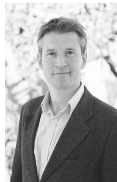
โนเจล เอิร์สท์ กัททาร์กซ์มากาประสมการณ