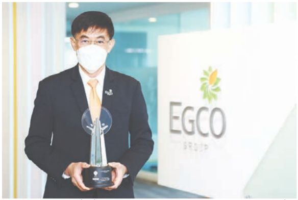
ด้วยความเชื่อว่า “ต้นทางดี จะก่อให้เกิดผลผลิตปลายทางที่ดี” บริษัทผลิตไฟฟ้า จำกัด (มหาชน) หรือ เอ็กโก กรุ๊ป จึงมุ่งมั่นในการส่งเสริมการเรียนรู้ด้านพลังงานและสิ่งแวดล้อมแก่เยาวชน ซึ่งเป็นวัยต้นทางและเป็นพลังสำคัญในการพัฒนาประเทศไทยในอนาคต ผ่านโครงการ “ศูนย์เรียนรู้โรงไฟฟ้าขอม” อำเภอขอม จังหวัดนครราชสีมา ในกลุ่มเอ็กโก