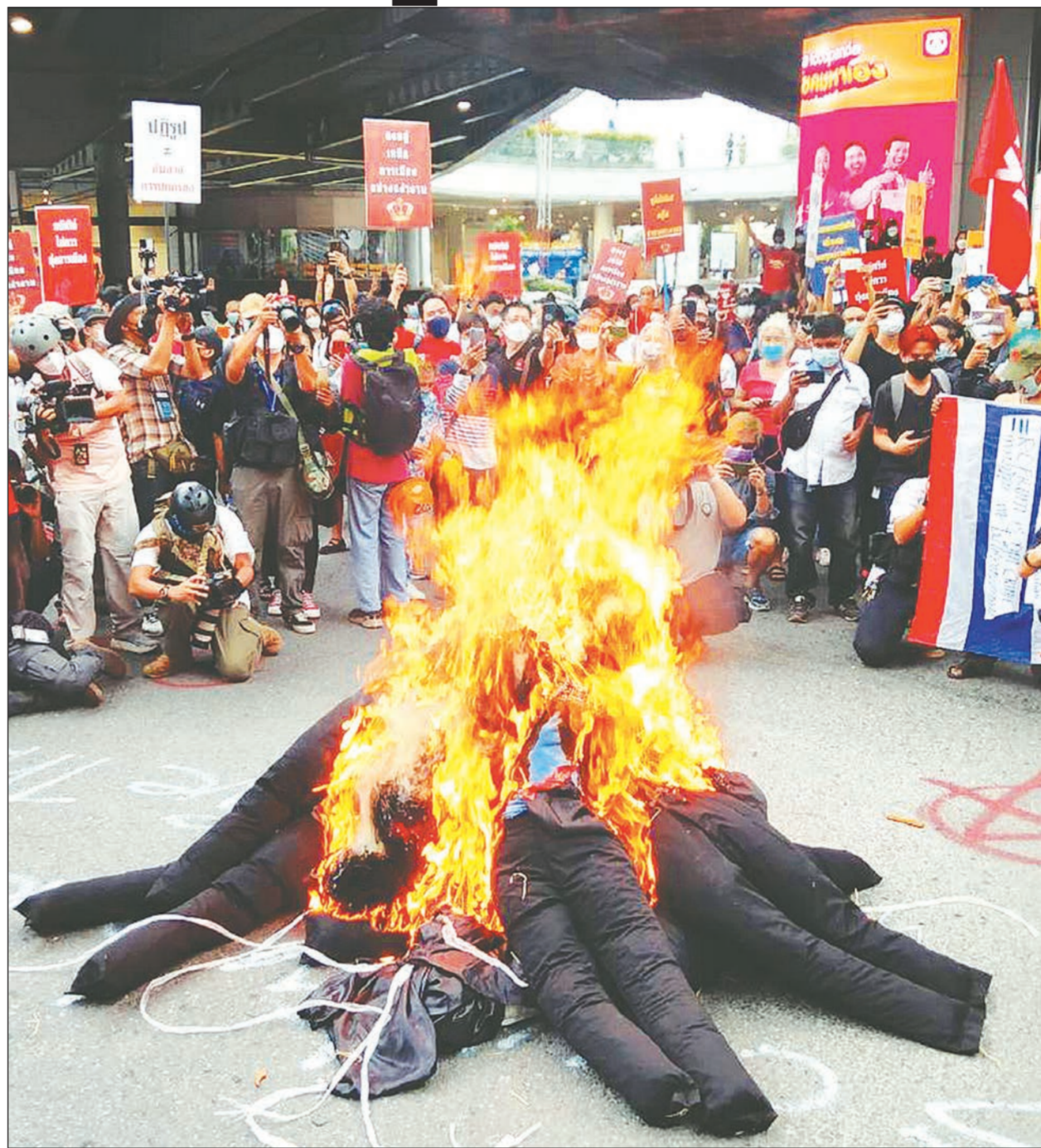
กลุ่มไม่เอาระบอบสมบูรณาญาสิทธิราชย์ ซึ่งเป็นการรวมตัวของเครือข่ายมือบ 3 นิ้ว ได้เผาหุ่นฟางที่สวมชุดเสื้อครุยของตุลาการศาลรัฐธรรมนูญกลางสี่แยกปทุมวัน ในการชุมนุมเมื่อวันที่ 14 พฤศจิกายน

มือบไร้เงา 'รุ่ง' ร่วมชุมนุม ไร้ฟ้องสถานทูตเยอรมนี