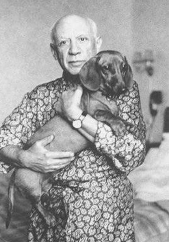
ปาโบล ปิกัสโซ ศิลปินเอกของโลก กับสุนัขชัชชุน

องรี มาติส ศิลปินในยุคสมัยใหม่ที่รักสัตว์เลี้ยง ช่วงทศวรรษที่ 1940 มาติสอาศัยอยู่ในบ้านพักที่เมือง Vence ประเทศฝรั่งเศส พร้อมด้วยแมวสามตัวและนกพิราบสีขาว ซึ่งเป็นแรงบันดาลใจให้เพื่อนชาวสเปนที่เป็นศิลปินเอกอย่าง ปิกัสโซ สร้างผลงาน Dove of Peace ขึ้นมาในปี 1949 ในช่วงบั้นปลายของชีวิตได้มอบนกอันเป็นที่รักให้กับปิกัสโซเป็นของขวัญ