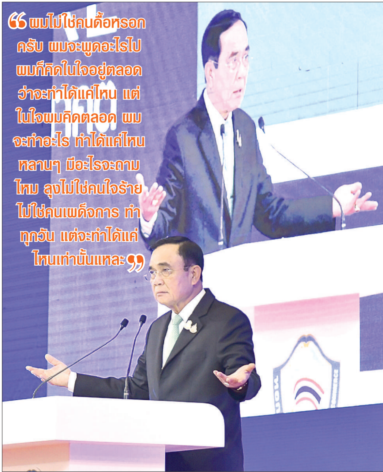
พล.อ.ประยุทธ์ จันทร์โอชา นายกรัฐมนตรีและรัฐมนตรีว่าการกระทรวงกลาโหม กล่าวปาฐกถาพิเศษเรื่อง “จับมือ รวมใจ พาชาติรอด” ในงานสัมมนาหอการค้าทั่วประเทศ ครั้งที่ 39 ที่หอประชุมใหญ่ มหาวิทยาลัยหอการค้าไทย ถนนวิภาวดีรังสิต เมื่อวันที่ 21 พฤศจิกายน 2564

“ผมไม่ใช่คนดีหรือคน ศรีบ ผมจะพูดอะไรไป ผมก็คิดในใจอยู่ตลอด ว่าจะทำได้แค่ไหน แต่ ในใจผมคิดตลอด ผม จะทำอะไร ทำได้แค่ไหน หลานๆ มีอะไรจะถาม ไหม ลุงไม่ใช่คนใจร้าย ไม่ใช่คนเผด็จการ ทำ ทุกวัน แต่จะทำได้แค่ ไหนเท่านั้นแหละ”