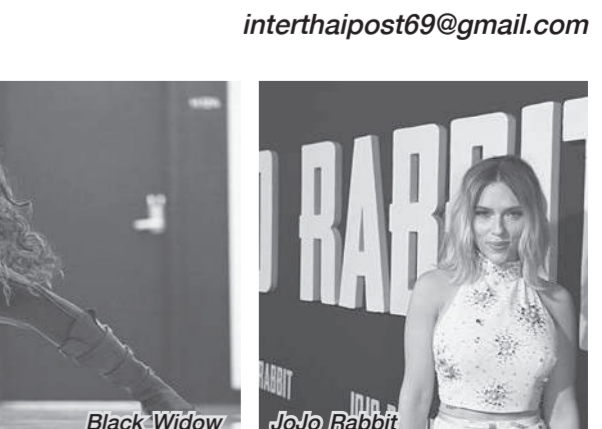
Black Widow, JoJo Rabbit

สการ์เลตต์ โจแฮนสัน คว้ารางวัลยอดเยี่ยมจากภาพยนตร์ซูเปอร์ฮีโร่ ขณะที่บอสใหญ่ของมาร์เวล สตูดิโอ แย้มบทบาทใหม่ของเธอในโปรเจกต์ใหม่ล่าสุด ยอด