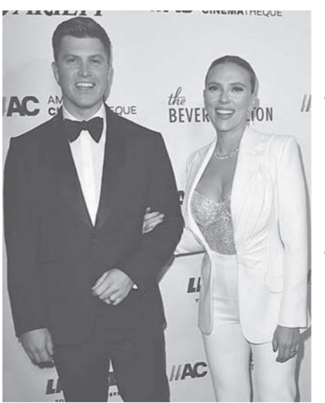
ออกงานครั้งแรกกับสามีนับตั้งแต่คลอดลูก

รางวัลนี้จัดขึ้นเพื่อยกย่องศิลปินที่มีความพิเศษบางอย่างในอุตสาหกรรมวงการบันเทิง ซึ่งมีส่วนร่วมอย่างเต็มที่กับงานของเธอหรือเขา และมุ่งเน้นไปที่คนอย่างมีนัยสำคัญต่อศิลปะการแสดง จัดขึ้นโดยองค์กรการกุศลซึ่งอุทิศให้กับการอนุรักษ์ภาพยนตร์