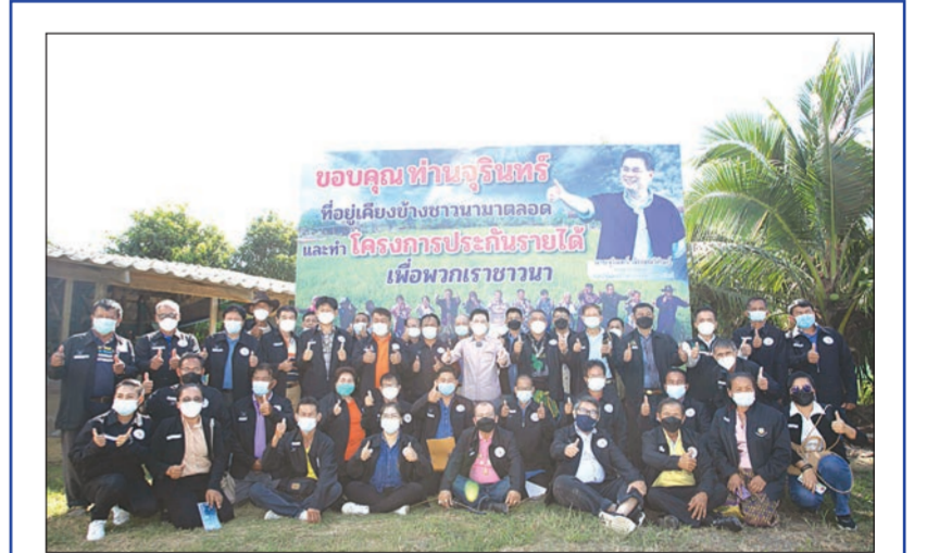
สมาคมชานานาและเกษตรกรไทยขอบคุณนายจรินทร์ ลักษณะวิศิษฎ์ รองนายกรัฐมนตรีและ รว.พาณิชย์ สร้าง "ประกันรายได้ข้าวให้ชาวนา" ชูนโยบาย "ดีที่ที่สุด ชาวนารอด-ปลอดทุจริต และยั่งยืน"