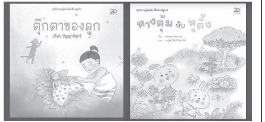
นิทานภาพชุด "ภูมิคุ้มใจเพื่อเด็กปฐมวัย" สื่อสร้างสุขภาวะเด็กปฐมวัย

พิชจากโควิดส่งผลกระทบต่อประเทศไทยมีแนวโน้มเด็กกำพร้าเพิ่มขึ้น เมื่อพ่อแม่หรือผู้ปกครองติดเชื้อและเสียชีวิตลง เด็กที่ต้องเผชิญกับเหตุการณ์สะเทือนใจรุนแรง โดยไม่ได้รับการฟื้นฟูเยียวยาจิตใจ อาจส่งผลกระทบต่อเด็กกลายเป็นแผลในใจไปตลอด ซึ่งโควิดยังไม่จบ ยังมีเด็กอีกจำนวนมากที่ต้องเผชิญกับการสูญเสียบุคคลอันเป็นที่รัก เพื่อเตรียมความพร้อมสุขภาวะด้านจิตใจของกลุ่มเด็กเล็ก สำนักงานกองทุนสนับสนุนการสร้างเสริมสุขภาพ (สสส.) ร่วมกับ สถาบันราชานุกูล กรมสุขภาพจิต กระทรวงสาธารณสุข กรมกิจการเด็กและเยาวชน กระทรวงการพัฒนาสังคมและความมั่นคงของมนุษย์ สมาคมผู้จัดพิมพ์และผู้จำหน่ายหนังสือแห่งประเทศไทย (PUBAT) สมาคมนักเขียนแห่งประเทศไทย ธนาคารจิตอาสา มูลนิธิ