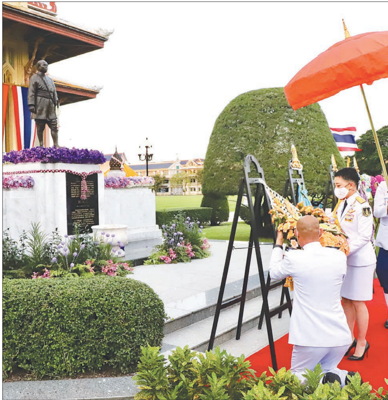
เมื่อเวลา 17.20 น. วันที่ 25 พฤศจิกายน 2564 พระบาทสมเด็จพระเจ้าอยู่หัว ทรงพระกรุณาโปรดเกล้าโปรดกระหม่อม ให้สมเด็จพระเจ้าลูกเธอ เจ้าฟ้าพัชรกิติยาภา นเรนทิราเทพยวดี กรมหลวงราชสาริณีสิริพัชร มหาวัชรราชธิดา เสด็จแทนพระองค์ไปทรงบำเพ็ญพระราชกุศลถวายพระบาทสมเด็จพระมงกุฎเกล้าเจ้าอยู่หัว เนื่องในโอกาสวันคล้ายวันสวรรคต ณ หอประชุมวชิราวุธวิทยาลัย เขตดุสิต กรุงเทพมหานคร ในการนี้ ทรงวางพวงมาลาถวายพระบาทสมเด็จพระเจ้าอยู่หัว สมเด็จพระบรมราชชนนีพันปีหลวง สมเด็จพระนางเจ้า พระบรมราชินี และพวงมาลาส่วนพระองค์

ชัดแทรกแซงกิจการภายใน 'แอมเนสตี้' ลั่นเดิมพันตำแหน่ง