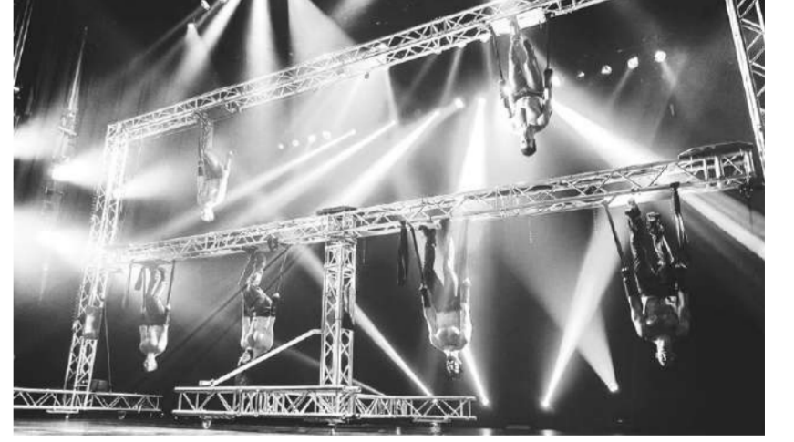
โชว์การเต้นเร้าใจเวทีต้องลุกเป็นไฟกับ 'Vivancos Live'

ผสานกับการฉายภาพดิจิทัลแบบไดนามิกแสดงถึงศิลปะการเต้นเบรกแดนซ์ที่แท้จริง โชว์วันที่ 12 ธ.ค.