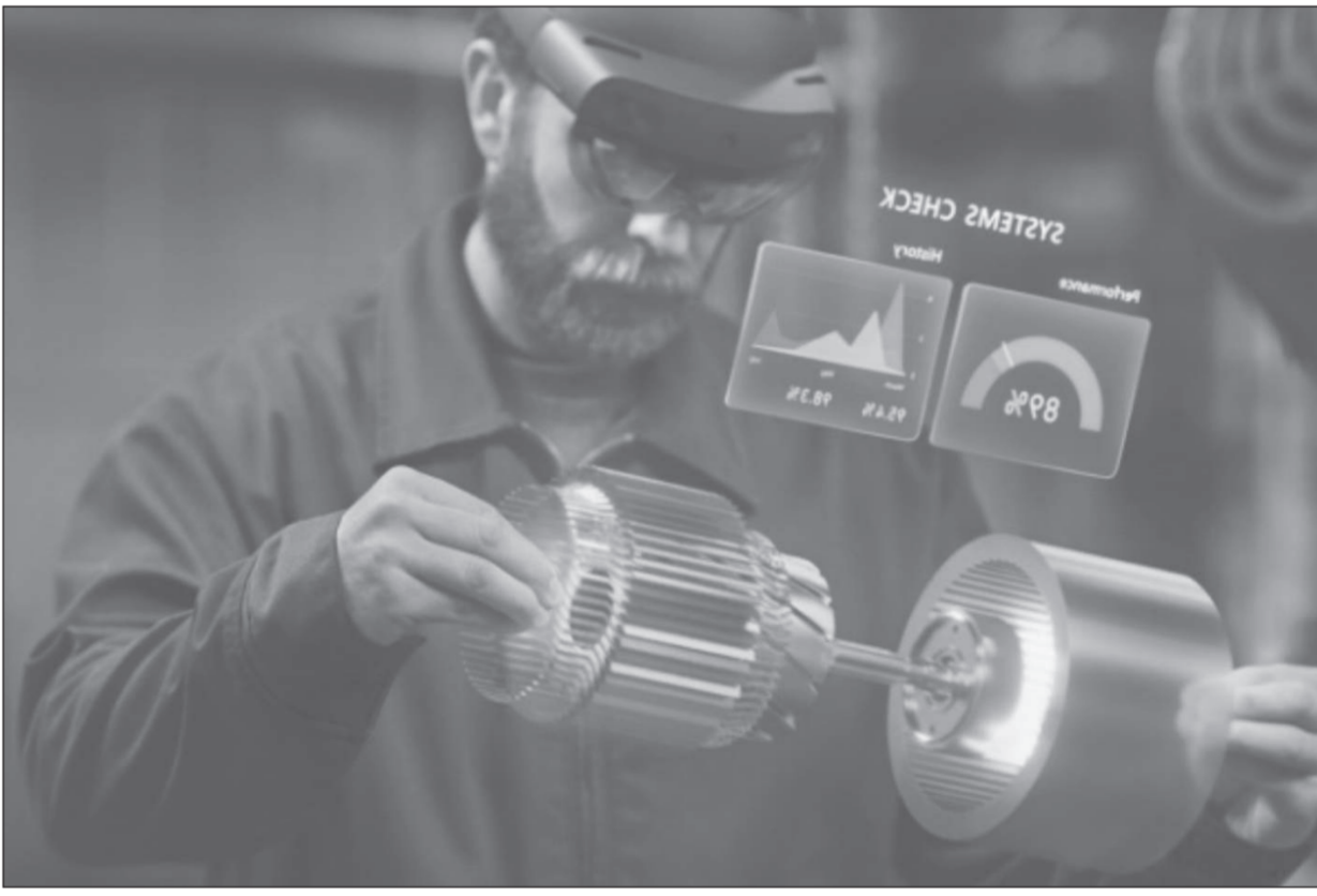
Microsoft Hololens 2

คำตอบคือ บ้านเหล่านั้นต้องถูกสร้างให้อยู่ในรูปแบบ