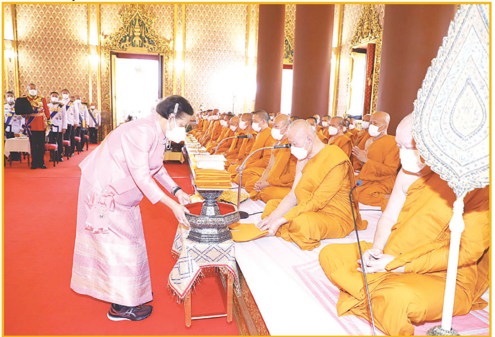
พระบาทสมเด็จพระเจ้าอยู่หัว ทรงพระกรุณาโปรดเกล้าฯ ให้สมเด็จพระกนิษฐาธิราชเจ้า กรมสมเด็จพระเทพรัตนราชสุดาฯ สยามบรมราชกุมารี เสด็จฯ แทนพระองค์ ไปในการพระราชพิธีถวายผ้าพระกฐิน พุทธศักราช 2564 ณ วัดเทพศิรินทราวาส