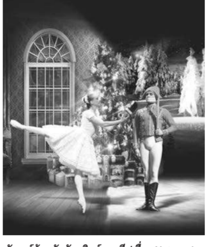
บัลเลต์ต้อนรับวันคริสต์มาสอีฟเรื่อง Nutcracker