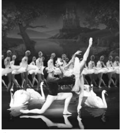
โชว์บัลเลต์สุดคลาสสิก Swan Lake 8 ภาคน่าติดตาม 3 มิติ

ผสานกับการฉายภาพดิจิทัลแบบไดนามิกแสดงถึงศิลปะการเต้นเบรกแดนซ์ที่แท้จริง โชว์วันที่ 12 ธ.ค.