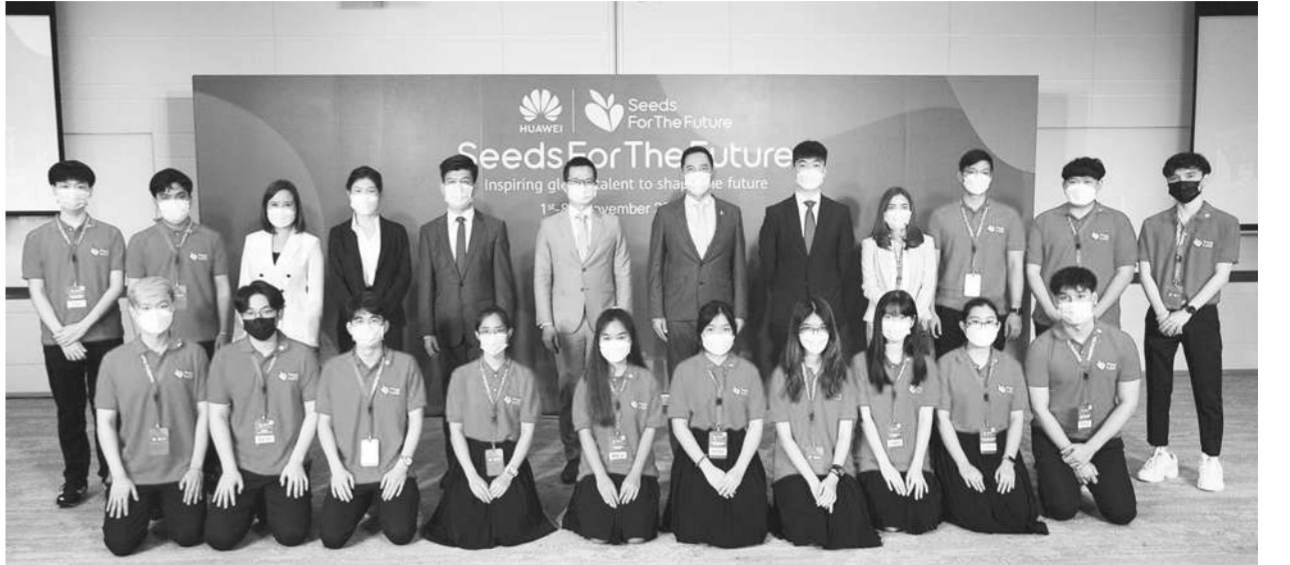
Seedsfor the Future 2021 • บริษัท หัวเว่ย เทคโนโลยี (ประเทศไทย) จำกัด จัดพิธีเปิดโครงการ "Seedsfor the Future 2021" เพื่อเปิดโอกาสให้นักศึกษาที่มีความรู้ความสามารถด้านไอซีทีได้เพิ่มพูนทักษะด้านดิจิทัล ผ่านโปรแกรมการฝึกอบรมภาคปฏิบัติกับผู้เชี่ยวชาญ และร่วมทำเวิร์กช็อปแลกเปลี่ยนความรู้ด้านวัฒนธรรม ภายใต้ภารกิจในการสนับสนุนการพัฒนาไอซีทีของประเทศไทย ในที่นี้ดังกล่าว นายอิทธิพล คุณปลื้ม รัฐมนตรีว่าการกระทรวงวัฒนธรรม ได้ให้เกียรติเป็นประธานในพิธีและกล่าวเปิดงาน