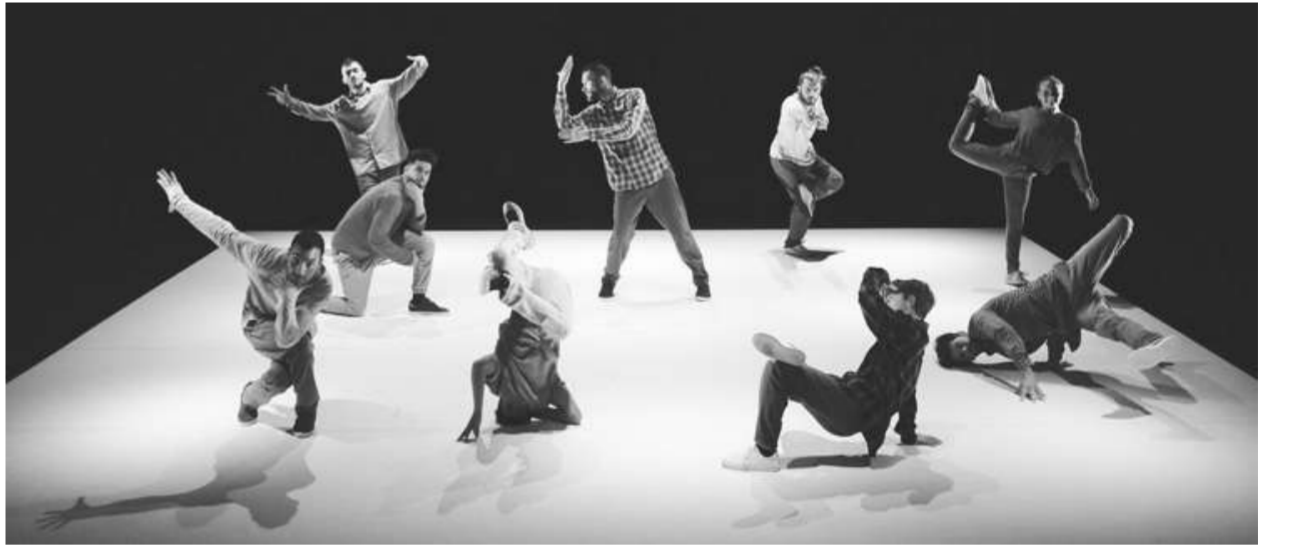
การแสดงชุด "Motion" จากฝรั่งเศส ชมการเต้นเบรกแดนซ์แท้ๆ

ปิดประเทศแล้วศิลปินนักเต้นและนักร้อง-นักดนตรีระดับโลกเข้าประเทศไทย พร้อมร่วม มหกรรมศิลปะการแสดงและดนตรีนานาชาติ กรุงเทพฯ ครั้งที่ 23 จัดศิลปะการแสดงและดนตรีระดับโลกให้ชาวไทยได้รับชมผ่าน 6 ชุดการแสดงสุดอลังการ ปลูกกรุงเทพฯ ให้กลับมามีชีวิตชีวามากขึ้น ที่ศูนย์วัฒนธรรมแห่งประเทศไทย ตั้งแต่วันที่ 18 พ.ย.-16 ธ.ค.2564 ปีนี้มหกรรมจัดขึ้นภายใต้คอนเซ็ปต์ "การเฉลิมฉลองจิตวิญญาณของมนุษยชาติ" หรือ "A celebration of the enduring spirit of humankind" แฟนชาวไทยจะได้เต็มอิ่มกับศิลปะ ประเดิมด้วยการแสดงบัลเลต์สุดคลาสสิก Swan Lake ผสมผสานกับฉากดิจิทัล 3 มิติตระการตา ถือเป็น การแสดงที่มีเพียงคณะรัสเซียมีเดียบัลเลต์เยเรเยอร์แห่งเดียวในโลก นำเสนอเรื่องราวอมตะของเจ้าชายซิกฟรีดกับเจ้าหญิงหงส์ผู้เปี่ยมเสน่ห์นามว่า ไอเดตต์ โชว์วันที่ 18-19 พ.ย.