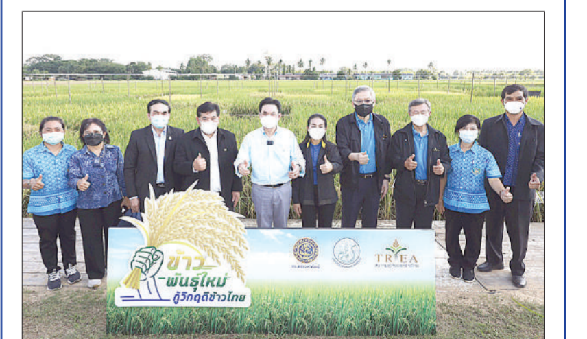
นายจรินทร์ ลักษณวิศิษฏ์ รองนายกรัฐมนตรีและรัฐมนตรีว่าการกระทรวงพาณิชย์ เป็นประธานในพิธีเปิด “โครงการประกวดข้าวพันธุ์ใหม่เพื่อการพาณิชย์ ภายใต้ยุทธศาสตร์ข้าวไทย” ณ ศูนย์วิจัยข้าวชัยนาท จังหวัดชัยนาท