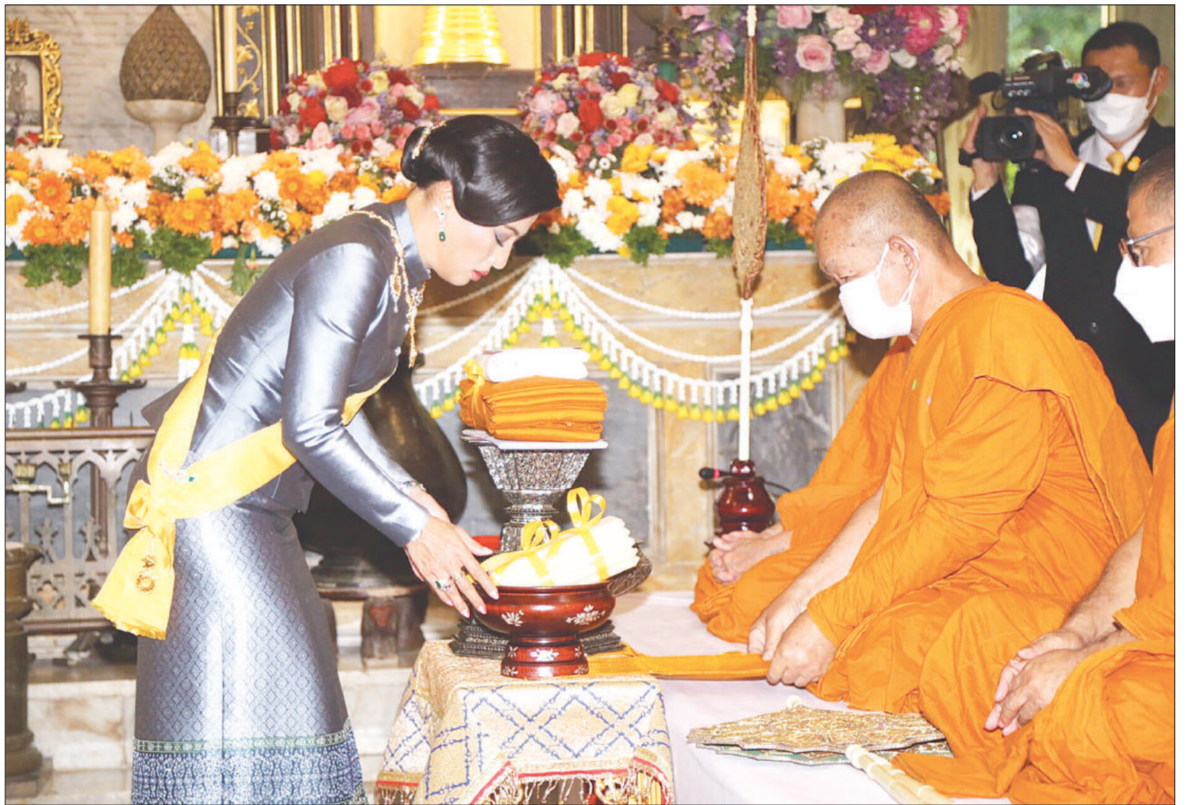
สมเด็จพระเจ้าลูกเธอ เจ้าฟ้าสิริวัณณวรี นารีรัตนราชกัญญา เสด็จแทนพระองค์ ถวายผ้าพระกฐิน พุทธศักราช 2564 ณ วัดนิเวศธรรมประวัติ อำเภอบางปะอิน จังหวัดพระนครศรีอยุธยา เมื่อวันที่ 5 พฤศจิกายน 2564

การมีอยู่ของสถาบันกษัตริย์เป็นส่วนสำคัญของความสัมพันธ์เชิงลึกของคนในชาติและความสัมพันธ์ระหว่างประเทศในเชิงประวัติศาสตร์ เช่น ไทย-จีน, ไทย-ญี่ปุ่น, ไทย-อังกฤษ เป็นต้น ที่น่าสนใจคือ ส่วนใหญ่หรือ 97% ระบุสถาบันกษัตริย์เป็นสถาบันหลักของการก่อร่างสร้างชาติในการกอบกู้เอกราช ทำนุบำรุงพระพุทธศาสนา และดูแลทุกข์สุขของราษฎร และ 96.1% ระบุไม่เห็นด้วยอย่างยิ่งกับการยกเลิก หรือแก้มาตรา 112 เพราะการมีอยู่ ไม่กระทบต่อการดำเนินชีวิตปกติและสิทธิส่วนบุคคลของประชาชนทั่วไป อ่านต่อหน้า 16