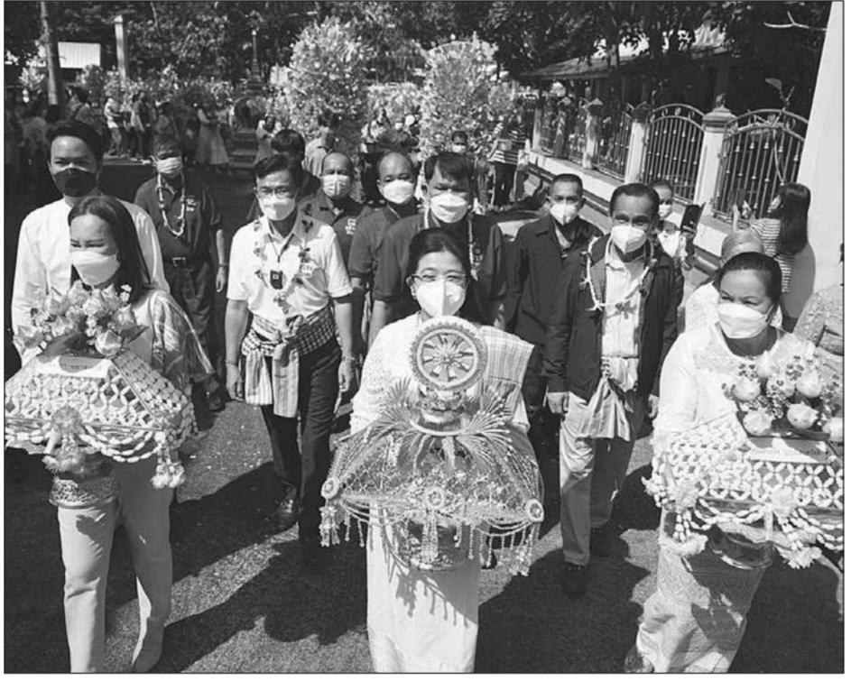
คุณหญิงสุดารัตน์ เกยุราพันธุ์ ประธานพรรคไทยสร้างไทย ร่วมทอดกฐินสามัคคีที่วัดหน้าพระธาตุ (วัดเหนือ) ตำบลนครไทย อำเภอนครไทย จังหวัดพิษณุโลก...