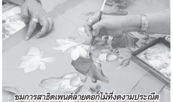
ชมการสาธิตเพนต์ลายดอกไม้ที่งดงามประณีต