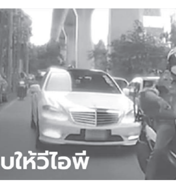
ขอบคุมาจาก Sanook

เรื่อง รถถูกเงิน ปรากฏอยู่ใน มาตรา 4 (19) คือหมายถึง รถดับเพลิงและรถพยาบาล