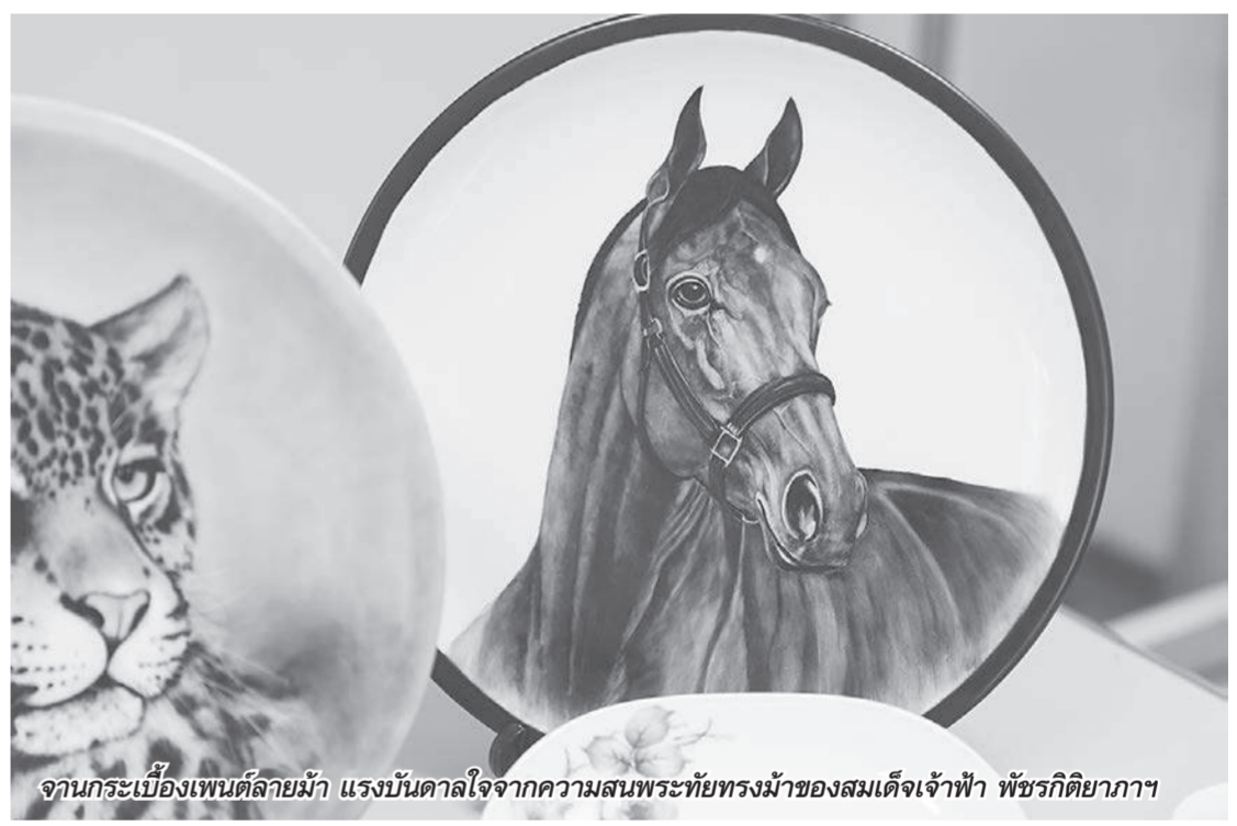
งานกระเบื้องเพนต์ลายม้า แร้งบนศาลาใจจากความสนพระทัยทรงม้าของสมเด็จพระเจ้าพี่นางเธอ เจ้าฟ้ากัลยาณิวัฒนา กรมหลวงมหมาทปรังษาลายม้า

สลีล สออส ชั้น 2 สยามพารากอน นำผลิตภัณฑ์ชิ้นงานฝีมือคอลเลกชันใหม่ที่ยังไม่เคยวางจำหน่ายที่ใดมาก่อน พร้อมด้วยสินค้าลดราคาครั้งใหญ่กว่า 2,000 ชิ้นมาให้ชมและชื้ออย่างมากมาย รายได้จากกำไรจำหน่ายทั้งหมดจะนำเข้าสู่มูลนิธิสายใจไทยฯ เพื่อช่วยเหลือสมาชิกทหารผ่านศึก