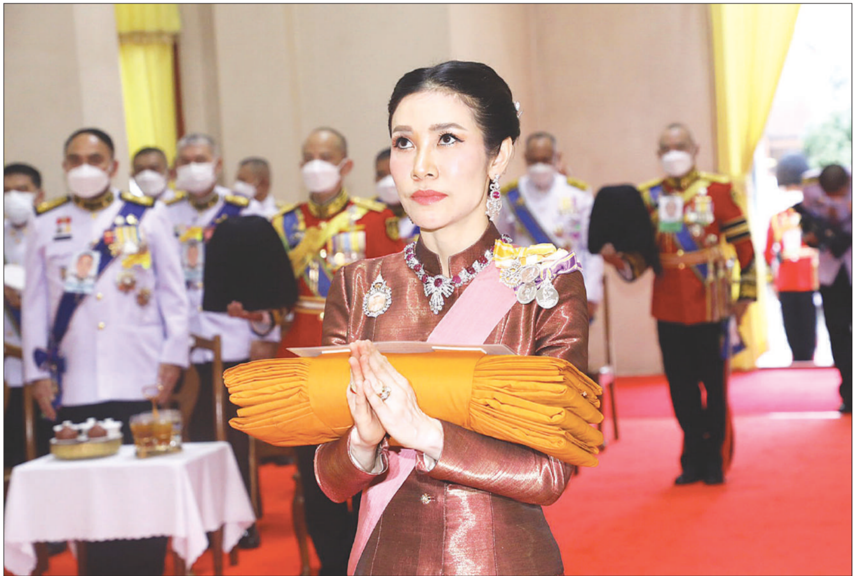
เจ้าคุณพระสินีนาง ทิลาภกัลยาณี เป็นผู้แทนพระองค์ไปถวายผ้าพระกฐิน ณ พระอุโบสถวัดพระปฐมเจดีย์ อําเภอเมืองนครปฐม จังหวัดนครปฐม เมื่อวันที่ 7 พฤศจิกายน 2564