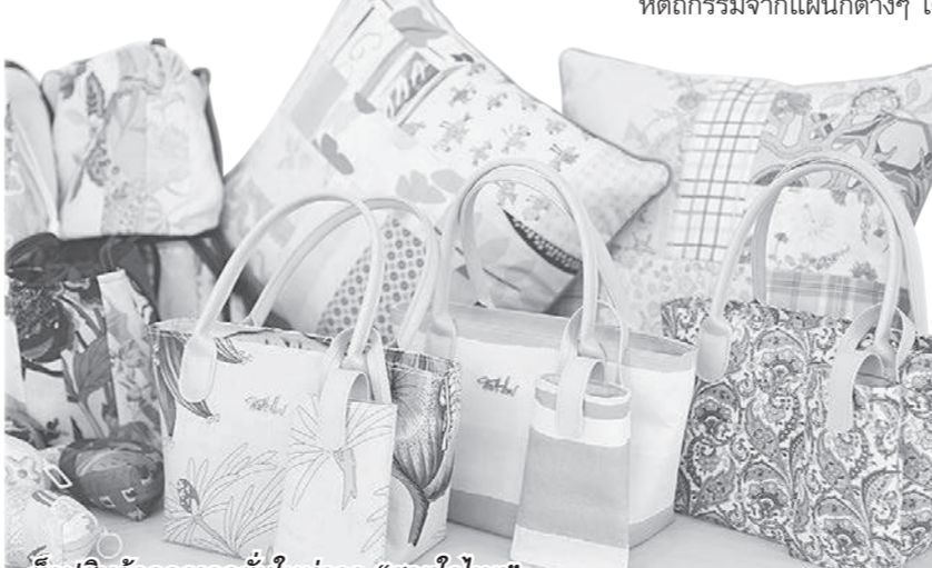
ชื้อปลินค้าคอลเลกชันใหม่จาก "สายใจไทย"