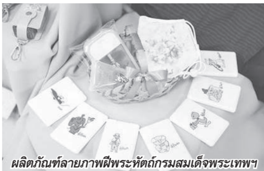
ผลิตภัณฑ์ลายภาพพิพระหัตถ์กรมสมเด็จพระเทพฯ

สลีล สออส ชั้น 2 สยามพารากอน นำผลิตภัณฑ์ชิ้นงานฝีมือคอลเลกชันใหม่ที่ยังไม่เคยวางจำหน่ายที่ใดมาก่อน พร้อมด้วยสินค้าลดราคาครั้งใหญ่กว่า 2,000 ชิ้นมาให้ชมและชื้ออย่างมากมาย รายได้จากกำไรจำหน่ายทั้งหมดจะนำเข้าสู่มูลนิธิสายใจไทยฯ เพื่อช่วยเหลือสมาชิกทหารผ่านศึก