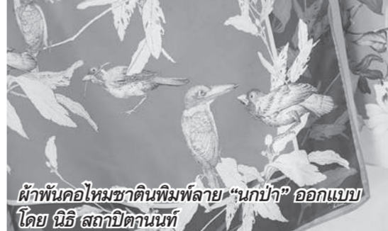
ผ้าพันคอไหมชาติพิมพ์ลาย "นกป่า" ออกแบบโดย นิธิ สถกาศิรินทร์