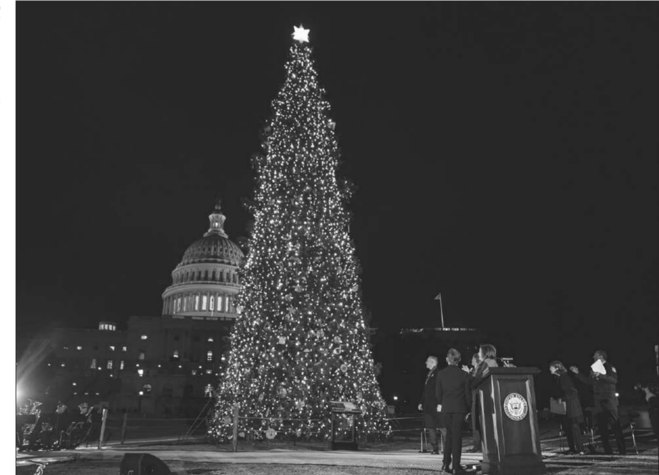
เบ็ดไฟ ● แนนซี เพโลซี ประธานสภาผู้แทนราษฎรสหรัฐฯ ทำพิธีเปิดต้นคริสต์มาสที่หน้าอาคารรัฐสภา กรุงวอชิงตัน ดี.ซี. เมื่อวันที่ 1 ธันวาคม ต้นคริสต์มาสปีสูง 84 ฟุต ตัดจากอุทยานแห่งชาติซีริเรอริส รัฐแคลิฟอร์เนีย.