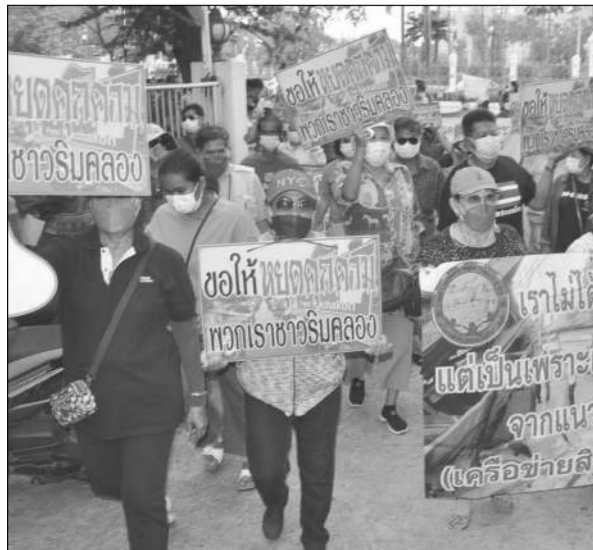
เครือข่ายท้องถิ่นตั้งเดิมชุมชนคนริมคลอง พร้อมตัวแทนชุมชนริมคลองเปรมประชากรคลองลาดพร้าว ที่ได้รับความเดือดร้อนจากการเข้าร่วมโครงการบ้านมั่นคงและถูกไล่ที่อยู่อาศัย ยื่นหนังสือขอความเป็นธรรมจาก พล.อ.ประยุทธ์ จันทร์โอชา นายกฯ เพื่อไต่ถามถึงโครงการดังกล่าว