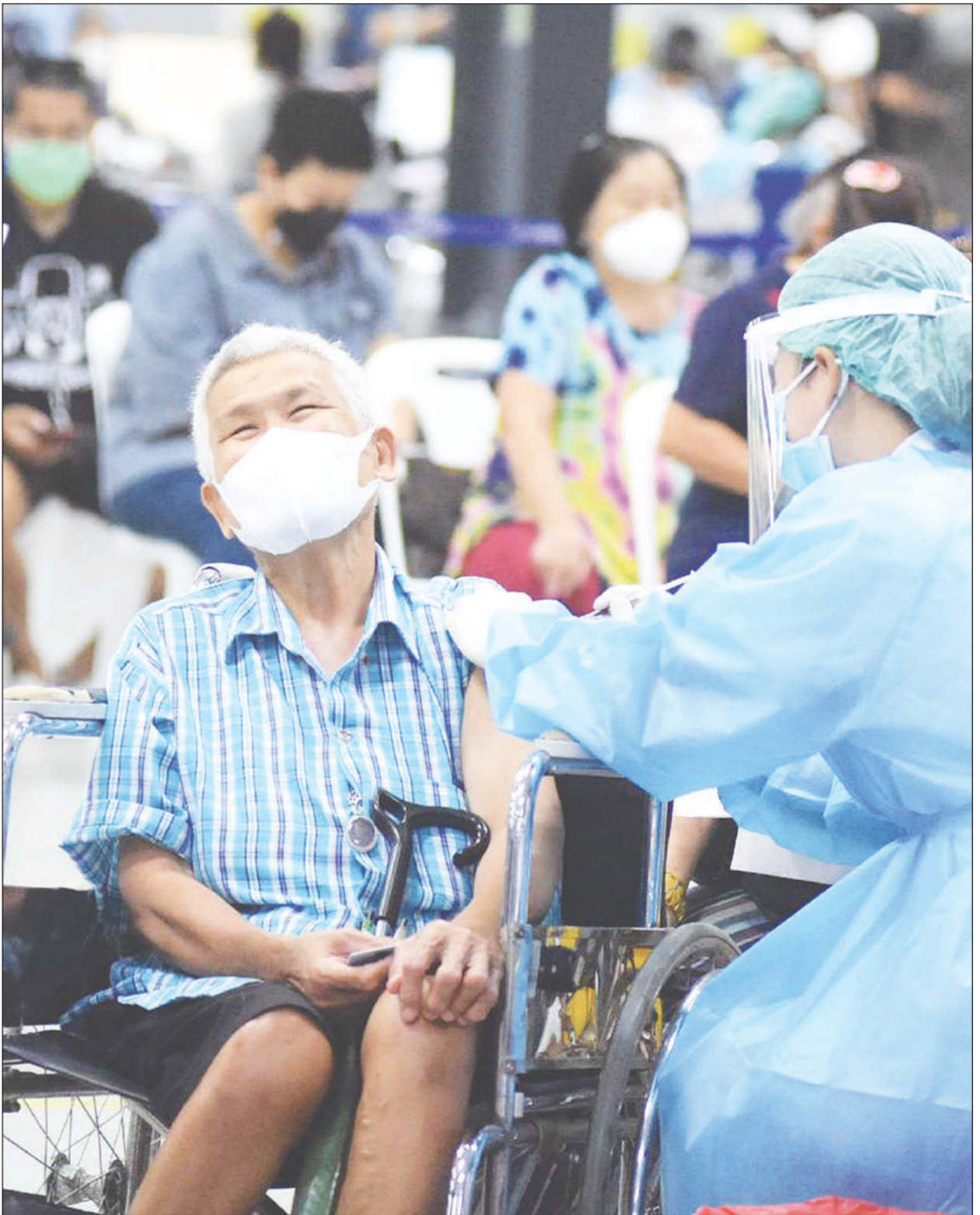
ประชาชนจำนวนมากเดินทางเข้ารับการฉีดวัคซีนเข็ม 1 เข็ม 2 และบูสเตอร์เข็ม 3 เพื่อสร้างภูมิคุ้มกันป้องกันโควิด-19 โดยเฉพาะสายพันธุ์โอมิครอนที่กำลังระบาดในเวลาสั้นๆ ที่ศูนย์ฉีดวัคซีนกลางบางซื่อ

ไทยโพสต์ • 4 วันสุดท้ายเลือกตั้งซ่อม ชุมพร-สงขลาเดือด “ธรรมนัส” ปราศรัย มั่นปาก “ก้าวไกล” สมช. ยื่น กกต.จังหวัด สงขลาขอเคลียร์หาเสียงบนเวที อดผู้สมัคร พปชร.ราย เอาโหมเงินและทำท่าลวงกระ เป้า “บิ๊กป้อม” ยัน ปชป.-พปชร.หาเสียง เดือดไล่กัน แต่ปิดหีบเลือกตั้งทุกอย่างจบ การหาเสียงช่วงโค้งสุดท้ายสนาม เลือกตั้งซ่อม ส.ส.ชุมพรและสงขลา ที่จะลงคะแนนเสียงกันวันอาทิตย์ที่ 16 ม.ค.นี้ ดำเนินไปอย่างเข้มข้น โดยเมื่อวันที่ 12 มกราคม 2565 ในช่วงเช้า ร.อ.ธรรมนัส พรหมเผ่า ในฐานะเลขาธิการพรรคพลังประชารัฐ (พปชร.) และนายชวลิต อัจฉาภา ผู้สมัคร ส.ส.เขต 1 เบอร์ 4 พรรคพลังประชารัฐ จ.ชุมพร พร้อมทีมงาน ได้ลงพื้นที่ พบปะทักทายประชาชนทั่วไปในย่านตลาดสด เทศบาลเมืองชุมพร โดย ร.อ.ธรรมนัสได้ แนะนำนายชวลิตหรือหนายแดงต่อประชาชน เพื่อให้เลือกมาช่วยดูแลชีวิตความเป็นอยู่ และพัฒนาเปลี่ยนแปลงเมืองชุมพรให้พัฒนาอย่างเข้มแข็ง ยั่งยืน โดยได้รับความ สนใจจากประชาชนและพ่อค้าแม่ค้าในตลาดสดเทศบาลเมืองชุมพรอย่างมาก จากนั้น ร.อ.ธรรมนัสพร้อมด้วยทนาย