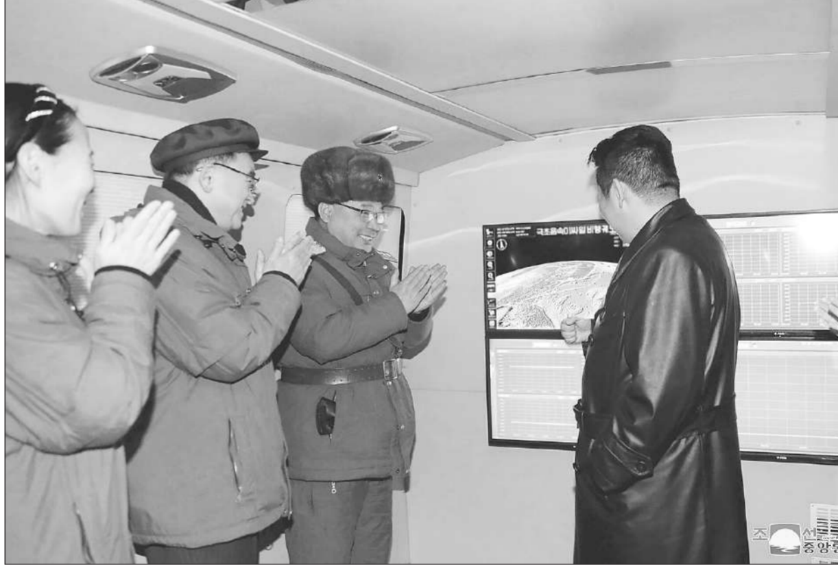
คิม จองอึน ผู้นำเกาหลีเหนือ สวมหมวกกับนายทหารระหว่างสังเกตการณ์การยิงทดสอบมิสไซล์ไฮเปอร์โซนิกในสถานที่ที่ไม่เปิดเผยในประเทศ

สื่อทางการเกาหลีเหนือรายงานว่า ภายหลังชมการทดสอบ คิมได้เรียกร้องต่อนักวิชาการทางการทหารให้เพิ่มความพยายามยิ่งขึ้นในการเสริมสร้างความแข็งแกร่งทางทหารเชิงยุทธศาสตร์ ทั้งในแง่คุณภาพและปริมาณ และให้ปรับปรุงกองทัพให้ทันสมัยมากขึ้นไปอีก