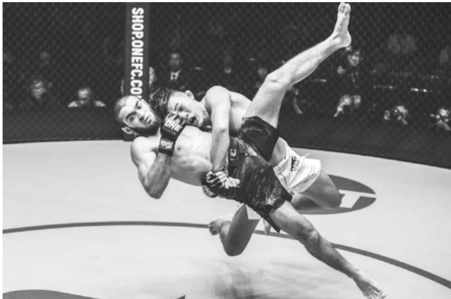
คาเกิ อาริสานาอิ vs คริสเตียน ดี