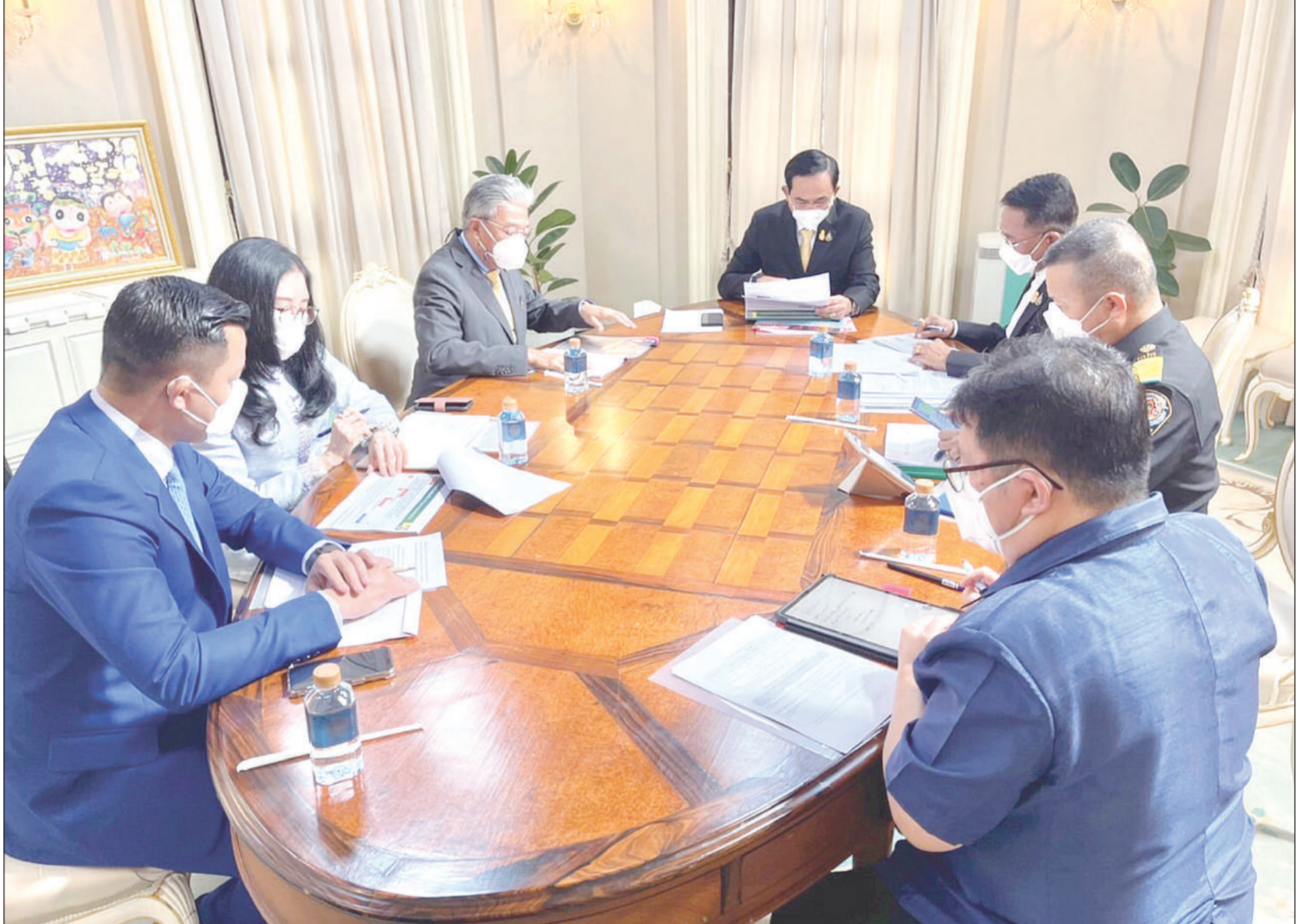
พล.อ.ประยุทธ์ จันทร์โอชา นายกรัฐมนตรีและรัฐมนตรีว่าการกระทรวงกลาโหม เรียกนายสัตวแพทย์สรวิศ ธานีโต อธิบดีกรมปศุสัตว์ เข้าพบด่วน เพื่อหารือถึงปัญหาโรคอหิวาต์แอฟริกาในสุกร (ASF) ที่ระบาดในประเทศ จนทำให้ราคาเนื้อหมูราคาพุ่งสูงขึ้นมาก