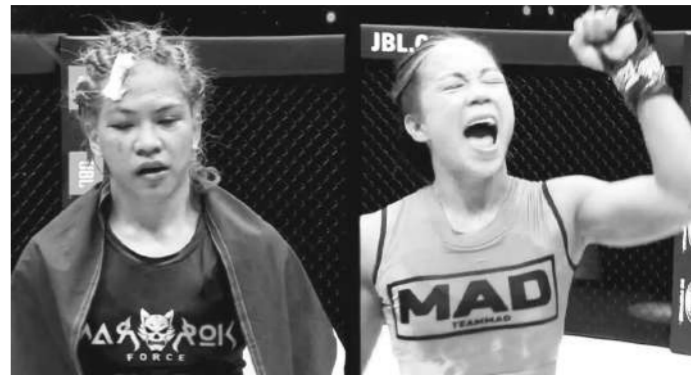
เคนนิส แชมโบอันกา vs ซอ ฮีฮาม