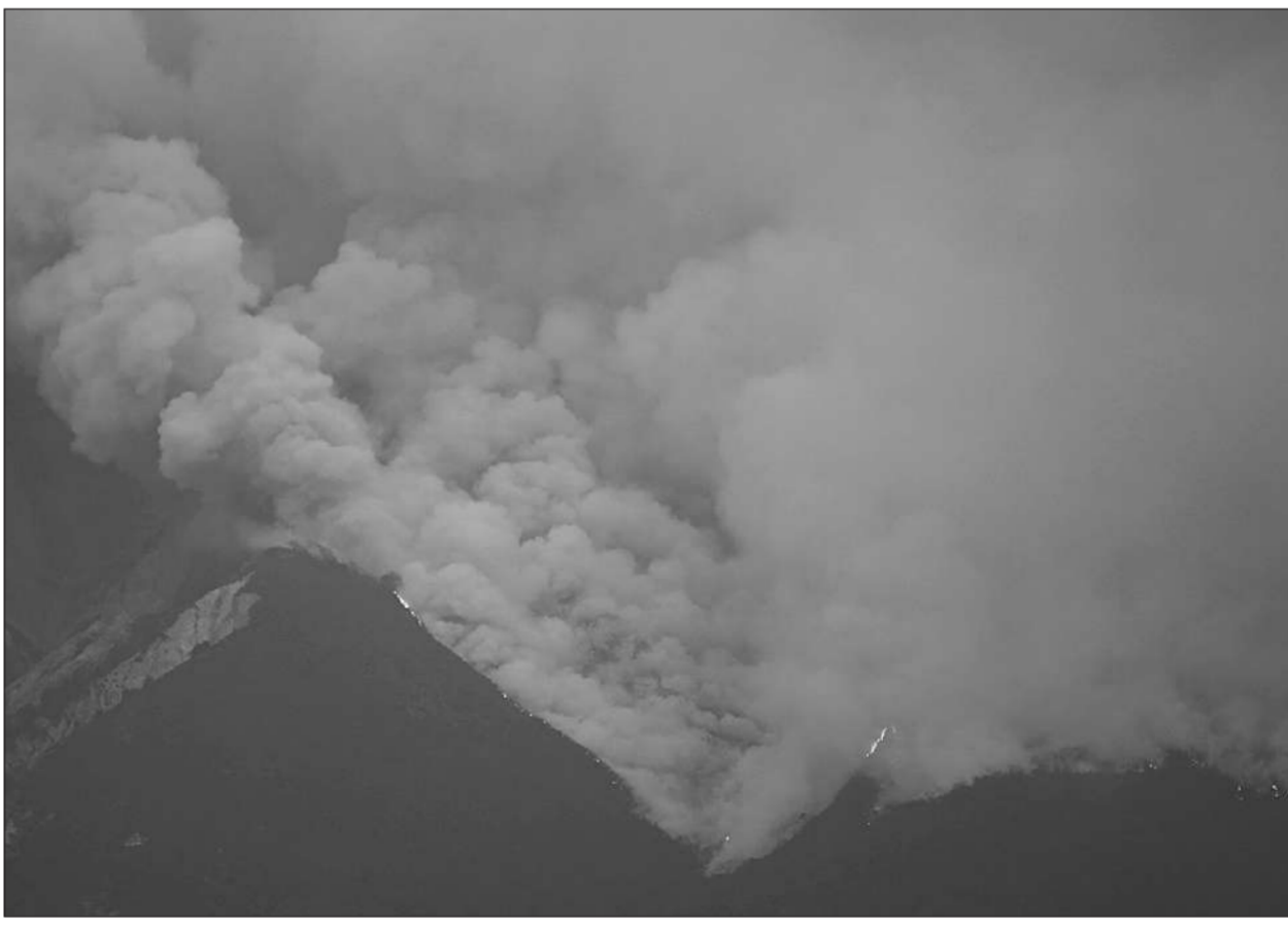
ไฟป่า ● คนและเปลวไฟพวยพุ่งขึ้นจากไฟป่าที่เกิดขึ้นใกล้เมืองบารีโลเซ รัฐริโอเนโกรของอาร์เจนตินา เมื่อวันที่ 13 มกราคม ไฟป่าเกิดขึ้นในรัฐริโอเนโกร, รัฐเนวเกน และรัฐชูปติ มาแล้วหลายสัปดาห์.

ลอนดอน ● สำนักพระราชวังอังกฤษประกาศถอดยศทหารของเจ้าชายแอนดรูว์ ดยุกแห่งยอร์ก พระราชโอรสในสมเด็จพระราชินีนาถเอลิซาเบธที่ 2 โดยพระองค์จะเลิกใช้ตำแหน่ง “เจ้าฟ้า” ด้วย และจะขึ้นศาลในฐานะสามัญชน เพื่อต่อสู้คดีที่ถูกหญิงอเมริกันกล่าวหาว่าล่วงละเมิดทางเพศขณะเป็นผู้เยาว์ คำประกาศของสำนักพระราชวังบักกิงแฮมเมื่อวันพฤหัสบดีที่ 14 มกราคม 2565 มีออกมาหนึ่งวันภายหลังทนายความของเจ้าชายไม่สามารถชกแจงให้ผู้พิพากษาศาลฎีกาชั้นกลางในนิวยอร์กปฏิเสธการรับฟ้องคดีที่เวอร์จิเนีย จูฟเฟร หมู่บ้านชาวอเมริกันวัย 38 ปี กล่าวหาเจ้าชายซึ่งมีพระชันษา 61 ปี ว่าล่วงละเมิดทางเพศเธอเมื่อปี 2544 ขณะที่เธอมีอายุ 17 ปี รายงานรอยเตอร์และเอเอฟพีเมื่อวันศุกร์อ้างแถลงการณ์จากพระราชวังบักกิงแฮมว่า ด้วยความเห็นชอบและความตกลงของสมเด็จพระราชินี ตำแหน่งทางทหารและหน่วยงานในพระอุปถัมภ์ของดยุกแห่งยอร์กจะถูกลบออกในสมเด็จพระราชินี “ดยุกแห่งยอร์กจะยังคงไม่ปฏิบัติกรณียกิจใดๆ และต่อสู้คดีนี้ในฐานะสามัญชน” แถลงการณ์ของสำนักพระราชวังอังกฤษกล่าว โดยอังกฤษยังแหล่งข่าวนิรนามที่ใกล้ชิดราชวงศ์ว่า เจ้าชายจะยุติการใช้ตำแหน่ง “His Royal Highness” หรือ HRH หรือยศเจ้าฟ้าที่ใช้กับพระบรมวงศ์ด้วย พระราชโอรสองค์โปรดในสมเด็จพระราชินีนี้ถูกขูดกบิบให้ยุติการปฏิบัติพระกรณียกิจเมื่อปี 2562 เนื่องจากมีความใกล้ชิดกับหญิงเพอร์รี่ เฮปสตัน นักการเงินผู้ทรงอิทธิพลที่ถูกตัดสินว่าเป็นผู้จัดหาการค้าประเวณีและล่วงละเมิดทางเพศผู้เยาว์ และหลังจากที่เจ้าชายประธาณสัมพันธ์กับแคปิตีซีวีที่ ที่กลับยังทำให้สถานการณ์ย่ำแย่ลง เมื่อเจ้าชายอ้างว่าพระองค์จำไม่ได้ว่าได้พบกับจูฟเฟร ทั้งที่มีหลักฐานภาพถ่ายชัดเจน และเจ้าชายยังปกป้องมิตรภาพระหว่างพระองค์กับเฮปสตัน