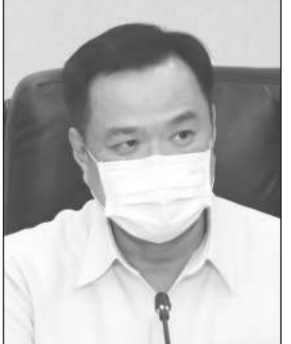
อนุทิน ชาญวีรกูล