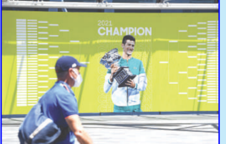
ชายคนแรกในประวัติศาสตร์ที่ชนะแกรนด์สแลม 21 รายการแล้วยังถูกแบนวิซ่า ห้ามเข้าประเทศออสเตรเลียเป็นเวลา 3 ปีด้วย.

เปิดฉาก "ผมพร้อมจะร่วมมือกับหน่วยงานที่เกี่ยวข้องกับการเดินทางออกนอกประเทศของผม"