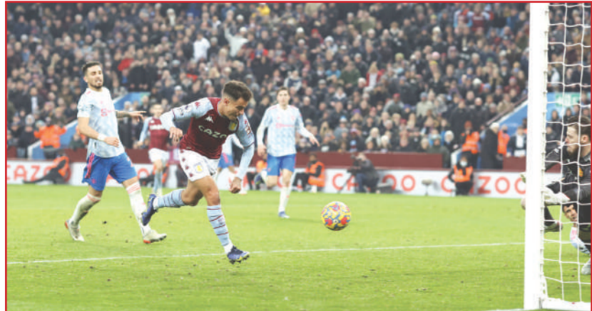
เบ็ดตัวสวย • ฟิลิปเป คูตินโญ ยิงประตูในนาทีที่ 82 ช่วยให้เจ้าบ้าน แอสตัน วิลลา ไล่ตามตีเสมอ แมนเชสเตอร์ ยูไนเต็ด 2-2 ทั้งๆ ที่โดนนำไปก่อน 2 ลูก

เบอร์มิงแฮม • ฟิลิปเป คูตินโญ ยอมรับว่ามีความสุขที่ได้กลับมาเล่นในพรีเมียร์ลีกอีกครั้ง