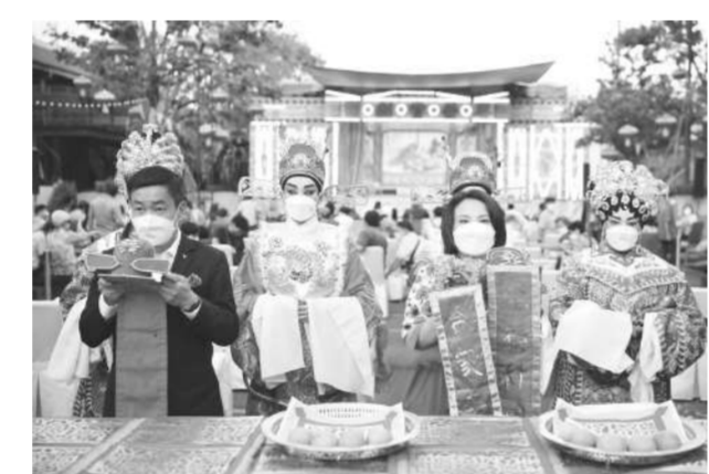
กราบไหว้ขอพรเจ้าแม่หม่าโจ้วเสริมสิริมงคล