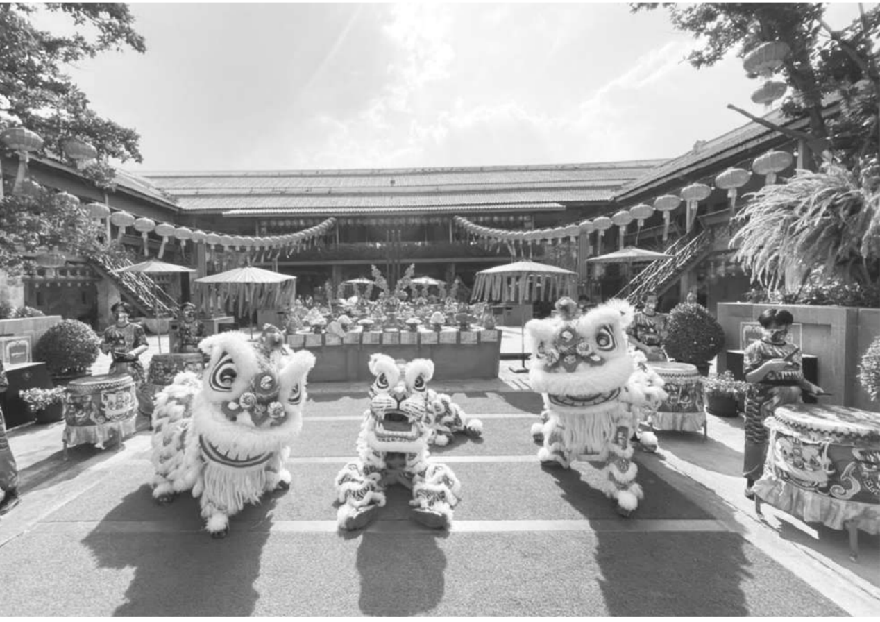
เรียนรู้วัฒนธรรม ชมสถาปัตยกรรมจีนโบราณที่เดอะ ลิ่ง 1919 รีเวอร์ไซด์ เฮอร์เทจ เดสติเนชั่น