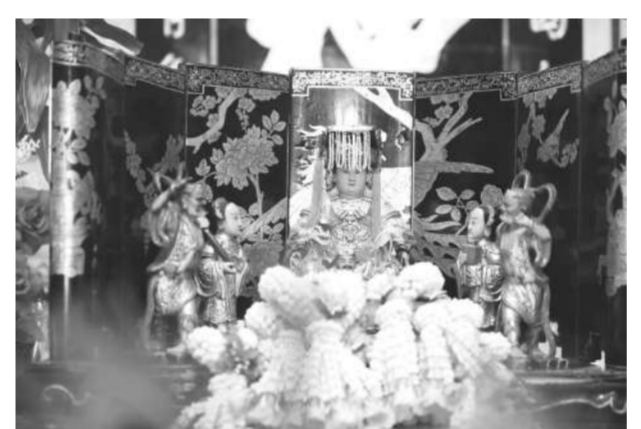
องค์เจ้าแม่หม่าโจ้วในศาลเจ้า