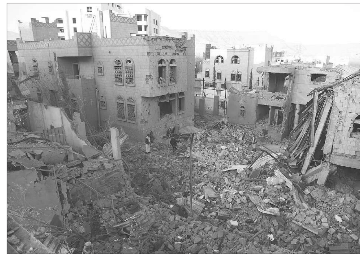
ถล่มราบ ● ชายเยเมนตรวจสอบความเสียหายของบ้านเรือนในกรุงซานา เมื่อวันที่ 18 มกราคม หลังการโจมตีทางอากาศของกองกำลังร่วมนำโดยซาอุดีอาระเบีย ตอบโต้ที่กบฏฮูตีใช้โดรนและมิสไซล์โจมตีกรุงซานาของรัฐบาลเยเมนอีโอมิครอน

ประเทศประชาธิปไตยที่สถาบันต่างๆ สูญเสียความไว้วางใจของประชาชนมากที่สุดเมื่อปีที่แล้ว คือ เยอรมนี ความไว้วางใจลดลง 7 จุด โดยตกลงมาอยู่ที่ 46% ตามด้วย ออสเตรเลีย คะเนแดน ลดลง 6 จุด อยู่ที่ 53%, เนเธอร์แลนด์ลดลง 6 จุด อยู่ที่ 57%, เกาหลีใต้ลดลง 5 จุด อยู่ที่ 42% และสหรัฐลดลง 5 จุด อยู่ที่ 43% กลับกัน ความไว้วางใจของประชาชนต่อสถาบันต่างๆ ในจีนเมื่อปีที่ผ่านมามีเพิ่มขึ้นถึง 11 จุด โดยมีคะแนนสูงถึง 83%, สหรัฐอาหรับเอมิเรตส์ (ยูเออี) เพิ่มขึ้น 9 จุด อยู่ที่ 76% และไทยเพิ่มขึ้น 5 จุด อยู่ที่ 66%