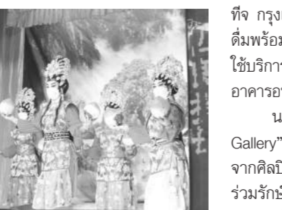
ชมศิลปะการแสดงจิวโบราณ

ที่จ กรุงเทพฯ ซึ่งนักท่องเที่ยวสามารถลิ้มรสเครื่องดื่มพร้อมทานอาหารว่างจากเมนูสุดพิเศษ รวมถึงใช้บริการพื้นที่ Co-Working Space ในบรรยากาศอาคารอนุรักษ์ที่สวยงามเหมาะกับการไลฟ์สไตล์ นอกจากนี้ ชวนเสฟงานศิลปะที่ “เดอะ Gallery” เป็นโครงการเพื่อชุมชน จำหน่ายสินค้าจากศิลปินคุณภาพและศูนย์รวมสินค้าชุมชน และร่วมรักษ์โลกกับ “reConcept” ร้านจำหน่ายของตกแต่งบ้านและเฟอร์นิเจอร์คุณภาพภายใต้แนวคิด Everything old is new again: reConcept reCycle reUse ที่สามารถใช้เป็นไอเดียตกแต่งบ้านและอาคารสำนักงานในราคาประหยัด โดยเปิดให้บริการทุกวัน ระหว่างเวลา 12.00-20.00 น. ตามแผนพัฒนาพื้นที่ซึ่งมีร้านค้าชั้นนำทยอยเปิดให้บริการใน “เดอะ ลิ่ง 1919 รีเวอร์ไซด์ เฮอร์เทจ เดสติ