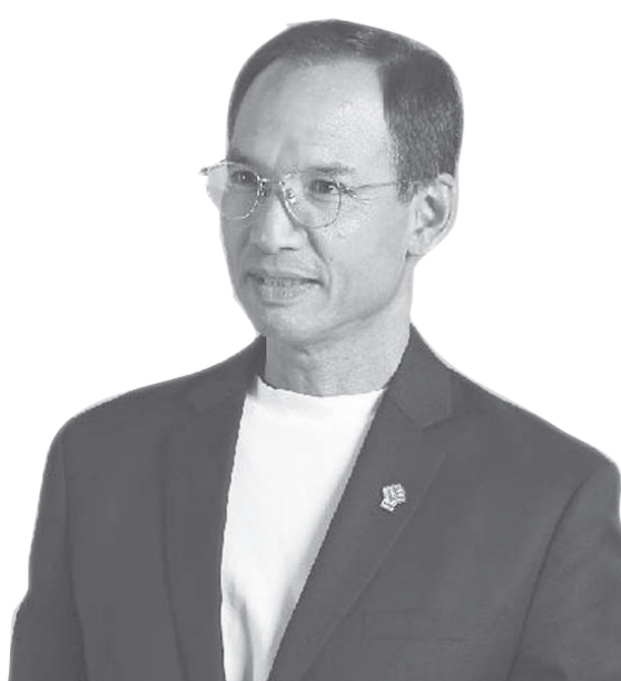
กอร์น จาคิตกอนิช หัวหน้าพรรคกล้า

“การเลือกตั้งซ่อมอาจทำให้รัฐบาลเสถียรมากเกินไป แต่เมื่อเลือกตั้งซ่อมในภาคใต้จบลงแล้ว ก็ขอให้กลับมามีการทำงานที่การแก้ปัญหาเศรษฐกิจ ต้องแก้ไขร่วมกันอย่างมีเอกภาพทุกหน่วยงาน ทุกกระทรวง ต้องร่วมมือกัน ซึ่งตรงนั้นมันต้องมีการแสดงความเป็นผู้นำ ตั้งแต่ระดับนายกรัฐมนตรีไล่ลงมา”