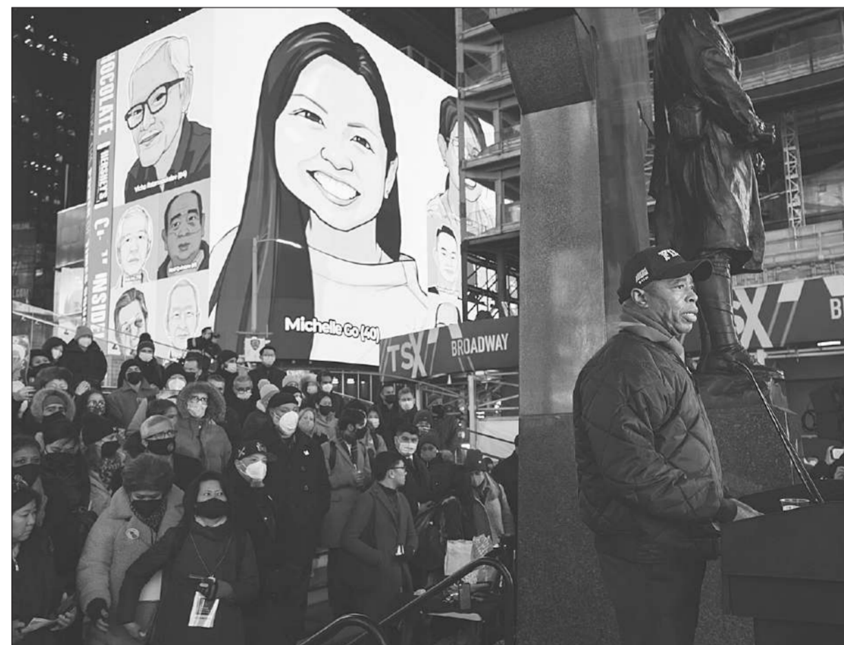
ไวโอลีย์ • เอริก อัดัมส์ นายกเทศมนตรีนครนิวยอร์ก กล่าวที่จัตุรัสไทม์สแควร์ เมื่อคืนวันที่ 18 มกราคม ระหว่างที่ไวโอลีย์ให้กับมีเซลโก หญิงอเมริกันเชื้อสายเอเชีย วัย 40 ปี ที่ถูกหลักตำรวจรถไฟใต้ดินและถูกรถไฟชน เมื่อวันที่ 15 มกราคม และเสียชีวิตในเวลาต่อมา.

“ภัยพิบัติที่ไม่เคยเกิดขึ้นมาก่อนถล่มตองกา” รัฐบาลกล่าวในแถลงการณ์ และว่าหน่วยกู้ภัยถูกส่งไปอพยพประชาชนในพื้นที่ที่ประสบภัยรุนแรงที่สุดแล้ว โดยมีรายงานว่า มีคนเสียชีวิตอย่างน้อย 3 คน บาดเจ็บอีกจำนวนหนึ่ง ผู้เสียชีวิต รวมถึงหญิงอายุ 65 ปี บนเกาะแมงโก และหญิงชาวอังกฤษ สำนักงานเพื่อการพัฒนาระหว่างประเทศของสหรัฐฯ (ยูเอสเออี) อ้างข้อมูลของสมาคมกาชาดตองกาว่า เกือบเขาไฟและสึนามิส่งผลกระทบบต่อประชาชนมากกว่า 100,000 คน หรือเท่ากับประชากรทั้งประเทศนี้ เครื่องบินลำเลียงของกองทัพออสเตรเลียและนิวซีแลนด์พร้อมนำส่งสิ่งของบรรเทาทุกข์ทันทีที่เรือขนส่งสินค้าจากต่างประเทศมาถึงท่าเรือของเกาะตองกา