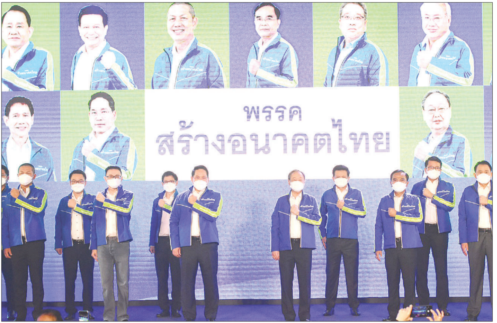
นายอุตตม สาวนายน อดีต รมว.การคลัง และนายสนธิรัตน์ สนธิจิรวงศ์ อดีต รมว.พลังงาน เปิดตัวพรรคการเมืองใหม่ในชื่อ พรรคสร้างอนาคตไทย ที่โรงแรมเซ็นทาราแกรนด์แอทเซ็นทรัลเวิลด์ โดยมีนักการเมือง นักวิชาการ นักธุรกิจ เข้าร่วมกันตัดเค้ก