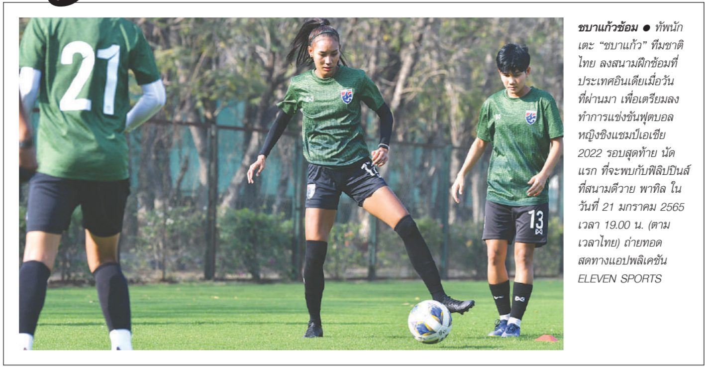
ชบาแก้วซ้อม ● ท็อปนักเตะ "ชบาแก้ว" ทีมชาติไทย ลงสนามฝึกซ้อมที่ประเทศอินเดียเมื่อวันที่ผ่านมา เพื่อเตรียมลงทำการแข่งขันฟุตบอลหญิงชิงแชมป์เอเชีย 2022 รอบสุดท้าย นัดแรก ที่จะมีขึ้นที่ฟิลิปปินส์ ที่สนามติเวีย พาทิล ในวันที่ 21 มกราคม 2565 เวลา 19.00 น. (ตามเวลาไทย) ถ่ายทอดสดทางแอปพลิเคชัน ELEVEN SPORTS

กรุงเทพฯ ● รับกรรมไปหลังจากศาลสั่งจำคุก 6 เดือน ปรับเหลือ 1 แสนบาท พร้อมรอลงอาญา 2 ปี แก๊งจ้างล้มบอลไทยลีก 2 คู่ สมุทรสาคร เอพี เปิดบ้านรับระยอง เอพี เมื่อวันที่ 21 เม.ย. 2561 โดย 2 อดีตปะทิวคือ นายณัฐกร ฉิมพาลี นายสุระศักดิ์ หัสจรรย์ พร้อมนายพงศ์พันธ์ วงศ์สุวรรณ อดีตผู้บริหารสโมสรฟุตบอล