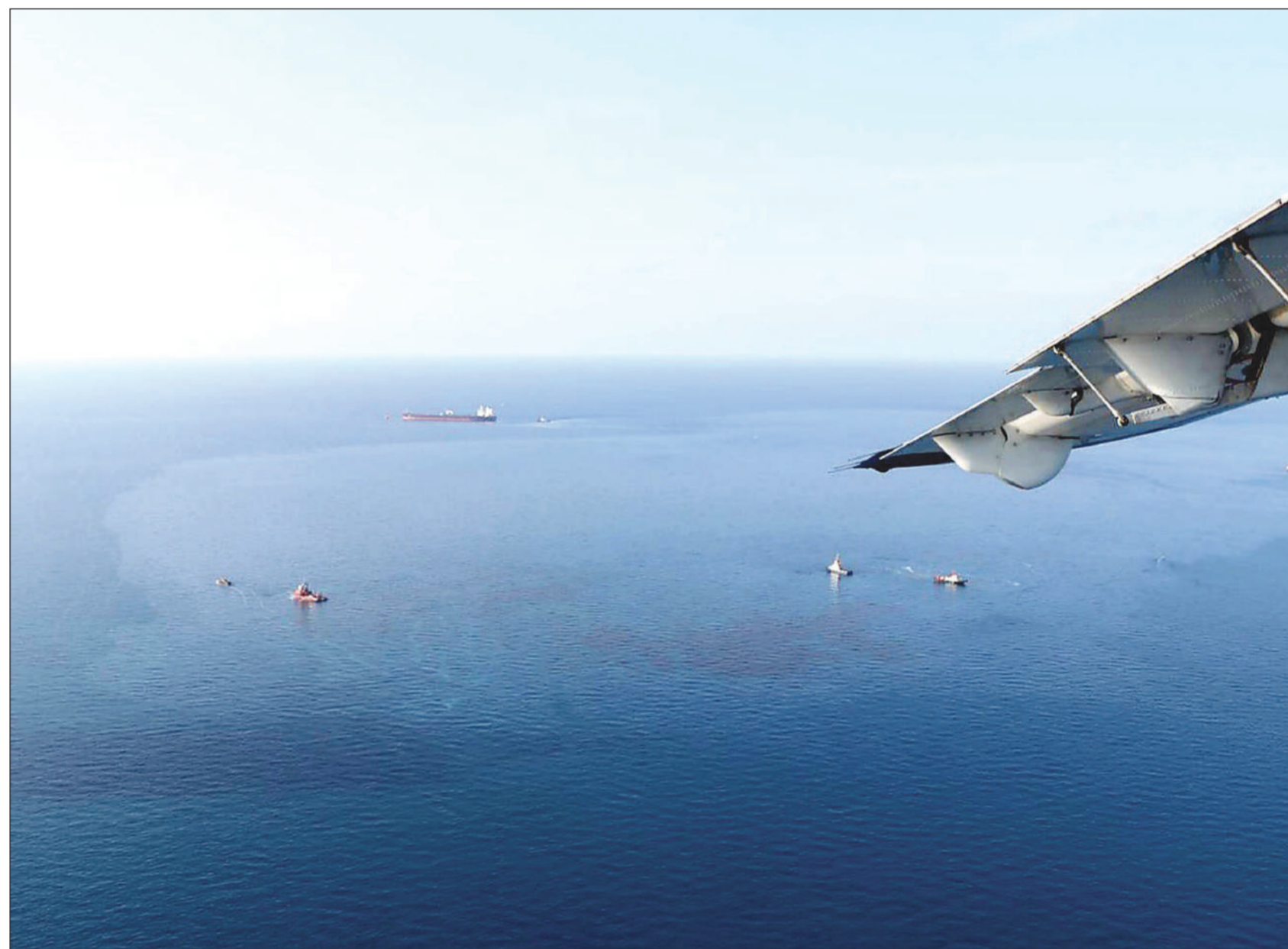
ทัพเรือภาคที่ 1 ส่งเครื่องบินลาดตระเวนขึ้นบินสำรวจคราบน้ำมันทางอากาศ พร้อมจัดเรือตรวจการณ์ ต.273 และ ต.228 ออกตรวจสอบคราบน้ำมันบนผิวน้ำ หลังเกิดเหตุน้ำมันดิบรั่วไหลออกจากท่อใต้ทะเลของทุ่นรับน้ำมันดิบกลางทะเลของบริษัท สตาร์ ปิโตรเลียม รีไฟน์นิ่ง จำกัด (มหาชน) ในพื้นที่นคมอุตสาหกรรมมาบตาพุด จ.ระยอง

บิกตูทุลเชิญ ‘มกุฎราชกุมาร’ มาเยือน-เร่งตั้งทูต