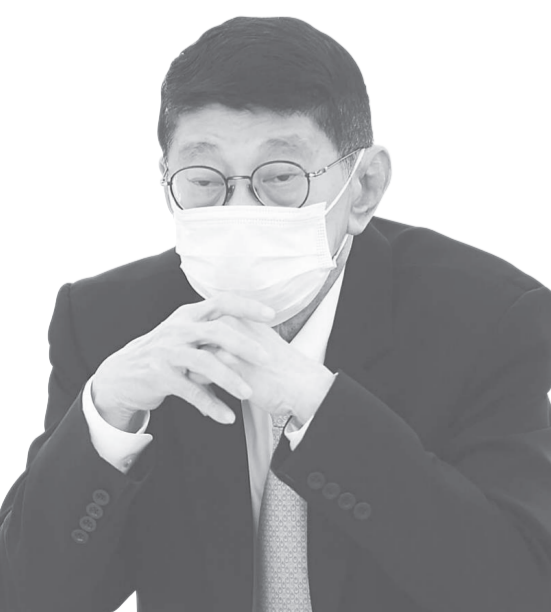
นายวิษณุ เครืองาม รองนายกรัฐมนตรี

คำถามมีอยู่ว่า ถ้าคนที่มาสอบติดโควิด-19 จะทำอย่างไร แม้จะบอกว่าจะมีการตรวจ ATK ก็ตาม แต่ถ้าตรวจ ATK แล้วผลออกมาติดเชื้อแล้วจะทำอย่างไร จะแยกห้องสอบได้หรือไม่ เพราะการติดสิทธิ์ไม่เหลือบั้น นับเป็นการติดสิทธิ์ ติดโอกาสเขา.