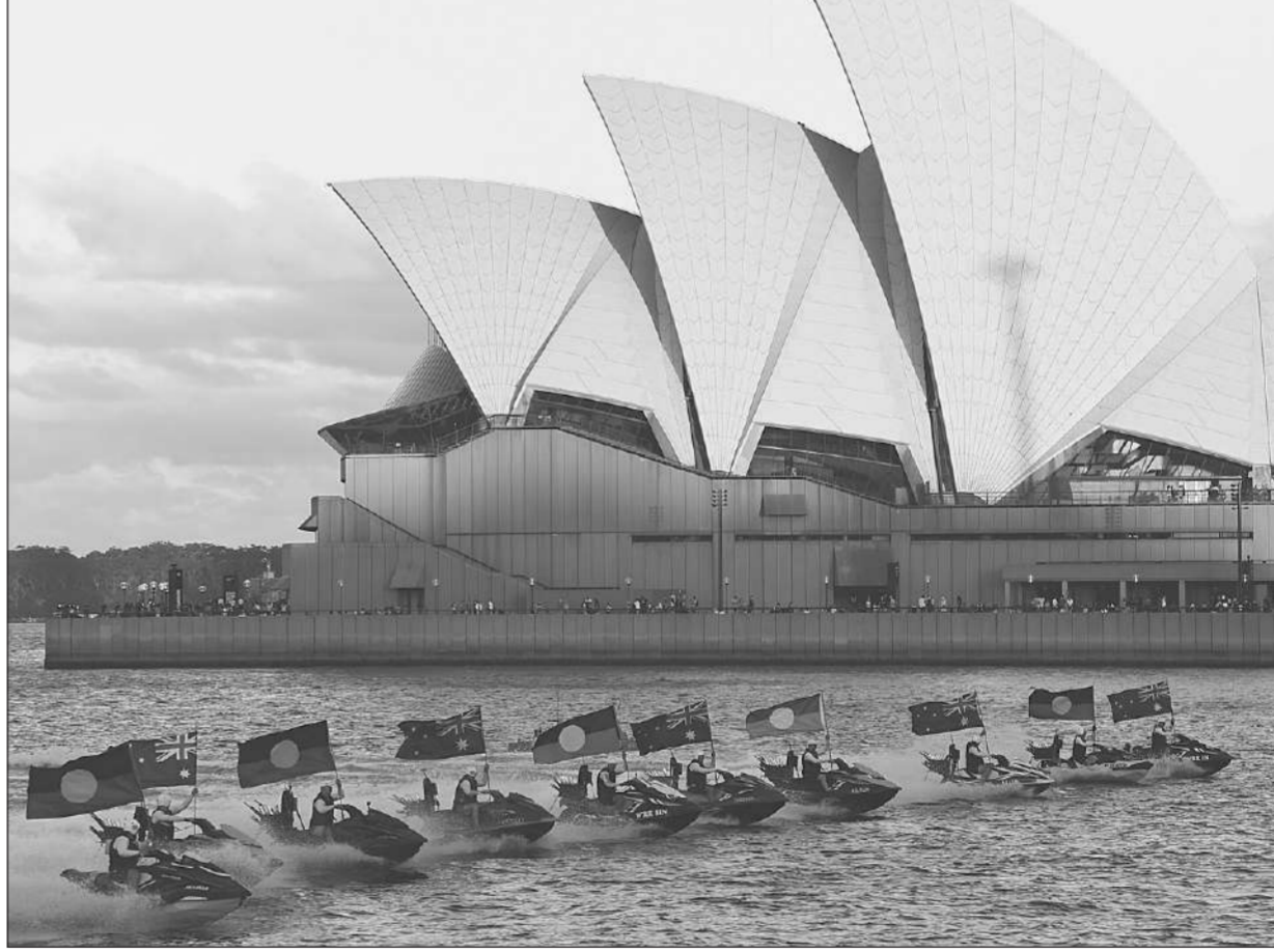
ฉลองวันชาติ • คนที่เจ็ดสก็อตธงชาติออสเตรเลียและธงของบอร์จีนที่เป็นชนเผ่าพื้นเมือง ผ่านโอเปร่าเฮาส์ในนครซิดนีย์ ระหว่างที่มีการแสดงคอนเสิร์ตฉลองวันชาติ เมื่อวันที่ 26 มกราคม

ไบเดนกล่าวว่า หากรัสเซียยกกำลังพลบุกยูเครน จะเป็นการรุกรานครั้งใหญ่ที่สุด นับตั้งแต่สงครามโลกครั้งที่ 2 และ “เปลี่ยนแปลงโลก” ซึ่งจะนำไปสู่ผลกระทบมหาศาล ซึ่งรวมถึงการคว่ำบาตรปูติน การคว่ำบาตรผู้นำประเทศโดยตรงนั้นเกิดขึ้นมานาน แต่ไม่ใช่ไม่เคยเกิดขึ้นก่อน ผู้นำคนอื่นที่เคยโดนสหรัฐคว่ำบาตร อาทิ