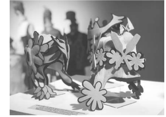
หมวกที่ได้แรงบันดาลใจจากประเพณีแข่งเรือน่าน

ตำนานที่เล่าสืบทอดกันมา ทำให้เข้าใจชุมชนมากยิ่งขึ้น นอกจากนี้ ชาวบ้านมีทักษะดีมากเก่งในการทำเครื่องมือเครื่องใช้แบบปักษ์ถิ่นด้วยตนเองและทีมก่อออกแบบ 5 คน ได้นำมรดกวัฒนธรรมมาตีไซน์ เป็นผลงานให้สามารถใช้งานได้จริงในชีวิตประจำวัน อาทิ กระเป๋ามอนอชิ เครื่องประดับเครื่องสักการะ แก้วน้ำ เป็นต้น นอกจากนี้ ได้สร้างสรรค์การแสดง