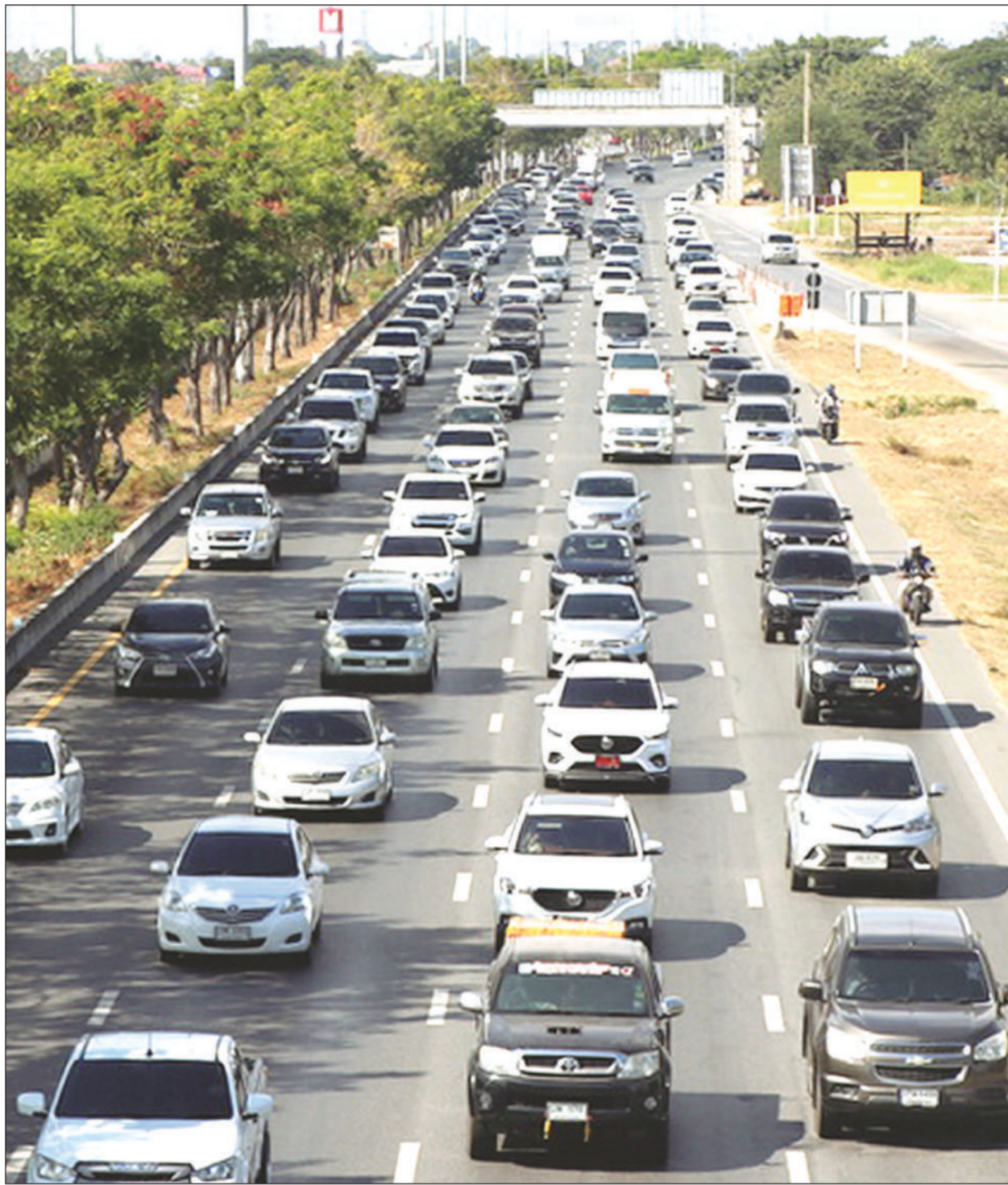
การจราจรบนถนนสายเอเชียช่วงจังหวัดอ่างทองเมื่อวันจันทร์ ซึ่งเป็นวันหยุดเทศกาลปีใหม่วันสุดท้าย รถติดตลอดทั้งวัน สืบเนื่องจากประชาชนทยอยเดินทางกลับกรุงเทพฯ

‘พัลลภ’ โวยลบชื่อพันพรรค ข้องใจคำสั่ง ‘ทำชั่ว’ ในอดีต