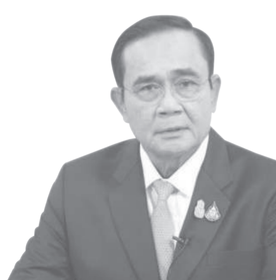
พล.อ.ประยุทธ์ จันทร์โอชา นายกรัฐมนตรีและรัฐมนตรีว่าการกระทรวงกลาโหม

บางครั้งทุกคนไปพูดกันปลายทางเสียเยอะ ก็กลายเป็นว่าไปพูดเรื่องความขัดแย้งเสียเยอะ เราควรไปมองต้นทางว่าปัญหามันอยู่ที่ไหน มีอะไรเกิดขึ้นมาแล้วบ้าง จะแก้ยังไงไร นั่นเป็นสิ่งที่ต้องทำ รัฐบาลต้องทำ เพราะเป็นความรับผิดชอบของรัฐบาล.