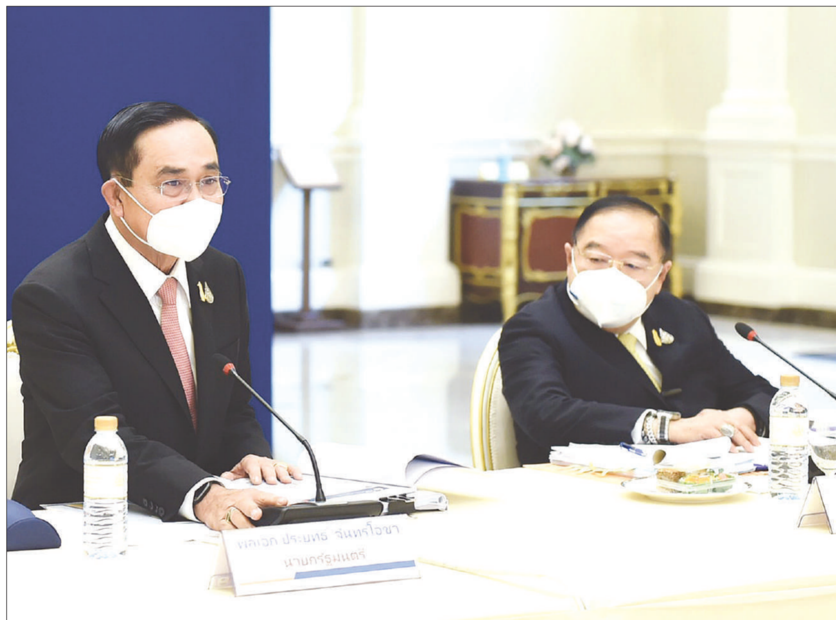
พล.อ.ประยุทธ์ จันทร์โอชา นายกรัฐมนตรีและ รว.กลาโหม เป็นประธานการประชุมคณะกรรมการจัดความยากจนและพัฒนาคนทุกช่วงวัยอย่างยั่งยืนตามหลักปรัชญาของเศรษฐกิจพอเพียง ครั้งที่ 1/2565 โดยมี พล.อ.ประวิตร วงษ์สุวรรณ รองนายกรัฐมนตรี และ พล.อ.อนุพงษ์ เผ่าจินดา รว.มหาดไทย เข้าร่วมประชุมด้วย ที่ทำเนียบรัฐบาล