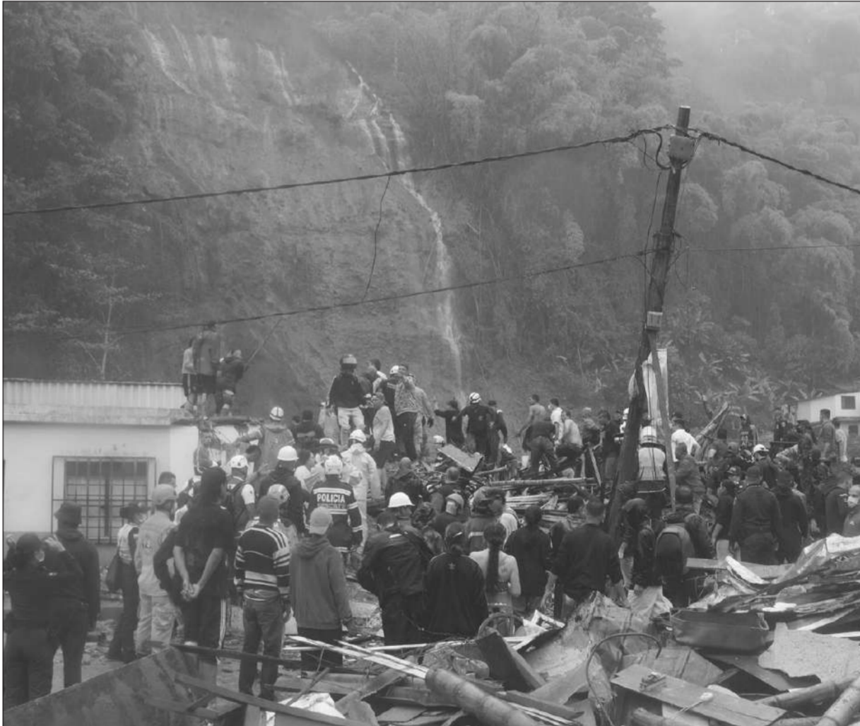
โคลนถล่ม ● ฝนตกหนักทำให้เกิดโคลนถล่มที่บ้านเรือนประชาชนในเขตเทศบาลนครหาดใหญ่ ใกล้เคียงเปเรร์ราทางตะวันตกของโคลอมเบีย เมื่อวันที่ 8 กุมภาพันธ์ มีผู้เสียชีวิตอย่างน้อย 14 ราย บาดเจ็บ 34 คน