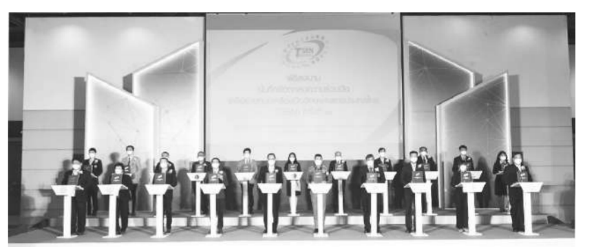
เครือข่ายศูนย์เครื่องมือวิจัย/อาคารศูนย์ประชุมอุทยานวิทยาศาสตร์ประเทศไทย (TSP-CC) สวทช. จ.ปทุมธานี

สอบเกิดขึ้นอย่างเด็ดขาด แต่เมื่อเร็วๆ นี้ ตนได้รับรายงานว่าเจอมือป็นรับจ้างสอบที่สนามสอบพื้นที่จังหวัดประจวบคีรีขันธ์ โดยพบครูอัตราจ้างรายหนึ่งจ้างบุคคลภายนอกมาจากจังหวัดมหาสารคาม จากการตรวจสอบพบว่ามีการปลอมแปลงบัตรประจำตัวประชาชนเข้าสอบแทนผู้สมัครซึ่งเป็นครูอัตราจ้างในจ.ประจวบคีรีขันธ์ เบื้องต้น สพฐ.ได้ลงโทษตัดสิทธิ์การเข้ารับราชการของทั้ง 2 ราย “ที่สนามสอบจังหวัดประจวบคีรีขันธ์เข้าสอบแทนตัวเอง ซึ่งเจ้าหน้าที่คุมสอบเข้าไปตรวจสอบเจอก่อน จากนั้นจึงเชิญออกจากห้องสอบ และสนามสอบจังหวัดประจวบคีรีขันธ์ได้แจ้งความดำเนินคดีไว้แล้ว โดยจากนี้จะเป็นการดำเนินคดีทางกฎหมายกับผู้จ้างสอบต่อไป”