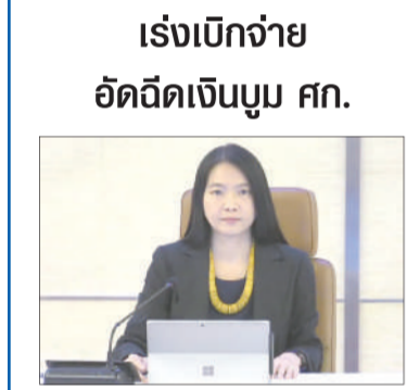
เร่งเบิกจ่าย อัดฉีดเงินบูม ศก.