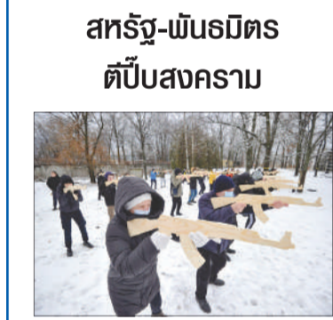
สหรัฐ-พันธมิตร ตีบสงคราม