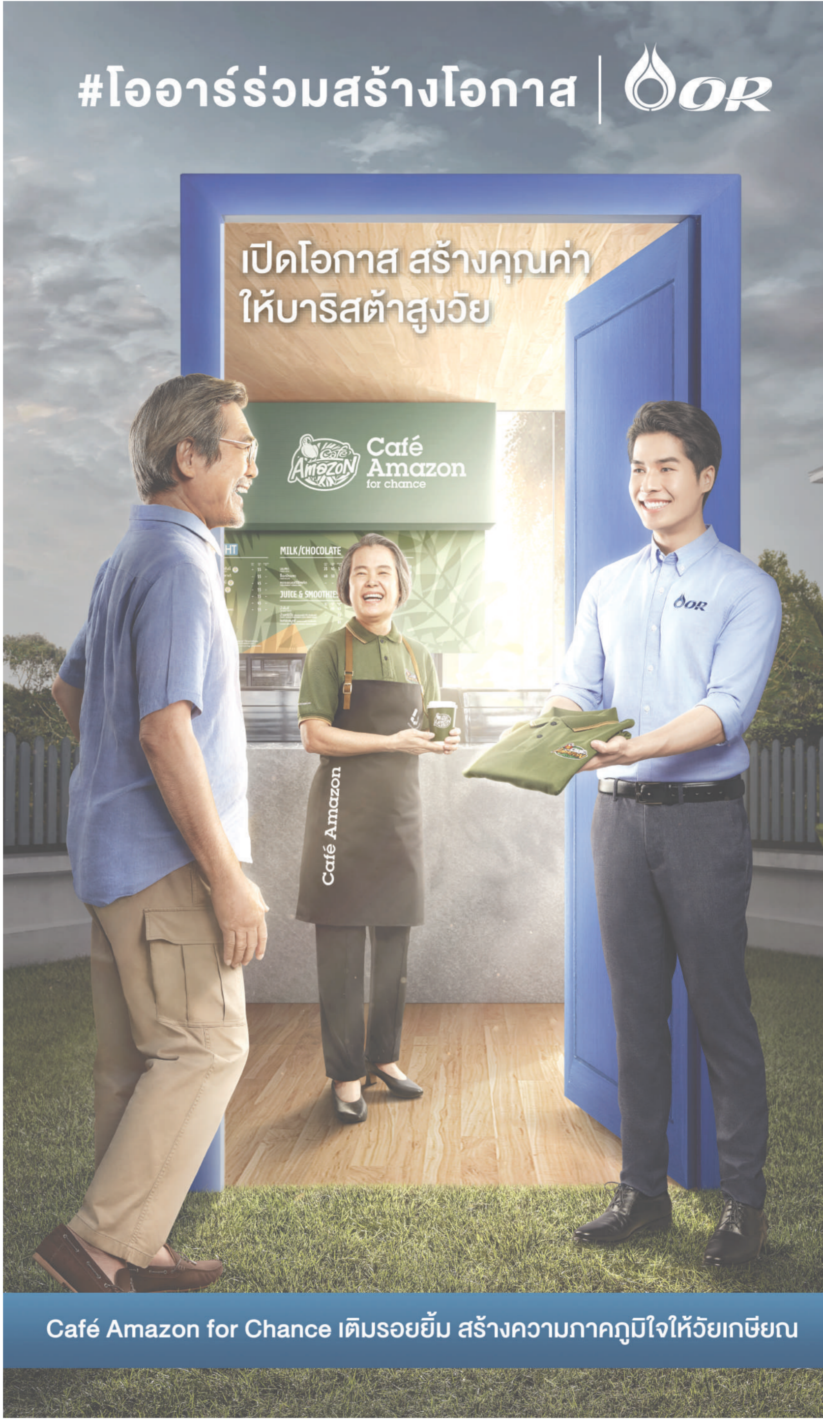
Café Amazon for Chance เต็มรอยยิ้ม สร้างความภาคภูมิใจให้วัยเกษียณ

นายเรืองไกรกล่าวเพิ่มเติมว่า กรณีดังกล่าว กรมสรรพากรอาจยังไม่ได้ตรวจสอบเรื่องนี้ ดังนั้น จึงมีเหตุที่ควรแจ้งให้นายกรัฐมนตรีทราบ เพื่อพิจารณาส่งเรื่องกรมสรรพากรตรวจสอบไปว่ารายได้ของนายเดชอิศม์และคู่สมรส มีการนำไปเสียภาษีโดยครบถ้วนถูกต้องทุกๆ ปีหรือไม่ โดยในวันที่ 14 ก.พ. จะส่งหนังสือทางไปรษณีย์ EMS ถึง พล.อ.ประยุทธ์ จันทร์โอชา นายกรัฐมนตรีและรัฐมนตรีว่าการกระทรวงกลาโหม เพื่อขอให้ตรวจสอบต่อไป