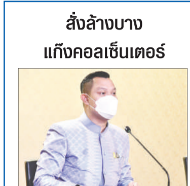
สั่งล้างบาง แก๊งคอลเซ็นเตอร์

‘อนุทิน’ มั่นใจมี 260 เสียง เมินตั้งวอร์รูมศึกชกฟอก