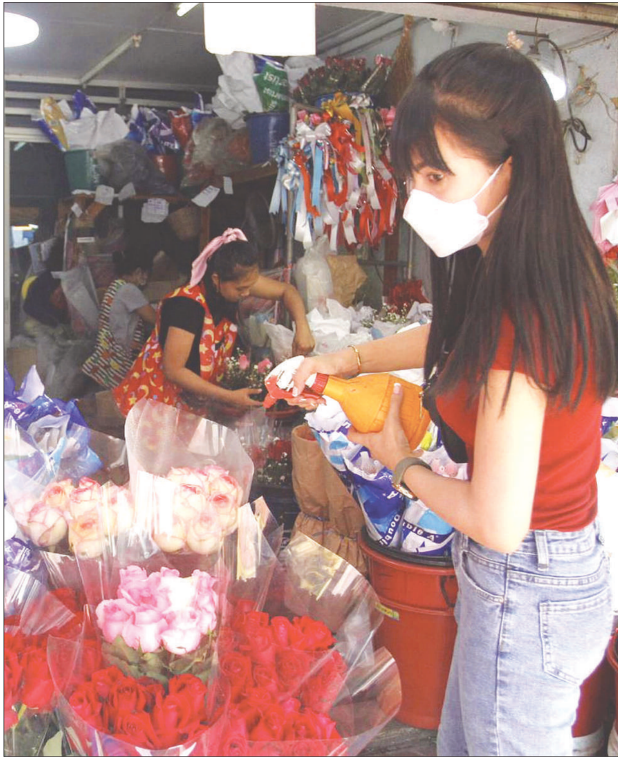
แม่ค้าร้านดอกไม้ตลาดปากคลองตลาดฉีดน้ำให้ดอกกุหลาบเพื่อคงความสด รอประชาชนมาเลือกซื้อในช่วงเทศกาลวันวาเลนไทน์

กมธ.เปลี่ยนเป้า เน้นค้ำชู ‘สุขชีวีร์’ เอื้อผลประโยชน์