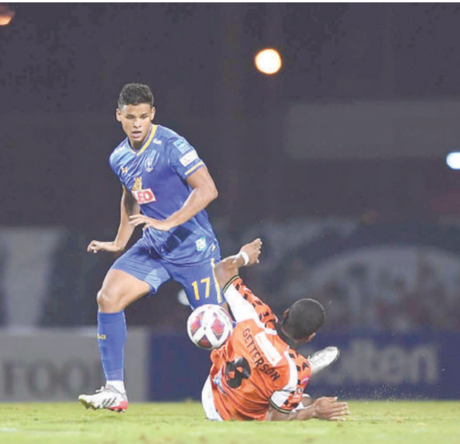
กลุ่มเอช : โอจีเอ็มที ซีดี, เวียดนาม โดยมี 4 สโมสรที่อยู่ในกลุ่มนี้ ประกอบไปด้วย (ชน

กรุงเทพฯ • สมาพันธ์ฟุตบอลแห่งเอเชีย หรือ เอเอฟซี ยืนยันว่าได้เลือกประเทศไทยให้เป็นเจ้าภาพจัดการแข่งขันฟุตบอลเอซีแอลแชมเปียนส์ลีก ฤดูกาล 2022 รอบแบ่งกลุ่ม 3 กลุ่ม โดยยืนยันการจัดการแข่งขันที่กรุงเทพมหานคร, บุรีรัมย์ และเชียงใหม่ ทางเอเอฟซีจะส่งเจ้าหน้าที่มาตรวจความพร้อมของสนามอีกครั้งในช่วงต้นเดือนมีนาคม สำหรับการแข่งขันฟุตบอลเอเอฟซีแชมเปียนส์ลีก ฤดูกาล 2022 มีตัวแทนจากประเทศไทยเข้าร่วมการแข่งขันทั้งหมด 4 สโมสร โดยแบ่งเป็น รอบแบ่งกลุ่ม 2 สโมสร คือ บีจี ปทุม ยูไนเต็ด (แชมป์ ไทยลีก ฤดูกาล 2020/21) และลีโอ เชียงราย ยูไนเต็ด (แชมป์ เอเอฟคัพ ฤดูกาล 2020/21) และอีก 2 สโมสร ในรอบเพลย์ออฟ คือ บุรีรัมย์ ยูไนเต็ด (อันดับ 2 ไทยลีก ฤดูกาล 2020/21) และการท่าเรือ เอเอฟซี (อันดับ 3 ไทยลีก ฤดูกาล 2020/21) โดยล่าสุดเอเอฟซีได้ส่งจดหมายยืนยัน