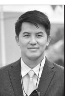
อธิรัฐ รัตนเศรษฐ

จากเหตุการณ์น้ำมันรั่วที่บริเวณทะเล จ.ระยอง เป็นรอบที่ 2 แล้วซ้ำอีก งานนี้ร้อนถึง “อธิรัฐ รัตนเศรษฐ” รมช.คมนาคม