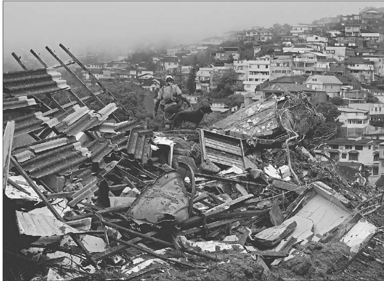
ดินถล่ม ● ทีมกู้ภัยของเจ้าหน้าที่ดับเพลิงบราซิลและสุนัขดมกลิ่น ค้นหาผู้รอดชีวิตจากซากบ้านเรือนในเมืองปโตรโปลิส เมื่อวันที่ 16 กุมภาพันธ์ หลังฝนตกหนักทำให้เกิดน้ำท่วมและดินถล่ม มีผู้เสียชีวิตอย่างน้อย 34 ศพ