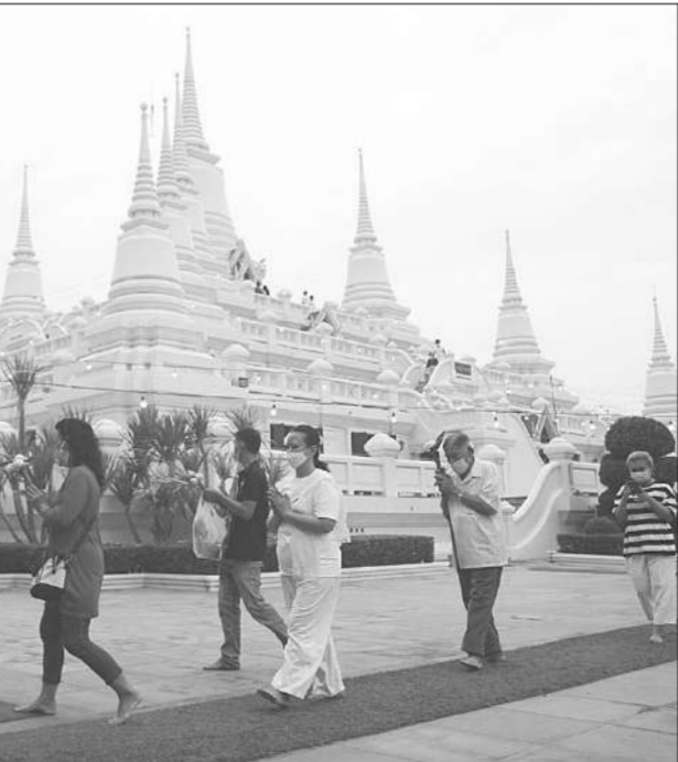
พุทธศาสนิกชนร่วมเวียนเทียนรอบพระพุทธรูปองค์ใหญ่ วัดโคกกราม จังหวัดสมุทรปราการ เนื่องในวันมาฆบูชา ประจำปี 2565

terim Assessment สหรัฐอเมริกาจัดทำเฉพาะ 45 ประเทศที่ถูกจัดอันดับในกลุ่มเทียร์ 2 เมื่อจับตามองในปี 2564 ในส่วนที่เกี่ยวข้องกับประเทศไทยนั้น มีประเด็นความก้าวหน้าที่ถูกหยิบยกขึ้นเป็นภาพรวม อาทิ การจัดตั้งศูนย์คัดแยกผู้เสียหายจากการค้ำมนุษย์ เพื่อช่วยเหลือให้ผู้ที่พิกังแก่ผู้ต้องเข้าข่ายเป็นผู้เสียหายจากการค้ำมนุษย์ ในระหว่างการจัดกรองเบื้องต้นจนถึงการคัดแยกเพื่อระบุตัวผู้เสียหายอย่างเป็นทางการ, การออกกฎกระทรวงแรงงานที่ใช้สัญญาณจ้างแรงงานต่างด้าว 3 สัญชาติ 4 ภาษา ได้แก่ ไทย, เมียนมา, กัมพูชา และลาว นอกจากนี้ ได้รับทราบความก้าวหน้าในการจัดตั้งศูนย์คัดแยกผู้เสียหายจากการค้ำมนุษย์ โดยได้มอบสำนักงานตรวจคนเข้าเมือง, สำนักงานตำรวจแห่งชาติ และกระทรวงแรงงานเป็นเจ้าภาพ ทั้งในด้านการปรับปรุงอาคารสถานที่ และระบบเครื่องมืออุปกรณ์สำหรับห้องซักถาม