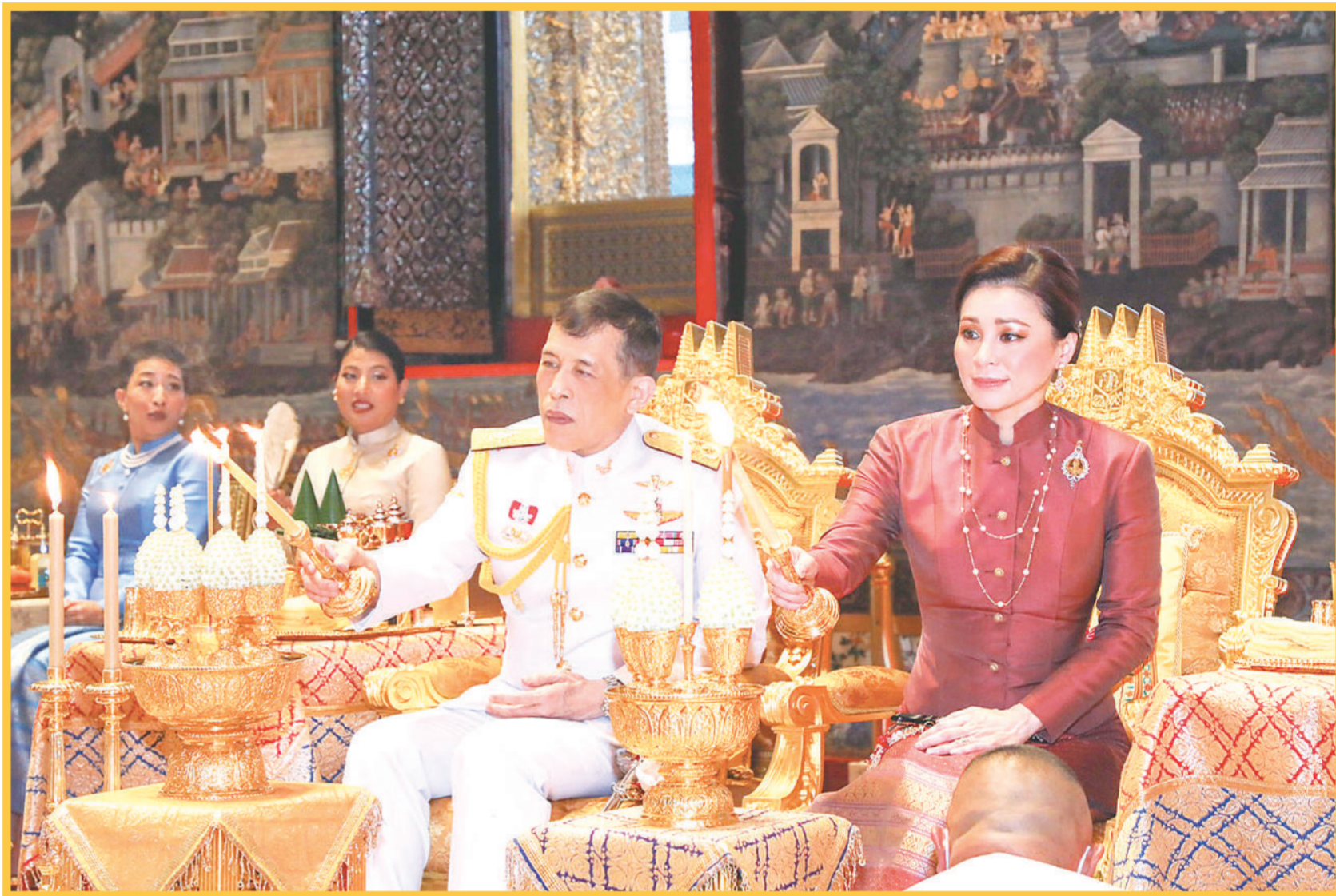
พระบาทสมเด็จพระเจ้าอยู่หัว และสมเด็จพระนางเจ้า พระบรมราชินี เสด็จฯ ทรงบำเพ็ญพระราชกุศลเนื่องในวันมาฆบูชา ณ พระอุโบสถวัดพระศรีรัตนศาสดาราม พระบรมมหาราชวัง ในโอกาสนี้ สมเด็จพระเจ้าลูกเธอ เจ้าฟ้าพัชรกิติยาภา นเรนทิราเทพยวดี กรมหลวงราชสาริณีสิริพัชร มหาวัชรราชธิดา และสมเด็จพระเจ้าลูกเธอ เจ้าฟ้าสิริวัณณวรี นารีรัตนราชกัญญา โดยเสด็จในการนี้ด้วย