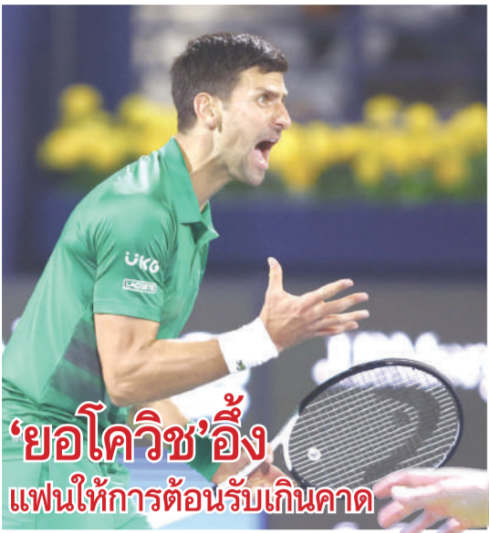
'ยอโควิช' อึ้ง แฟนให้การต้อนรับเกินคาด

ดูไบ ● โนวัก ยอโควิช นักเทนนิสหมายเลข 1 ของโลกจากเซอร์เบีย ยอมรับว่าได้รับการต้อนรับอย่างอบอุ่นเกินความคาดหมายในการแข่งขันที่ดูไบ ซึ่งเป็นการกลับมาลงแข่งขันอย่างเป็นทางการเป็นครั้งแรกนับตั้งแต่ถูกเนรเทศออกจากออสเตรเลีย