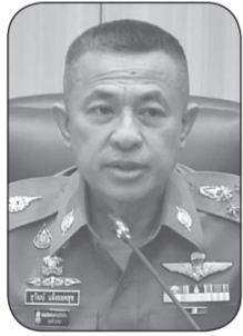
พล.ต.อ.สุวัฒน์ แจ้งยอดสุข