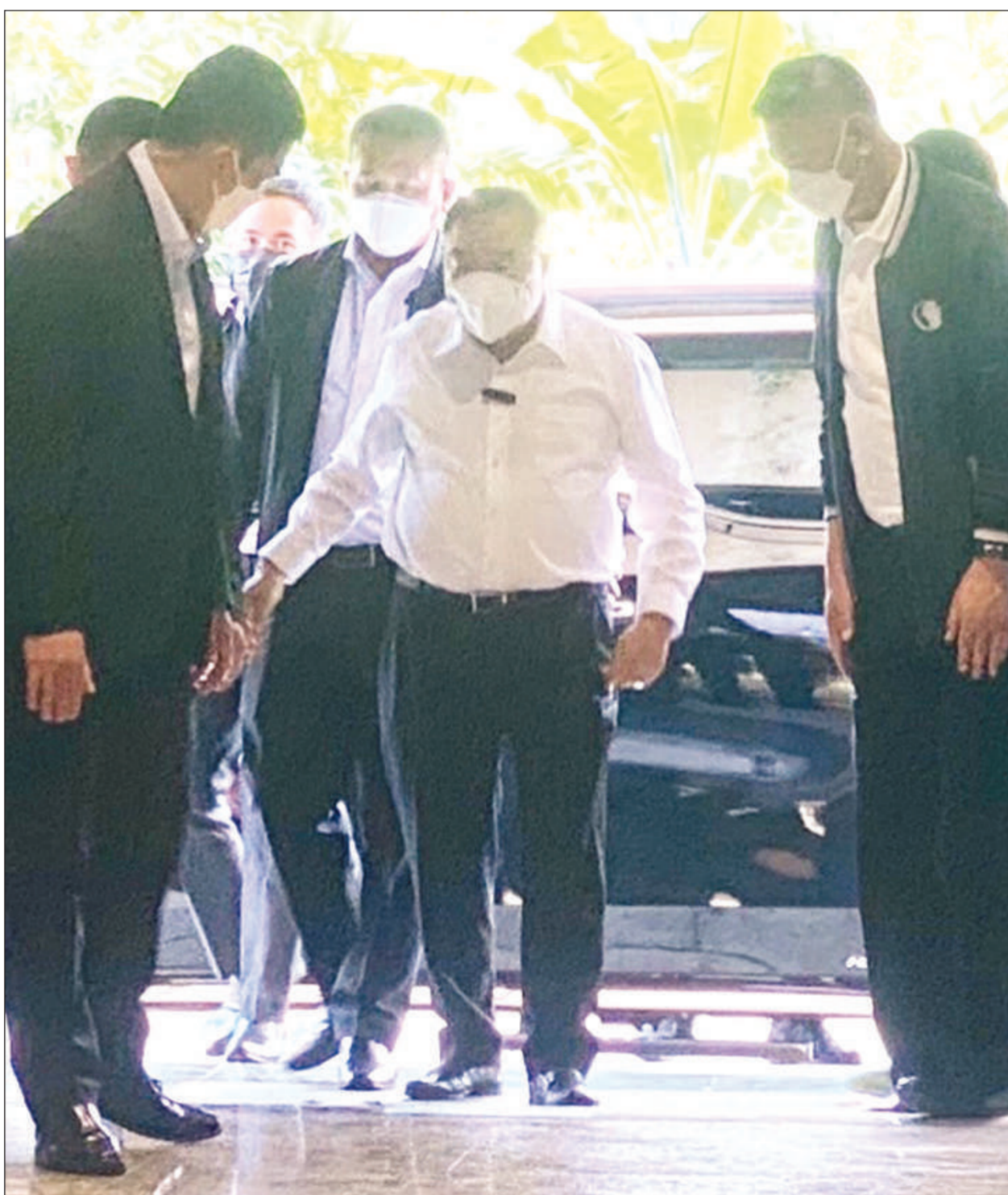
พล.อ.ประวิตร วงษ์สุวรรณ รองนายกรัฐมนตรี ในฐานะหัวหน้าพรรคพลังประชารัฐ เดินทางมาที่ทำการพรรคพลังประชารัฐ เพื่อเข้าร่วมประชุม ส.ส. ในขณะที่ช่วงเช้าได้ลาการประชุมคณะรัฐมนตรีเนื่องจากท้องเสีย โดยมีแกนนำ และ ส.ส. ร่วมต้อนรับ

โควิดพุ่ง! ครม. พวาโดนด่า ศบค. จ่อคลอดแผนรับมือ