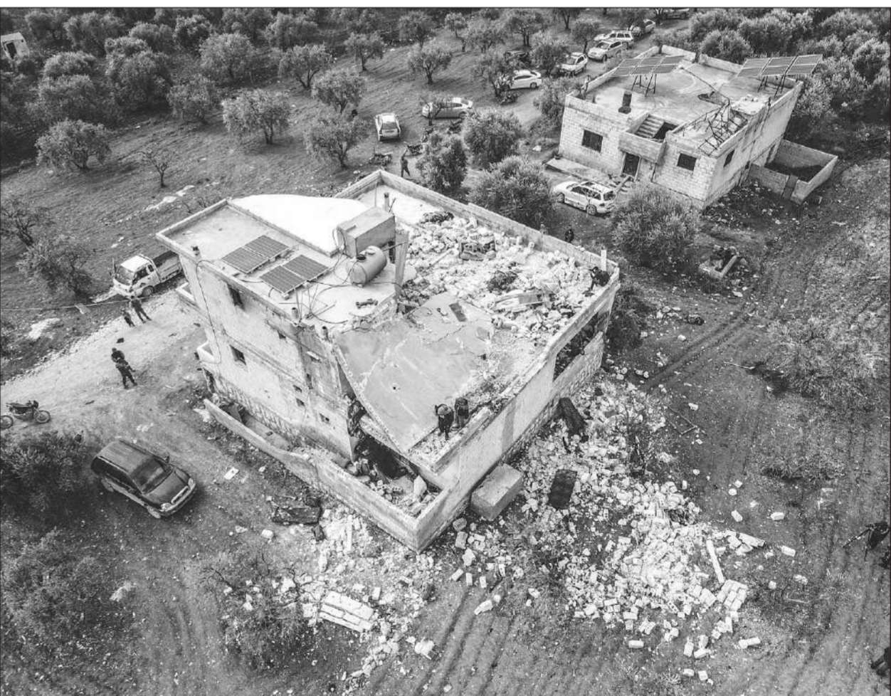
พริบรา ● ภาพถ่ายทางอากาศความเสียหายของอาคารในจังหวัดอิดลิบของซีเรียที่โดนหน่วยพิเศษของกองทัพสหรัฐโจมตีทางอากาศ เมื่อวันที่ 3 กุมภาพันธ์ เจ้าหน้าที่กู้ภัยซีเรียเผยมีผู้เสียชีวิตอย่างน้อย 13 ศพ ในจำนวนนี้เป็นเด็ก 6 คน และผู้หญิง 4 คน.

จอห์น เคอร์บี โฆษกเพนตากอน กล่าวว่า วัตถุประสงค์ของการเสริมกำลังทหารในยุโรปตะวันออกครั้งนี้เพื่อส่ง "สัญญาณที่หนักแน่น" ถึงปูติน และ "บอกต่อโลกตรงๆ ว่า นาโตมีความสำคัญต่อสหรัฐ และมีความสำคัญต่อพันธมิตรของเรา" เรารู้ว่าปูตินหงุดหงิดกับนาโต เกี่ยวกับเรื่องนี้ เราจึงทำให้ชัดเจนว่าเรากำลังเตรียมพร้อมที่จะปกป้องพันธมิตรของเรา นาโต หากถึงเวลา แต่หวังว่าจะไม่ถึงเวลานั้น เมื่อวันพุธ นายกรัฐมนตรีโอลาฟ โชลซ์ ของเยอรมนี ประกาศว่าเขาจะเดินทางไปกรุงมอสโกเพื่อหารือเกี่ยวกับวิกฤตนี้ ขณะที่ประธานาธิบดีเอมมานูเอล มาครง ของฝรั่งเศส เผยว่าเขาอาจเดินทางไปยังมอสโกเช่นกัน ขึ้นอยู่กับผลการเจรจาที่ผู้นำประเทศอื่น ๆ ที่กำลังเกิดขึ้น มาครงคุยโทรศัพท์กับไบเดนเมื่อวันพุธ โดยในช่วง 2 ชั่วโมงนั้นว่า จะเสนอต่อวิกฤตนี้ อย่างไรก็ตาม ประธานาธิบดี โอลาฟ โชลซ์ ของเยอรมนี ประกาศว่าเขาจะเดินทางไปกรุงมอสโกเพื่อหารือเกี่ยวกับวิกฤตนี้