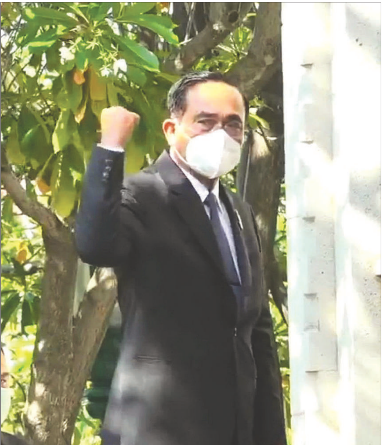
พล.อ.ประยุทธ์ จันทร์โอชา นายกรัฐมนตรี และ รว.ก.ลาโหม ชูกำปั้นมือขวาขึ้น ภายหลังผู้สื่อข่าวถามว่านายกา ยังสู้หรือไม่ โดยนายกา ท้าทายถามกลับว่าวันนี้วันอะไร และกล่าวต่อว่า “ทหารผ่านศึก” ก่อนเดินกลับขึ้นตึกไทยคู่ฟ้า ทำเนียบรัฐบาล เมื่อ วันที่ 3 ก.พ.

ไทยก็ปีใหม่ได้ตลอดอยู่แล้ว เพราะเรามีคน หลายเชื้อชาติในประเทศไทย” พล.อ.ประยุทธ์กล่าวถึงการเรียกร้อง ให้ยุบสภาว่า ติดตามสถานการณ์อย่างต่อเนื่อง เป็นเรื่องที่ต้องติดตามสถานการณ์ บริษัทยาหรือกับคนที่เกี่ยวข้องทุกคน เพราะ ฉะนั้นถ้าจะบอกว่าคุณกา ตัดสินใจเพียงผู้ เดียวมันต้องตัดสินใจบนพื้นฐานเอาข้อมูล ที่มีอยู่ตอนนี้ ยังไม่มีอะไร สิ่งสำคัญที่สุดใน วันนี้รัฐบาลต้องการทำงานให้ได้ อ่านต่อหน้า 15