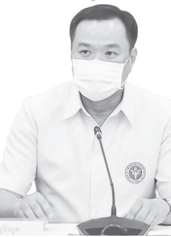
นายอนุทิน ชาญวีรกูล หัวหน้าพรรคภูมิใจไทย

"การเลือกตั้งสามารถเกิดขึ้นได้ตลอดเวลา ตั้งแต่ปีแรก หากมีอุบัติเหตุทางการเมืองใดๆ ก็ตาม และผู้ที่มิอำนาจในการยุบสภาคือ นายกรัฐมนตรีคนเดียว ดังนั้นเมื่อรวมวาระรัฐบาลเราก็คงต้องพยายามอย่าให้มีอุบัติเหตุทางการเมือง แต่ถ้าไปไม่ได้เราก็ต้องพร้อม ก็มีเท่านั้น".