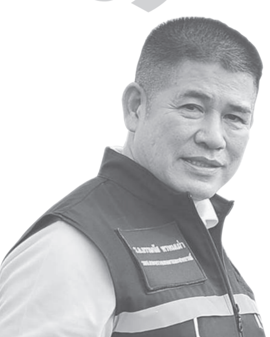
ร.อ.ธรรมนัส พรหมเผ่า อดีตนายกรัฐมนตรีพรรคพลังประชาชน

"ตามที่มีการแสวงหาพรรคที่จะร่วมรัฐบาล โดยขอต่อรองตำแหน่ง รว.ม.ท.ท.ไทยให้ พล.อ.ประวิตร วงษ์สุวรรณ รองนายกรัฐมนตรีและหัวหน้าพรรคพลังประชาชน ผมและกลุ่มหนึ่ง ส.ส.พรรคเศรษฐกิจไทย ขอเป็นพันธมิตรเดิม คือขอทำการเมืองอย่างสร้างสรรค์ โดยยึดผลประโยชน์ของประเทศไทยและพี่น้องประชาชนเป็นที่ตั้ง ดำรงไว้ซึ่งเสาหลักของบ้านของเมือง นั่นคือ ศาสน์ กษัตริย์"