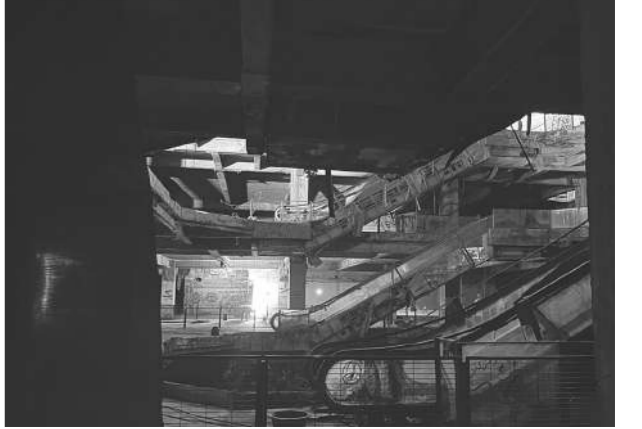
นิวเวสต์ โอเดอร์ทาวน์ ภาค 2 นิทรรศการออกแบบแสงและเสียง