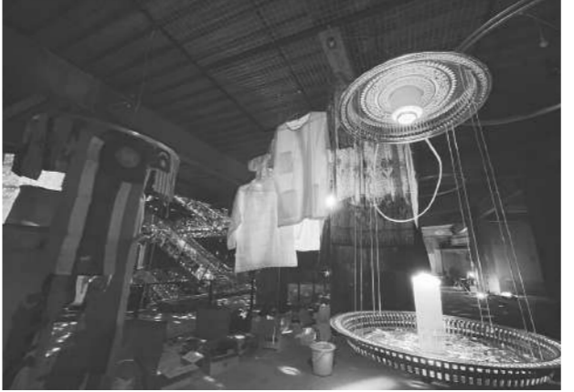
นิทรรศการปลุกชีวิตชีวาในห้างนิวเวสต์