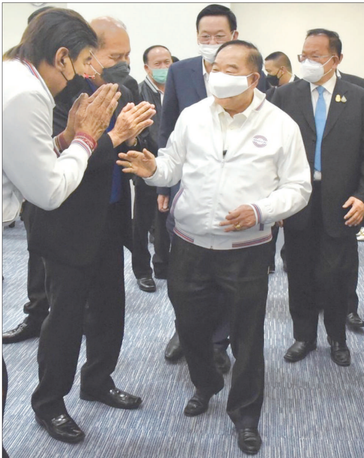
พล.อ.ประวิตร วงษ์สุวรรณ รองนายกรัฐมนตรี ในฐานะหัวหน้าพรรคพลังประชารัฐ (พปชร.) ขณะเดินทางเข้าร่วมเป็นประธานการประชุมพรรค พปชร. ท่ามกลางข่าวความขัดแย้งภายในพรรค เมื่อวันที่ 7 ก.พ.