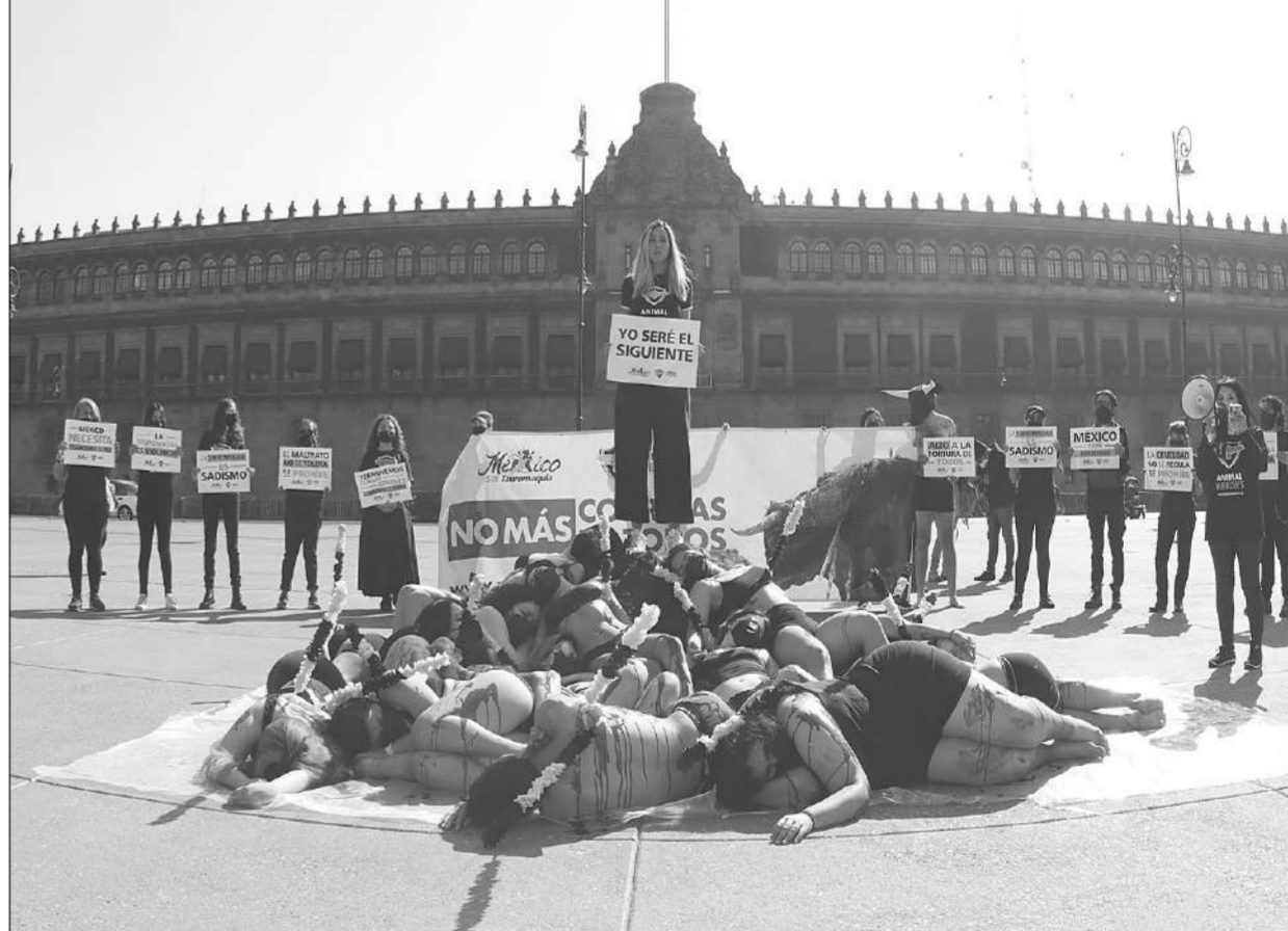
เบนส์วู้ ● โซเฟีย ซิลเนียกา ดาราเม็กซิกัน ถือป้ายที่เขียนเป็นภาษาสเปนว่า "ฉันจะเป็นคนต่อไป" ระหว่างรณรงค์ให้ยกเลิกการสู้วัวกระทิง หน้าทำเนียบรัฐบาล ในกรุงเม็กซิโกซิตี เมื่อวันที่ 6 กุมภาพันธ์.