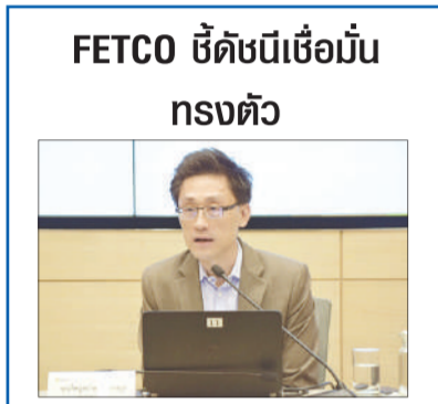
FETCO ซีอีโอขึ้นกรงตัว

ชู 'ป้อม' นั่งมท.1 แทน 'ป็อก' 'ตุ้ย-แป๊ะ' ขยับเคลื่อนรทสช.