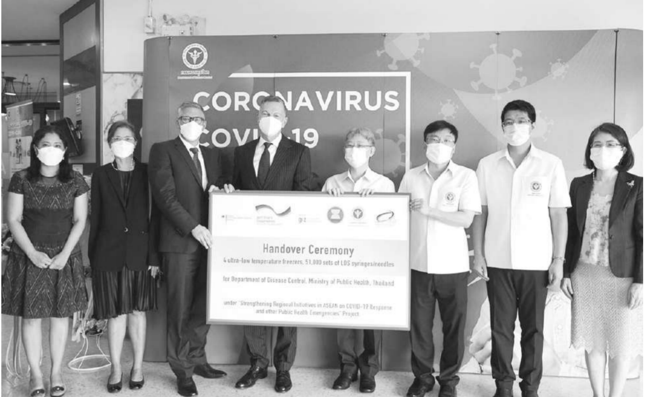
มอบตู้แช่ ● สทพ.นั้สธารณรัฐเยอรมนี องค์การความร่วมมือระหว่างประเทศของเยอรมัน (GIZ) ส่งมอบตู้แช่แข็งอุณหภูมิต่ำเพื่อจัดเก็บวัคซีนโควิด-19 พร้อมอุปกรณ์ทางการแพทย์ที่เกี่ยวข้องอย่างเป็นทางการแก่กระทรวงสาธารณสุข ณ กรมควบคุมโรค เพื่อเพิ่มแรงสนับสนุนการดำเนินงานกระจายวัคซีนในกลุ่มที่มีความเปราะบาง รวมถึงประชากรที่มีความเสี่ยงตามพื้นที่แนวชายแดนให้แก่หน่วยงานด้านสาธารณสุขของประเทศไทย.

ภาคแล้วอย่างชัดเจน ส่วน ครม.ก็ได้อนุมัติให้คณะกรรมการมีอำนาจดำเนินการได้อย่างสมบูรณ์เต็มที่ ตนจึงอยากใหทุกฝ่ายเตรียมพร้อมและศึกษาขั้นตอนวิธีการและกฎเกณฑ์ต่างๆ ให้เข้าใจ พร้อมร่วมกันพัฒนาและผลักดันให้หลักสูตรต่างๆ ใช้งานได้จริงในอนาคตอันใกล้ให้ได้