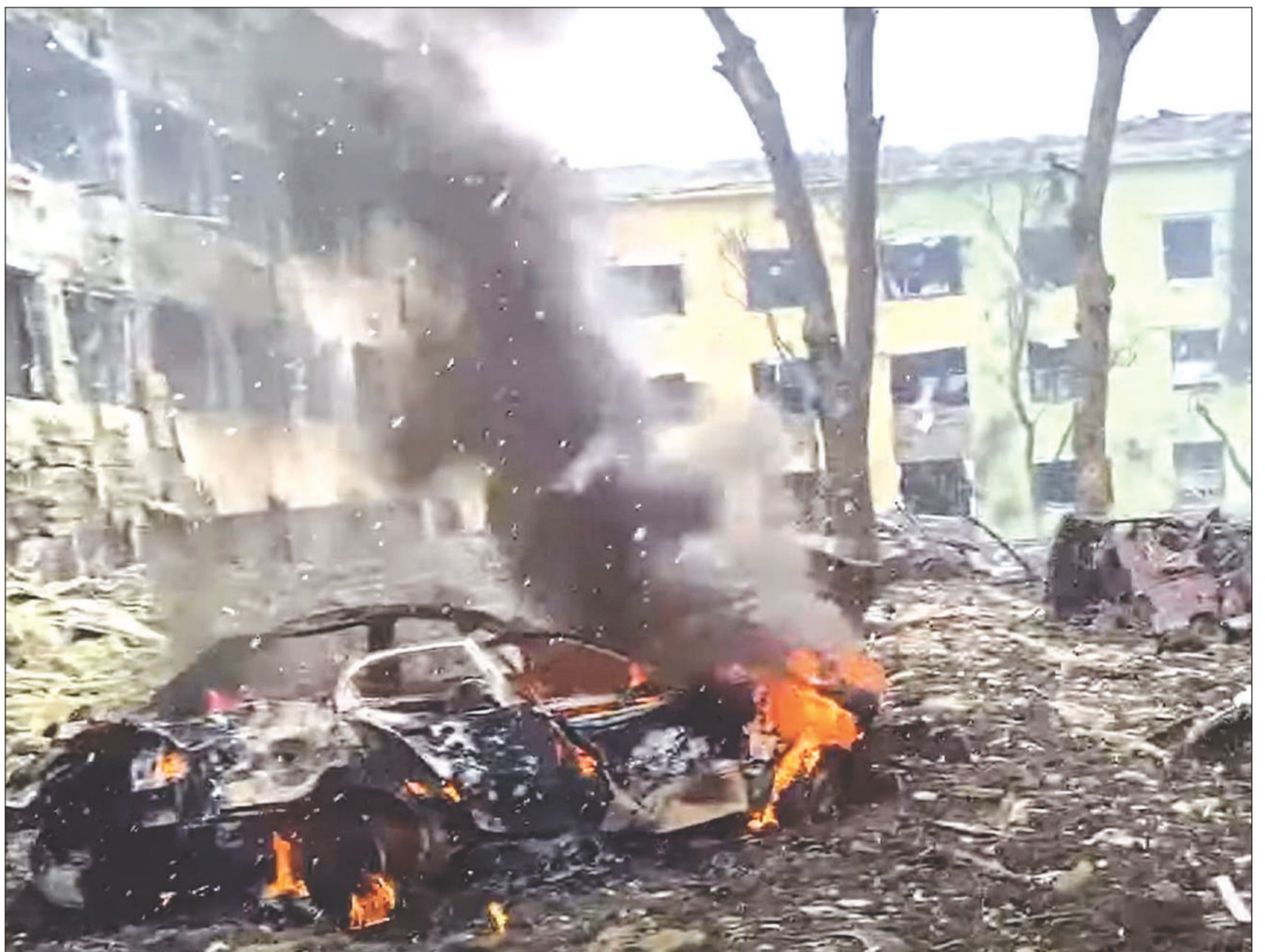
ภาพถ่ายหน้าจอบวิดีโอที่สำนักงานตำรวจแห่งชาติเผยแพร่วันที่ 9 มี.ค. 2565 เผยสภาพความเสียหายของอาคารโรงพยาบาลเด็กในเมืองมารีโพล และขากรยนต์และเศษซากปรักหักพัง หลังจากโดนรัสเซียโจมตีทางอากาศ