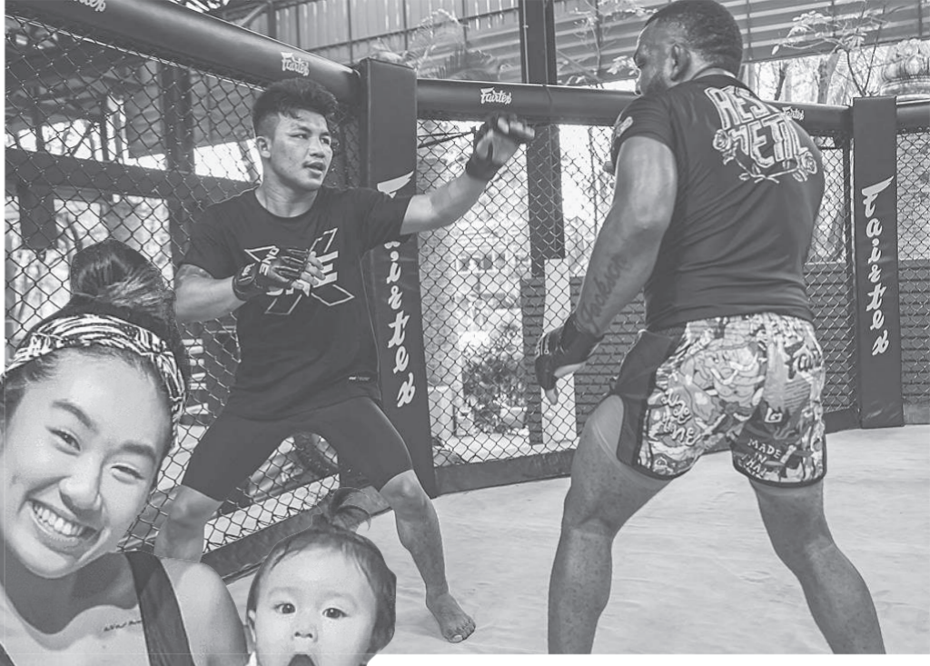
รดถึง จิตรเมืองนนท์