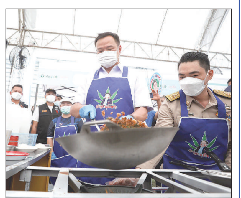
นายอนุทิน ชาญวีรกูล รองนายกรัฐมนตรี และรัฐมนตรีว่าการกระทรวงสาธารณสุข ผัดกะเพราหมกรอบโดยใช้กัญชาประกอบ ในระหว่างเป็นประธานเปิดการประชุมวิชาการทางการแพทย์ เขตสุขภาพที่ 5 ที่โรงเรียนราชประชานุเคราะห์ 45 อำเภอพนมทวน จ.กาญจนบุรี