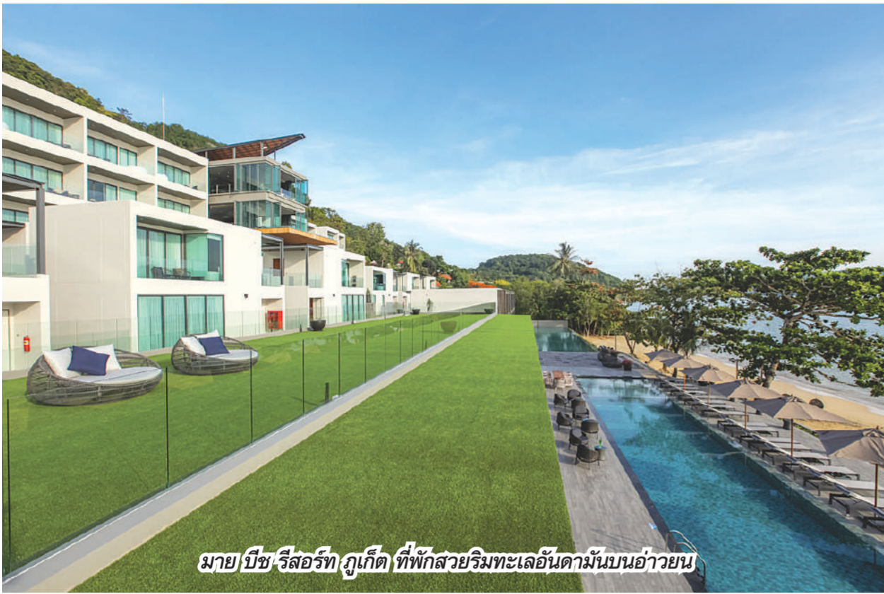
มาย บีช รีสอร์ท ภูเก็ต ที่พักรีสอร์ททะเลอันดามันบนอ่าวายน