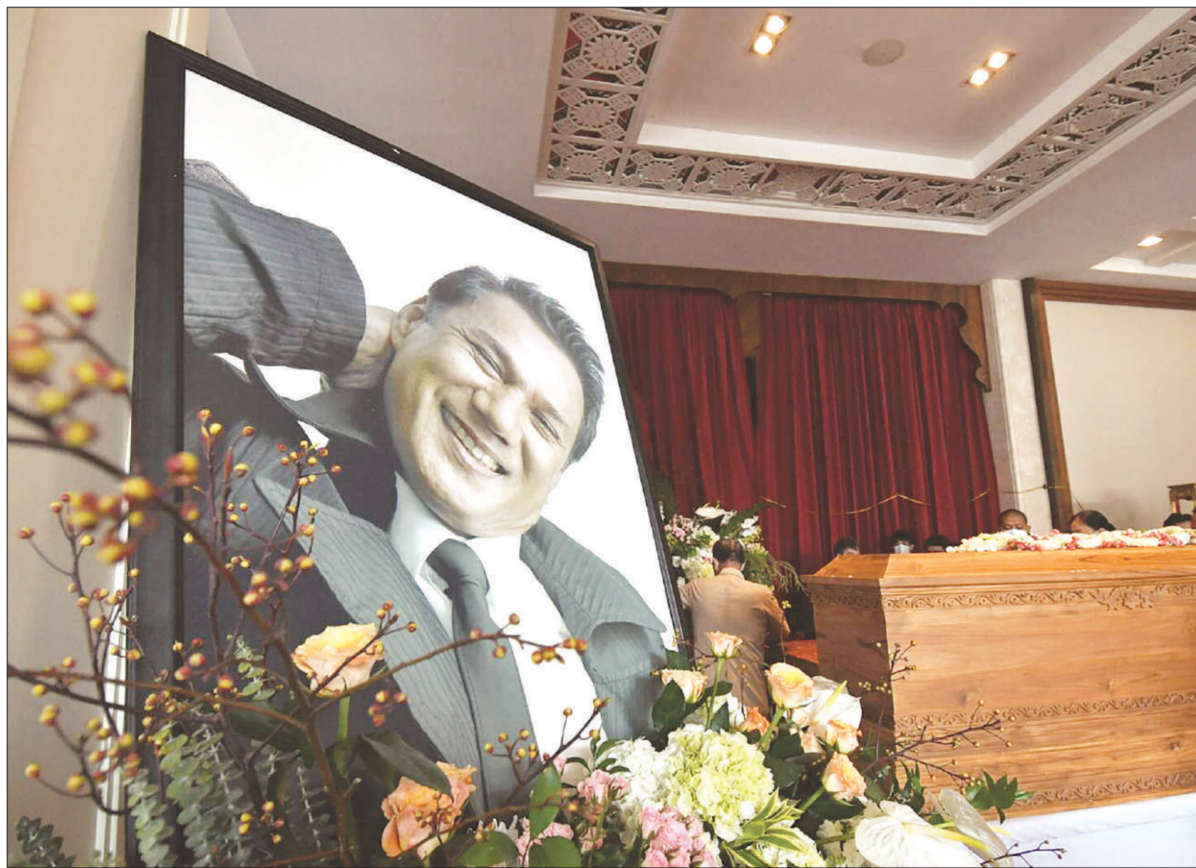
บรรยากาศก่อนพิธีพระราชทานน้ำหลวงอาบศพ และพิธีรดน้ำศพ นายกริ่งศักดิ์ เทียมเศวต หรือสรพงศ์ ชาตรี ศิลปินแห่งชาติ ที่ศาลากลางน้ำ ศาลา 11 วัดเทพศิรินทราวาสฯ เมื่อวันที่ 11 มีนาคม 2565

ไทยโพสต์ • รัฐบาลยอมรับชะตากรรมวิกฤตสงคราม “รัสเซีย-ยูเครน” ทำราคาน้ำมัน-ปุ๋ยพุ่งปรี๊ด “ประยุทธ์” เรียกกลลพพัฒนาพงษ์-ทีมที่ปรึกษาตัวจริง ช่วยเหลือประชาชนและรีบทำโดยเร็ว รว.พลังงานรับสต็อกเชลล์ได้ถึง พ.ค.เท่านั้น “ก๊าซหุงต้ม” สต็อกสั้น มี.ค.ปรับขึ้น กก.ละ 1 บาท ค่าไฟก็เอาไม่อยู่ พ.ค.ขยับตามต้นทุนที่พุ่งขึ้น อธิบดีกรมธุรกิจพลังงานชี้ไทยมีน้ำมันสำรองใช้ในสถานการณ์เลวร้ายที่สุด 66 วัน เล็งออกกฎให้เพิ่มสำรอง