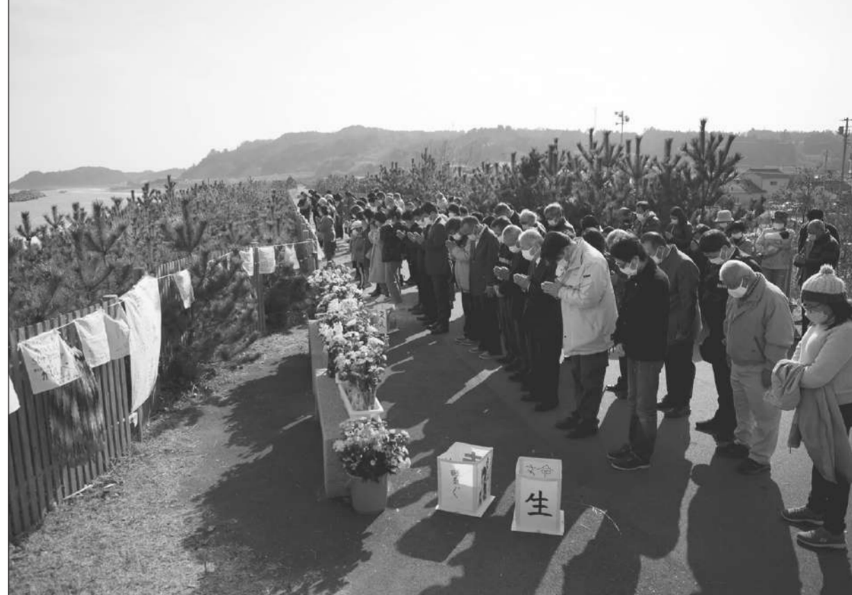
รำลึก 11 ปี ● ชาวญี่ปุ่นยืนสงบนิ่งไว้อาลัยต่อผู้เสียชีวิตจากเหตุแผ่นดินไหวและคลื่นสึนามิครบ 11 ปี ที่เมืองอิวากิ จังหวัดฟูกูชิมะ เมื่อวันที่ 11 มีนาคม.

กระทรวงกลาโหมสหรัฐฯ แถลงเมื่อวันพฤหัสบดีว่า จากการวิเคราะห์อย่างแม่นยำ การทดสอบขีปนาวุธล่าสุดทั้ง 2 ครั้งของเกาหลีเหนือเป็นการทดสอบขั้นเริ่มต้นก่อนการยิงทดสอบไอซีบีเอ็มพิสัยไกลเต็มรูปแบบ จอห์น เคอร์รี่ โฆษกกระทรวงกลาโหมสหรัฐฯ แถลงเมื่อวันพฤหัสบดีว่า เป้าหมายการทดสอบขีปนาวุธ 2 ครั้งที่ผ่านมาของเกาหลีเหนือเกี่ยวข้องกับระบบขีปนาวุธข้ามทวีปใหม่ที่ เกาหลีเหนือนำมาแสดงครั้งแรกในพิธีสวนสนามเมื่อเดือนตุลาคม 2563 แม้จะไม่ใช่ว่าเป็นการทดสอบยิงในพิธีของไอซีบีเอ็ม หรือประสิทธิ