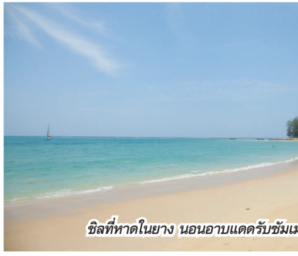
ชิลที่หาดในยาง นอนอาบแดดรับซัมเมอร์

เหนียวหนึบไปอย่างร้อนๆ หรือจะดื่มชา กาแฟกับขนมสดนานาชนิด ได้ฟีลอีกแบบ วันนี้เชฟตั้งใจเลือกซัพบอร์ดมาแล้ว กลับมาเช็กอินที่รีสอร์ท 2 เมนูจากปลา เมนูแรก ปลาย่างเครื่องเทศและเห็ดผัดในสไตล์เมดิเตอร์เรเนียนเรียบง่าย รวมน้ำจิ้ม อีกเมนูแบบอิตาเลียน สเต็กปลาทอดซอสไวน์ขาวมะเขือเทศโบโระพา แกรมเมตต์กับพาสต้าที่นำกินสดๆ จัดเป็นดินเนอร์ที่ห้องอาหารเทอร์เรซ กริลล์ พร้อมบรรยากาศริมทะเล เสิร์ฟพร้อมซีฟู้ดและกริลล์ด้วยวัตถุดิบท้องถิ่น เราเลิฟเลย เช้าวันใหม่เติมพลังมื้อเช้าด้วยไลน์อาหารเช้าครบครัน หรือถ้าใครอยากไปเสิร์ฟอาหารเช้าในสระน้ำส่วนตัวก็มี 3 แบบให้เลือก The Phuketian, The Cosmopolitan และ The