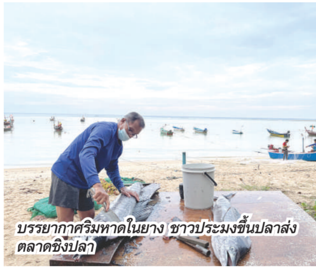
บรรยากาศริมหาดในยาง ชาวประมงขึ้นปลาสด ตลาดซิงปลา

จากนั้นเราเดินทางมาอีกที่พักรีสอร์ทแนวชิลธรรมชาติ เดวา ภูเก็ต รีสอร์ท แอนด์ วิลล่า ตั้งอยู่ใกล้จากสนามบินนานาชาติภูเก็ต เป็นจุดมุ่งหมายของใครหลายคน เน้นความรื่นรมย์ด้วยพรรณไม้นานา