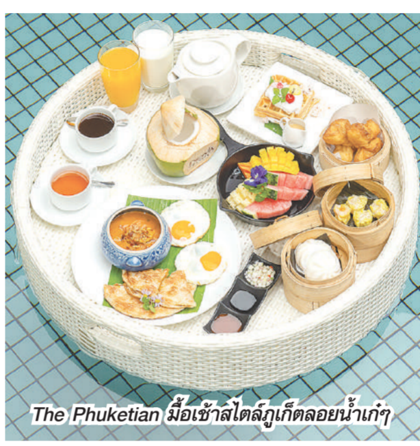
The Phuketian มื้อเช้าสไตล์ภูเก็ตลอยน้ำเก๋ๆ