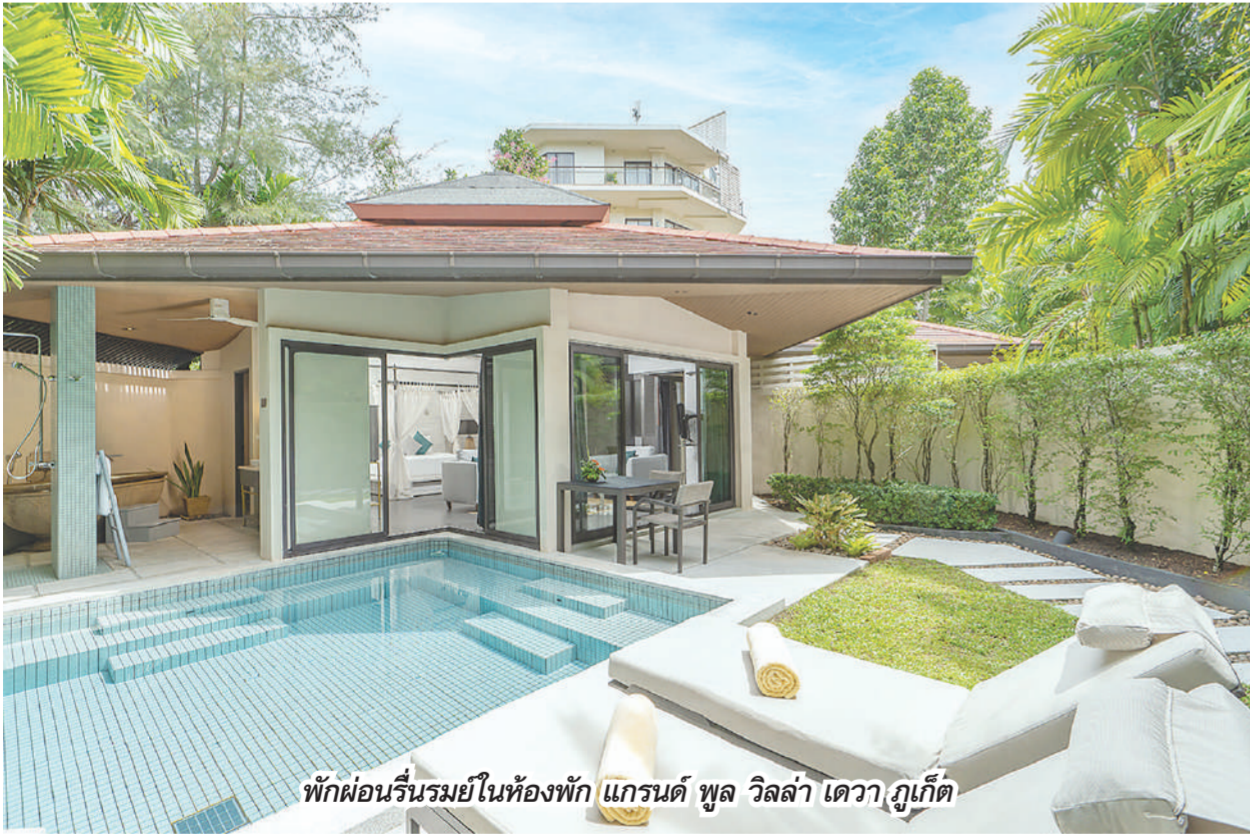
พักผ่อนรื่นรมย์ในห้องพัก แกรนด์ พูล วิลล่า เดวา ภูเก็ต

เหนียวหนึบไปอย่างร้อนๆ หรือจะดื่มชา กาแฟกับขนมสดนานาชนิด ได้ฟีลอีกแบบ วันนี้เชฟตั้งใจเลือกซัพบอร์ดมาแล้ว กลับมาเช็กอินที่รีสอร์ท 2 เมนูจากปลา เมนูแรก ปลาย่างเครื่องเทศและเห็ดผัดในสไตล์เมดิเตอร์เรเนียนเรียบง่าย รวมน้ำจิ้ม อีกเมนูแบบอิตาเลียน สเต็กปลาทอดซอสไวน์ขาวมะเขือเทศโบโระพา แกรมเมตต์กับพาสต้าที่นำกินสดๆ จัดเป็นดินเนอร์ที่ห้องอาหารเทอร์เรซ กริลล์ พร้อมบรรยากาศริมทะเล เสิร์ฟพร้อมซีฟู้ดและกริลล์ด้วยวัตถุดิบท้องถิ่น เราเลิฟเลย เช้าวันใหม่เติมพลังมื้อเช้าด้วยไลน์อาหารเช้าครบครัน หรือถ้าใครอยากไปเสิร์ฟอาหารเช้าในสระน้ำส่วนตัวก็มี 3 แบบให้เลือก The Phuketian, The Cosmopolitan และ The