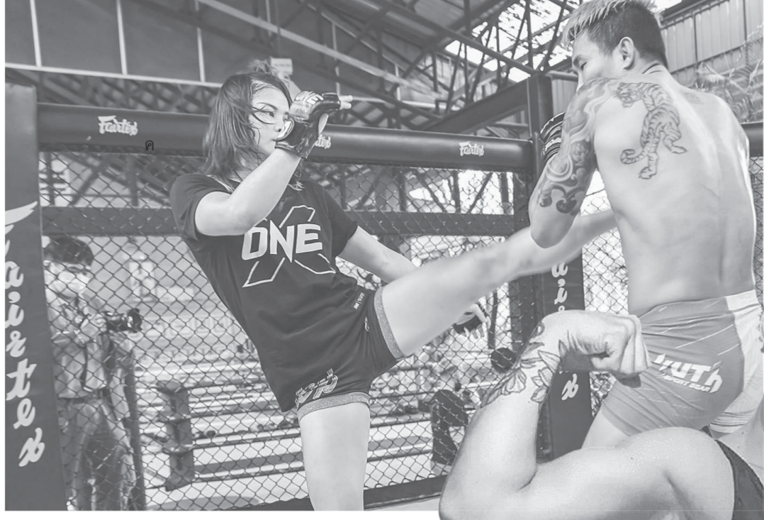
เสตมป์ แฟร์เท็กซ์