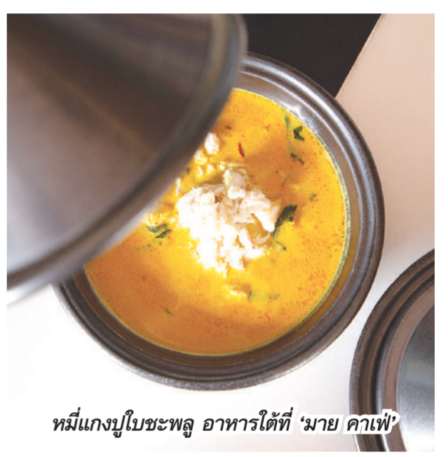
หมี่แกงปูใบชะพลู อาหารใต้ที่ 'มาย คาเฟ่'