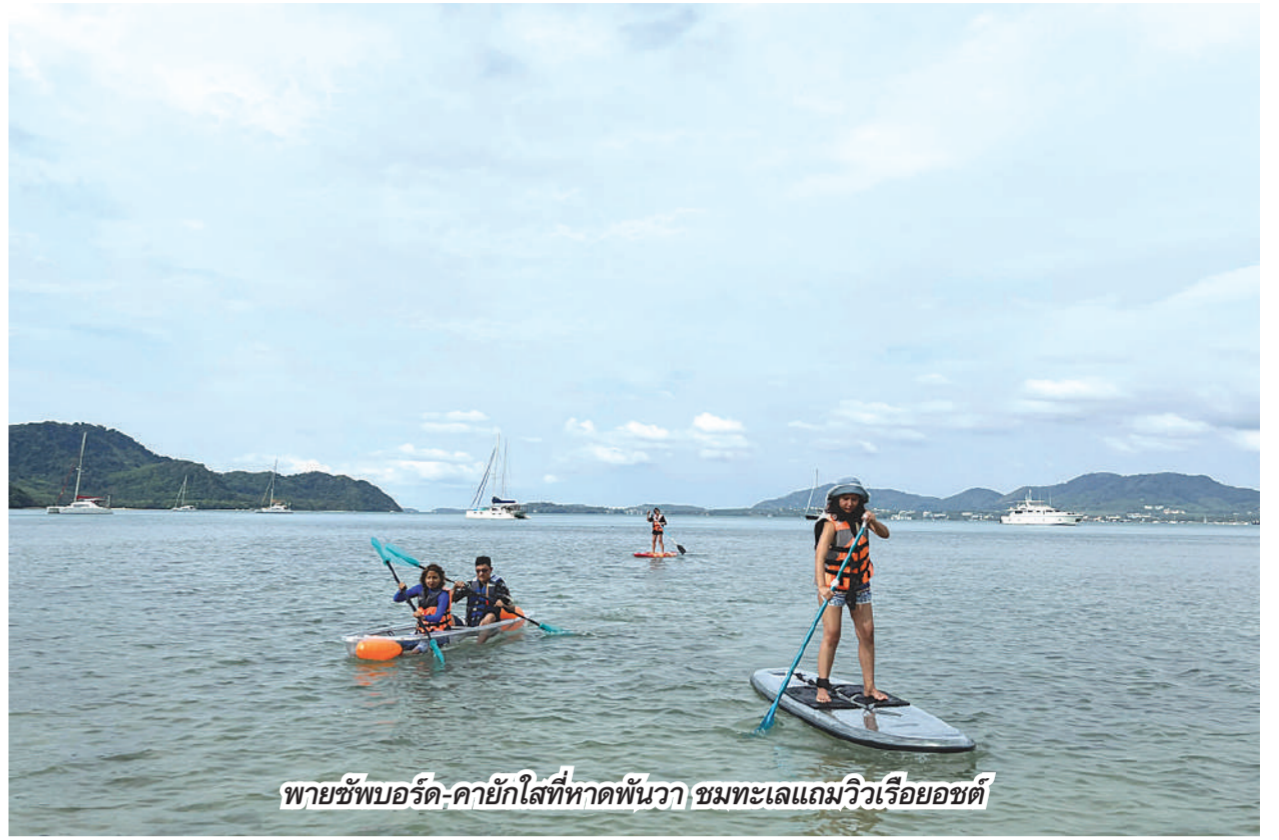
พายซัพบอร์ด-คายัคใสที่หาดพันวา ชมทะเลแถมวิวเรือยอชต์