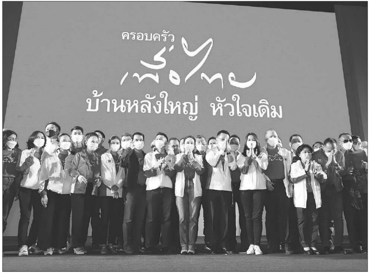
พรรคเพื่อไทยจัดงาน “ครอบครัวเพื่อไทย บ้านหลังใหญ่ หัวใจเดิม” ที่ศูนย์การประชุมและจัดแสดงสินค้านานาชาติ มลฑาทิพย์ฮอลล์ อ.เมือง จ.อุดรธานี พร้อมประกาศให้นางสาวแพทองธาร ชินวัตร บุตรสาวนายทักษิณ ชินวัตร เป็นหัวหน้าครอบครัวเพื่อไทย.