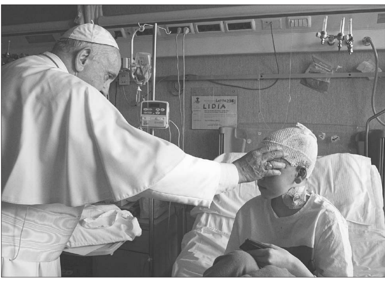
ไปเยี่ยมพระ • ขณะสมเด็จพระสันตปาปาฟรังซิสเยี่ยมพระเด็กชายยูเครนที่ได้รับบาดเจ็บจากสงครามในโรงพยาบาลแมมมีในเจนีวา ในกรุงโรม เมื่อวันที่ 19 มีนาคม

โซล • ยูน ซอกยอล ว่าที่ประธานาธิบดีเกาหลีใต้ที่เพิ่งชนะการเลือกตั้ง ประกาศเตรียมย้าย “บลูเฮาส์” ทำเนียบประธานาธิบดีปัจจุบันไปยังพื้นที่ของกระทรวงกลาโหม การย้ายทำเนียบต้องเสียค่าใช้จ่ายราว 1,364 ล้านบาท ประธานาธิบดียูน ซอกยอล แห่งเกาหลีใต้ เตรียมหลายประเด็นที่ท่ากษามานหลายศวรรษกล่าวว่า เขาจะย้ายทำเนียบประธานาธิบดีหรือ “บลูเฮาส์” ไปยังพื้นที่บริเวณกระทรวงกลาโหม จากรายงานของรอยเตอร์เมื่อวันที่ 20 มีนาคม 2565 ยูนซึ่งชนะการเลือกตั้งประธานาธิบดีอย่างถนัดเมื่อวันที่ 9 มีนาคมที่ผ่านมา ให้คำมั่นว่าจะย้ายทำเนียบไปอยู่ในสถานที่ที่เขาตั้งใจได้ภายในกรุงโซล ให้สาธารณชนได้เข้ามาใช้ประโยชน์ นอกจากนี้ยังกล่าวว่า เขาจะย้ายบ้านพักประจำตำแหน่งของเขาไปที่เขตช็อนนัม ซึ่งเป็นย่านที่พักอาศัยของนักธุรกิจและนักการทูตจำนวนมาก แผนการของเขาได้รับการตอบสนองที่หลากหลายจากชาวเกาหลีใต้ แม้แต่ผู้สนับสนุนก็ยังย้ำให้เขาให้ความสำคัญต่อความไม่สะดวกของผู้คนและบรรดาธุรกิจต่างๆ ที่อยู่ใกล้ทำเนียบใหม่ที่จะย้ายไป เนื่องจากถนนในกรุงโซลที่แออัดจะต้องปิดทุกวันระหว่างการเดินทางของประธานาธิบดี การย้ายทำเนียบทำให้เกิดการโต้เถียงอย่างรุนแรงในหมู่ผู้เชี่ยวชาญด้านอสังหาริมทรัพย์ หลังจากสมาชิกพรรคประชานิยมของยูนได้ยื่นข้อเสนองานวิจัยว่าอาคารใหม่หลังที่เขาได้รับอิทธิพลจากอาจารย์ด้านชินแสจากจีน ซึ่งมีความเชื่อเรื่องจิตวิญญาณ กระทรวงเศรษฐกิจและการคลังของเกาหลีใต้ประเมินว่าการย้ายทำเนียบประธานาธิบดีครั้งนี้จะมีค่าใช้จ่าย 49,600 ล้านบาท หรือราว 1,364 ล้านบาท รวมถึงการย้ายกระทรวงกลาโหมไปที่ใหม่ และการปรับปรุงสำนักงานใหม่และบ้านพักอาศัยอย่างเป็นทางการ.