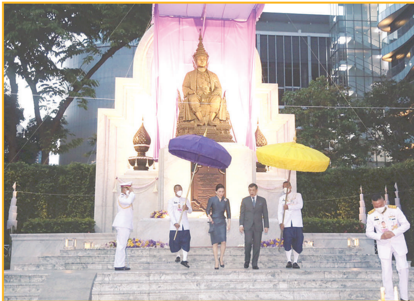
พระบาทสมเด็จพระเจ้าอยู่หัว และสมเด็จพระนางเจ้า พระบรมราชินี เสด็จพระราชดำเนินไปทรงเปิดพระบรมราชานุสาวรีย์พระบาทสมเด็จพระมงกุฎเกล้าเจ้าอยู่หัว ณ บริษัท ปูนซิเมนต์ไทย จำกัด (มหาชน) สำนักงานใหญ่ เขตบางซื่อ กรุงเทพมหานคร เมื่อวันที่ 20 มีนาคม 2565

บางซื่อ • ในหลวงและพระราชินีทรงเปิดพระบรมราชานุสาวรีย์ รัชกาลที่ 6 นับเป็นพระบรมรูปประทับบนพระราชบัลลังก์แห่งแรกของไทย