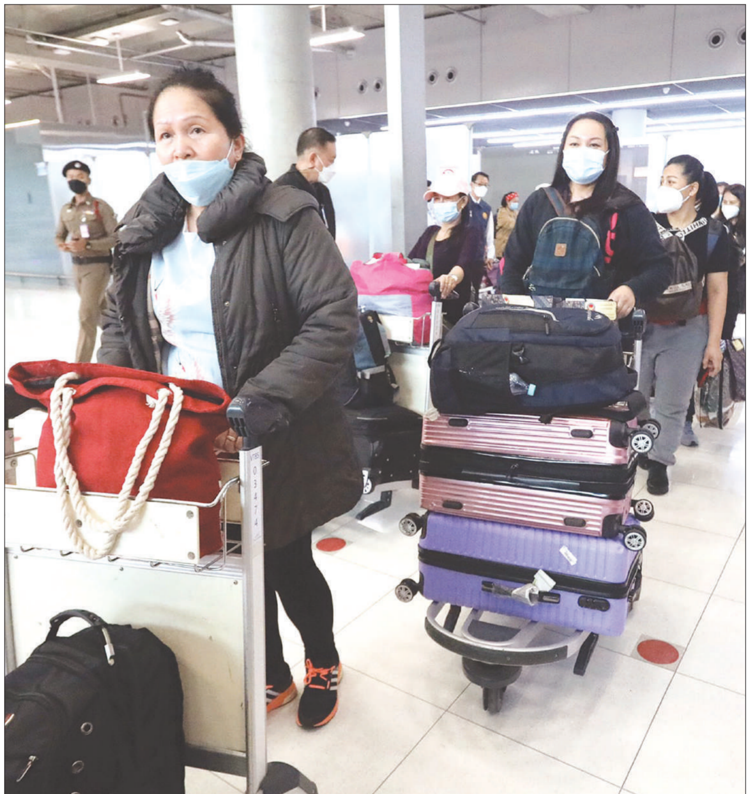
คนไทยที่อาศัยอยู่ในประเทศยูเครนจำนวน 38 คน เดินทางกลับถึงประเทศไทยชุดแรก ด้วยสายการบินไทย เที่ยวบินที่ TG 923 ถึงท่าอากาศยานสุวรรณภูมิ เวลา 06.25 น. โดยได้รับการช่วยเหลือจากสถานเอกอัครราชทูตไทย ณ กรุงวอร์ซอ

กรุงเทพฯ ● สัญญาณเริ่มชัด ลูกโหน้ลุยการเมืองแน่ “ผู้ชิง-แพทองธาร” ลูกสาวเจ้าของพรรคเพื่อไทยสอน พท. สร้างนวัตกรรมทางการเมือง “ลาอิต” ลั่นเดินหน้าเร่งพิจารณาแก้ กม.ลูก 2 ฉบับ ดับเสียงวิจารณ์ รบ.คิดเตงถ่วง จอคิดออกฟเลือกตั้งผู้ว่าฯ กทม.-พัทยา มท.พร้อมขง ครม.ไฟเขียวลปคทาหน้า นายลาอิต บิดเตเซะ รัฐมนตรีช่วยว่าการกระทรวงสาธารณสุข และรองหัวหน้าพรรคประชาธิปัตย์ ในฐานะประธานคณะกรรมการวิสามัญพิจารณาร่างพระราชบัญญัติประกอบรัฐธรรมนูญว่าด้วยการเลือกตั้ง ส.ส. และร่างพระราชบัญญัติประกอบรัฐธรรมนูญว่าด้วยพรรคการเมืองของรัฐบาล ให้สัมภาษณ์ “สำนักข่าวไทย” โดยย้ำว่า จะเร่งพิจารณาร่างพระราชบัญญัติทั้ง 2 ฉบับให้เสร็จภายในช่วงปิดสมัยประชุม โดยมีเวลาประมาณ 2 เดือน จะพิจารณาร่างพระราชบัญญัติประกอบรัฐธรรมนูญว่าด้วยการเลือกตั้ง ส.ส.ในวันพุธ และร่างพระราชบัญญัติประกอบรัฐธรรมนูญว่าด้วยพรรคการเมืองในวันพฤหัสบดี ซึ่งจะเริ่มในสัปดาห์หน้า นายลาอิตกล่าวว่าจะนำร่าง พ.ร.บ.ทั้ง 2 ฉบับเข้าการประชุมของทั้งประชุมร่วมรัฐสภาในสมัยประชุมหน้าทันทีหลังวันที่ 22 พฤษภาคม หรือหากเสร็จเร็วจะประสานประธานรัฐสภาเพื่อขอเปิดสมัยประชุมวิสามัญพิจารณาให้เสร็จโดยเร็ว เพื่อป้องกันข้อครหาว่ารัฐบาลเตงถ่วงเพราะต้องการอยู่ในตำแหน่งนานๆ ทั้งนี้ ยังไม่มีนโยบายอะไรมารจากรัฐบาล และยืนยันว่า อ่านต่อหน้า 16