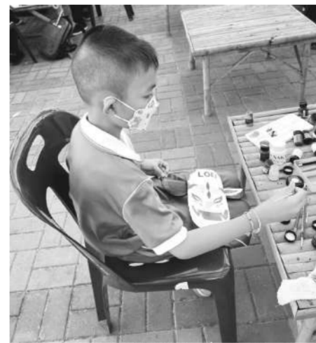
ศิลปินตัวจิ๋วสนุกกับการเพนต์หน้ากา

ศิลปวัฒนธรรมในจังหวัดเลย แล้ว ยังมีนิทรรศการหน้ากาศี นานาชาติจาก 5 ประเทศ ได้แก่ สิงคโปร์ อินโดนีเซีย ลาว กัมพูชา และญี่ปุ่น แต่ละประเทศล้วนมีวัฒนธรรมการแสดง หน้ากา มืองค์ความรู้ ในการสร้างสรรค์หน้ากา ทั้งวัสดุและฝีมือเชิงช่างที่น่าสนใจ เทศกาลผลงานศิลปะครั้งใหญ่ที่เชียงคานยังร่วมต้อนรับปีชาลทรงพลัง ขวมนม และสร้างสรรค์หน้ากาเสื่อผีตุงเต่าที่ทำจากวัสดุ น้ำเต้าของเรือ สำหรับ ผีตุงเต่า เป็นหน้ากักยักษ์ที่ทำจากน้ำเต้า ชาวเขนอนุยนันท์หรือตุง ซึ่งเป็นประเพณีการทำรูปของชาวบ้านไฮตาก ตำบลลาด