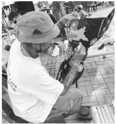
เปิดพื้นที่ไฮโซเดี่ยวรังสรรค์หน้าการร่วมสมัย

VARIETY เมืองท่องเที่ยวเชิงสุขภาพและวัฒนธรรมประเพณี เพราะเลยมีต้นทุนทางวัฒนธรรมที่สืบทอดมายาวนานกว่า 700 ปี และมีภูมิอากาศที่สวยงามเอื้ออำนวยต่อการท่องเที่ยวเป็นอย่างดี สำหรับโครงการเทศกาลศิลปะร่วมสมัยลุ่มแม่น้ำโขงที่จังหวัดเลยประจำปีงบประมาณ 2565 ประกอบด้วยกิจกรรมสวมหน้ากาก ยลงานศิลป์ เชิดอินทรีมโหง Mask Festival 2022 นักท่องเที่ยวจะได้ชมขบวนพาเหรดหน้ากา The Carnival Mask of Loi ประกอบด้วยหน้ากากผีตุงเต่า หน้ากากผีขนน้ำ หน้ากากผีตาโขน และหน้ากากแฟนซีจากสวนราชการและหน้ากักนานาชาติที่งดงามตระการตา และยังมีการแสดงผลงานจากการประกวดศิลปะร่วมสมัยของเยาวชน เทศกาลหน้ากา “Mask Festival” การสาธิตและจำหน่ายผลิตภัณฑ์ทางวัฒนธรรม (CPOT / CCOT) กิจกรรมถนนสายศิลปะ (Street Art at loei) ซึ่งจะปลูกเชิงคุณค่าให้มีสีสันและเป็นการแสดงออกถึงความคิดสร้างสรรค์ผ่านการวาดระบายสีหน้ากากใส่ลวดหน้า ป้องกันโควิด FACE SHIELD ที่เชื่อมโยงถึงการปรับตัวอยู่กับไวรัสตามวิถีชีวิตอันกลมกลืน เป็นช่วงเวลาที่เราทุกคนต้องผ่านวิกฤตนี้ไปได้ งานศิลปะที่สร้างสรรค์สวยงามจึงมีการจำหน่าย FACE SHIELD เพื่อเป็นทุนการศึกษาแก่เยาวชนที่ร่วมกิจกรรม ภายในงานมีไฮไลต์นิทรรศการหน้ากานานาชาติจากมหาวิทยาลัยราชภัฏในภาคตะวันออกเฉียงเหนือ 11 แห่ง สะท้อนถึงการเปิดโอกาสให้สถาบันการศึกษาในพื้นที่มีส่วนร่วมขับเคลื่อน