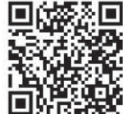
รายละเอียดฉบับเต็ม

**เฉพาะกรณีเลือกดอกเบี้ย Re-Finance 100 ฟรีจดจำนองสำหรับวงเงินสินเชื่อคงเหลือตั้งแต่ 1.00 ลบ. ขึ้นไป