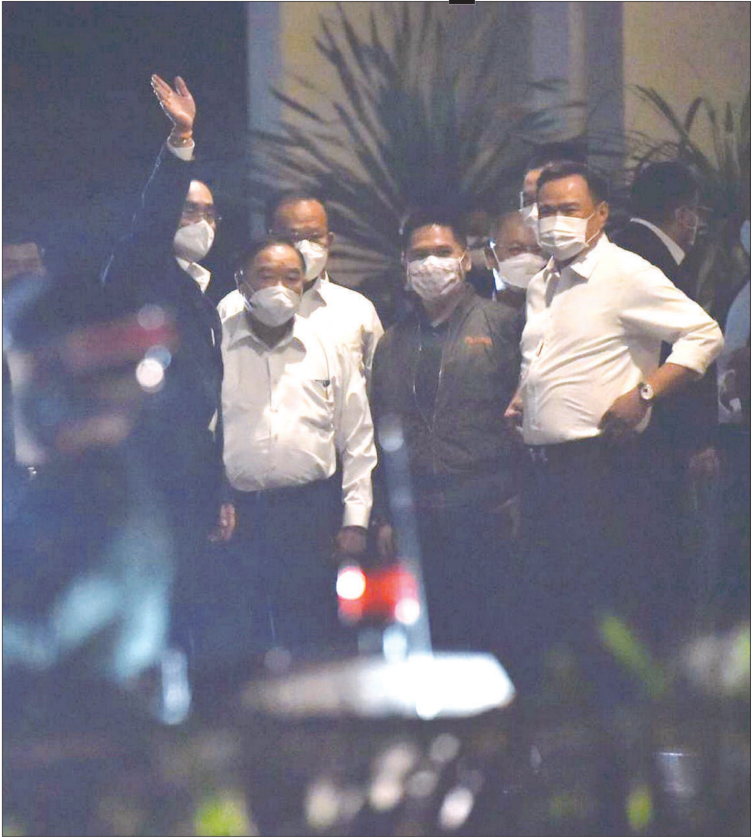
พล.อ.ประยุทธ์ จันทร์โอชา นายกรัฐมนตรี และ รมว.กลาโหม จัดงานเลี้ยง หัวหน้าพรรคและ เลขาธิการพรรค ร่วมรัฐบาล ที่ อยู่ในคณะรัฐมนตรี ในช่วงเย็น วันอังคารที่ 8 มี.ค. ที่สโมสรราชพฤกษ์ ถนนวิภาวดีรังสิต

‘บิ๊กตู’ เจ้าภาพพรรคร่วม พท.ตีปีบซึกฟอกนายกฯ