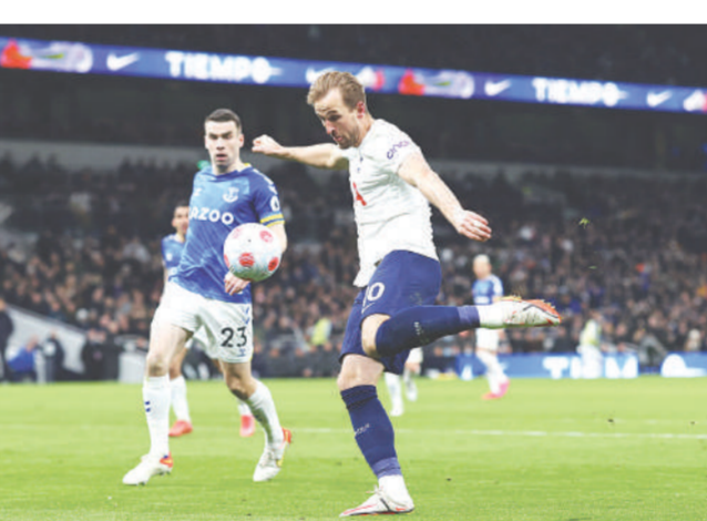
ไมเคิล ● แฮร์รี่ เคน (ขวา) จ้างเข้าเตรียมชุดประจักษ์ท้ายพา "โกเดียทอง" ที่อดแนม ฮอตสเปอร์ เปิดบ้านถล่มเอฟเวอร์ตัน 5-0 ในศึกฟุตบอลพรีเมียร์ลีกที่สนามที่อดแนม ฮอตสเปอร์ สเตเดียม ในลอนดอน ประเทศอังกฤษ

"แน่นอนว่าเรายังพัฒนาได้อีก และยังสามารถพัฒนาได้อีกและจะลดด้วย แต่ตอนนี้ผมบอกนักเตะไปว่า เราเริ่มอยู่ในระดับที่ดีแล้ว และตอนนี้เราต้องรับผิดชอบ เราต้องทำให้ดีที่สุดเพื่อแข่งท็อป 4 กับยูไนเต็ด อาร์เซนอล เวสต์แฮม และทีมอื่น" คอนเตกล่าว