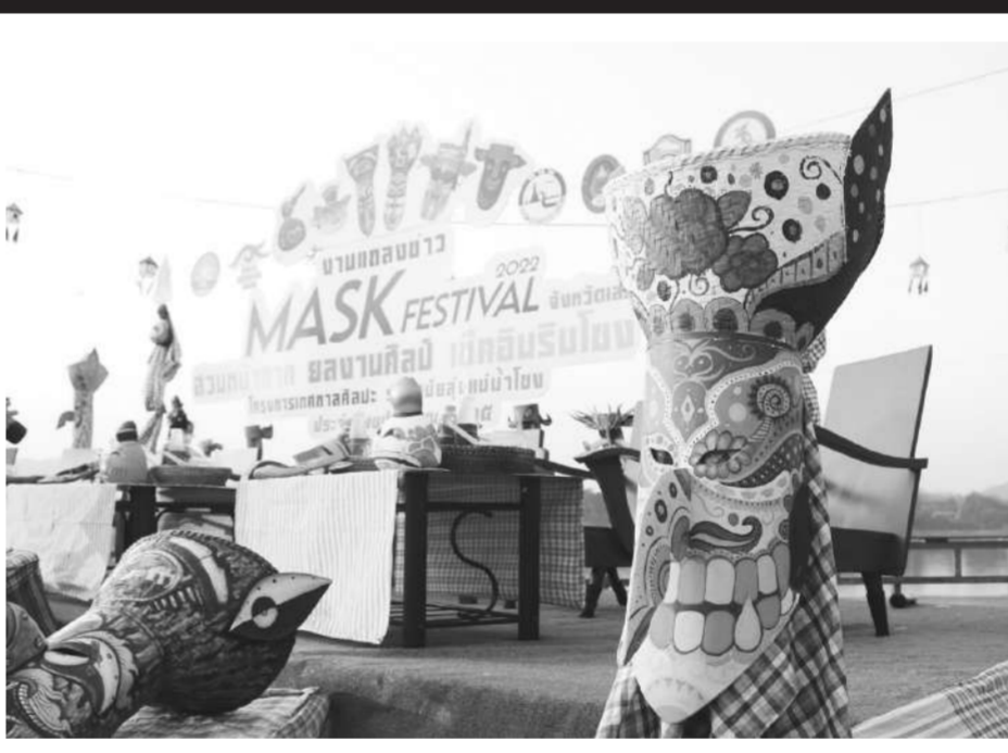
ผลงานศิลปะหน้ากากผีตาโขนใน 'MASK Festival 2022'

จังหวัดเลยขับเคลื่อนด้วยพลังศิลปวัฒนธรรมร่วมสมัย โดยร่วมกับกระทรวงวัฒนธรรม (วธ.) และภาคประชาสังคมร่วมสร้างการท่องเที่ยวทางวัฒนธรรมอย่างยั่งยืน เปิดพื้นที่จัดงาน “MASK Festival 2022 สวมหน้ากาก ยลงานศิลป์ เชิดอินทรีมโหง” วันที่ 11-13 มีนาคม 2565 ณ ลานวัฒนธรรมริมแม่น้ำโขง ตำบลเชียงคาน อำเภอเชียงคาน จังหวัดเลย นำหน้ากาประดิษฐ์ซึ่งอยู่ในงานประเพณีบุญหลวง และการละเล่นผีตาโขน จ.เลย อันงดงามและโด่งดังไปทั่วโลกมาพัฒนาต่อยอดเป็นงานทางวัฒนธรรมและสร้างความตระหนักในคุณค่าของภูมิปัญญาท้องถิ่น ตลอดจนส่งเสริมความร่วมมือในการแลกเปลี่ยนศิลปวัฒนธรรมเชื่อมโยงกับประเทศลุ่มน้ำโขง ซึ่งการท่องเที่ยวแห่งประเทศไทย (ททท.) นำกิจกรรม MASK FESTIVAL 2022 ลงในปฏิทินของการท่องเที่ยวแห่งประเทศไทยอีกด้วย จังหวัดเลยมีความพร้อมขับเคลื่อนการท่องเที่ยวจังหวัดเลยอย่างยั่งยืน มีวิสัยทัศน์จังหวัดเป็น