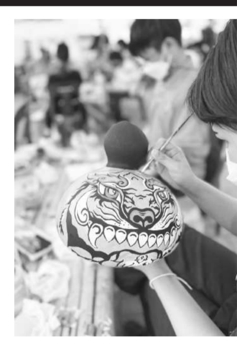
คนรุ่นใหม่ร่วมสร้างสรรค์หน้ากากผีตาโขน