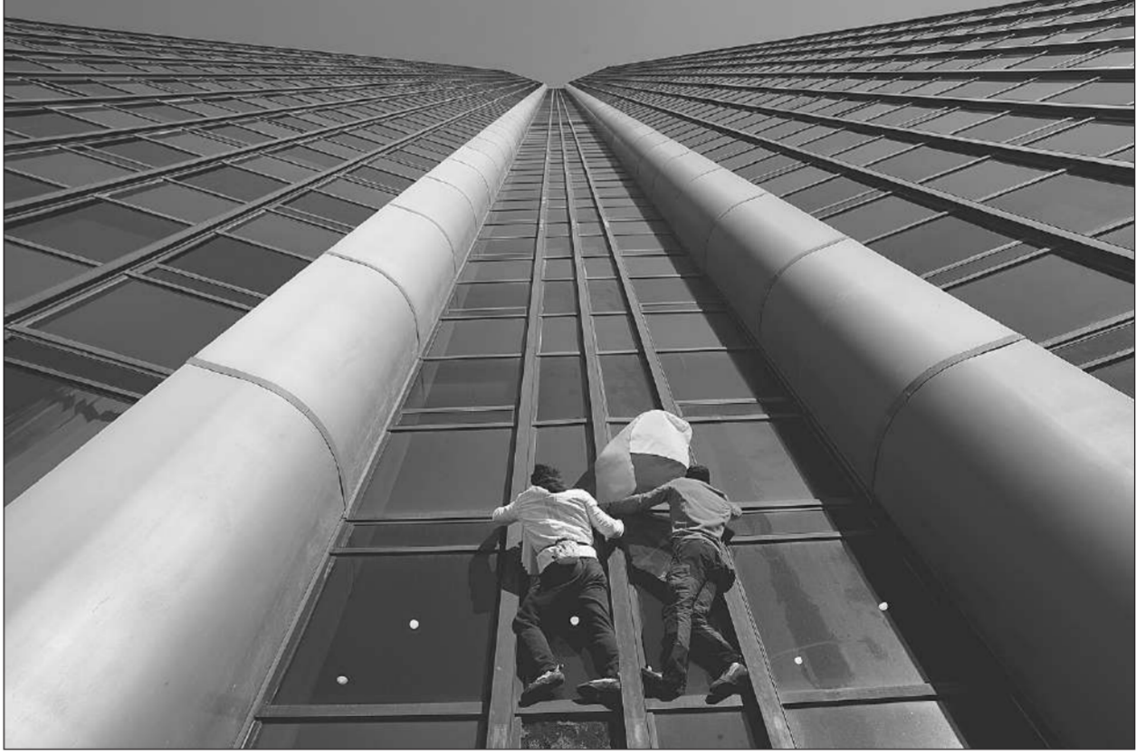
เที่ยวยูเครน • ชาวฝรั่งเศส 2 คนปีนอาคารสูง มงต์ปาร์นาส อาคารสูงที่สุดในกรุงปารีสด้วยมือเปล่า เมื่อวันที่ 7 มีนาคม โดยนำธงชาติยูเครนไปผูกบนยอดตึกเพื่อแสดงความเห็นหนึ่งเดียวกับชาวยูเครน

เหลียงกล่าวด้วยว่า ยุทธศาสตร์จัดการกับการระบาดของไวรัสโคโรนาเป็นศูนย์ (dynamic zero) ไม่ได้หมายความว่าไม่มีผู้ติดเชื้อเลย ในขณะที่มีการระบาดของโควิด-19 สูงมาก อ่องกงควรจะทำอย่างดีที่สุดเพื่อลดจำนวนผู้ติดเชื้อและมีมาตรการป้องกันไม่ให้เกิดการแพร่เชื้อต่อไปในอนาคต ปัจจุบันฮ่องกงมีผู้ติดเชื้อโควิด-19 พุ่งสูงทำลายสถิติ โดยผู้ติดเชื้อสะสมราว 500,000 ราย และผู้ติดเชื้อที่เสียชีวิตมากกว่า 2,200 ราย ส่วนใหญ่เสียชีวิตในช่วง 2 สัปดาห์ที่ผ่านมา เมื่อวันจันทร์อ่องกงมีรายวันผู้ติดเชื้อรายใหม่ 25,150 ราย และผู้ติดเชื้อเสียชีวิต 280 คน การระบาดส่วนใหญ่เกิดขึ้นในบ้านพัก