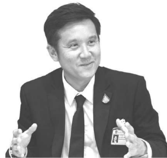
นายชัยวุฒิ ธนาคมานุสรณ์รมว.ดีอีเอส ในฐานะรองหัวหน้าพรรค พท.พร.

หมัดเด็ดไม่ถนัดแล้ว เพราะรัฐบาลไม่ได้ทำอะไรที่ผิดพลาดหรือเสียหาย ตอนนี้มีแต่ข่าวที่รัฐบาลแก้ปัญหาได้หลายเรื่องลุล่วงไปหมดแล้ว ไม่ว่าจะเป็นเรื่องโควิด-19 หรือเรื่องการเปิดประเทศที่ตอนนี้เริ่มเปิดและนักท่องเที่ยวเข้ามา เศรษฐกิจก็เริ่มฟื้น จึงคิดว่าไม่มากแล้ว ส่วนในเรื่องของการทุจริตคอร์รัปชันไม่ได้มีประเด็นอะไรที่รัฐบาลทำเสียหายเท่าที่สมควรได้อยู่