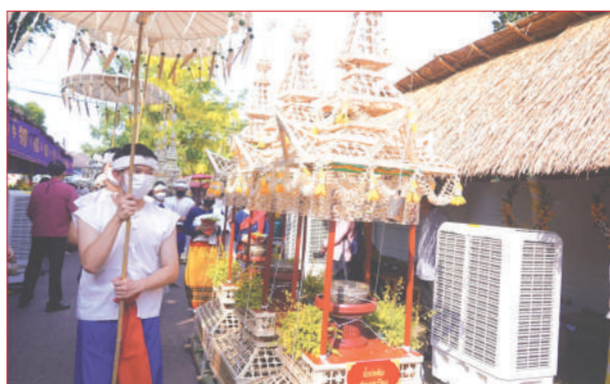
ส่วนหนึ่งของขบวนแห่

มาก ที่มีกิจกรรมเนื่องในวันสงกรานต์ ไม่ว่าจะเป็นการก่องเจดีย์ทราย ทำบุญ และเป็นไฮไลต์เลยคือ การสรงน้ำพระธาตุ โดยผู้ที่ต้องการสรงน้ำจะตักน้ำอบใส่ถัง จากนั้นจะต้องตั้งธูปขึ้นไปเพื่อทำการสรงน้ำ ซึ่งเป็นวิธีที่ช่วยให้ทุกคนได้รับบุญกันถ้วนหน้า จุดสุดท้ายเราได้เดินทางไปสักการะพระบรมธาตุดอนเต้า วัดพระแก้วดอนเต้าสุชาคาราม ซึ่งเป็นพระเจดีย์องค์ใหญ่ บรรจุพระ