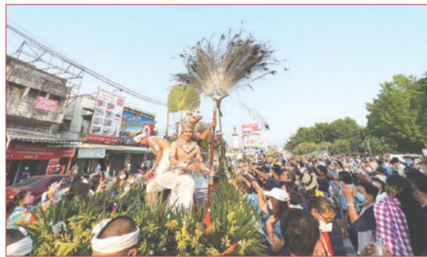
ชาวบ้านร่วมขอน้ำทิพย์จากเทพบุตรสรงหลวง