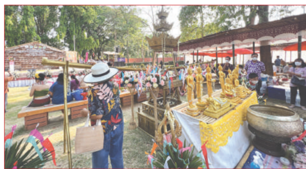
ประชาชนสรงน้ำพระที่ลานกิจกรรมข่วงนคร