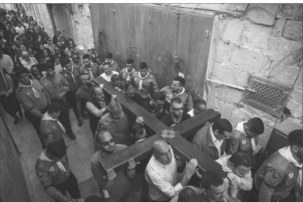
แบกกางเขน ● คริสตชนร่วมแบกกางเขนในวัน “กูดฟรายเดย์” ในพิธีสัปดาห์ศักดิ์สิทธิ์รำลึกพระมหาทรมานของพระเยซูเจ้า ก่อนถึงวันอาทิตย์อีสเตอร์ ที่นครเยรูซาเลม เมื่อวันที่ 15 เมษายน.

กระทรวงกลาโหมรัสเซียกล่าวในแถลงการณ์ว่ายังมีมิสไซล์จํานวนมากตกลงเป่าหมอบในกรุงเคียฟ เพื่อเป็นการตอบโต้การโจมตีของยูเครนที่ยังยิงขีปนาวุธร่อนต่อด้านเรือรบโจมตีเรือมอสควา เรือรบลาดตระเวนติดขีปนาวุธของรัสเซียในทะเลดำเมื่อวันที่ 2 สัปดาห์ที่แล้ว