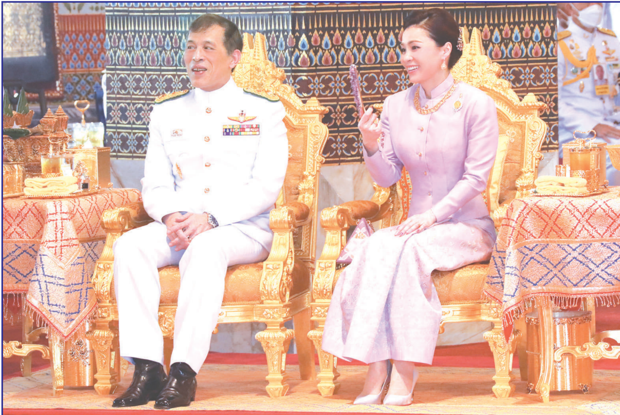
พระบาทสมเด็จพระเจ้าอยู่หัว และสมเด็จพระนางเจ้าฯ พระบรมราชินี เสด็จพระราชดำเนินไปทรงบำเพ็ญพระราชกุศลในการพระราชพิธีสงกรานต์ ณ พระที่นั่งอมรินทรวินิจฉัย พระบรมมหาราชวัง เมื่อวันที่ 15 เมษายน พุทธศักราช 2565