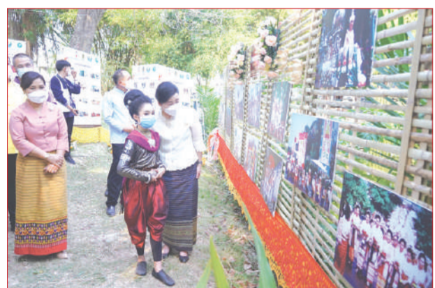
ปลัด ว.ธฆฆา