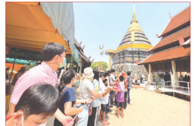
กิจกรรมสรงน้ำพระธาตุลำปางหลวง