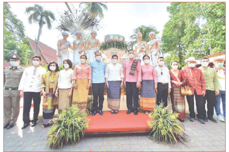
การเปิดงานขบวนสรงหลวง