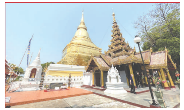
สักการะพระบรมธาตุดอนเต้า วัดพระแก้วดอนเต้าสุชาคาราม