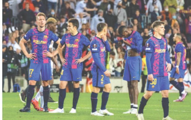
พลิกโลก ● บรรดานักเตะบาร์เซโลนาอินทรีกอินทรีก แฟรงก์เฟิร์ต จากเยอรมนี บุกมาชนะถึงถิ่นคัมป์นูในบาร์เซโลนา 3-2 ในศึกยุโรปาลีกก่อนรองชนะเลิศ เลกสอง รวมผลสองแมตช์แฟรงก์เฟิร์ตชนะไป 4-3

ปารีส ● บาร์เซโลนา โดนอินทรีก แฟรงก์เฟิร์ต บุกอัดคาบ้าน ตกกรอบรองชนะเลิศยุโรปาลีก ขณะที่ เวสต์แฮม อยู่ในเด็ต และกลาสโกว์ เรนเจอร์ส ตามแอร์เบ ไลป์ซิก ผ่านเข้าไปเล่นในรอบรองชนะเลิศ