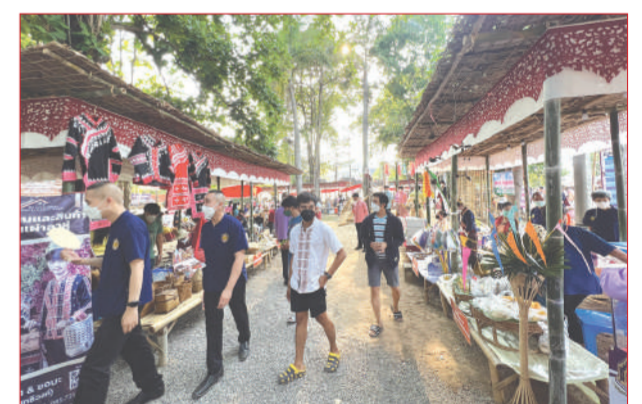
ตลาดพื้นบ้าน ณ ลานกิจกรรมข่วงนคร

มาก ที่มีกิจกรรมเนื่องในวันสงกรานต์ ไม่ว่าจะเป็นการก่องเจดีย์ทราย ทำบุญ และเป็นไฮไลต์เลยคือ การสรงน้ำพระธาตุ โดยผู้ที่ต้องการสรงน้ำจะตักน้ำอบใส่ถัง จากนั้นจะต้องตั้งธูปขึ้นไปเพื่อทำการสรงน้ำ ซึ่งเป็นวิธีที่ช่วยให้ทุกคนได้รับบุญกันถ้วนหน้า จุดสุดท้ายเราได้เดินทางไปสักการะพระบรมธาตุดอนเต้า วัดพระแก้วดอนเต้าสุชาคาราม ซึ่งเป็นพระเจดีย์องค์ใหญ่ บรรจุพระ