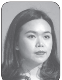
ไตรศุณี ไตรสรณกุล

แหม..เวลาทำงานที่ทำเนียบรัฐบาลทุกคนอาจจะเรียกท่านรองฯ แต่ถ้าอยู่ศรีสะเกษล่ะก็ ต้องเรียกท่านประธาน (ผ้าป่า) นะจ๊ะ อิอิ.