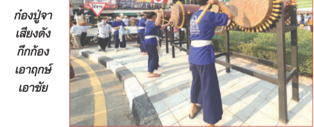
ก่องปูจานเสียงดี กีกก้องเอาฤกษ์เอาชัย