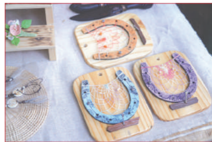
ผลงานศิลปะล้านนา นำมาสาธิตในงาน