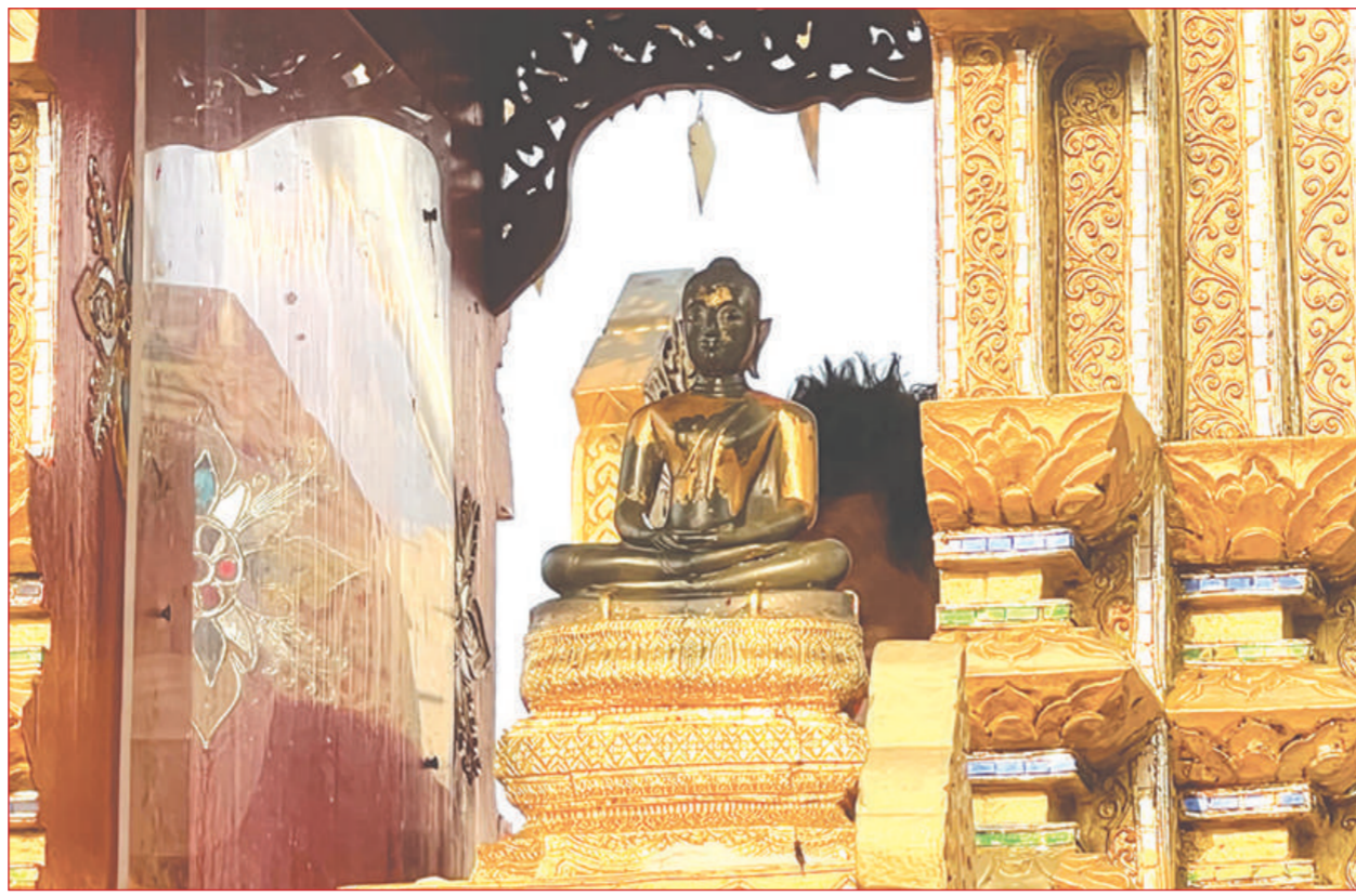
พระแก้วมรกตดอนเต้า

ในอดีตเมื่อถึงวันขึ้นปีใหม่ของคนพื้นเมืองในภาคเหนือตอนบนของประเทศไทย จะมีการประกอบพิธีสรงน้ำพระ โดยนำน้ำขมิ้น ลมป่อย น้ำอบ น้ำหอม ใส่ในสรงไปสรงน้ำองค์พระแก้วดอนเต้า