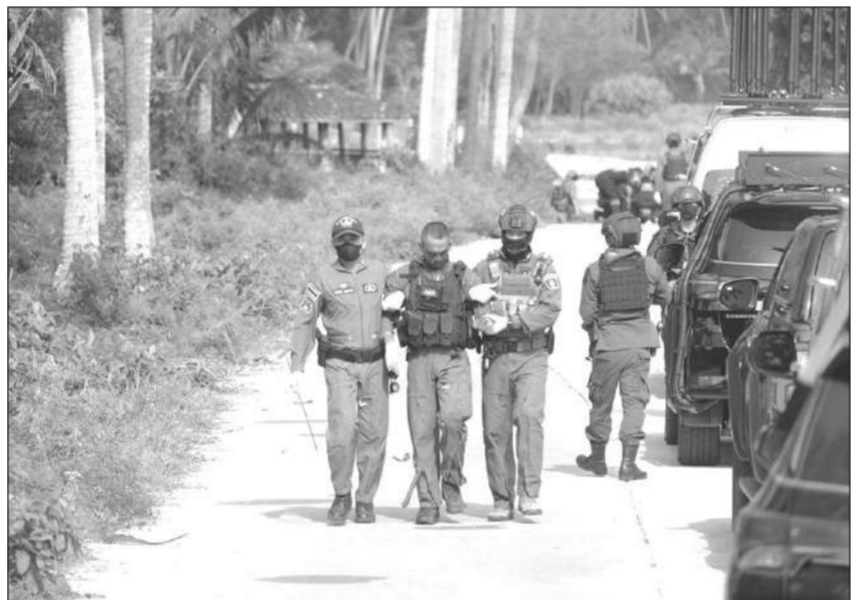
เจ้าหน้าที่ชุดเก็บกู้วัตถุระเบิด ตำรวจจร.ปัตตานี ได้รับบาดเจ็บระหว่างปฏิบัติหน้าที่ในอำเภอ สายบุรี ซึ่งเกิดเหตุระเบิดในพื้นที่ทำให้ชาวบ้านเสียชีวิต 1 ราย