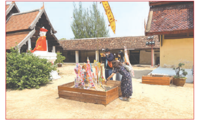
ก่องเจดีย์ทราย