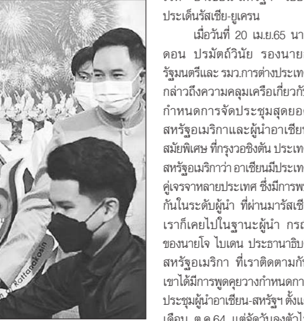
มิตินี่มาร์

กันนั้นเป็นไปโดยยาก ไม่ใช่ติดต่อกันแล้วทั้ง 10 ประเทศจะเห็นพ้องได้ทันที ขณะที่สหรัฐฯ ก็ยังไม่มีความพร้อมในช่วงเวลานั้นด้วย จึงได้เลื่อนการประชุมออกไป จึงไม่ใช่เรื่องที่เกิดขึ้น แต่หลายคนก็นำไปโยงกับเรื่องสงครามระหว่างประเทศรัสเซียและยูเครน ทั้งที่ไม่ได้เกี่ยวข้องกัน การหารือเรื่องกำหนดการดังกล่าวมีมาก่อนเกิดสงครามระหว่างรัสเซียและยูเครน จึงอย่านำไปโยงกัน