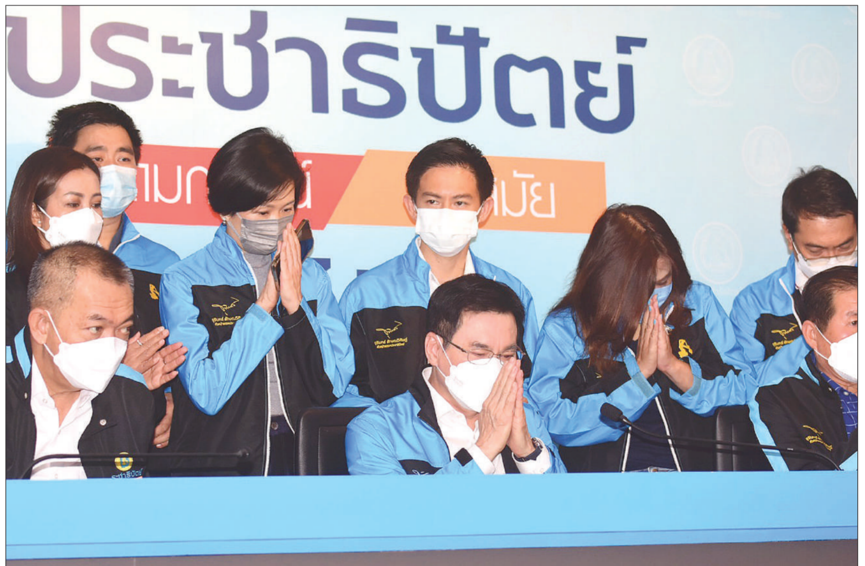
นายจรินทร์ ลักษณวิศิษฏ์ รองนายกรัฐมนตรีและ รมว.พาณิชย์ ในฐานะหัวหน้าพรรคประชาธิปัตย์ พร้อมแกนนำพรรค ได้ยกมือไหว้ขอโทษระหว่างการแถลงข่าวกรณีมีผู้เสียหายหลายรายกล่าวหา นายปริญญา พานิชภัคดี อดีตรองหัวหน้าพรรค กระทำการล่วงละเมิดทางเพศ ที่พรรคประชาธิปัตย์