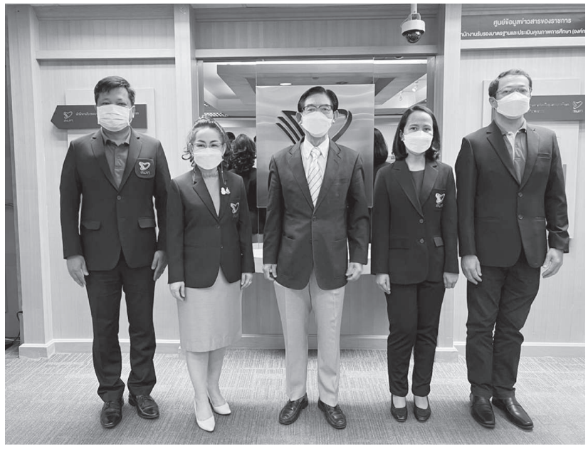
สมศ. เดินทางตั้งเป้าประเมิน 18,000 แห่ง ● ศ.ดร.สมคิด เลิศไพฑูรย์ รักษาการประธานกรรมการ สำนักงานรับรองมาตรฐานและประเมินคุณภาพการศึกษา (สมศ.) และ ดร.นันทา พงษ์นิตติ รักษาการผู้อำนวยการ สมศ. ร่วมแถลงข่าวแผนการประเมินคุณภาพภายนอกสถานศึกษา ปี 2565 โดย สมศ. ตั้งเป้าประเมินสถานศึกษา 18,000 แห่ง พร้อมเปิดให้สถานศึกษาดาวานโหลตหนังสือรับรองการประกันคุณภาพภายนอก (E - Certificate) ผ่านระบบออนไลน์เป็นครั้งแรก ทั้งนี้กิจกรรมดังกล่าวจัดขึ้น ณ สำนักงานรับรองมาตรฐานและประเมินคุณภาพการศึกษา

เพื่อมอบความประทับใจและการดูแลเป็นพิเศษที่จะเติมเต็มประสบการณ์ในการสัมมนาครั้งนี้ให้สมบูรณ์แบบ เพราะกรุงศรี เอ็กซ์คลูซีฟ เชื่อว่าความสุขคือผลตอบแทนที่มีค่าที่สุดของชีวิตค่ะ” ร่วมสัมผัสประสบการณ์เหนือระดับ พร้อมรับสิทธิประโยชน์มากมายที่คัดสรรมาให้ลูกค้าคนสำคัญตลอดทั้งปี ให้กรุงศรี เอ็กซ์คลูซีฟ เป็นผู้ดูแลทุกเรื่องการเงินของคุณ โดยสามารถศึกษารายละเอียดเพิ่มเติมเกี่ยวกับผลิตภัณฑ์และบริการต่างๆ ได้ที่ www.krungsri.com หรือ LINE @krungsriexclusive