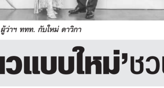
เที่ยวแบบใหม่รับมิตรชอบต่อสิ่งแวดล้อม