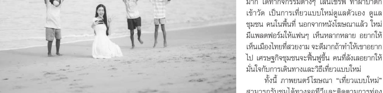
สัมผัสความน่ารักของเด็กๆ ในพื้นที่เขาหลักผ่านหนังสือชม

“วิถีชีวิตผู้คน นำเสนอความน่ารักของมิตรภาพ และหัวใจคนไทยในพื้นที่ (Amazing People) ไม่