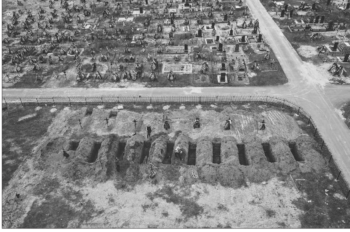
อาลัย • ภาพถ่ายทางอากาศตีพิมพ์ซึ่งศพผู้เสียชีวิตหลายรายจากสงครามในยูเครนที่เมืองบูซา เมื่อวันที่ 18 เมษายน