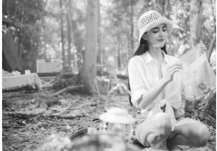
เที่ยวแบบใหม่รับมิตรชอบต่อสิ่งแวดล้อม