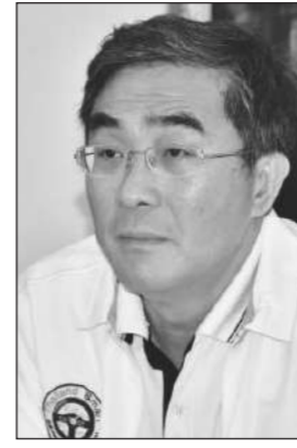
พิศักดิ์ จิตวิริยะวาทิน

นายพิศักดิ์ จิตวิริยะวาทิน รองปลัดกระทรวงคมนาคม ในฐานะประธานคณะกรรมการพิจารณาตรวจสอบข้อเท็จจริงกรณีกันเฟืองอาคาร Service Hall ท่าอากาศยานดอนเมืองพังถล่ม เปิดเผยว่า ใต้วงพื้นที่ตรวจสอบสภาพความเสียหายในเบื้องต้น และได้กำหนดแนวทางในการทำงาน โดยตั้งคณะทำงาน 2 คณะ แบ่งเป็น คณะแรกดูแลการตรวจสอบด้านวิศวกรรม และคณะที่สองตรวจสอบด้านสัญญาว่าดำเนินการครบถ้วนหรือไม่ ทั้งนี้จะประชุมสรุปกันอีกครั้งในวันที่ 29 เม.ย.2565