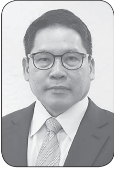
อุดม สาวน้อย

อย่างไรก็ตาม คงต้องติดตามกันต่อไป ...● อย่างน้อยก็ต้องปบรวมือให้กับความกล้าหาญและความซื่อสัตย์ของพรรคสร้างอนาคตไทย ที่ประกาศแล้วว่า "จนคิดอ่อน" "สมคิด จาคูศรีพิทักษ์" เป็นแคนดิเดตนายกฯ เบอร์หนึ่ง แล้วก็ต้องชมความกล้าของกระบวนการเลือก "สุรพันธ์ เวชชาชีวะ" เป็นทั้ง