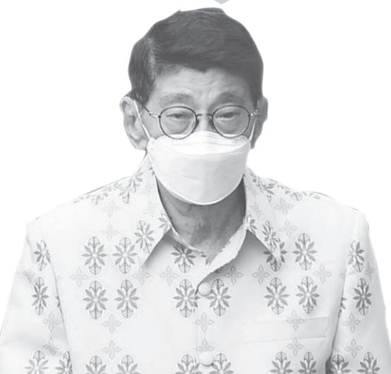
นายวิษณุ เครืองาม รองนายกรัฐมนตรี

ขอยืนยันเป็นเรื่องของปฏิบัติที่มีอยู่แล้ว ที่กำหนดไว้ว่าสภาจะต้องพิจารณาว่า พ.ร.บ.งบประมาณรายจ่ายให้เสร็จภายในกี่วัน หากสภาพิจารณาไม่เสร็จถือว่าอนุมัติตามมติคณะรัฐมนตรีเสนอ จากนั้นจะเข้าสู่การพิจารณาในชั้นวุฒิสภา เมื่อเสร็จสิ้นกระบวนการทุกอย่างแล้วจะมีการนำขึ้นทูลเกล้าฯ ถวายต่อไป โดยรวมแล้วจะต้องให้ร่าง พ.ร.บ.งบประมาณรายจ่ายมีผลบังคับใช้ในวันที่ 1 ต.ค. ทุกปีจะมีปฏิทินเช่นนี้อยู่แล้ว.