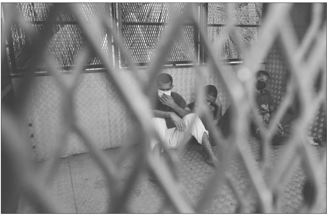
จับกุม ● ตำรวจมาเลเซียเผยแพร่ภาพของผู้อพยพชาวโรฮีนจาที่หลบหนีจากศูนย์ควบคุมตัวในรัฐปีนัง ถูกตามจับกุมมาได้นั่งอยู่ในรถบรรทุกของกรมตรวจคนเข้าเมืองเมื่อวันที่ 20 เมษายน.

เคียฟ ● หลังจากทหารรัสเซียโจมตีโอบล้อมเมืองมารีอูโพล เมืองท่ายุทธศาสตร์สำคัญทางใต้ของยูเครนมาแล้วเกือบ 2 เดือน รัสเซียใกล้ยึดเมืองนี้ไว้ได้อย่างเบ็ดเสร็จ แม้ทางยูเครนยืนยันว่าจะยังต่อสู้ป้องกันเมืองนี้ไว้ได้ แต่ขณะนี้ทั้ง 2 ขาดตกลงเบื้องต้นที่จะเปิดเส้นทางให้พลเรือนอพยพออกจากเมือง เอเอฟพีรายงานว่า เมื่อวันที่ 20 เมษายน 2565 ว่าสงครามรัสเซียรุกรานยูเครนที่ยังยืดเยื้ออยู่ต่อไป โดยยังมีการสู้รบอย่างดุเดือดทางตะวันออกและทางใต้ของยูเครน ขณะที่ชาร์ลส์ มิเชล ประธานคณะมนตรียุโรปเดินทางถึงกรุงเคียฟในวันเดียวกัน เป็นสัญญาณว่าความล้มเหลวของทั้งสองฝ่ายจะเร่งระหว่างยูเครนกับสหภาพยุโรป มิเชลโพสต์ทางโซเชียลมีเดียเมื่อวันพุธว่า เขาอยู่ในกรุงเคียฟในวันนี้ ในใจกลางของเสรีภาพและประชาธิปไตยของทวีปยุโรป ไม่กี่ชั่วโมงก่อนที่มีเชลเดินทางถึงกรุงเคียฟ กระทรวงกลาโหมสหรัฐฯ แถลงว่า เมื่อเร็วๆ นี้ได้ส่งเครื่องบินขับไล่หลายลำและอะไหล่เพื่อเพิ่มขีดความสามารถให้กับกองทัพอากาศยานยูเครน ด้านสถานการณ์การสู้รบที่เมืองมารีอูโพล เมืองท่ายุทธศาสตร์สำคัญทางใต้ของยูเครน เข้าใกล้ถึงจุดแตกหักแล้วหลังจากทหารรัสเซียปิดล้อมเมืองนี้มาแล้วเกือบ 2 เดือน ทำให้พลเรือนติดค้างอยู่ในเมืองกองทัพรัสเซียยื่นคำขาดให้ทหารยูเครนที่ยังคงปักหลักต่อสู้อยู่ในเมืองมารีอูโพลให้ยอมจำนนอีกครั้งเมื่อวันพุธ คราวนี้เชลเดินทางที่เวลา 14.00 น. ตามเวลารัสเซีย หรือ 18.00 น. ตามเวลาไทย โดยจะเปิดเส้นทางอพยพให้กับทหารรัสเซียที่ยอมมาอาวุธ ขณะที่ เซอร์ฮีย์ โวยนา ผู้