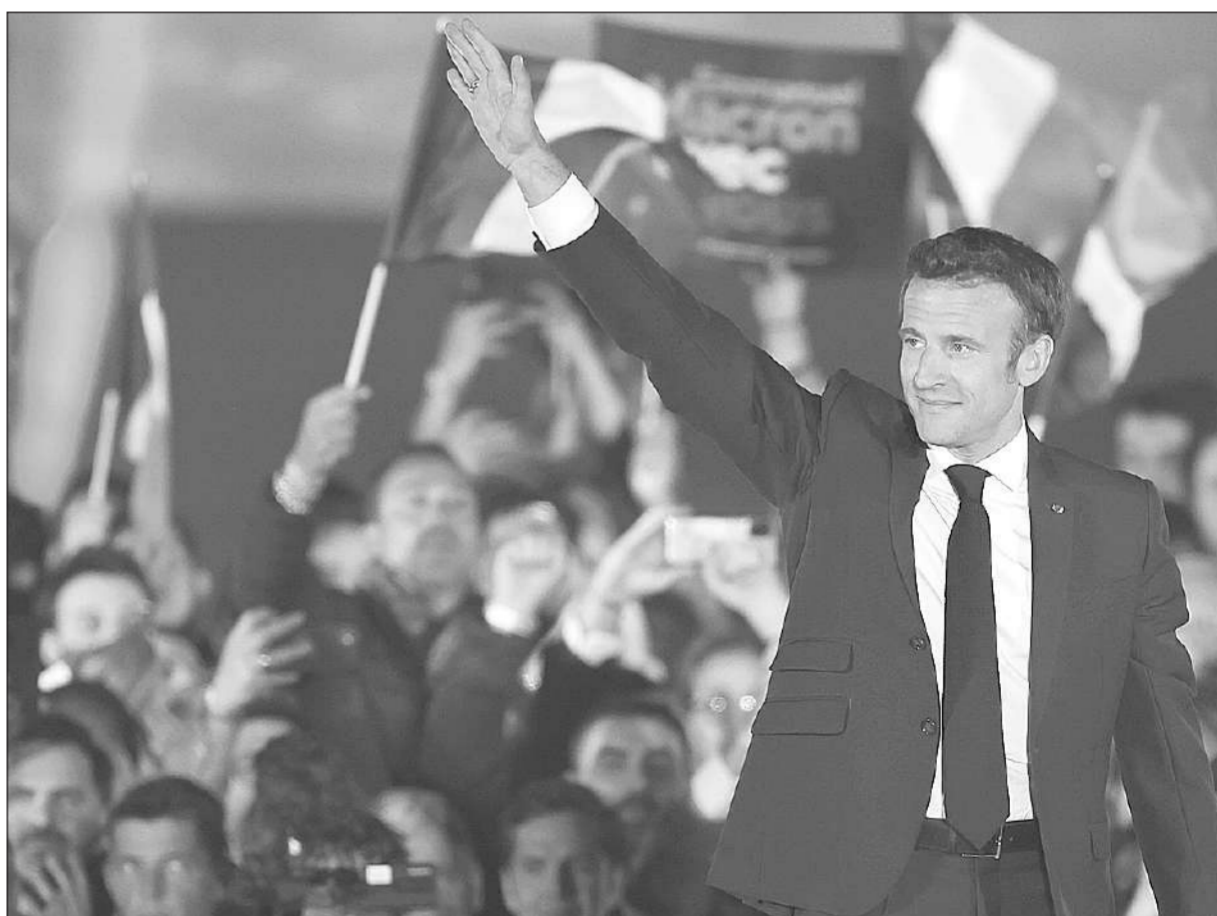
ประกาศชัย ● ประธานาธิบดีเอมานูเอล มาครง ฉลองชัยชนะการเลือกตั้งประธานาธิบดีฝรั่งเศสรอบ 2 ที่มีต่อมารีน เลอ เปน ที่ห้องเดอมาร์ส กรุงปารีส เมื่อวันที่ 24 เมษายน.

ปารีส ● ประธานาธิบดีเอมานูเอล มาครง ของฝรั่งเศส ให้สัญญาณว่าจะเริ่มต้นสร้างเอกภาพในชาติที่มีการแบ่งแยกอย่างหนัก หลังคว้าชัยชนะในการเลือกตั้งประธานาธิบดีฝรั่งเศสรอบ 2 ที่เป็นรอบชี้ขาดเมื่อวันอาทิตย์ต่อมารีน เลอ เปน คู่แข่งแนวคิดขวาจัด คู่ต่อสู้เดิมของเขาที่คราวนี้ได้คะแนนเพิ่มขึ้นมาก เออเฟพีและรอยเตอร์รายงานเมื่อวันที่ 25 เมษายน 2565 ว่าผลการเลือกตั้งประธานาธิบดีฝรั่งเศสรอบที่ 2 เมื่อวันที่ 10 ตุลาคมที่ผ่านมา หลังการเลือกตั้งรอบแรกไม่มีผู้สมัครที่ได้คะแนนเกิน 50% ในการเลือกตั้งรอบที่ 2 เป็นการแข่งกันระหว่างประธานาธิบดีเอมานูเอล มาครง วัย 44 ปี กับมารีน เลอเปิน วัย 53 ปี คู่แข่งที่ขู่นโยบายขวาจัด ซึ่งเป็นคู่แข่งเดิมในการเลือกตั้งประธานาธิบดีรอบ 2 เมื่อ 5 ปีก่อน กระทรวงมหาดไทยฝรั่งเศสแถลงผลการเลือกตั้งอย่างเป็นทางการเมื่อวันที่ 24 พฤษภาคม ประธานาธิบดีมาครงเป็นผู้ชนะการเลือกตั้งด้วยคะแนน 58.55% ส่วนเลอ เปน ได้ 41.45% ชาวฝรั่งเศสออกมาใช้สิทธิเลือกตั้งประธานาธิบดีรอบ 2 ครั้งนี้เพียง 72% เป็นจำนวนผู้ใช้สิทธิต่ำสุดตั้งแต่ปี 2512 และ 6.35% ของผู้ใช้สิทธิก็โหวตไม่เลือกทั้งมาครงและเลอ เปน โดยมีบัตรเสีย 2.25% แม้มาครงชนะเลือกตั้งเป็นประธานาธิบดีฝรั่งเศสสมัยที่ 2 คนแรกในรอบ 20 ปี แต่การเลือกตั้งรอบ 2 ในปีนี้เขามิได้คะแนนลดลงจากการเลือกตั้งรอบ 2 เมื่อปี 2560 ที่เขาได้ 66.1% ส่วนเลอ เปน มีคะแนนเพิ่มขึ้นจากเมื่อ 5 ปีก่อนได้ 33.9% ความท้าทายแรกที่มาครงต้องเผชิญคือการเลือกตั้งทั่วไปที่จะมีขึ้นในเดือนมิถุนายน หลังประกาศผลการเลือกตั้งประธานาธิบดี มีกลุ่มซ้ายสุดโด้งหลายร้อยคนออกมาประท้วง ผลการเลือกตั้งในบางเมือง ตำรวจยิงแก๊สน้ำตาใส่ผู้ประท้วง