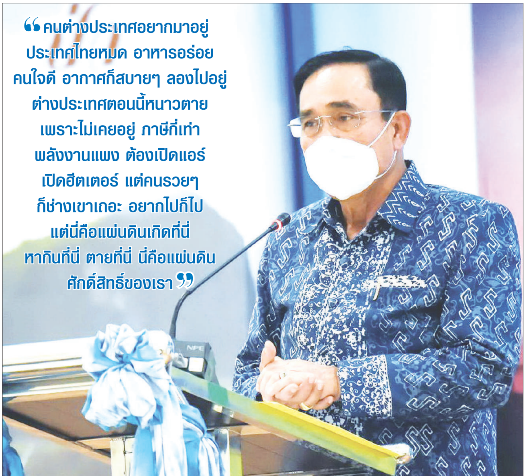
พล.อ.ประยุทธ์ จันทร์โอชา นายกรัฐมนตรีและ รมว.กลาโหม ขณะเป็นประธานในพิธีเปิดโครงการส่งเสริมศิลปวัฒนธรรมพื้นบ้าน การแสดงโนรา “สืบสานศิลป์แผ่นดินโนรา มรดกโลกภูมิปัญญาทางวัฒนธรรม” ณ ศาลากลางจังหวัดพัทลุง (หลังเก่า) อ.เมืองพัทลุง จ.พัทลุง เมื่อเวลา 17.30 น. วันที่ 25 เม.ย.

“คนต่างประเทศอยากมาอยู่ ประเทศไทยหมด อาหารอร่อย คนใจดี อากาศก็สบายๆ สองไปอยู่ ต่างประเทศตอนนี้หนาวตาย เพราะไม่เคยอยู่ ภาษาก็เท่า พลังงานแพง ต้องเปิดแอร์ เปิดฮีตเตอร์ แต่คนรววยๆ ก็ช่างเขาเถอะ อยากไปก็ไป แต่นี่คือแผ่นดินเกิดที่นี่ หากินที่นี่ ตายที่นี่ นี่คือแผ่นดิน ศักดิ์สิทธิ์ของเรา”