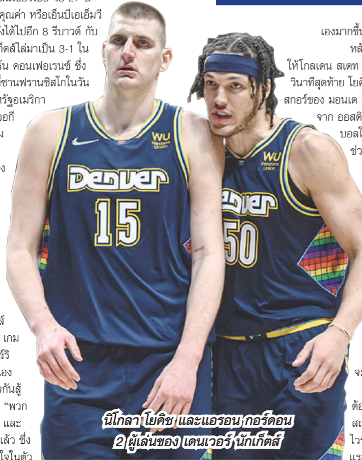
นิโกลา โยคิช และ Aaron Gordon 2 ผู้เล่นของ เดนเวอร์ นิกส์

โยคิชยอมรับว่า เดนเวอร์ นิกส์มีลุ้นมากขึ้นที่จะไม่ยอมแพ้ซีรีส์แบบโดนกวาดครบทั้ง 4 เกมให้กับ โกลเดนสเตท วอร์ริเออร์ส ในสนามของตนเอง “พวกเราพร้อมใจกันสู้เพิ่มเติม” โยคิชกล่าว “พวกเราไม่ต้องกดดันกดดัน และตอนนี้พวกเราทำสำเร็จแล้ว ซึ่งนั่นทำให้พวกเรารู้สึกภูมิใจในตัว