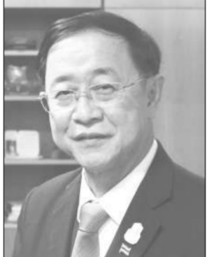
อาคม เติมพิทยาไพสิฐ รมว.การคลัง

นายอาคม เติมพิทยาไพสิฐ รมว.การคลัง กล่าวว่า ได้พูดไปหลายครั้งแล้วว่าอยู่ระหว่างการพิจารณาว่าจะมีการต่ออายุมาตรการคนละครึ่งระยะที่ 5 หรือไม่ โดยต้องประเมินสถานการณ์เศรษฐกิจในภาพรวมก่อน เพราะมีการถูกถามอยู่เสมอว่ารัฐบาลมีเงินเพียง