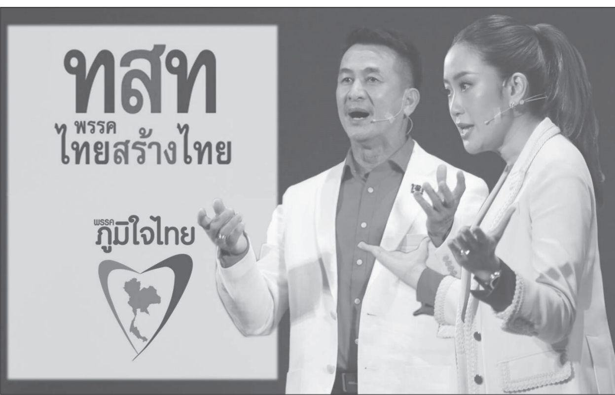
สมาชิกพรรค แนวร่วม และ ส.ส.เพื่อไทย