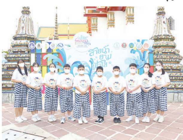
เยาวชนเจ้าบ้านสืบสานวัฒนธรรมถ่ายทอดเรื่องราวชุมชน

ถัดมา ท่ามหาราช เปิดพื้นที่ให้สงกรานต์พระพุทธรูป แล้วมาช้อปปิ้ง ชิม ชิม ริมเจ้าพระยา ต้มคำว้าวที่คั่นวิถีชีวิตและการสัญจรทางน้ำระหว่างฝั่งพระนครและฝั่งธนบุรี มีเกมงานวัดที่เด็กๆ จะสนุกสนานเพลิดเพลินด้วย, เอเซียทิค เดอะเรเวอร์พร้อนท์ มาเรียนรู้เส้นทางความร่วมมือริมน้ำเจ้าพระยา ตื่นตาไปกับขบวนสงกรานต์ไทย ร่วมสรงน้ำพระพุทธรูป 65 องค์ อัญเชิญจากพระอารามหลวงริมแม่น้ำเจ้าพระยา ท่ามหาราช เวทีการแสดงศิลปวัฒนธรรมไทย และร่วมย้อนยุคกลางกรุง, ตั้ง 1919 มาสักการะเจ้าแม่หม่าโจ้วในเทศกาลปีใหม่ไทย พร้อมสัมผัสคุณค่าแห่งศิลปะและวิถีไทย-จีนโบราณ และ สุขสยาม ณ ไอคอนสยาม จัดขบวนแห่พระพุทธรูป 4 ภาค และการแสดง 4 ภาครอบเมืองสุขสยาม สืบสานวัฒนธรรมไทย ทุกท่านนำไม้เท้ายาวชวยเข้าบ้านสืบสานวัฒนธรรมมาถ่ายทอดเรื่องราวและของดีชุมชนให้นักท่องเที่ยวอย่างมีรอยยิ้ม นอกจากนี้มีบริการล่องเรือฟรี 9 ท่าร่วมสมัย สามารถขึ้นเรือได้จากทุกท่าเวลาเดินเรือ 09.00-17.00 น. แล้วยังมีบริการเรือข้ามฟากอีกหนึ่งทางเลือก