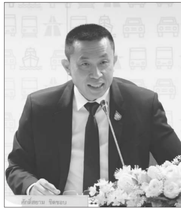
คักดีสยาม ขีดชอบ

2.มิติความปลอดภัยในการเดินทาง ตรวจสอบและปรับปรุง