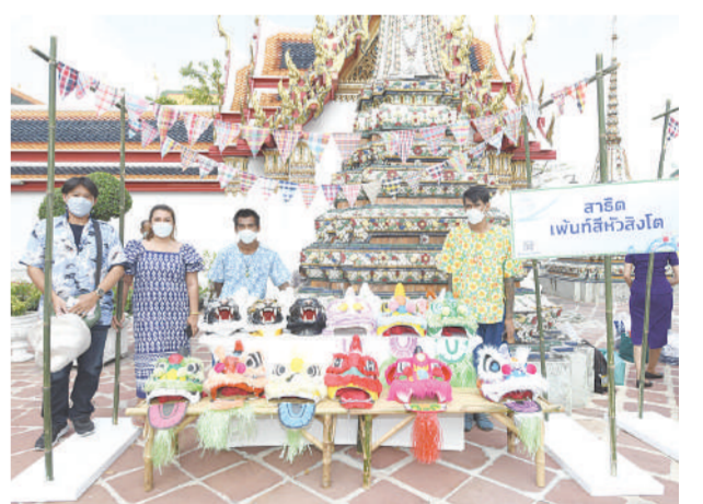
เวิร์กช็อปหัวสิงโตที่วัดกัลยา

อุตรดิตถ์ จัดงานที่วัดสระแก้ว วัดสันติธรรม และลานวัฒนธรรมมรดกโลกบ้านเชียง สืบสานวัฒนธรรมประเพณีชุมชนไทพวน ร่วมกิจกรรมมงคล ตักบาตรวิถีไทพวนที่เป็นเสน่ห์วัฒนธรรมท้องถิ่นให้ผู้มาเยือนได้สัมผัส สรงน้ำพระพุทธรูปสำคัญของชุมชน และชมขบวนวัฒนธรรมไทพวนบ้านเชียง อัญเชิญพระพุทธรูปสำคัญลงสรงน้ำปีใหม่ไทยระหว่างวันที่ 13-14 เม.ย.