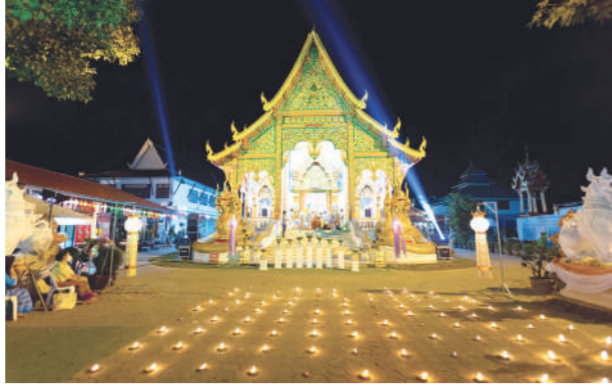
สงกรานต์สืบสานวัฒนธรรมล้านนาที่ลำพูน

สงกรานต์ปีนี้จะมีความคึกคักมากกว่าปีที่ผ่านมา นักท่องเที่ยวเตรียมตัวเดินทางเฉลิมฉลองสงกรานต์ทั้งในกรุงเทพฯ และจังหวัดต่างๆ ซึ่งมีหลายพื้นที่จัดเทศกาลสงกรานต์เพื่อสืบสานวัฒนธรรมที่ดั้งเดิมและกระตุ้นการท่องเที่ยว งาน “Water Festival 2022 เทศกาลวิถีน้ำ...วิถีไทย” เป็นหนึ่งในกิจกรรมที่ได้รับความนิยมในช่วงเทศกาลสงกรานต์ของทุกปี เป็นงานที่ถูกกล่าวถึงมาก ว่าบอกเล่าความเป็นไทยที่ผูกพันกับสายน้ำไปทั่วโลก ปีนี้ บริษัท ไทยเนฟเวอเรจ จำกัด (มหาชน) ร่วมกับกระทรวงการท่องเที่ยวและกีฬา กระทรวงวัฒนธรรม กองทัพอากาศ กรุงเทพมหานคร การท่องเที่ยวแห่งประเทศไทย และเครือข่ายพันธมิตร ประกาศความพร้อมจัดเทศกาลวัฒนธรรมระดับประเทศ “Water Festival 2022 เทศกาลวิถีน้ำ...วิถีไทย” ขึ้นเป็นครั้งที่ 7 ภายใต้แนวคิด “สายน้ำ ยาม ฟ่ำใส” ชวนนักท่องเที่ยวฉลองสงกรานต์ปีใหม่ไทยอย่างมีความสุข สดใส และร่วมรักษาวัฒนธรรมประเพณีอันเป็นสิริมงคล ซึ่งจัดขึ้น 4 ภาคใน 6 จังหวัด ได้แก่ กรุงเทพฯ เชียงใหม่ ลำพูน อุตรดิตถ์ ขอนแก่น และภูเก็ต ระหว่างวันที่ 11-15 เมษายน