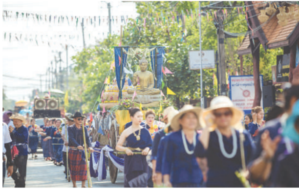
ขบวนวัฒนธรรมไทพวนบ้านเชียง อัญเชิญพระพุทธรูปให้สงกรานต์