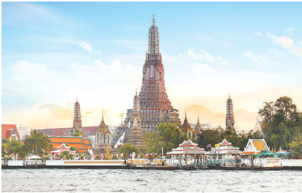
ก้าวข้ามปีใหม่ที่วัดอรุณฯ 1 ใน 9 ท่าน้ำประวัติศาสตร์