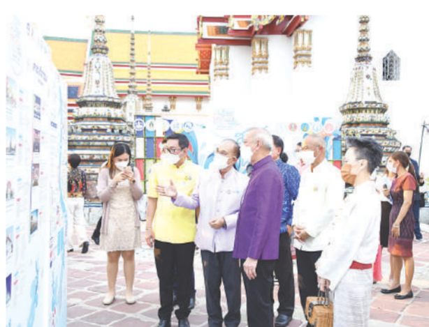
พิพัฒน์ รัชกิจประการ รว.ท่องเที่ยว เปิดงาน “Water Festival 2022 เทศกาลวิถีน้ำ...วิถีไทย”

ตลาดน้ำชุมชน สงเสริมท่องเที่ยววิถีวัฒนธรรมพื้นเศรษฐกิจชุมชนภาคเหนือ เชียงใหม่ สืบสานประเพณีปีใหม่เมือง ณ บ้านโบราณเชียงใหม่ ริมน้ำแม่ปิง วันที่ 13-15 เม.ย. ไหว้พระพุทธรูปและประเพณีน้ำมนต์ หรือ “น้ำมงคล” จากวัดหลักทั้ง 9 ตามหลักทักษาเมือง สรงน้ำพระและครูบาครูวิชัย ไม้ค้ำ เบี้ยเสียดไทย ดงพระธาตุประจำป็นักช้เกิด 12 ราศี แทนพิธีไหว้ท้าวพรพราหมณ์ 4 รวมถึงพระอินทร์และพระแม่ธรณี รับพรล้านนาฉบับใหม่ ภายในงานสละเมืองจัดเวิร์กช็อปงาน Craft ล้านนา กับแหล่งเรียนรู้อารยธรรมเครื่องปั้นดินเผาบ้านต้นน้ำ สล่าแดง เรียนรู้การปั้นดินเป็นรูปสัตว์ต่างๆ เครื่องประดับล้านนา ลูกปัดดิน ถ้วยกาแฟ ลำพูน จัดงานที่อินทผยงศ และวัดมหาวัน มีขบวนแห่สงกรานต์พระอย่างสร้างสรรค์ โดยเยาวชนเจ้าบ้าน 3 ขบวน ขบวนแห่การแสดงกลองสะบัดชัยผ่านถนนอินทผยงศและขบวนสงกรานต์ตลาดนัดชุมชน และการแสดงดนตรีบริเวณถนนรถแก้ว วันที่ 13 เม.ย.