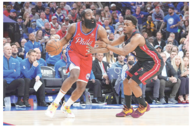
เจมส์ ฮาร์เดน (ซ้าย) ผู้เล่นของ ฟิลาเดลเฟีย เซเวนตีซิกเซอร์ส พยายามเลี้ยงบอลผ่าน โคลด์ ลาวรี ผู้เล่นของไมอามี ฮีต ในเกมบาสดอบเบิลเอ็นบีเอเพลย์ออฟ เกมที่ 4 ของซีรีส์รอบรองชนะเลิศของฝั่งอีสต์เทิร์น คอนเฟอเรนซ์ ที่เวสต์ พาร์ก เซ็นเตอร์ ในฟิลาเดลเฟีย ที่เจ้าบ้านเซเวนตีซิกเซอร์สชนะไป 116-108 คะแนนซีรีส์กลับมาเสมอ 2-2

ลอสแอนเจลิส ● ดัลลัส มาเวอริกส์ จัดการระยะ 3 คะแนนลงไปถึง 20 ลูก ก่อนเปิดบ้านเอาชนะทีมวางอันดับ 1 ของสายอย่าง ฟินิกซ์ ซันส์ 111-101 ทำให้คะแนนซีรีส์กลับมาเสมอกัน ในศึกบาสดอบเบิลเอ็นบีเอเพลย์ออฟ เมื่อวันที่ 9 พ.ค.ที่ผ่านมา ลูก ดอนชิว การ์ดระดับสตาร์ของเจ้าบ้านมาเวอริกส์กดไป 26 คะแนน และคอเรียน ฟินนิย์-สมิท ทำไปอีก 24 คะแนน ให้ดัลลัสคว้าชัยชนะทั้ง 2 เกมที่เล่นในบ้าน ทำให้คะแนนซีรีส์ดีที่สุดใน 7 เกม ในรอบรองชนะเลิศของฝั่งเวสต์เทิร์น คอนเฟอเรนซ์ กลับมาเสมอกัน 2-2 หลังจาก 2 เกมแรกซึ่งเล่นที่ฟิnikซ์นั้นแพ้รวดทั้ง 2 เกม