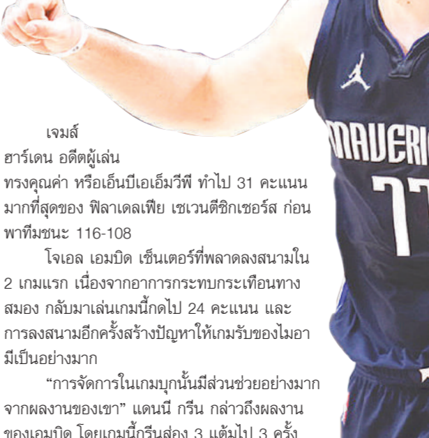
เจมส์ ฮาร์เดน อดีตผู้เล่นทรองคุดคำ หรือเอ็นบีเอเอ็มวีพี ทำไป 31 คะแนนมากที่สุดของ ฟิลาเดลเฟีย เซเวนตีซิกเซอร์ส ก่อนพ่ายชนะ 116-108 โจเอล เอมบิด เซ็นเตอร์ที่พลาดลงสนามใน 2 เกมแรก เนื่องจากอาการกระดูกงูเข่าที่บาดเจ็บจากการลงสนามอีกครั้งสร้างปัญหาให้เกมรับของไมอามีเป็นอย่างมาก "การจัดการในเกมบุกนั้นมีส่วนช่วยอย่างมากจากผลงานของเขา" แดนนี กรีน กล่าวถึงผลงานของเอมบิด โดยเกมนี้กรีนส่ง 3 แต้มไป 3 ครั้ง

ทำแต้มเหนือกว่าถึง 36-26 "นี่มันสุดยอดมาก" ดอนชิวกล่าว โดยใน 2 เกมแรกของซีรีส์ที่เปิดด้วยความพ่ายแพ้ เขาเล่นได้อย่างโดดเด่น แต่ขาดการสนับสนุนจากเพื่อนร่วมทีม "ทุกคนที่ลงสนามต่างใส่ทุกอย่างที่เข้าไปหมด ถ้าเราเล่นได้อย่างนี้เราจะกลายเป็นทีมที่อันตราย" ในเกมนี้ถึงแม้ดอนชิวจะมีปัญหาในการชู้ตทำคะแนน แต่เขาสามารถส่งให้เพื่อนทำแต้มได้ถึง 11 แอสซิสต์ และขึ้นไปโลบริบราวต์อีก 4 ครั้ง นอกจากนั้นยังชโยบายบอลจากคู่แข่งได้ 4 สตีล ในเกมที่ซันส์เสียเทิร์นโอเวอร์ถึง 17 ครั้ง โลบริบราวต์เองชนะเลิศของฝั่งอีสต์เทิร์นคอนเฟอเรนซ์ ฟิลาเดลเฟีย เซเวนตีซิกเซอร์ส ก็ชนะทั้ง 2 เกมที่เล่นในบ้านเช่นกัน ทำให้คะแนนซีรีส์กลับมาเสมอ ไมอามี ฮีต 2-2