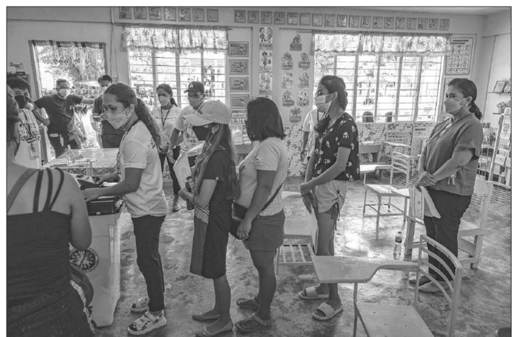
ลงคะแนน • เลนี โรเบรโด (ขวาสุด) ผู้สมัครชิงเก้าอี้ประธานาธิบดีฟิลิปปินส์ ต่อแถวเพื่อรอลงคะแนนที่หน่วยเลือกตั้งในโรงเรียนแห่งหนึ่งในเมืองมาคินาเนา จังหวัดคามารีเนสซูร์ เมื่อวันที่ 9 พฤษภาคม

เลือกตั้งแห่งหนึ่งหลังจากเพิ่งเปิดให้ประชาชนมาใช้สิทธิ์เลือกตั้งในเทศบาลบูลูอัน จังหวัดกิงคานาเนา ทำให้เจ้าหน้าที่รักษาความปลอดภัยเสียชีวิต 3 ราย และบาดเจ็บ 1 คน เกาะมินดาเนาเป็นแหล่งหลบซ่อนของกลุ่มติดอาวุธหลายกลุ่ม เช่น ผู้ก่อการร้ายคอมมิวนิสต์ และกลุ่มอิสลามิสต์ ในวันเดียวกัน เกิดเหตุคนร้ายกราดยิงที่หน่วยเลือกตั้งในจังหวัดลาเนาเดสซูร์ บนเกาะมินดาเนา ทำให้ประชาชนที่มาใช้สิทธิ์เลือกตั้งเสียชีวิต 1 คน และบาดเจ็บ 2 คน และเมื่อคำวันอาทิตย์ที่ผ่านมา เกิดเหตุคนร้ายชิงทรัพย์และฆาตกรรม 5 ลูกมาคอกนอกหน่วยเลือกตั้งแห่งหนึ่งที่เทศบาลดาตุนเซจังหวัดมาคินดาเนาเช่นกัน ทำให้มีผู้ได้รับบาดเจ็บ 9 คน.