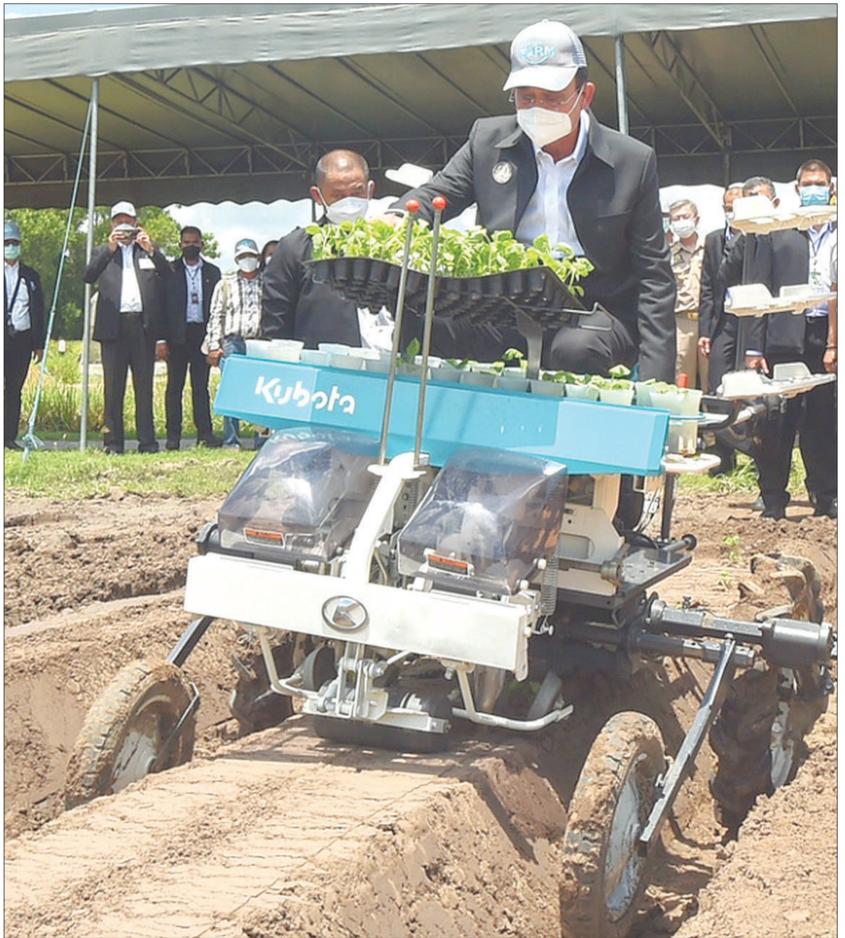
พล.อ.ประยุทธ์ จันทร์โอชา นายกรัฐมนตรีและ รมว.กลาโหม ทดลองขับรถหอดอกกล้วย ระหว่างเยี่ยมชมนวัตกรรมทางการเกษตรสมัยใหม่ และพบปะเกษตรกรพร้อมรับฟังแนวทางการความสำเร็จของ smart farming ที่คูโบต้าฟาร์ม ต.หนองอิรุณ อ.บ้านม่วง จ.ชลบุรี เมื่อวันที่ 9 พ.ค.