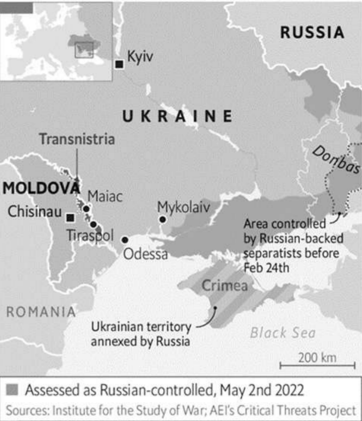
Assessed as Russian-controlled, May 2nd 2022

ประการที่สอง ดูเหมือนจะร้ายแรงกว่าข้อแรก คือประมาณ 80% ของไฟฟ้าของมอลโดวาจากเครื่องกำเนิดไฟฟ้าในทรานสนีสตริยา ซึ่งขับเคลื่อนด้วยก๊าซของรัสเซียเช่นกัน