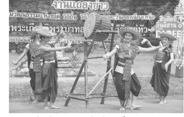
การแสดงศิลปวัฒนธรรม 20 จังหวัดแดนอีสาน

รวมศิลปินพินัยยอดเยี่ยมปี 65 หอศิลป์สมเด็จพระนางเจ้าสิริกิติ์ พระบรมราชินีนาถ ชวนชมนิทรรศการศิลปะพินัยยอดเยี่ยม ปี 2565 รวบรวมผลงานศิลปะพินัยยอดเยี่ยมของศิลปินพินัยยอดเยี่ยมและประติมากรไทย ชั้นปีสุดท้ายของปีการศึกษา 2564 จากสถาบันอุดมศึกษาที่เปิดสอนด้านศิลปะ 43 แห่งทั่วประเทศ รวม 161 ชิ้น ประกอบด้วยจิตรกรรม ประติมากรรม สื่อผสม และงานจัดวาง เป็นต้น จัดแสดงตั้งแต่วันที่ 28 มิ.ย. 2565 มาเสถียรภาพศิลปะและแลกเปลี่ยนเรียนรู้เทคนิคทางศิลปะกันได้ เพื่อก้าวสู่การเป็นศิลปินอาชีพ ณ หอศิลป์สมเด็จพระนางเจ้าสิริกิติ์ พระบรมราชินีนาถ เปิดให้เข้าชมทุกวัน (ปิดวันพุธ) เปิดตัวหนังสืออนิช คาปัวร์ เทศกาลศิลปะร่วมสมัยนานาชาติ บางกอก อาร์ต เบียนนาเล่ 2020 หัวเรือใหญ่โดยบริษัท โยเบฟเวอเรจ จำกัด (มหาชน) เปิดตัวหนังสือ “อนิช คาปัวร์ : จักรวาล สุนyata และความเป็นแม่” ซึ่ง ศ.ดร.กัมปิตน์ โปษยานนท์ เป็นบรรณาธิการ เนื้อหาเล่าถึงเนื้องานและความหมายของสัญลักษณ์ในผลงานศิลปะของศิลปินชื่อ อนิช คาปัวร์ ทั้งแง่ศาสนาพุทธและฮินดูในมุมมองศิลปะ ประวัติศาสตร์ ศิลปะ ศาสนา ความศรัทธาและปรัชญา นอกจากนี้เล่าถึงนิทรรศการที่จัดแสดงวัดโพธิ์ วัดอรุณ และเดอะปาร์ค หนังสือเขียนทั้งภาษาไทยอังกฤษและภาษาไทย สามารถสั่งซื้อหนังสือล่วงหน้าได้จนถึงวันที่ 31 พ.ค. สนใจ inbox มาได้ที่ Facebook : Bkartiennale.