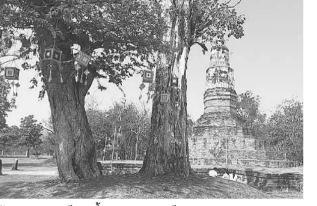
จัดงานประเพณีสงกรานต์พระธาตุยาคู ปี 2565