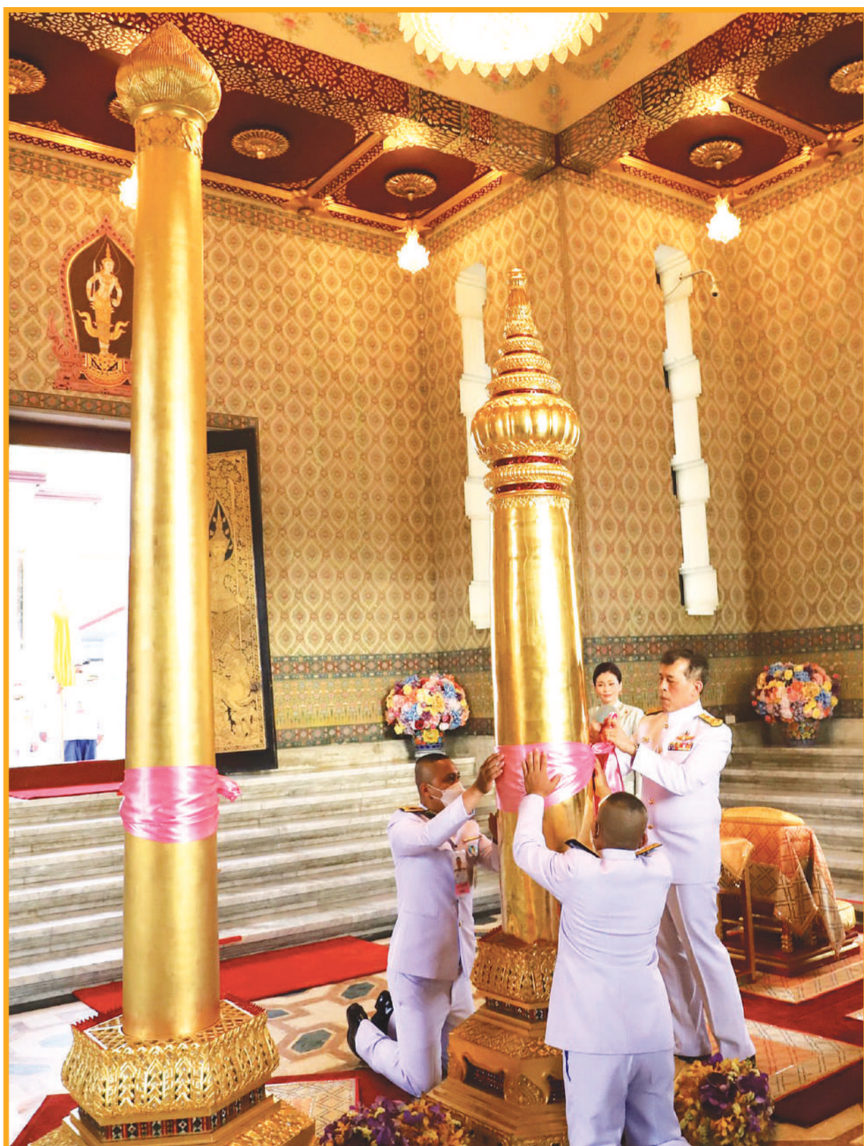
พระบาทสมเด็จพระเจ้าอยู่หัว และสมเด็จพระนางเจ้า พระบรมราชินี เสด็จพระราชดำเนินไปทรงบวงสรวงพระหลักเมืองเมืองใหม่โอกาสกรุงรัตนโกสินทร์ครบ 240 ปี ณ ศาลหลักเมือง เขตพระนคร กรุงเทพมหานคร