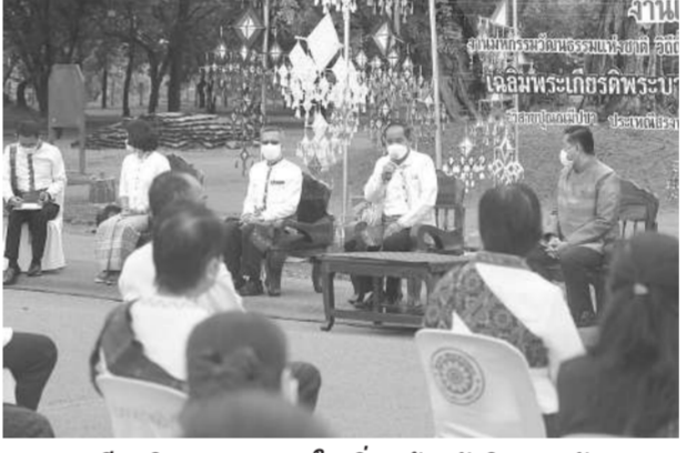
ประเพณีสงกรานต์และทวงพล ใจกริม พร้อมจัดกิจกรรมวันธรรม