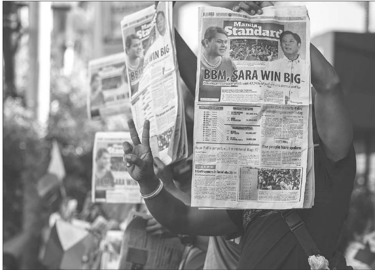
ฉลองชัย ● ผู้สนับสนุนเฟอร์ดินานด์ มาร์กอส จูเนียร์ ชูหนังสือพิมพ์ที่พาดหัวว่ามาร์กอสและซารา ดูเตรเด ชนะเลือกตั้งอย่างถล่มทลายที่เมืองมันดาเลย์ออง มหานครมะนิลา เมื่อวันที่ 10 พฤษภาคม

กล่าวหาว่า ความผิดปกติกในการเลือกตั้งครั้งนี้