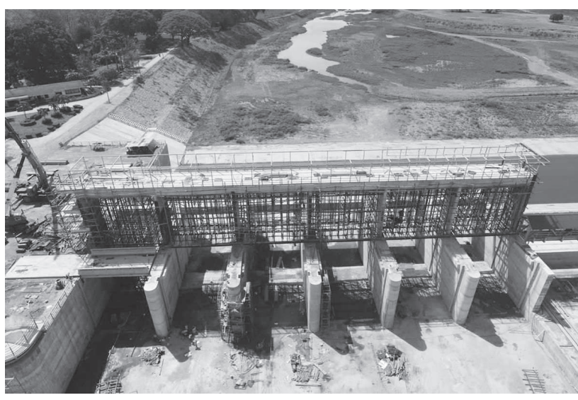
“ในการลงพื้นที่ของพล.อ. ประวิตร วงษ์สุวรรณ รองนายกรัฐมนตรี จ.พิษณุโลก อุดรดิตต์ และพิจิตร เมื่อวันที่ 4 เม.ย.65 ที่ผ่านมา ได้ให้นโยบายกับกรมชลฯ ว่าให้วางแผนการบริหารน้ำเพื่อการอุปโภคบริโภคเพียงพอตลอดทั้งปี พร้อมประชาสัมพันธ์ประชาชนใช้น้ำอย่างประหยัดสอดคล้องกับนโยบายของรัฐเพื่อสงวนน้ำสำหรับสนับสนุนทุกกิจกรรมของประชาชน ทั้งนี้โครงการเพิ่มประสิทธิภาพการบริหารน้ำลุ่มน้ำยม มีทั้งการขุดขยายคลอง ปรับปรุงประตูระบายน้ำ(ปตร.) ปรับปรุงฝาย ซึ่งจุดที่มีนัยสำคัญของโครงการเช่น การปรับปรุงฝายแม่ยม ให้มีความสูงเพิ่มขึ้น 1 เมตร ด้วยการเสริมฝายยาง การปรับปรุงคลองต้นน้ำยม-น่าน จากเดิมสามารถระบายน้ำ

ขณะที่ลุ่มน้ำยมตอนกลาง มีแผนการพัฒนาแหล่งน้ำ ด้วยการปรับปรุงลำน้ำ