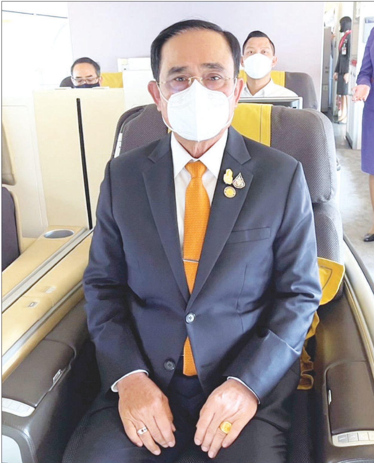
พล.อ.ประยุทธ์ จันทร์โอชา นายกรัฐมนตรีและ รว.ภค.ท. พร้อมคณะ ขณะออกเดินทางไปยังกรุงวอชิงตัน สหรัฐอเมริกา เพื่อเข้าร่วมการประชุมสุดยอดอาเซียน-สหรัฐอเมริกา สมัยพิเศษ (ASEAN-U.S. Special Summit) ครั้งที่ 2 ระหว่างวันที่ 12-13 พ.ค.นี้