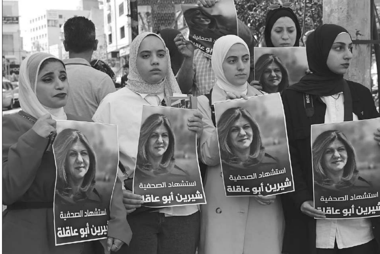
สำนักข่าว • ชาวปาเลสไตน์ในเมืองเฮบรอนถือภาพถ่ายของชีรีน อานู อักเลห์ ผู้สื่อข่าวหญิงของสถานีโทรทัศน์อัลจาซีราที่ถูกยิงเสียชีวิตระหว่างรายงานข่าวทหารอิสราเอลจู่โจมค่ายผู้ลี้ภัยในเมืองเจนนิน เขตเวสต์แบงก์ เมื่อวันที่ 11 พฤษภาคม

ภรรยาของทหารยูเครนกลุ่มหนึ่งที่มาถึงของพวกเขาคือเป็นทหารในกองพันอาซอฟที่ยังคงปักหลักอยู่ในโรงงานเหล็กอาซอฟสตัลในเมืองมารีอูโพล ที่นั่น