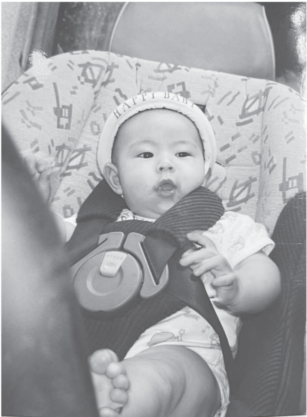
ภาพ : เจ้าต้นคนโตในวัยยังไม่ถึงขวบปี

ปัจจุบันมี 96 ประเทศทั่วโลกที่มีกฎหมายบังคับใช้ที่นั่งนิรภัยสำหรับเด็กแล้ว หลายประเทศให้ความสำคัญกับเรื่องคาร์ซีตและบังคับใช้กฎหมายมานานแล้ว มีประเทศที่เข้ม เช่น ในประเทศเยอรมนี นอกจากจะบังคับสำหรับเด็กที่มีอายุน้อยกว่า 12 ปี หรือส่วนสูงน้อยกว่า 150 เซนติเมตร ยังครอบคลุมไปถึงรถแท็กซี่ต้องมีคาร์ซีตสำหรับเด็กด้วย ส่วนเรื่องที่มีลูกหลายคนทำอย่างไร ก็มีประเทศเนเธอร์แลนด์ที่กำหนดให้เด็กที่มีความสูงไม่เกิน 135 เซนติเมตร ต้องใช้คาร์ซีตสำหรับเด็ก และถ้าต้องการให้เด็กจำนวนสามคนนั่งในรถยนต์บนเบาะหลังแต่มีที่ว่างสำหรับคาร์ซีตแค่ 2 ที่นั่ง เด็กอายุ 3 ปีขึ้นไป