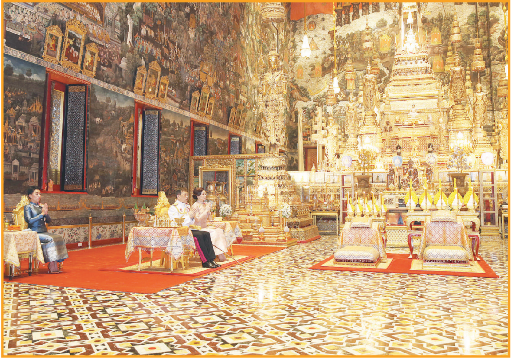
เมื่อวันที่ 12 พ.ค.2565 เวลา 17.00 น. พระบาทสมเด็จพระเจ้าอยู่หัวฯ และสมเด็จพระนางเจ้าฯ พระบรมราชินี เสด็จพระราชดำเนินพร้อมด้วย สมเด็จพระเจ้าลูกเธอ เจ้าฟ้าพัชรกิติยาภา นเรนทิราเทพยวดี กรมหลวงราชสาริณีสิริพัชร มหาวัชรราชธิดา ไปยังพระอุโบสถวัดพระศรีรัตนศาสดาราม ในพระบรมมหาราชวัง เนื่องในพระราชพิธีพืชมงคลจรดพระนังคัลแรกนาขวัญ พุทธศักราช 2565