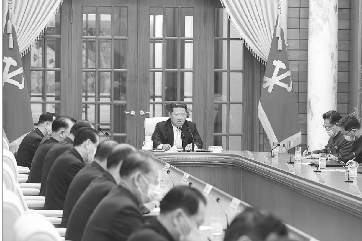
รับมือโควิด • คิม จองอึน ผู้นำเกาหลีเหนือ นั่งเป็นประธานการประชุมกรรมการบริหารพรรคแรงงานเกาหลีในกรุงเปียงยาง หลังมีรายงานผู้ป่วยโควิด-19 ในประเทศครั้งแรก เมื่อวันที่ 12 พฤษภาคม

คิมมีคำสั่งให้ทุกเมืองทั่วประเทศใช้มาตรการล็อกดาวน์พื้นที่ของตน แต่ยังไม่มีการให้รายละเอียดถึงมาตรการล็อกดาวน์ที่จะบังคับใช้ ตามรายงานของเคซีเอ็นเอระบุว่า คิมกล่าวต่อที่ประชุมว่า เป้าหมายคือต้องรักษาผู้ติดเชื้อให้หายโดยเร็วที่สุดเพื่อจำกัดแหล่งของการแพร่เชื้อไวรัสเกาหลีเหนือจะระงับสถานการณ์ฉุกเฉินครั้งนี้ในที่สุด