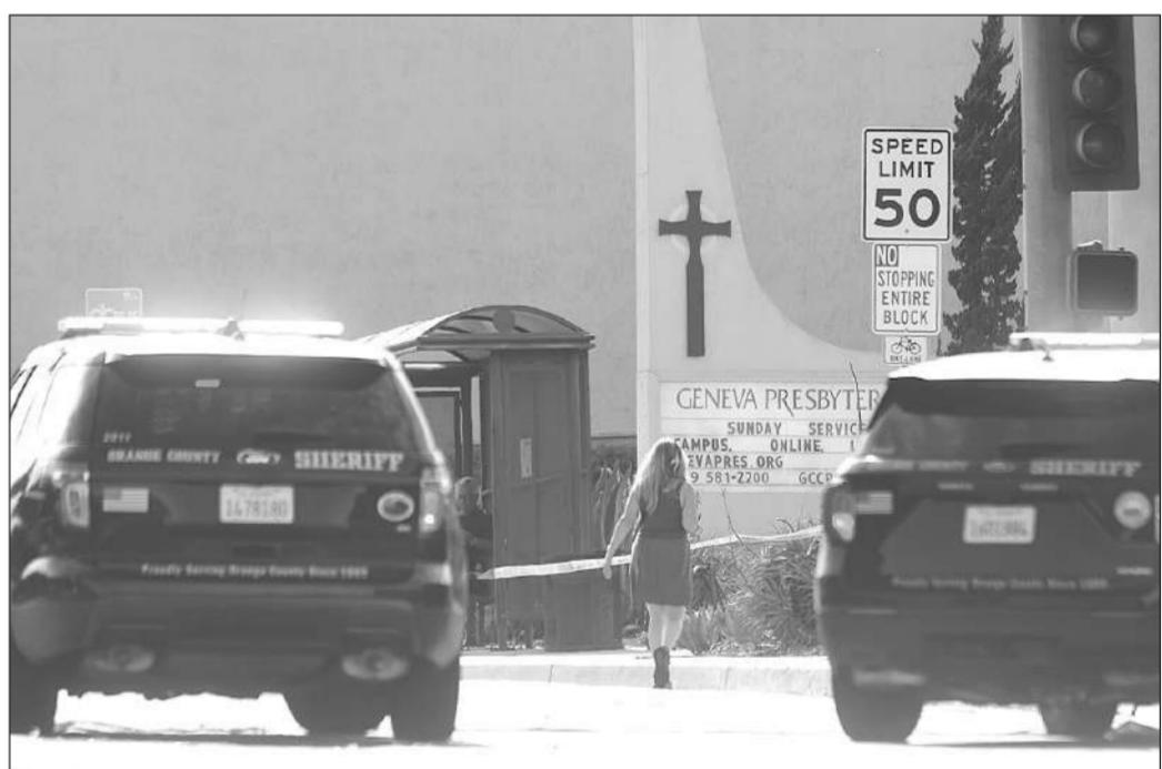
ยิงในโบสถ์ • รถตำรวจจอดหน้าโบสถ์เจนีวาเพรสไบทีเรียน เมืองลา구나วาลล์ รัฐแคลิฟอร์เนีย ที่เกิดเหตุยิงในโบสถ์ มีผู้เสียชีวิต 1 ราย บาดเจ็บ 4 ราย เมื่อวันที่ 15 พฤษภาคม

ทั้งหมด 200 คนที่ยื่นขออภิปราย ส่วนผลโพลล่าสุดของชาวฟินแลนด์ต่อเรื่องนี้ มีผู้สนับสนุนให้ฟินแลนด์เข้าร่วมนาโตมากกว่า 3 ใน 4 ส่วนนายกรัฐมนตรีคริสตาลีลา แอนเดอร์สัน ของสวีเดน ท้าหรือในเรื่องนี้ต่อที่ประชุมรัฐสภาในวันเดียวกัน ก่อนที่รัฐบาลสวีเดนจะประกาศการสมัครเป็นสมาชิกนาโตอย่างเป็นทางการ แอนเดอร์สันกล่าวต่อที่ประชุมรัฐสภาว่า สวีเดนเป็นประเทศเดียวในภูมิภาคทะเลบอลติกที่ไม่ได้เป็นสมาชิกนาโตนับเป็นร้อยเอ็ดมาก ในสถานการณ์รัสเซียบุกยูเครนยิ่งเพิ่มความกดดันต่อสวีเดน และจากที่ฟินแลนด์แสดงเจตจำนงสมัครเป็นสมาชิกนาโต เพื่อความมั่นคงของประเทศ สวีเดนควรสมัครเป็นสมาชิกนาโตพร้อมฟินแลนด์.