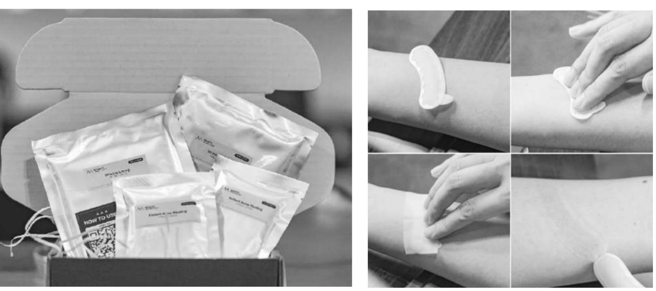
เข็มฉีดยาแบบแปะไมโครนีดเดิล