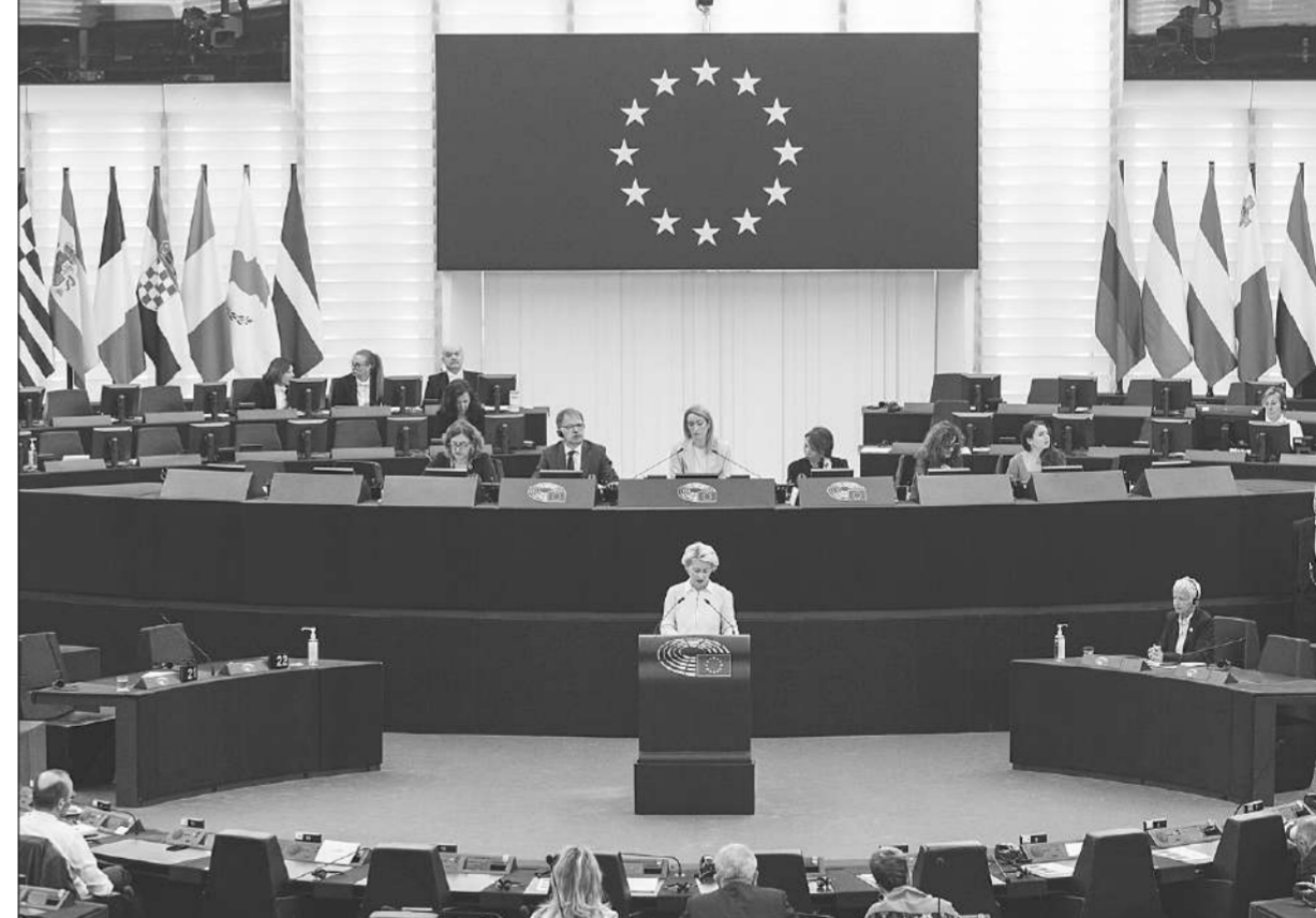
กตัตันต ● อูร์ซูลา ฟอน เดอร์ ลอเอิน ประธานคณะกรรมาธิการยุโรป แถลงต่อที่ประชุมรัฐสภายุโรปที่เมืองสตราสบูร์ก เสนอมาตรการคว่ำบาตรรัสเซียรอบใหม่ รวมถึงห้ามนำเข้าน้ำมันจากรัสเซีย เมื่อวันที่ 4 พฤษภาคม

อูร์ซูลา ฟอน เดอร์ ลอเอิน ประธานคณะกรรมาธิการยุโรป กล่าวต่อที่ประชุมรัฐสภายุโรปที่เมืองสตราสบูร์กเมื่อวันพุธว่า ประธานาธิบดีวลาดิมีร์ ปูติน จะต้องชดเชยและชดใช้ในราคาที่สูงสำหรับการรุกรานที่โหดเหี้ยมของรัสเซียต่อยูเครน