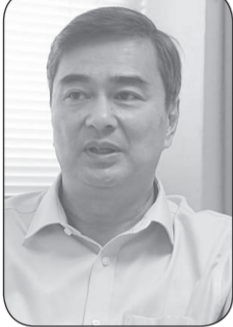
อภิสิทธิ์ เวชชาชีวะ