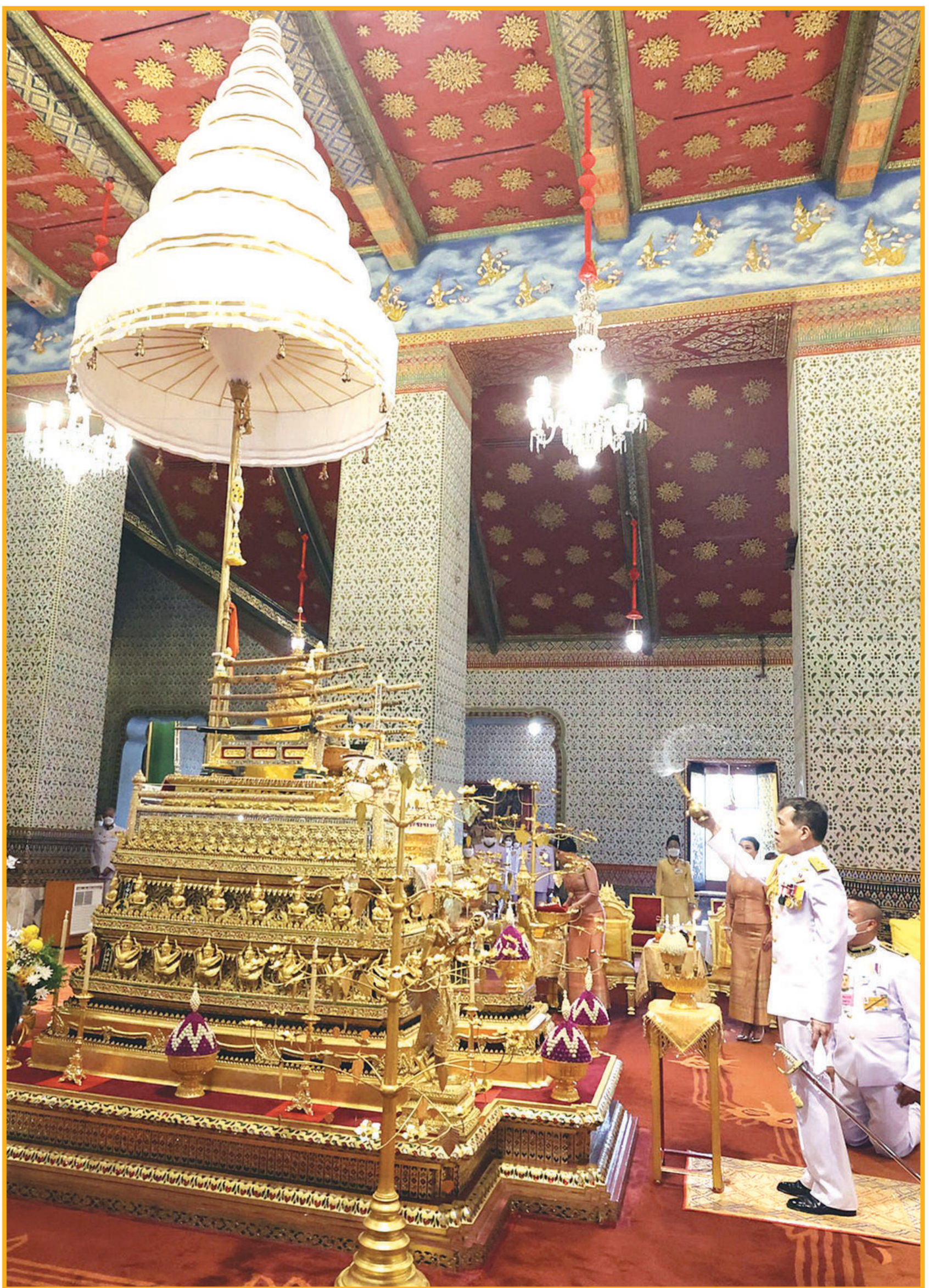
พระบาทสมเด็จพระเจ้าอยู่หัว และสมเด็จพระนางเจ้าฯ พระบรมราชินี เสด็จพระราชดำเนินไปในการพระราชพิธีฉัตรมงคล พุทธศักราช 2565 ณ พระที่นั่งอมรินทรวินิจฉัย ในพระบรมมหาราชวัง

สองชั้นบูชาพระพุทธรูปวิฆเนศวร์ รัชกาลที่ 1 ถึงรัชกาลที่ 7 และรัชกาลที่ 9 ที่หน้าพระที่นั่งบุษบกมาลา ทรงกราบ ทรงศีล สมเด็จพระอริยวงศาคตญาณ สมเด็จพระสังฆราช สกลมหาสังฆปริณายก ถวายศีล พระสงฆ์ถวายพรพระ จบแล้ว เสด็จพระราชดำเนินไปทรงประเคนปืนได้กัศัตถาหาร แต่ประธานสงฆ์และสมเด็จพระราชาคณะ นอกนั้น ทรงพระกรุณาโปรดเกล้าโปรดกระหม่อมให้พระราชวงศ์ องคมนตรี และข้าราชการชั้นผู้ใหญ่ ทรงประเคน และประเคนจนครบ 20 รูป เสร็จแล้ว ทรงประเคนจตุปัจจัยไทยธรรมแด่สมเด็จพระราชาคณะ พระราชาคณะเจ้าคณะรอง และพระราชาคณะ จนครบ 20 รูป ทรงหลังทักษิณทก พระสงฆ์ถวายอนุโมทนา ถวายอดิเรก ถวายพระพรลา จากนั้น เสด็จพระราชดำเนินไปทรงจุดเทียนเครื่องทองน้อยบูชาเทวดาที่รักษาพระนพปฎลมหาเศวตฉัตร เครื่องราชกกุธภัณฑ์ ทรงคม พราหมณ์เบิกแว่นเทียนสมโภชพระนพปฎลมหาเศวตฉัตร เครื่องราชกกุธภัณฑ์ ครบ 3 รอบ พราหมณ์เจิมพระนพปฎลมหาเศวตฉัตรแล้ว โหรงหลวงผูกผ้าสีชมพู เสร็จแล้ว พระบาทสมเด็จพระเจ้าอยู่หัว เสด็จพระราชดำเนินไปทรงพระสุหร่าย เครื่องราชกกุธภัณฑ์ และพระราชสัญลักษณ์พระครุฑพ่าห์ทองคำประจำรัชกาลที่พระแทนพระนพปฎลมหาเศวตฉัตร แล้วทรงกราบพระพุทธรูปวิฆเนศวร์ รัชกาลที่ 1 อ่านต่อหน้า 15