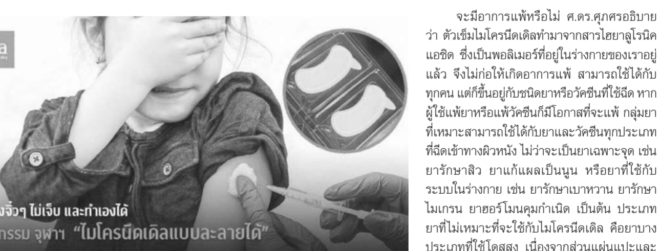
จิตยา เรื่องจิตฯ ไม่เจ็บ และทำเองได้