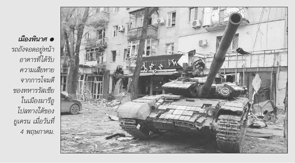
เมืองทินดา ● รถถังจอดอยู่หน้าอาคารที่ได้รับ ความเสียหาย จากการโจมตีของทหารรัสเซีย ในเมืองมารีอูโพลทางใต้ของยูเครน เมื่อวันที่ 4 พฤษภาคม.