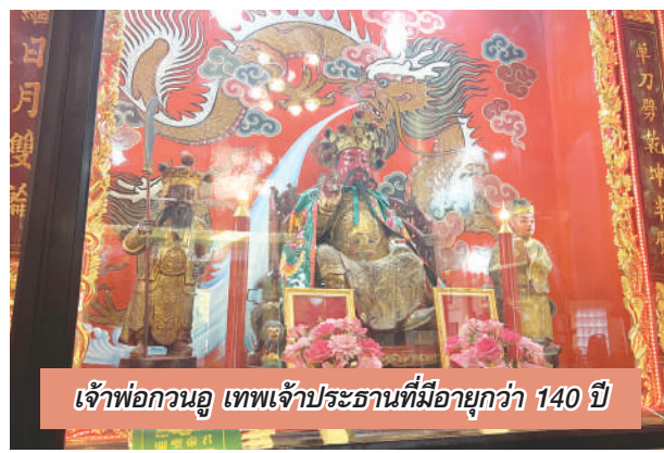
เจ้าพ่อกวนอู เทพเจ้าประธานที่มีอายุกว่า 140 ปี

วรวิหาร ซึ่งเป็นวัดประจำตระกูลมาไว้ที่นี่ เดิมทีไปทางด้านซ้ายของพิพิธภัณฑ์ เป็นที่ตั้งของศาลเจ้าพ่อกวนอู ที่คนไทยเชื้อสายจีนที่ให้ความเคารพศรัทธาอย่างมาก โดยท่านช่วงได้มอบที่ดินให้กว่า 2 ไร่ในการสร้างศาลเจ้า ซึ่งในอดีตเป็นเพียงศาลเจ้าเล็ก เทพเจ้าที่เป็นประธานในศาลคือ เทพเจ้ากวนอู มีลักษณะแตกต่างจากที่อื่น มีอายุอยู่ในห้าพันครา มีชัยถือค้ำกระบี่ เป็นงานแกะสลักจากไม้ มีอายุเก่าแก่กว่า 140 ปี ความวิจิตรงดงามที่ดูขลังน่าไว้วางใจศาลเจ้าพ่อกวนอูคือ ตู้ไม้เก็บป้ายวิญญูณขนาดใหญ่ที่สร้างด้วยความประณีต