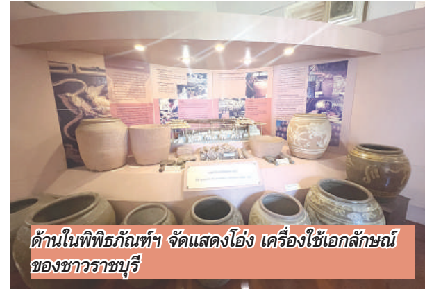
ด้านในพิพิธภัณฑ์ จัดแสดงโถง เครื่องใช้เอกลักษณ์ของชาวราชบุรี