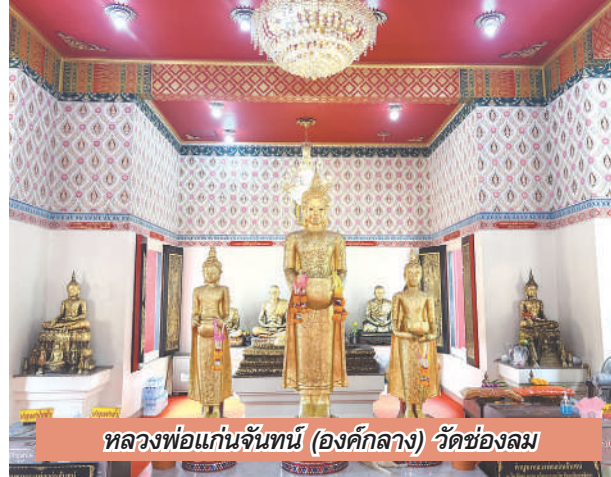
หลวงพ่อแก้วจันทร์ (องค์กลาง) วัดช่องลม