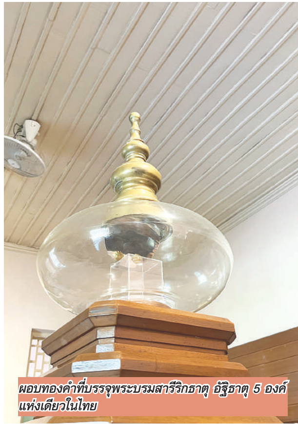
ผอบทองคำที่บรรจุพระบรมสารีริกธาตุ อัฐิธาตุ 5 องค์ แห่งเดียวในไทย