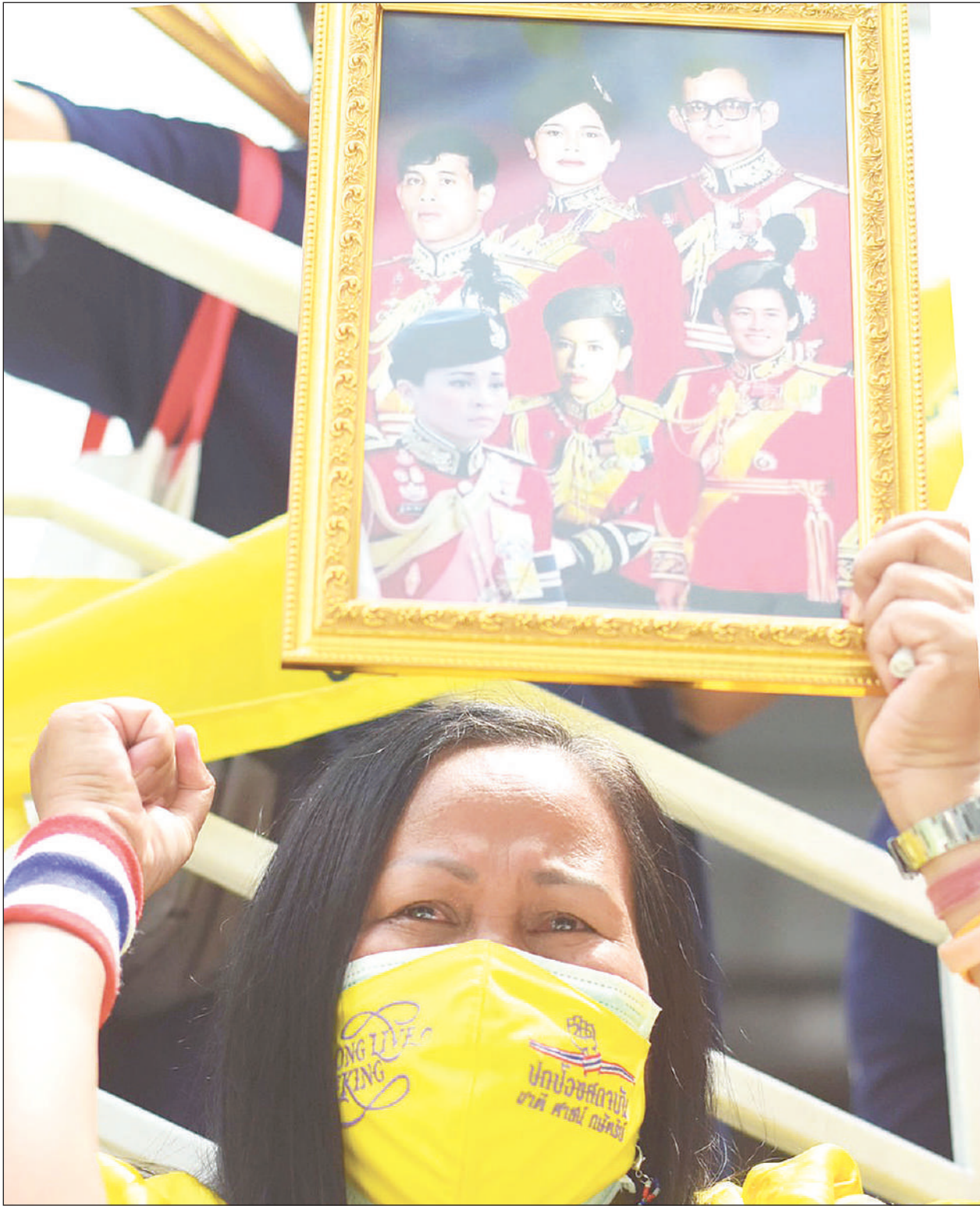
ประชาชนกลุ่มศรัทธารวมประชาชนปกป้องสถาบันถึงกับน้ำตาคลอ ในระหว่างไม่ประท้วงบริษัท ลาซาต้า จำกัด ที่อาคารกรีฑาทาวเวอร์ ด.สุขุมวิท จากโฆษณาที่มีการบูลลี่และล่วงละเมิดสถาบัน

ยังสถานการณ์การเมือง เป็นอีกเรื่องหนึ่งซึ่งมันไม่ได้หมายถึงในตอนนี้นะ วันนี้เราต้องเตรียมการในเรื่องของการชี้แจงเรื่องงบประมาณตามวาระที่เตรียมไว้ ถ้าหากไม่ผ่านการพิจารณาจะเดือดร้อนในส่วนของงบประมาณปี 2566 ที่จะต้องมีการเริ่มใช้ตั้งแต่เดือน ต.ค. เป็นต้นไป ขอร้องให้เข้าใจกันบ้าง และก็ยังมีอีกหลายเรื่องที่ต้องทำให้บ้านเมืองเกิดความสงบ เพราะเรากำลังอยู่ในเรื่องของการท่องเที่ยว รวมทั้งการลงทุนต่างๆ ซึ่งนักลงทุนเขาก็ต้องบอกว่าในประเทศไทยมีความขัดแย้งอะไรมากมายหรือไม่ ถ้าไม่มีอะไรขัดแย้งกันมากมายและอยู่ในเกณฑ์ที่รับได้ก็จะมีมีการเพิ่มการลงทุนในประเทศของเราอีกขึ้น “อะไรที่ขัดแย้งกันมากๆ โดยที่ไม่มี ความจำเป็นก็ไม่ต้องขัดแย้งกันไปทำไมเหมือนกัน ส่วนเรื่องการเดินทางไปต่างประเทศ อ่านต่อหน้า 16