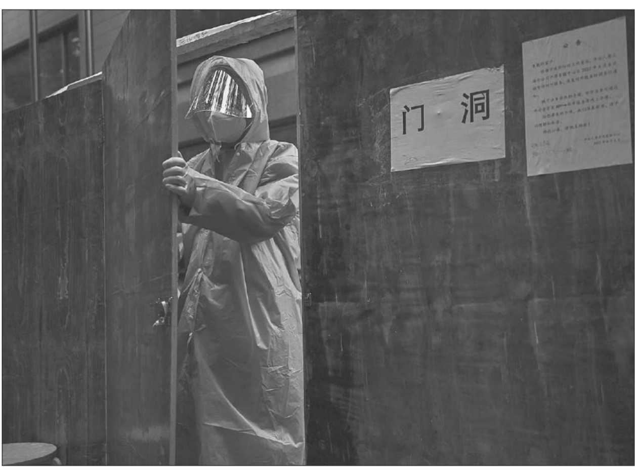
ล็อกดาวน์ • คนงานเตรียมรับสำหรับปิดพื้นที่อยู่อาศัยในเขตของนครเซี่ยงไฮ้ เมื่อวันที่ 10 มิถุนายน หลังทางการมีคำสั่งกลับมาใช้มาตรการล็อกดาวน์ควบคุมโควิด-19 ในบางเขตของเมือง

ลิว ทาร์ล รัฐมนตรีต่างประเทศอังกฤษ โพลิตทางทวีตเตอร์ว่า ของประมวลอย่างที่สุดต่อการตัดสินประหารชีวิตเอเดน อัลลีน และฌอน ฟินเนอร์ โดยศาลที่เป็นตัวแทนของรัสเซียในภาคตะวันออกของยูเครน พวกเขาเป็นเชลยศึก เป็นคำพิพากษาที่หกลกและไม่ใช่ชอบด้วยกฎหมายอย่างยิ่ง โฆษกนายกรัฐมนตรี บอริส จอห์นสัน ของอังกฤษ กล่าวว่า อนุสัญญาเจนีวาว่าด้วยเชลยศึกมีเอกลักษณ์คุ้มครองของผู้ทำการรบ ไม่วางตำแหน่งคดีเชลยศึกโดย