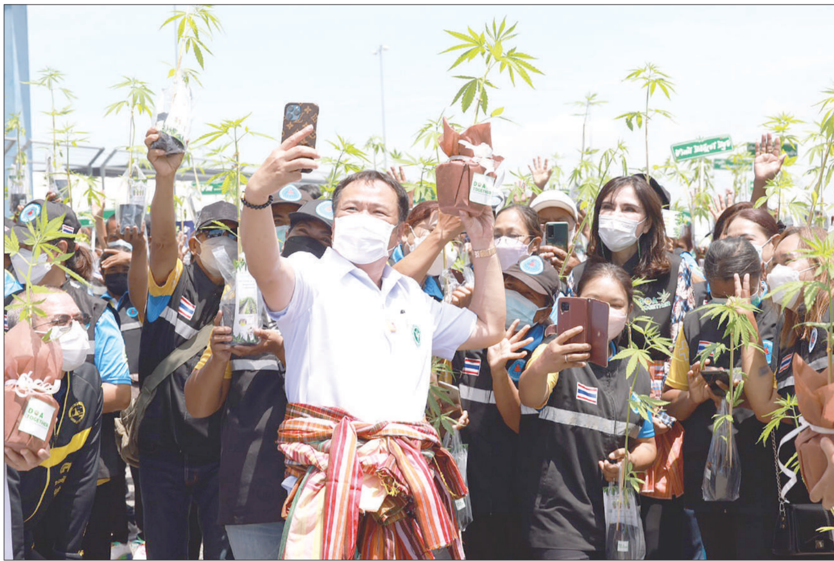
นายอนุทิน ชาญวีรกูล รองนายกรัฐมนตรีและรัฐมนตรีว่าการกระทรวงสาธารณสุข (สธ.) เชลท์หลังเป็นประธานเปิดงานมหกรรมกัญชา 360 องศา ปลดล็อกกัญชาประชาชนได้อะไร ที่สนามช้าง อินเตอร์เนชั่นแนล เซอร์เกิต จ.บุรีรัมย์