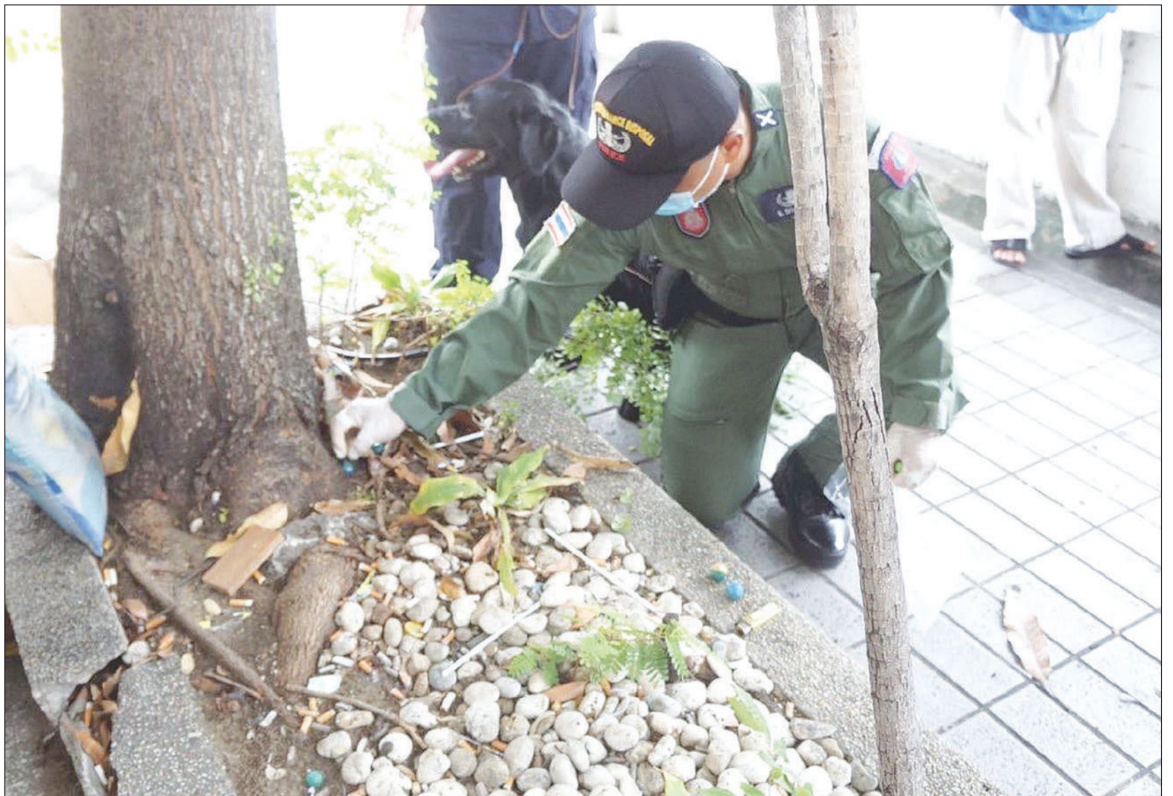
เจ้าหน้าที่ชุดเก็บกวาดขยะบริเวณสวนสามเหลี่ยมดินแดงเพื่อหาสิ่งผิดกฎหมาย โดยพบลูกบอลประทัดจำนวน 17 ลูก บริเวณใต้ถุนอาคารเพชรราวุธ และเคอะแคบปิดตอล คอนโด