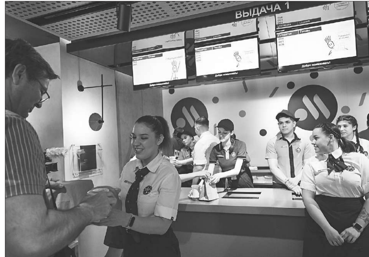
เปิดใหม่ ● พนักงานร้านกุตโนโอดอชกาเสิร์ฟลูกค้าที่ร้านสาขาใหญ่ในกรุงมอสโก เมื่อวันที่ 12 มิถุนายน หลังพิธีเปิดร้านแมคโดนัลด์ในรัสเซียที่กลับมาเปิดใหม่ภายใต้ชื่อและโลโก้ใหม่.

ราคาตั้งแต่ 129 รูเบิล หรือราว 78 บาท ถูกกว่าของแมคโดนัลด์ที่จำหน่ายเมนูนี้ในราคาราว 160