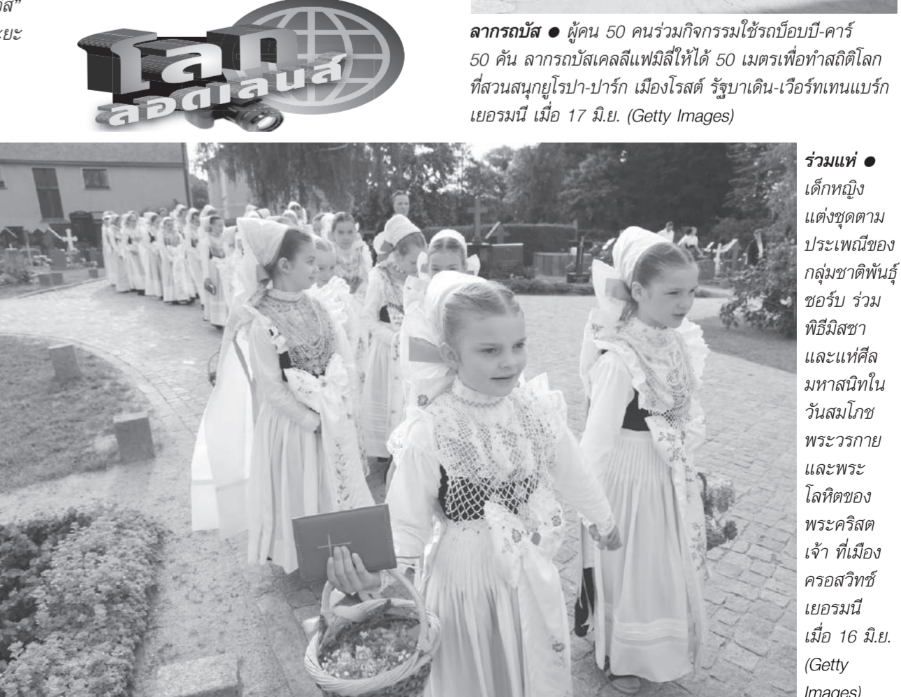
ร่วมแห่ ● เด็กหญิงแต่งชุดตามประเพณีของกลุ่มชาติพันธุ์ซอร์บ รวมพิธีมิสซาและแห่ศีลมหาสนิทในวันสมโภชพระวรกายและพระโลหิตของพระคริสต์เจ้าที่เมืองครอสวิทซ์ เยอรมนี เมื่อ 16 มิ.ย.