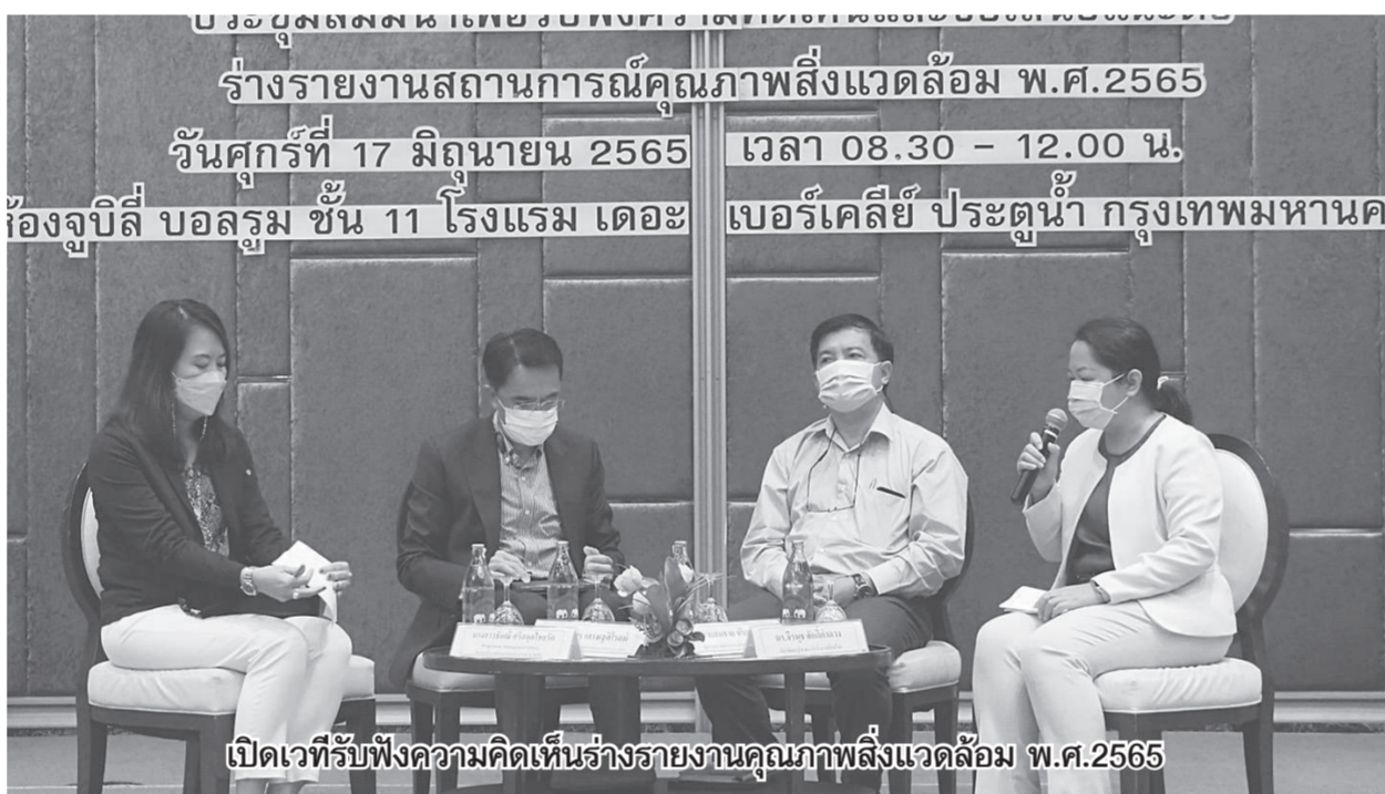
เปิดเวทีรับฟังความคิดเห็นร่างรายงานคุณภาพสิ่งแวดล้อม พ.ศ.2565

หรืออ่อนไหวทางสิ่งแวดล้อม” ดร.วิจารย์กล่าว