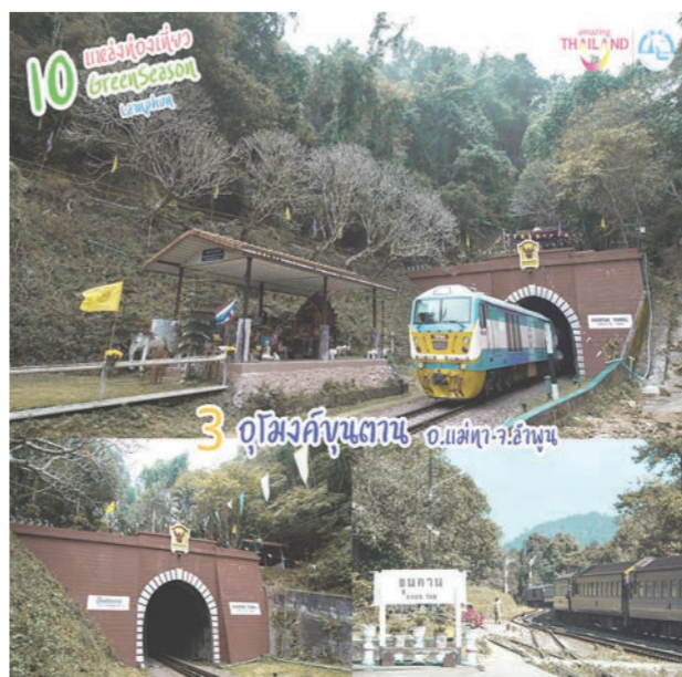
3 อุโมงค์ขุนตาน อ.แม่ทะ จ.ลำปาง