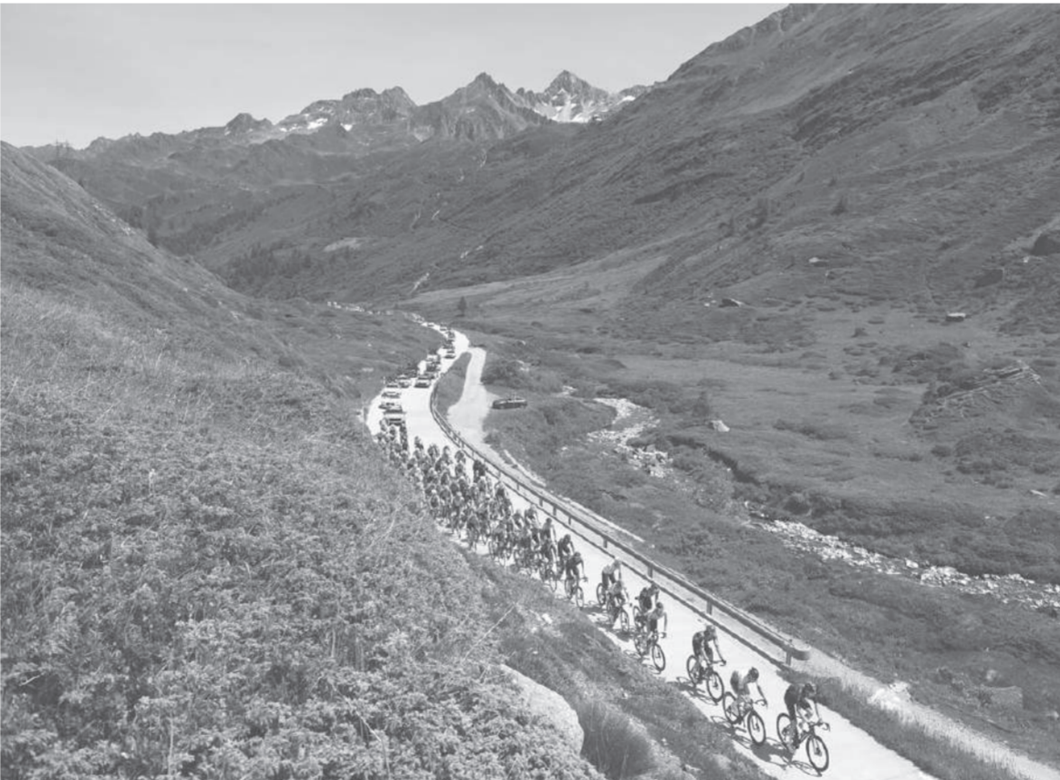
กลางเขา ● ผู้เข้าแข่งขันจักรยานรายการ "ตูร์เดอสวิส" ปั่นผ่านภูเขามูซาลป์ในสวิตเซอร์แลนด์ ในสัปดาห์ 6 ระยะทาง 177.5 กม. เมื่อ 17 มิ.ย.