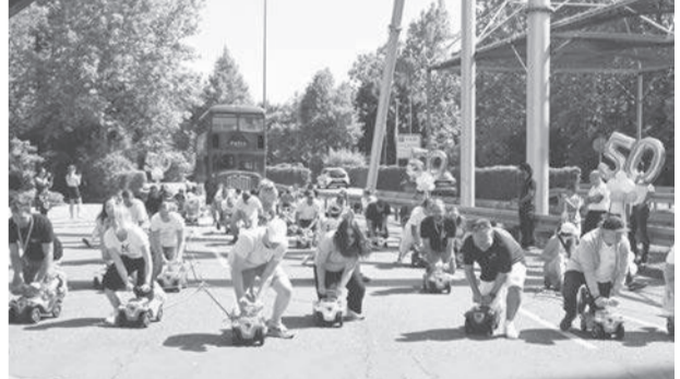
ลากรบัส ● ผู้คน 50 คนร่วมกิจกรรมใช้รถบัสบีบี-คาร์ 50 คัน ลากรบัสเคลลีแฟมิลี่ให้ได้ 50 เมตรเพื่อทำสถิติโลกที่สวนสนุกยุโรป-ปาร์ค เมืองโรสตัน รัฐบาเนน-เวียร์เทนแบร์ก เยอรมนี เมื่อ 17 มิ.ย.