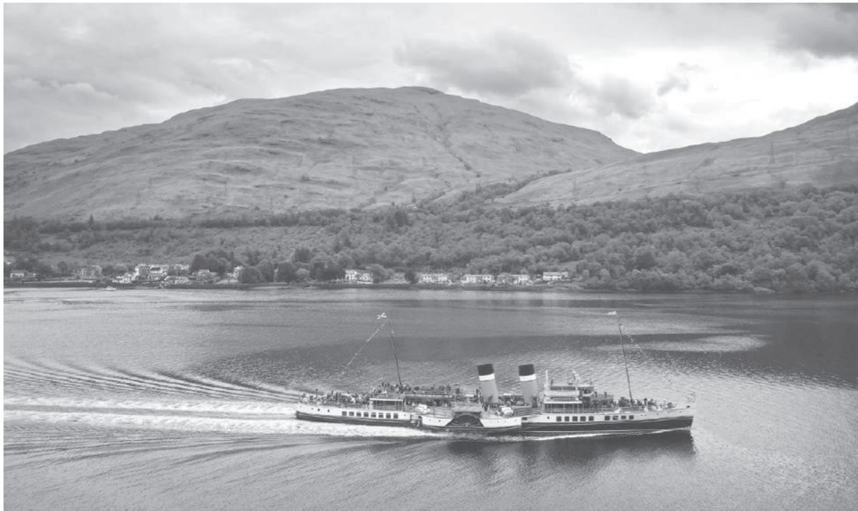
ล่องเรือ ● เรือกลไฟเฟเวอริลีย์กำลังแล่นอยู่ในทะเลสาบลองท์หมู่บ้านอาร์โรซา สกอตแลนด์ เพื่อฉลองเรือลำนี้มีอายุครบ 75 ปี เมื่อ 16 มิ.ย.