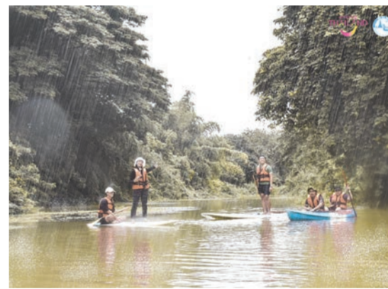
PEG Farm Thailand อ.เมือง จ.ลำปาง แหล่งท่องเที่ยวสำหรับสายผจญภัย