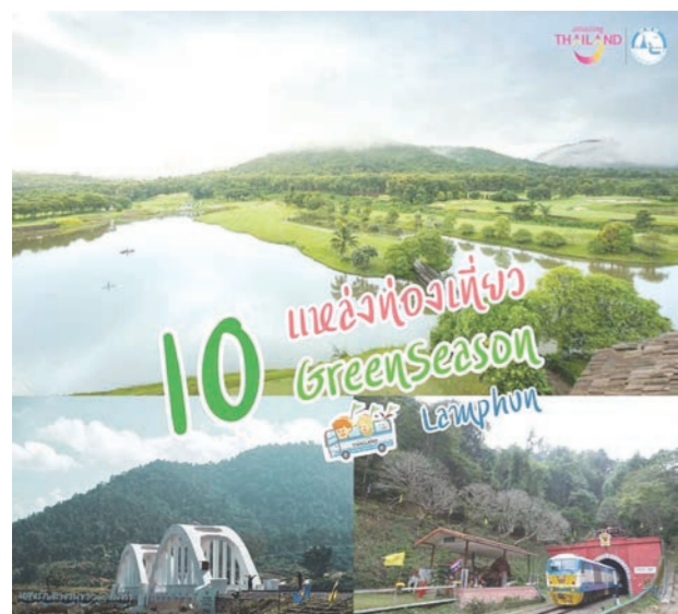
แหล่งท่องเที่ยวยอดนิยมช่วง Green Season