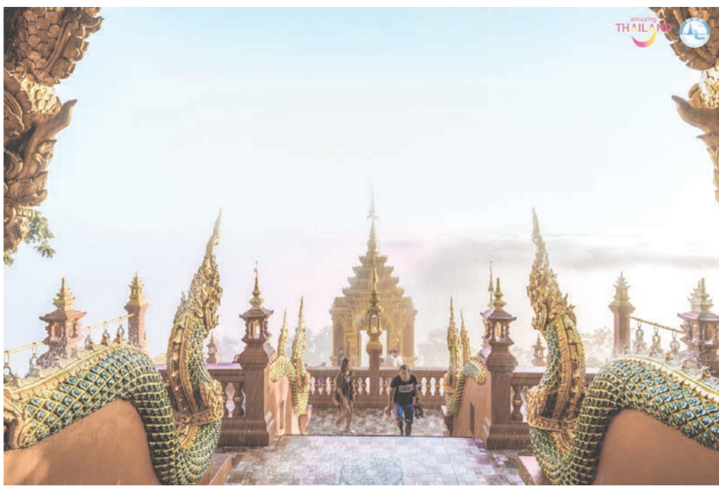
วัดพระธาตุยอดพระผาง อ.แม่ทะ จ.ลำปาง

สำหรับผู้ที่มาเยือนจังหวัดลำปางแล้ว สามารถเดินทางต่อไปยังจังหวัดลำพูน