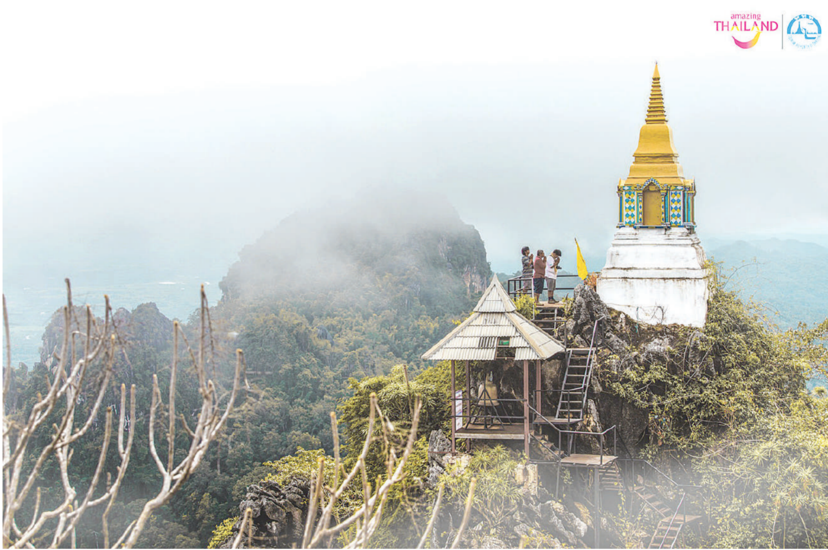
วัดพุทธบาทสุทธาวาส อ.แจ้ห่ม จ.ลำปาง