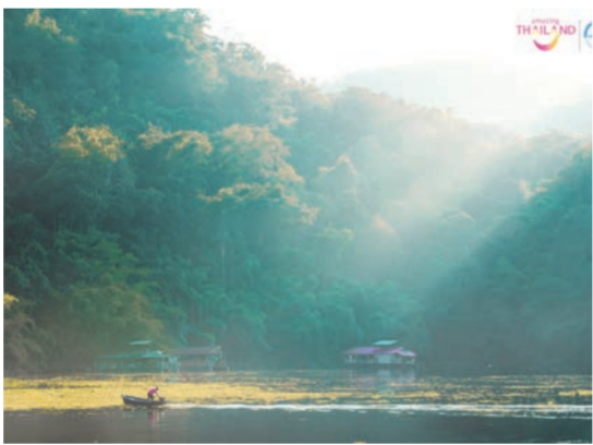
เขื่อนกิ่วลม อ.เมือง จ.ลำปาง