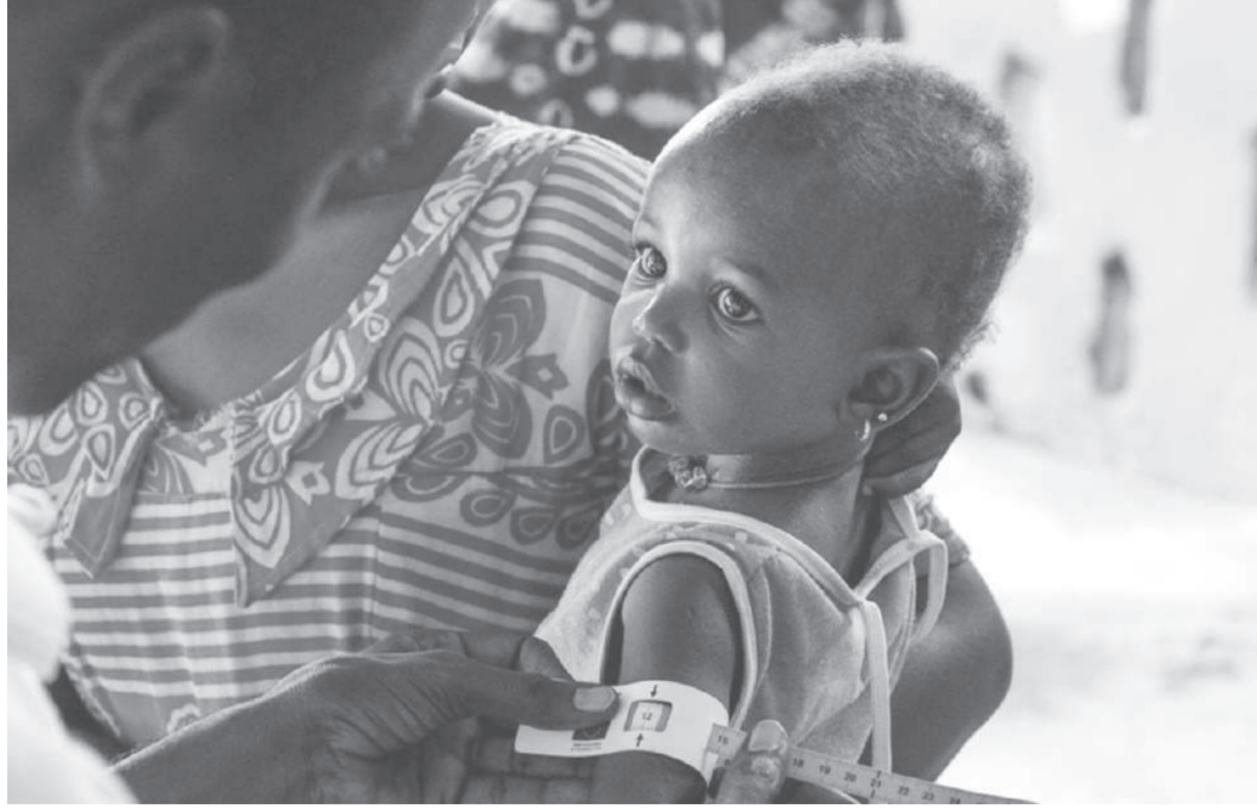
ภาพ: โลกมีอาหารพอสำหรับทุกคนแต่ทุกวันนี้ 811 ล้านคนอดอยาก