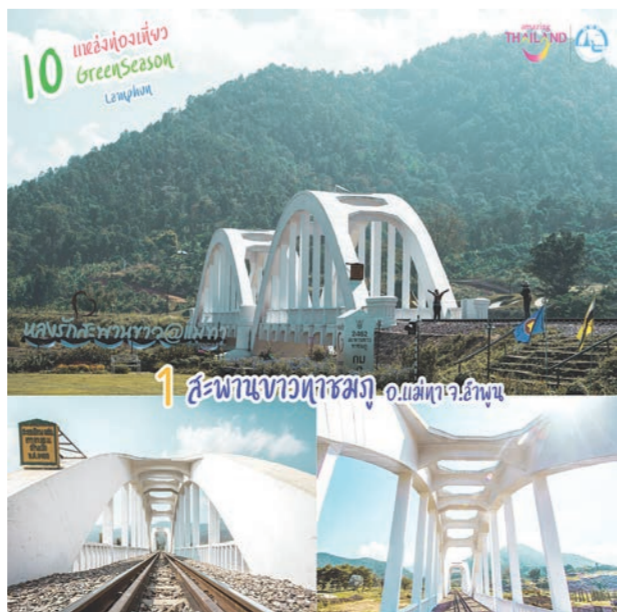
1 สะพานทอผ้าห่ม อ.แม่ทะ จ.ลำปาง