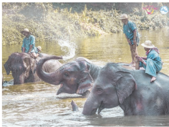
ศูนย์อนุรักษ์ช้างไทย อ.ห้างฉัตร จ.ลำปาง