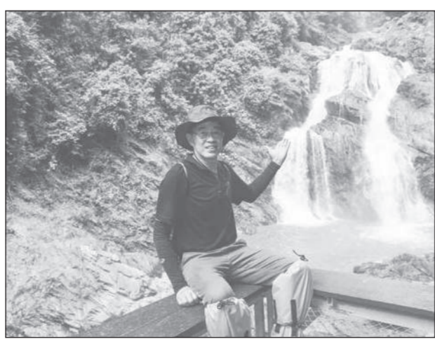
เกี่ยวกับธรรมชาติ ตระหนักถึงคุณค่าของป่าต้นน้ำซึ่งเป็นต้นทางหล่อเลี้ยงสรรพชีวิต การอยู่ร่วมกับสิ่งมีชีวิตอื่นอย่างเกื้อกูลและร่วมรักษาไว้เพื่อส่งต่อให้คนรุ่นต่อไป