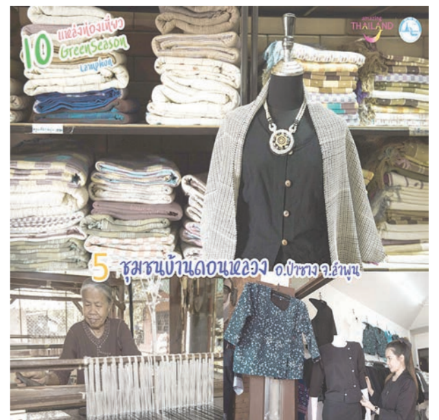
5 ร้านบ้านดอนนาง อ.ปรางค์กู่ จ.ลำพูน