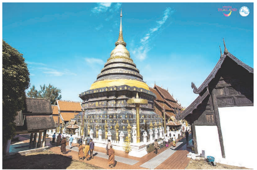
วัดพระธาตุลำปางหลวง อ.เกาะคา จ.ลำปาง