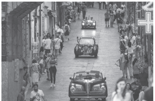
แข่งรถ ● รถวินเทจที่เข้าแข่งขันในรายการแข่งรถมิลเลียมิลเลีย การแข่งรถรายการเก่าแก่ของอิตาลี ขณะขับผ่านถนนในเมืองเรียดี เมื่อ 16 มิ.ย.