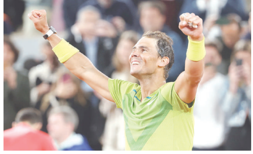
คว่ำมือ 1 • ราฟาเอล นาดาล ยอดนักเทนนิสจากสเปนฉลองหลังคว้าชัยชนะเหนือ โนวัก ยอโควิช มือ 1 โลกจากเซอร์เบีย 6-2, 4-6, 6-2, 7-6 (7/4) ในรอบก่อนรองชนะเลิศชายเดี่ยว เฟรนช์ โอเพ่น ที่โรลิ่งดี การ์รอส ในกรุงปารีส ประเทศฝรั่งเศส

ส่วน โนวัก ยอโควิช นักเทนนิสหมายเลข 1 ของโลกจากเซอร์เบีย กล่าวว่า การพ่ายแพ้ครั้งนี้เป็นการพ่ายนวดนอลในการแข่งขันรายการเฟรนช์ โอเพ่น เป็นครั้งที่ 8 จากการเจอกันทั้งหมด 10 ครั้ง "เขาเป็นผู้เล่นที่ดีกว่าในช่วงเวลาที่สำคัญ" ยอโควิชกล่าว "แสดงให้เห็นว่าเขาถึงเป็นแชมป์ที่ยอดเยี่ยม การยืนเล่นอยู่ตรงนั้นด้วยสภาพจิตใจที่แข็งแกร่งและจบแมตช์ได้อย่างที่เขาทำ คือขอแสดงความยินดีกับเขาและทีมงาน ไม่มีอะไรต้องสงสัย เขาเหมาะสมแล้วที่จะชนะแมตช์นี้" ยอโควิชมีโอกาสนี้โรมเมื่อเดือนที่แล้ว ไปถึงเซตตัดสินหลังจากที่เขาผ่านการแข่งขันในเซตที่ 4 อยู่ 5-2 เกม อย่างไรก็ตาม นาดาลซึ่งกำลังจะอายุครบ 36 ปี ในวันที่ครั้งนี้จะเป็นวันที่เขาลงเล่นกับ อเล็กซานเดอร์ ซเวเรฟ ในรอบรอง