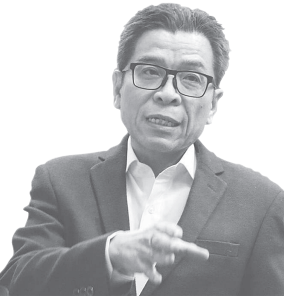
นายแสวง บุญมี เลขาธิการ กกต.

ข้อพิพาทในนามสำนักงาน กกต.ว่า กกต.ตั้งขึ้นมาทำหน้าที่ตามกฎหมาย ไม่ได้ตั้งขึ้นมาเพื่อทำตามความต้องการของผู้ใด สิ่งที่เราทำทุกอย่าง ต้องเป็นเรื่องที่ถูกกฎหมาย เราทราบความรู้สึก หรือกระแสของสังคมทุกการเลือกตั้ง แต่ความรู้สึก หรือกระแสที่เกิดขึ้นไม่ได้ทำให้เราต้องละเลยความถูกต้องตามกฎหมาย เพราะความถูกต้องไม่ว่าเมื่อวาน วันนี้ หรืออนาคตก็ยังคงเป็นความถูกต้อง ไม่ว่าผู้แพ้หรือผู้ชนะก็ต้องการความถูกต้อง