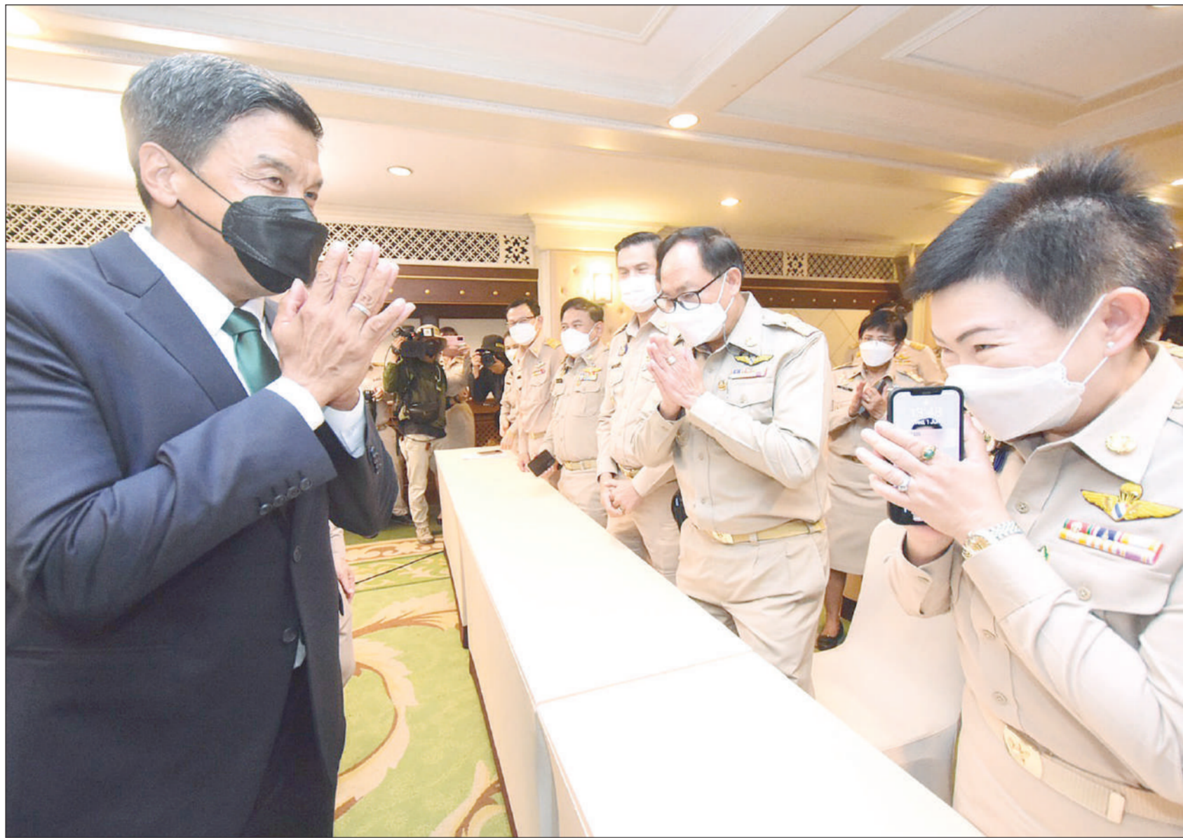
นายชัชชาติ สิทธิพันธุ์ ผู้ว่าราชการกรุงเทพมหานคร ได้เดินทางเข้าทำงานที่ศาลาว่าการกรุงเทพมหานคร เสาชิงช้า เป็นวันแรก โดยพบปะข้าราชการ พร้อมเปิดตู้ที่มงานบริหาร กทม.

ไทยโพสต์ • "ประยุทธ์" พอใจภาพรวมชี้แจงร่าง พ.ร.บ.งบประมาณปี 2566 "พท." ชัดเป็นฉบับชุดรีด ปชช. บอกลดเงินกู้เสียงวิจารณ์ "มีกตุ" คริวออกทูตมรดิใคร ยันรับผิดชอบทุกอย่าง เน้น "ก้าวไกล" ใช้เวลาพิจารณางบหาเสียงผิดเวที "พชช" สวนตัวอย่างเดียว โดนหาเล่นการเมือง "หมอมชสนาน" ผ่าถึงคนเขียนไทยค่าต่อนายกาอย่าใส่อารมณ์มาด้วย "ก้าวไกล" ชงตัดงบศาล รธน. 100% อ้างไม่เข้าใจคำว่า "ปฏิรูป-ล้มล้าง" สะพัด โหวตวาระแรกผ่านฉลุย หลังกลุ่มพรรคเล็กเสียงแตก กิวรธนรมนัสลดท่าที่แข็งกร้าว เพื่อไทยคุมเสียงไม่ได้หมดทางโหวตจัดสรร กมธ.บ.ฯ ลงตัว