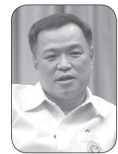
อนูทิน ชาญวีรกุล

● กลายเป็นปัญหาสำหรับ 1 ที่นั่งปาร์ตี้ลิสต์ที่หายไป "รังสิมันต์ โรม" ส.ส.บัญชีรายชื่อและโฆษกพรรคก้าวไกล ซึ่งเคยแบกก่อนสภาจะเลือก ส.ส.บัญชีรายชื่อของพรรคภูมิใจไทย สลับพรรค "ลำลิ รักรุณี" โดยยกผล นายชัยวุฒิ ธนาคมานุสรณ์ ส.ส.บัญชีรายชื่อ พรรคก้าวไกล ที่พ้นสมาชิกภาพกรณีมือปืนสือ แล้วไม่สามารถเลื่อนรายชื่อในบัญชีลำดับถัดไปของพรรคมาเป็น ส.ส.ได้ เนื่องจากนายชัยวุฒิมาจากการเลือกตั้งของพรรคอนาคตใหม่ที่ถูกยุบ ย้อนไปดูคำพิพากษาของศาลรัฐธรรมนูญเมื่อวันที่ 28 ต.ค.63 ในตอนท้ายระบุว่า "ศาลรัฐธรรมนูญโดยเสียงข้างมากเห็นว่า ในคดีนี้วินิจฉัยที่ 5/63 เมื่อวันที่ 21 ก.พ.63 ที่ใหญ่พรรคอนาคตใหม่ พรรคจึงไม่มีรายชื่อสมาชิกในลำดับถัดไปที่จะเลื่อนขึ้นมาแทน เป็นกรณีเหตุทำที่ ส.ส.บัญชีรายชื่อ