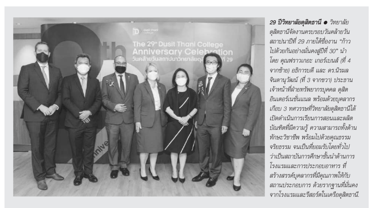
ความสำคัญของการจัดการศึกษาที่ต้องดำเนินการในภูมิภาคและอนุภูมิภาคเอเชีย-แปซิฟิกภายหลังการแพร่ระบาดของโควิด-19 โดยจะนำไปสู่การฟื้นฟูและการจัดการวิกฤตการเรียนรู้ การพลิกโฉมการศึกษาและระบบการศึกษาเพื่อให้ความเท่าเทียม ครอบคลุม เชื่อมโยง ตอบสนองและยืดหยุ่น ส่งผลต่อศักยภาพของเด็ก เยาวชน และผู้ใหญ่ทั่วทั้งภูมิภาคเอเชีย-แปซิฟิก

สำหรับจุดเน้นของการประชุมดังกล่าวต้องการสร้างความตระหนักถึงสถานการณ์การแพร่ระบาดของโรคติดเชื้อไวรัสโคโรนา 2019 หรือโควิด-19 ซึ่งก่อให้เกิดความผันผวนที่คาดการณ์ไม่ได้และมีผลกระทบต่อการศึกษามากมายในระดับโลกและภูมิภาค รวมถึงผลสัมฤทธิ์ทางการศึกษาและสุขภาพความเป็นอยู่ที่ดีของผู้เรียน ส่งผลกระทบต่อการบรรลุเป้าหมายการพัฒนาที่ยั่งยืน โดยเฉพาะเป้าหมายที่ 4 ด้านการศึกษา โดยการประชุม APREMC II จะมีผู้แทนระดับรัฐมนตรีจากประเทศสมาชิกยูเนส