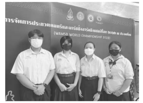
ตัวแทนประเภท Marching Parade (Drumline Battle) โรงเรียนสิริรัตนาร