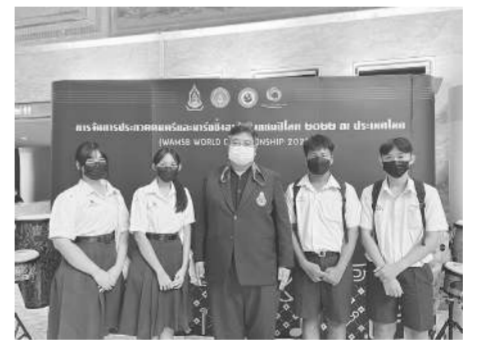
ตัวแทนประเภท Concert Band (World Division) จากทีมโรงเรียนราชประชาสามาลัย ฝ่ายมัธยม รัชดาภิเษก