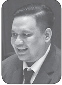
ไม่ ลิกค์

ไทยโพสต์ "อิสรภาพแห่งความคิด" www.thaipost.net งบประมาณ 66 กล้วย ถึงแม้เสียงรัฐบาลจะเพิ่งหายไป 2 เสียง หลัง สืบคดีก่อนศาลฎีกาส่งให้นายวัฒนา สิทธิวัง หลุดจากเก้าอี้ ส.ส.พรรคพลังประชาชนฯ และให้จัดเลือกตั้งซ่อม ส.ส.เขต 4 ลำปาง เนื่องจากได้รับเลือกตั้งมาโดยไม่สุจริตเที่ยงธรรม และเมื่อวันที่ 1 พฤษภาคม 2566 งบ 16 คน และ ส.ส.เขต 4 ลำปาง เนื่องจากได้รับเลือกตั้งมาโดยไม่สุจริตเที่ยงธรรม และเมื่อวันที่ 1 พฤษภาคม 2566 งบ 16 คน และ ส.ส.เขต 4 ลำปาง เนื่องจากได้รับเลือกตั้งมาโดยไม่สุจริตเที่ยงธรรม