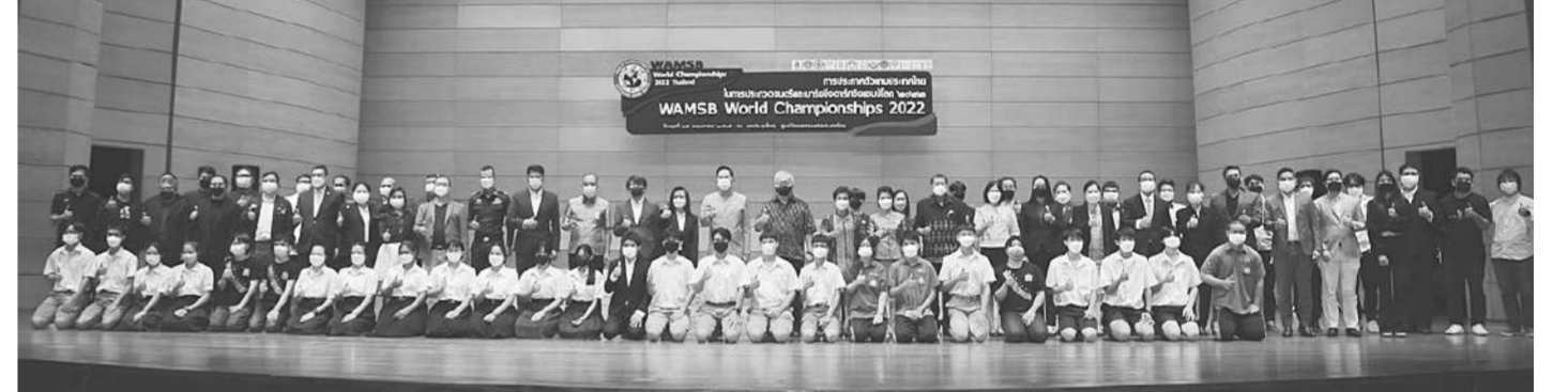
บรรยากาศการประกวดตัวแทนประเทศไทย

นี้ ว่าเป็นความฝันอันยิ่งใหญ่สำหรับเยาวชนไทยที่มีใจรักทางดนตรี ในการโชว์ศักยภาพ ทักษะความสามารถทางด้านดนตรีสู่สายตาชาวโลก ในเวทีการประกวดที่ประเทศไทยได้เป็นเจ้าภาพจัดการประกวดดนตรีและมาร์ชชิงอาร์ทชิงแชมป์โลก 2565 (WAMSB World Championship 2022) ครั้งแรก เพราะถือเป็นอีกหนึ่งการประกวดที่ได้รับการรับรองมาตรฐานการแข่งชิงจากองค์กรระดับโลก ล่าสุด กระทรวงวัฒนธรรม โดยกรมส่งเสริมวัฒนธรรม ร่วมกับสมาคมดนตรีและมาร์ชชิงอาร์ทสากล ได้ประกาศรายชื่อตัวแทนประเทศไทยที่ผ่านการคัดเลือกเข้าประกวดชิงแชมป์โลก ใน 6 ประเภท ประกอบด้วย 1.ประเภท Concert Band ได้แก่ Division 1 จำนวน 7 โรงเรียน, World Division จำนวน 11 โรงเรียน 2.ประเภท Indoor Show Band ได้แก่ Division 1 จำนวน 2 โรงเรียน, World Division จำนวน 2 โรงเรียน 3.ประเภท Marching Parade ได้แก่ Division 1 จำนวน 3 โรงเรียน, Color Guard (World Division) จำนวน 2 โรงเรียน, Drumline Battle จำนวน 4 โรงเรียน 4.ประเภท Ensemble ได้แก่ Brass Ensemble จำนวน 4 โรงเรียน, Woodwind Ensemble จำนวน 8 โรงเรียน, Mixed Ensemble จำนวน 12 โรงเรียน, Marching Percussion Ensemble จำนวน 3 โรงเรียน 5.ประเภท Solo (Winds Instrument) จำนวน 24 คน แยกเป็น Drum or Multi-Percussion จำนวน 2 คน ประเภท Keyboard Percussion จำนวน 3 คน ประเภท Marching Percussion จำนวน 3 คน และ 6.ประเภท Showcase (Concert Band) จำนวน 4 โรงเรียน และผู้เข้าร่วมแข่งขันจากอีก 13 ประเทศ รวมถึงสิ้น 14 ประเทศ โดยมีกำหนดจัดการประกวดที่ประเทศไทย ระหว่างวันที่ 11-13 กรกฎาคม 2565 ณ ศูนย์วัฒนธรรมแห่งประเทศไทย ในวันที่ 14, 16 กรกฎาคม 2565 ณ อาคารกีฬา นิมิบุตร และในวันที่ 15 กรกฎาคม 2565 ณ สนาม