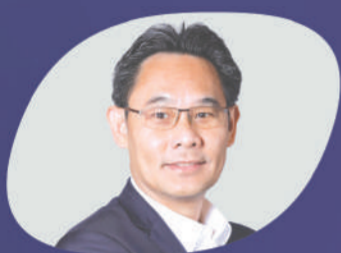
คณูชา พิชญนิทร์ สภาพัฒนาการเศรษฐกิจ และสังคมแห่งชาติ

งานที่จะสร้างโอกาสเติบโตร่วมกับธุรกิจทุกขนาดและสตาร์ทอัพ พบกับผู้นำและนักธุรกิจระดับแนวหน้ากว่า 50 คน ไททิสความสำเร็จโมเดลธุรกิจแห่งอนาคต ซอปปิงสินค้าไทยเด็ด อิ่มอร่อยกับอาหารและเครื่องดื่ม ร่วมสนุกกับนักแสดง ศิลปิน และนักร้องชื่อดังมากมาย