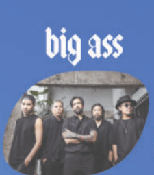
big ass 24 ก.ค.