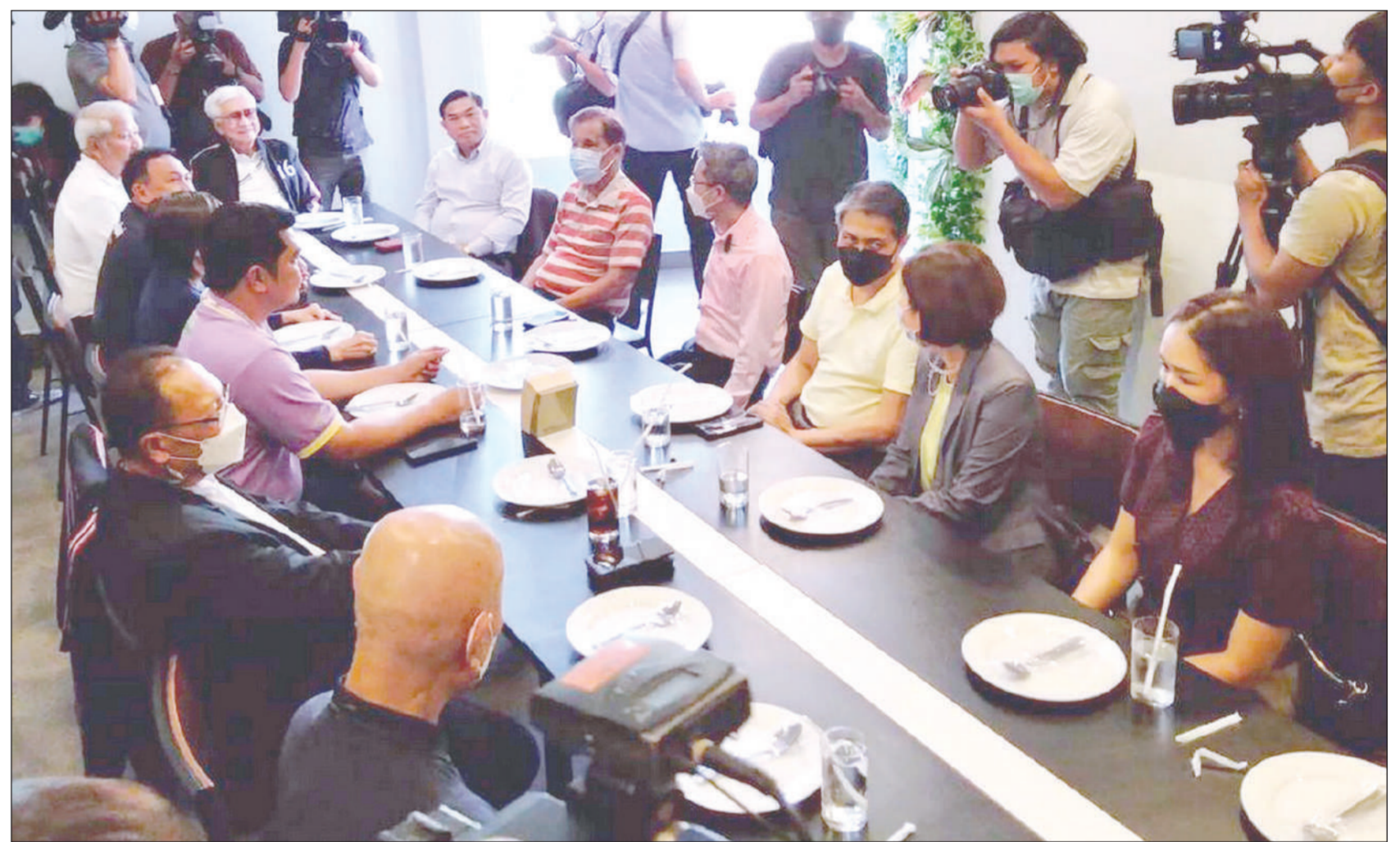
กลุ่ม 16 นั่งรับประทานอาหารเย็นร่วมกันที่ร้านอาหารเพลิน ถ.วิภาวดีฯ เพื่อหารือถึงทิศทางในการลงมติอภิปรายไม่ไว้วางใจ หลังจากเดินทางเข้าพบ พล.อ.ประวิตร วงษ์สุวรรณ รองนายกรัฐมนตรี และหัวหน้าพรรคพลังประชารัฐ (พปชร.) ที่มูลนิธิปรายต่อฯ เมื่อช่วงเย็นวันอาทิตย์ที่ 17 กรกฎาคม 2565