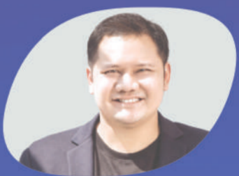
เกรกิง พูนผล 500 TukTuks