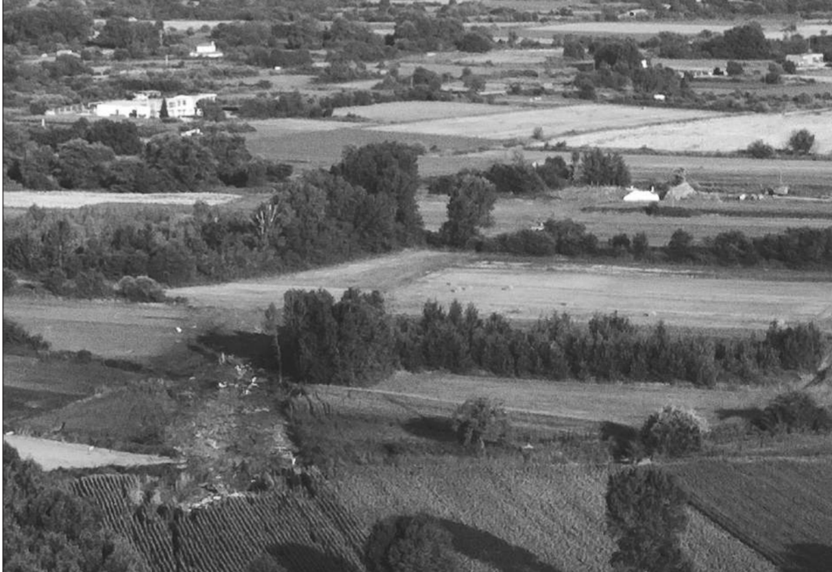
จุดตก ● ภาพถ่ายจุดที่เครื่องบินอินโดเนซ อัน-12 ของยูเครนตก ที่เมืองควาลาของกรีซ โดยถ่ายไว้เมื่อวันที่ 17 กรกฎาคม หลังเครื่องบินลำนี้ตกเมื่อคืนวันเสาร์ และลูกเรือทั้ง 8 คนเสียชีวิต