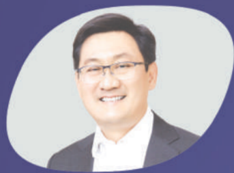
ดร.ภากร ปีตธวัชชัย ตลาดหลักทรัพย์แห่งประเทศไทย