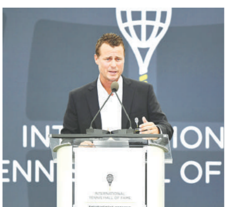
เลย์ตัน ฮิววิตต์ ยอดนักเทนนิสจากออสเตรเลีย กล่าวสุนทรพจน์เนื่องในโอกาสที่เขาได้รับการบรรจุเข้าทำเนียบเกียรติยศเทนนิสนานาชาติ หรืออินเทอร์เน็ตเทนนิส ฮอลล์ ออฟ เฟม ในนิวยอร์ก โรดไอแลนด์ สหรัฐอเมริกา

"ผมรู้สึกว่ามันยอดเยี่ยมที่สามารถเล่นได้เช่นเจนอเวรชั่น" ฮิววิตต์กล่าว "การได้มีโอกาสได้เล่นกับฮีโร่ของผมอย่าง อังเดร อากซิช และพัค แชมพราส และเช่นเดียวกับการมีโอกาสได้เล่นกับตำนานอย่าง ราฟาเอล นาดาล, โรเจอร์ เฟเดอเรอร์ และนวิวก์ ยอโควิช".