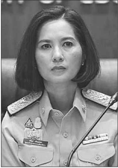
นางสาวตรีษฐ เทียนทอง

นางสาวตรีษฐ เทียนทอง รัฐมนตรีว่าการกระทรวงศึกษาธิการ (รมว.ศธ.) กล่าวถึงการแต่งตั้งผู้บริหารระดับสูงของกระทรวงศึกษาธิการ (ศธ.) เพื่อทดแทนอัคราการเกษียณอายุราชการในเดือนตุลาคม 2565 ว่า ขณะนี้ตำแหน่งผู้บริหารระดับ 11 ของ ศธ. ที่จะเกษียณอายุราชการในเดือนตุลาคมนี้มีนายสุภัทร จำปาทอง ปลัดกระทรวงศึกษาธิการ (ศธ.) 1 ตำแหน่ง ซึ่งตนอยู่ระหว่างการพิจารณาคัดเลือกผู้ที่เหมาะสม โดยจะดูคุณสมบัติอย่างรอบด้าน ไม่ว่าจะเป็นเรื่องของอายุราชการและความสามารถที่จะต้องสานต่องานต่างๆ เชื่อมโยงกับทุกองค์กรหลักใน ศธ. ได้ โดยตนต้องการทำงานและพร้อมขับเคลื่อนนโยบายการศึกษาที่สำคัญไปพร้อมกับตน ทั้งนี้ตนขอยืนยันไม่มีใครในใจอย่างแน่นอน อย่างไรก็ตามตนคิดว่า การเสนอรายชื่อผู้บริหารระดับสูงของ ศธ. ให้ที่ประชุมคณะรัฐมนตรี (ครม.) พิจารณาไม่ล่าช้า แม้กระทรวงอื่นๆ ที่มีผู้บริหารระดับสูงเกษียณอายุราชการในเดือนตุลาคมนี้เช่นกัน ได้ดำเนินการเสนอรายชื่อให้ที่ประชุม ครม.พิจารณาไปแล้ว ซึ่งตนมองว่ายังพอมองเวลาในการตัดสินใจ และคาดว่า จะสรุปรายชื่อผู้บริหารระดับ 11 ทดแทนอัคราการเกษียณอายุราชการได้ภายใน 1-2 เดือนนี้แน่นอน