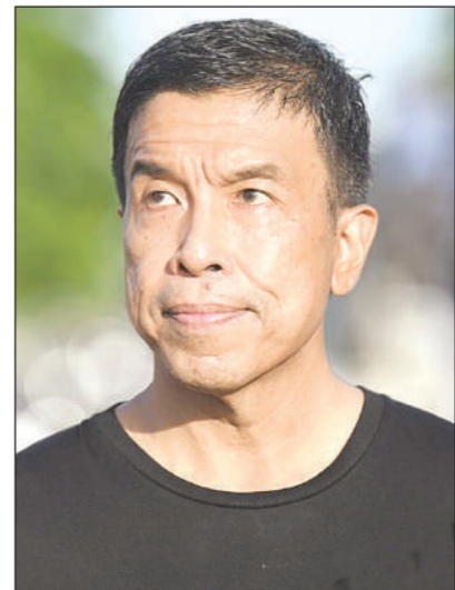
ซัชชาติ ลิทธิพันธ์ุ

ท่าเนียบฯ • ไทยพบผู้ติดเชื้อใหม่อีก 2,028 ราย เสียชีวิตอีก 18 คน “บิกตู่” เนะ ประชาชนตรวจ ATK ก่อนเข้าทำงานหลัง หยุดยาว “สธ.” เชิญ “ซัชชาติ” หารือตัว รับมือโควิด-19 ระลอก 6 ซึ่ กทม.เป็นจุด เสี่ยงหวังให้ลดกิจกรรมรวมตัว เมื่อวันที่ 17 ก.ค. ศูนย์บริหารสถาน การณ์การแพร่ระบาดของโรคติดเชื้อไวรัส โควิด-19 (โควิด-19) หรือ ศบค. รายงานสถานการณ์การแพร่ระบาดของโควิด-19 ในไทยว่า พบผู้ติดเชื้อรายใหม่ 2,028 ราย เป็นการติดเชื้อในประเทศ 2,025 ราย มาจากระบบเฝ้าระวังและระบบบริการ 2,025 ราย มาจากต่างประเทศ 3 ราย หายป่วยเพิ่มขึ้น 2,578 ราย อยู่ระหว่าง รักษา 23,299 ราย อาการหนัก 785 ราย