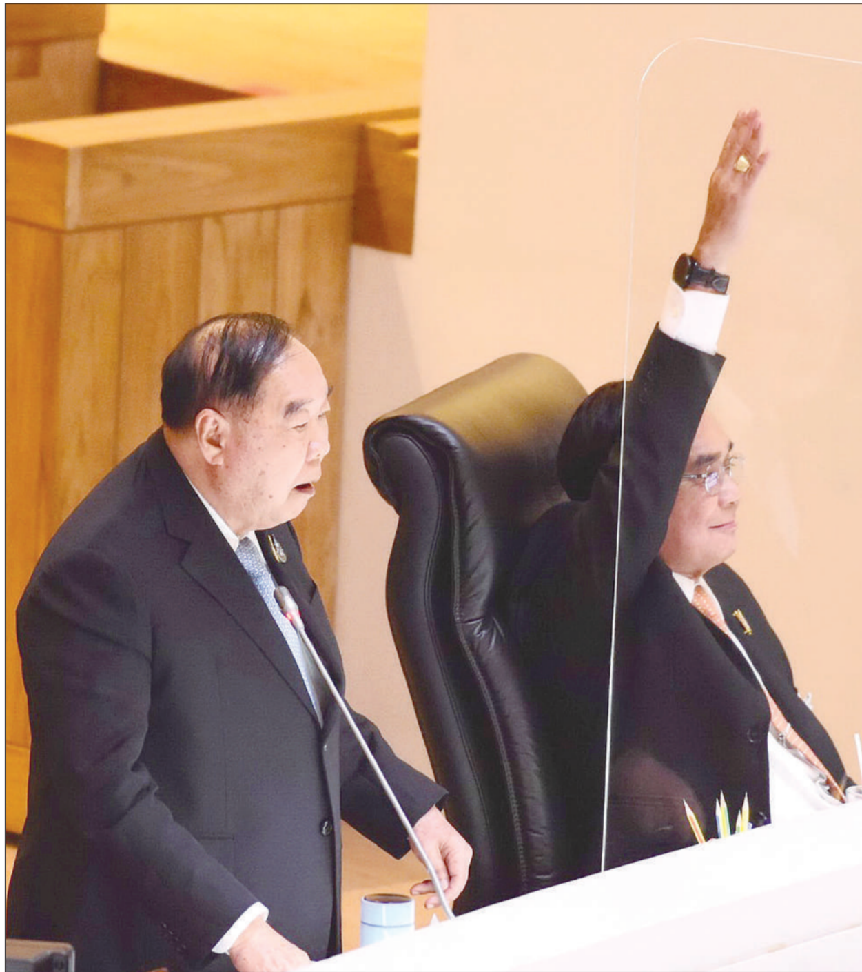
พล.อ.ประวิตร วงษ์สุวรรณ รองนายกรัฐมนตรี ลูกขึ้นขึ้นแจ้งต่อที่ประชุมสภาระหว่างถูกอภิปรายไม่ไว้วางใจว่าไม่เกี่ยวข้องกับเรื่องปฏิวัติ ก่อนชี้มือไปที่ พล.อ.ประยุทธ์ จันทร์โอชา นายกรัฐมนตรีและ รมว.กลาโหม ซึ่งนั่งอยู่ข้างๆ พร้อมระบุนายกฯ ปฏิวัติคนเดียว โดย พล.อ.ประยุทธ์ยิ้มรับและยกมือสนับสนุนคำพูด พล.อ.ประวิตร

รมว.DESชดttä! ชูฟองหมื่น ป้อมปิดปฏิวัติตุ่ทำคนเดี่ยว